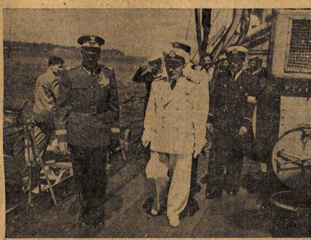
Dzień 29 czerwca obchodzony był w kraju jako Święto Marynarki Wojennej, która wiernie strzeże o-czystych portów i wybrze-ża przed wrogami. Głównie uroczystości w ramach święta, w których wziął udział Minister Obrony Narodowej, Marszałek Pol-ski Konstanty Rokossowski, odbyły się w Gdyni.