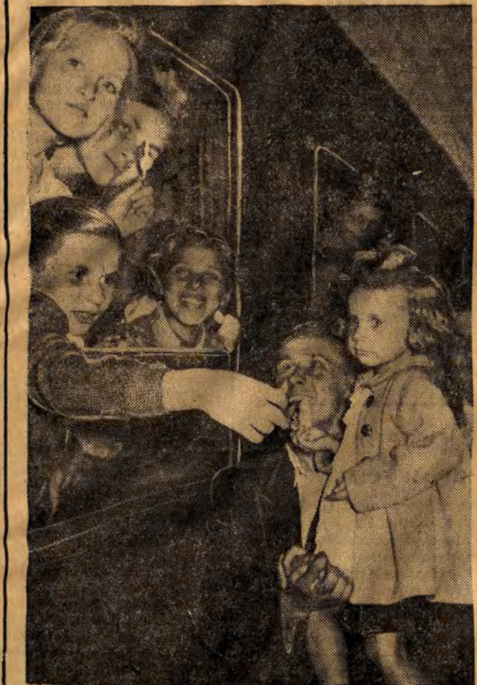
Specjalnymi pocławami wyjeżdżają na obozy i kolonie letnie tysiące dzieci i młodzieży. Młodzi uczą się wypożyczają będą w dobrze wyposażonych placówkach kolonijnych, położonych w najpiękniejszych okolicach Polski.