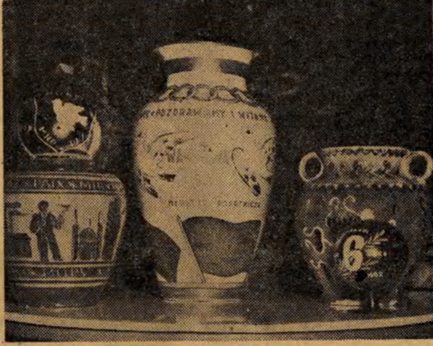
W całym kraju młodzież przygotowuje liczne podarki dla delegacji zagranicznych i zaoproszonych gości, którzy będą uczestniczyć w uroczystościach złotych.

W tym kioskach mieszkańców miasteczka zapatrzą się we wszystko, co może być im potrzebne w ciągu kilkudniowego pobytu. Jeśli komuś coś się zedrze, zniszczy — naprawimy mu to w lot punkt krawiecki lub szewski. O elegancję mieszkańców będzie dbał fryzjer. Spragnionych napoją kiosk MHD. Dom Książki dostarczy strawy duchowej, nie tylko w kioskach, lecz i na kiermaszu, który rozłoży się obok wzdłuż Al. Żwirki i Wigury i ul. Trójdena. Nie zapomniano o pamiętkach, wznaczących im miejsca na stoiskach Centrali Przemysłu Ludowego i Artystycznego