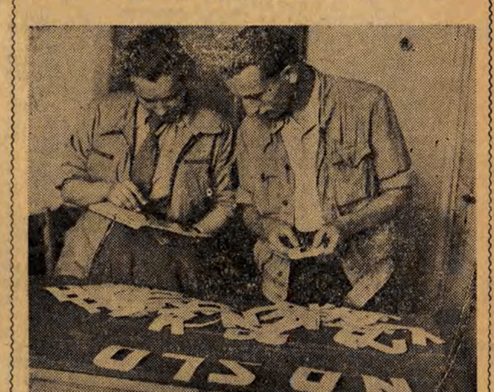
Jeszcze tylko 3 dni dzielą nas od Złotu. ZMP-owcy z Kombnatu Bawelnianego w Piotrkowie starannie przygotowują transporty, którymi w dniach Złotu przybiorą do zakład pracy.