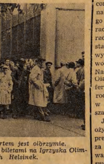
Zainteresowanie Finów sportem jest ogromne. NA ZDJĘCIU: jedna z kolejek za biletem na Igrzyska Olimpijskie na ulicach Helsinek.

sekiem poziomem gry naszej drużyny, która niewątpliwie, goyby nie grała w 10, miałaby szansę na uzyskanie znacznie lepszego wyniku, a może nawet i zwycięstwa. S. DONECKI