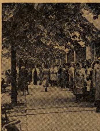
Zainteresowanie Finów sportem jest ogromne. NA ZDJĘCIU: jedna z kolejek za biletem na Igrzyska Olimpijskie na ulicach Helsinek.