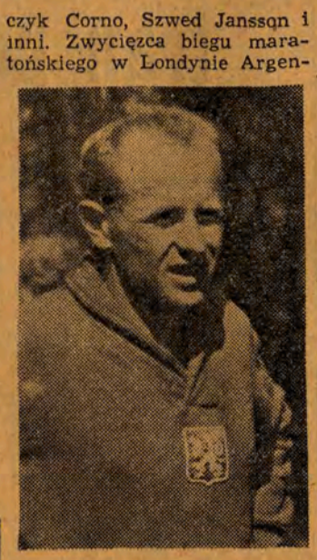
E. ZATOPEK (CSR)