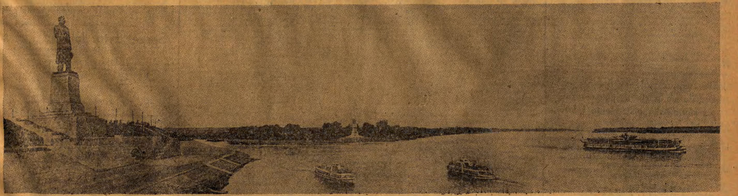
Widok ogólny wejścia do kanału od strony Wołgi.