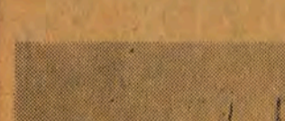
Reprezentacja Polski w hokeju na trawie rozegrała w ramach turnieju olimpijskiego trzy mecze...