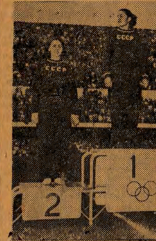
Finał rzutu dyskiem kobiet zakończył się potrójnym zwycięstwem zawodniczek radzieckich...