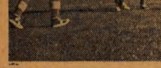
W dniu wczorajszym rozpoczęły się w kortach 'Wiołkarza' VIII mistrzostwa Polski w tenisie mężczyzn i kobiet.