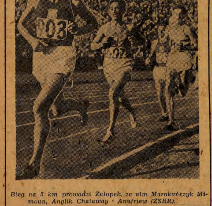
Bieg na 5 km prowadzi Zatopek, za nim Marokańczyk Mimoun, Anglik Chataway i Anufriew (ZSRR).