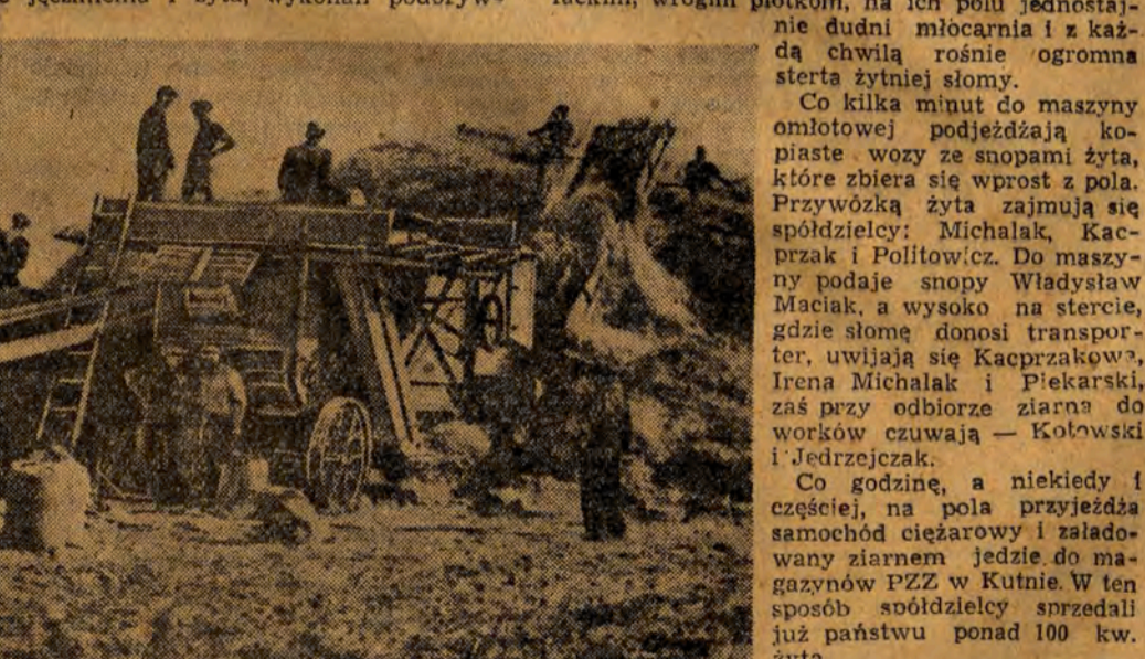
Pierwsza młocna w spółdzielni produkcyjnej w Bedlinie.

zemy przeznaczyć na inne roboty, np. na podorywki na pielęgnację sadu, na hodowlę itp. W ubiegłym roku spółdzielcy wcześniej, zaraz po żniwach, wykonali podorywki i dlatego niewiele szkody zrobiła im susza. Dlatego też w tym roku zebrał się u nich ładniejsze niż gdzie indziej. Teraz więc dzięki pracy kombajnu, który znacznie dopomógł im w pracy, zaraz po sprężeniu jęczmienia i żyta, wykonali podoryw-