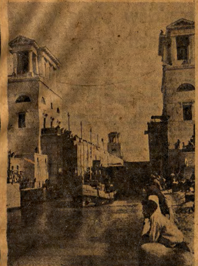
10-ła słuza Kanatu Wołga - Don.