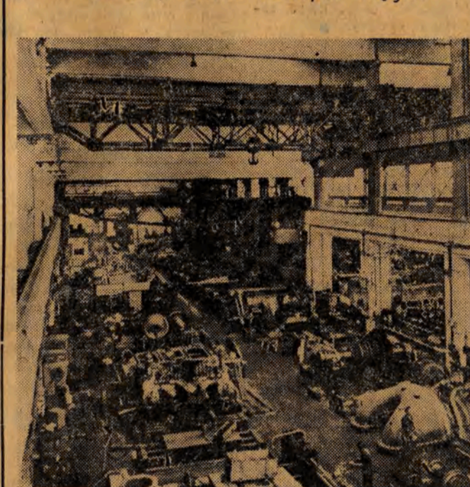
W Węgierskiej Republice Ludowej od chwili objęcia władzy przez lud pracujący nastąpił ogromny rozkwit przemysłu. NA ZDJĘCIU: montaż urządzeń w fabryce maszyn Lang w Budapeszcie.