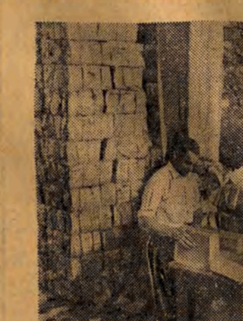
Księgarnie łódzkie zaopatrzone zostały już w pełny asortyment podręczników szkolnych. NA ZDJĘCIU: segregowanie podręczników w magazynie Domu Książki.

uruchomiony specjalny kiosk z materiałami szkolnymi. W trosce o terminowe i należyte zaopatrzenie młodzieży w podręczniki szkolne uruchomiona zostanie dodatkowo sprzedaż materiałów szkol-