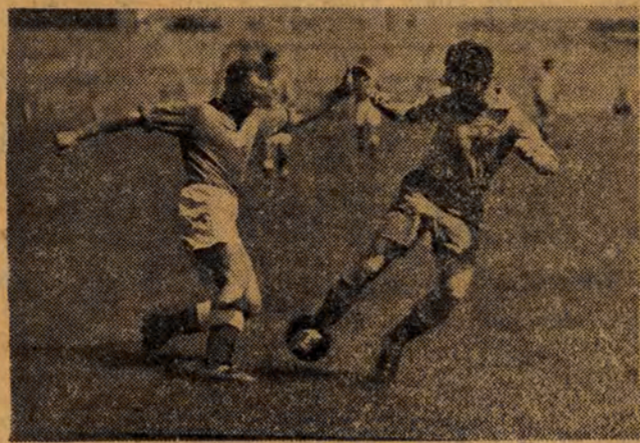
W dniu 15 sierpnia br. rozpoczęły się w Warszawie rozgrywki eliminacyjne Letniej Spartakiady Wojska Polskiego. NA ZDJĘCIU: fragment meczu piłkarskiego Bydgoszcz — Lotnictwo, zakończonego zwycięstwem Bydgoszczy w stosunku 3:0.