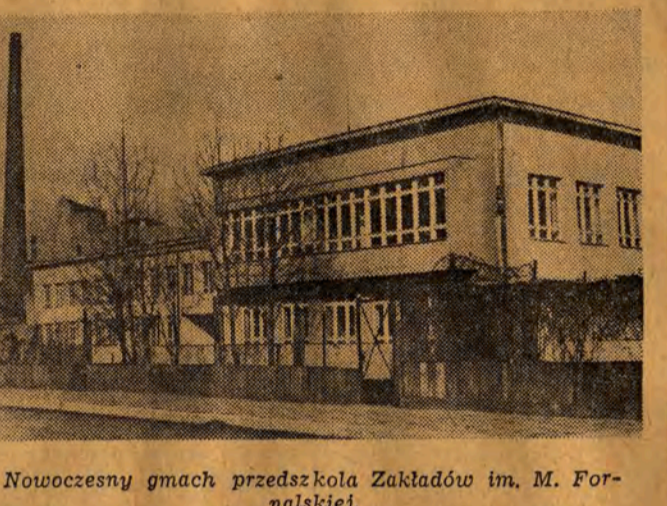
Nowoczesny gmach przedszkola Zakładów im. M. Fornalskiej.

Zajęcia w przedszkolach dostosowane są do godzin pracy rodziców. Np. przedszkole przy Zakładach Przemysłu Włókiennego im. Władysława Reymonta czynne jest od godziny 5 rano do godziny 10 wieczór. Już