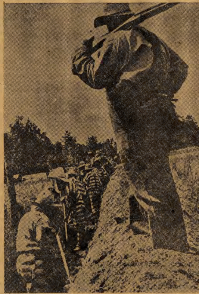
Terror rasistowski w USA przybiera na sile. NA ZDJĘCIU: od świtu do nocy pod nadzorem uzbrojonego białego zbira w pocie czoła pracują czarni więźniowie obozu w Hood's Chapel Georgia.