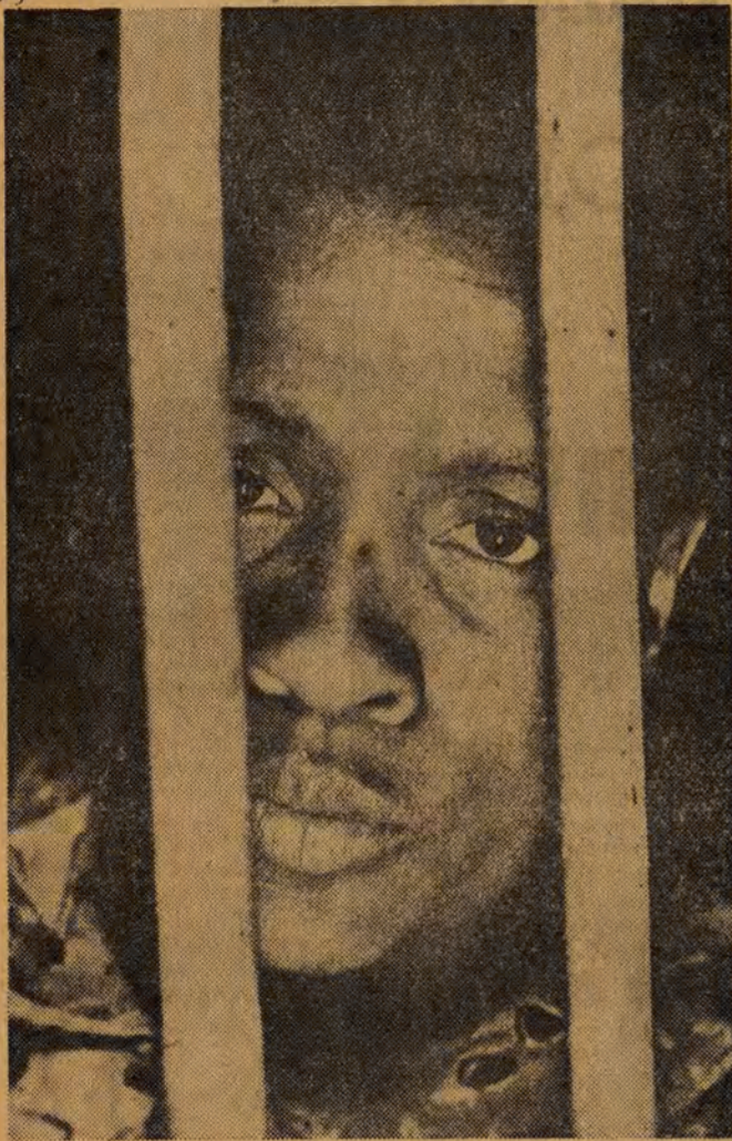
Piętnastomilionowa ludność murzyńska w USA jest przedmiotem brutalnej dyskryminacji rasowej. W Stanach Południowych więzi się np. Murzynów za samą chęć udziału w wyborach.

którzy krytykują Nixona nie rozumieją życia".