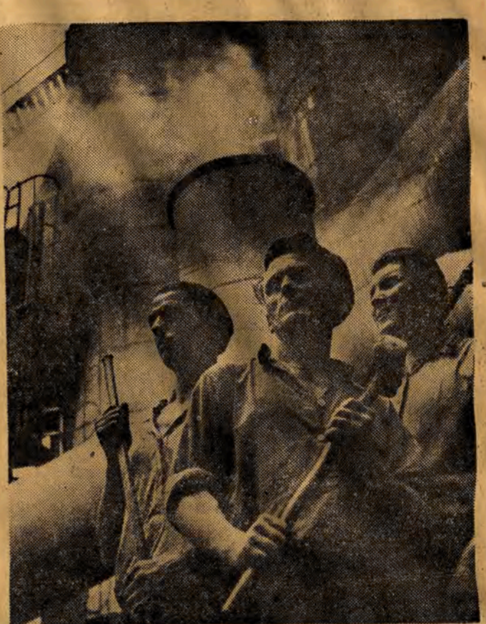
Zjednoczony we Frontie Narodowym naród polski buduje swoją szczęśliwą przyszłość. Jak Polska długa i szeroka wnosimy uspaniałotnienie budowlę Planu 6-letniego. NA ZDJĘCIU: przodownicy pracy w hucie im. Prezydenta Bieruta.

ŁÓDŹ. Pracownicy ZPB im. Dzierżyńskiego w Łodzi podjęli się dla uczczenia wyborów do Sejmu Polskiej Rzeczypospolitej Ludowej oraz XIX Zjazdu WKP(b) wykonać ponad plan 520 tys. metrów bież. tkanin.