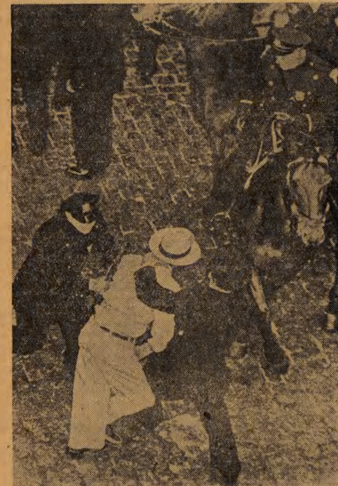
W USA swobody obywatelskie są ograniczone. Robotnicy amerykańscy, którzy nie zaprzestają walki o swe słuszne prawa, spotykają się z krasnymi represjami i zbrojnymi najeźdźcami policji i wojska. NA ZDJĘCIU: rozpadanie strajkujących przez policję w USA.