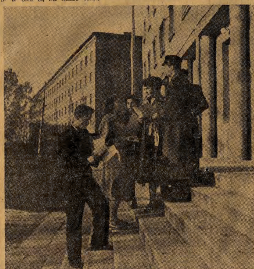
Państwo Ludowe nie szczędzi funduszy, by zapewnić studiującej młodzieży jak najlepsze warunki mieszkaniowe. NA ZDJĘCIU: studenci przed jednym z domów akademickich w Łodzi.