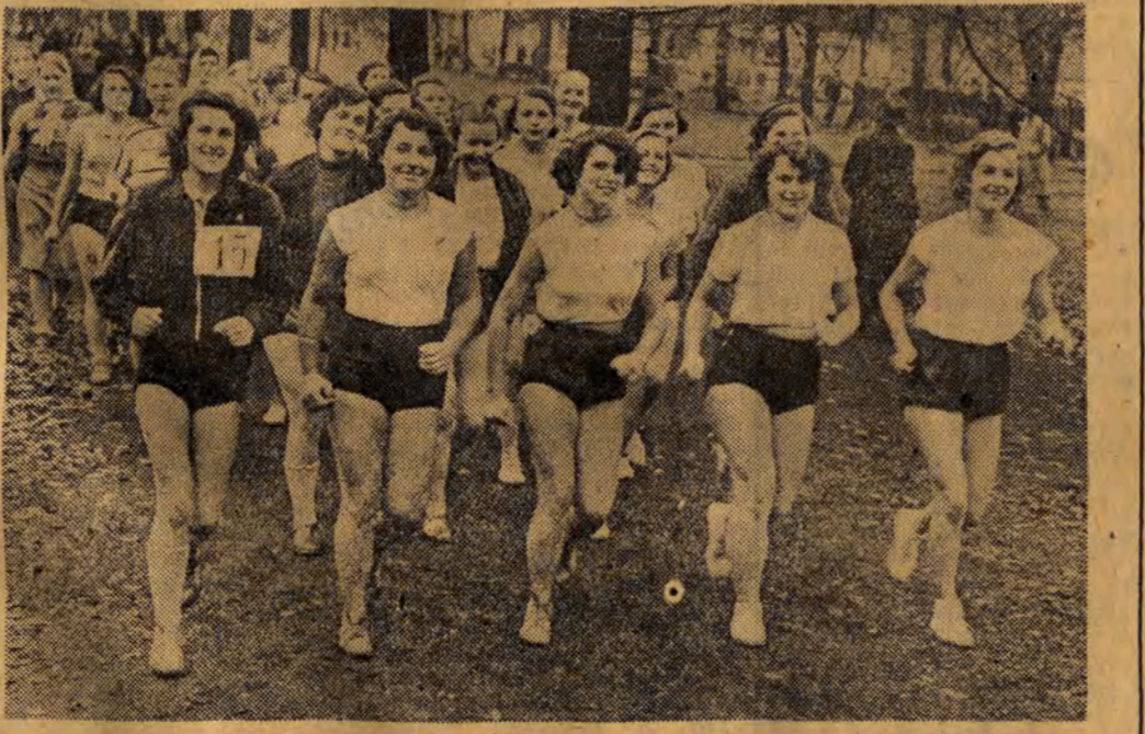
W dniu wczorajszym w całym kraju odbyły się Marsze Jesienne, w których wzięło udział setki tysięcy młodzieży obojga płci. NA ZDJĘCIU: jedna z łódzkich żeńskich szkół ogólnokształcących w czasie marszu w Parku Poniatońskiego. Reportaż z Marszów, w których brało udział w Łodzi przeszło 24 tysiące osób, zamieszczamy na str. 7.