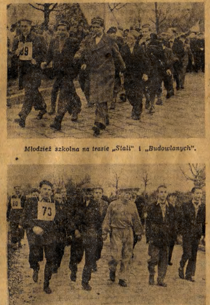
Młodzież szkolna na trasie „Stali” i „Budowlanych”.