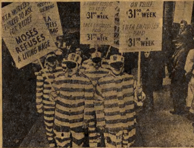
W Nowym Jorku demonstrowała niedawno grupa pracowników kolei podziemnej, żądając podwyższenia płac. Ubranie więziennicze, stanowiące ubiór grupy demonstrantów, ma symbolizować niewolniczą pracę w tym „wolnym kraju”.