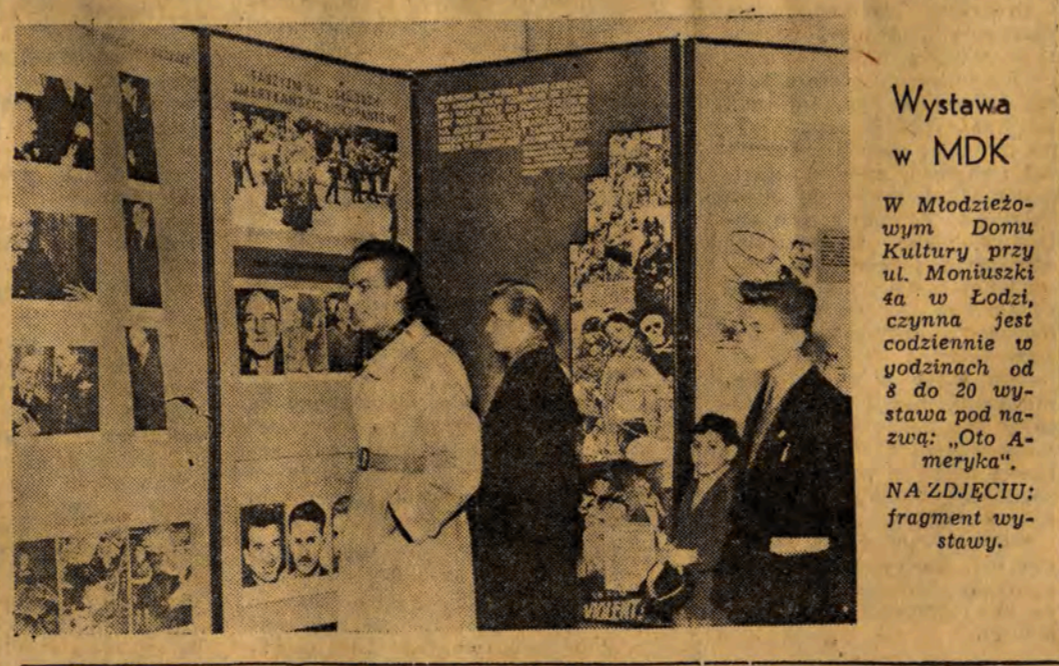
Wystawa w MDK