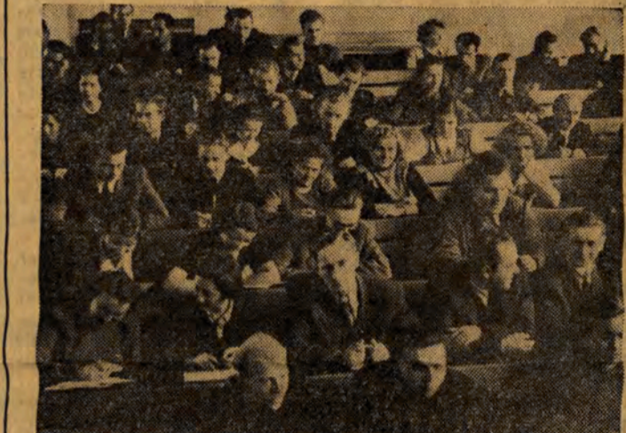
Wykład w auli W.S.E.