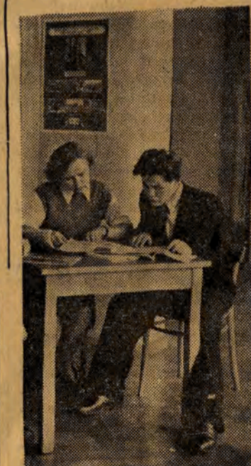
W świetlicy VII Domu Akademickiego.

powstanie w ciągu lat najbliższych olbrzymia Biblioteka Uniwersytecka