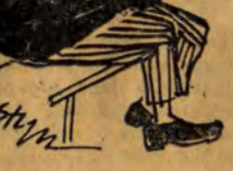
obrony łodzian i z najbliższej odległości oddać strzał.