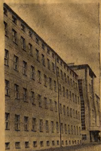
Nowy gmach Politechniki Łódzkiej.

jest Politechnika Łódzka, która kształci techników i inżynierów