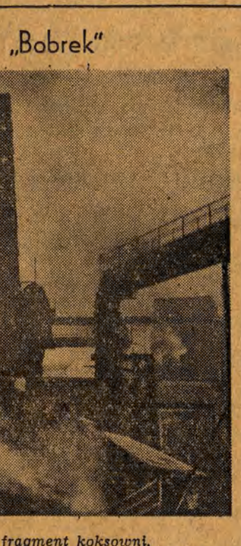
W Hucie „Bobrek” NA ZDJĘCIU: fragment kokosowni.

Na 68 dni przed, terminem wykonała przypadające na nią zadania trzeciego roku Planu 6-letniego załoga PRZEDSIĘBIORSTWA SPRZĘTU TRANSPORTOWEGO I ZAPATRYZACJI BUDOWLANE-GO.