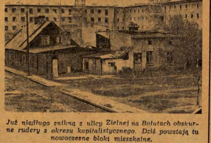
Już niedługo znikną z ulicy Zielnej na Białutach obskurne rudery z okresu kapitalistycznego. Dziś powstają tu nowoczesne bloki mieszkalne.