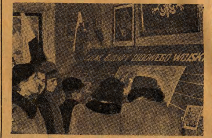
W poczekalni kina „Bałtyk” znajduje się interesująca wystawa, obrazująca szlak bojowy Ludowego Wojska Polskiego...