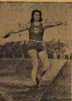
1.598 rekordów Związku Radzieckiego ustanowili w ciągu dziesięciu miesięcy 1952 roku sportowcy ZSRR. Z tych nowych rekordów — 115 to nowe rekordy Europy, a 51, to najlepsze wyniki na świecie. Jeden z tych 51 rekordów — w rzucie dyskiem — uzyskała niedawno świetna niestrzyna radzieckiego sportu, czołowa zawodniczka ZSRR. Jak brzmi jej nazwisko?