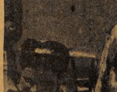
Scena z filmu dokumentalnego „Radziecka Moldawia”

Radziecki film dokumentalny powstał w ogniu walk Wielkiej Październikowej Rewolucji Socjalistycznej. Już w pierwszym okresie istnienia państwa radzieckiego filmowym narzędziem walczącej klasy robotniczej stała się walka z burżuazją i jej ideologią.