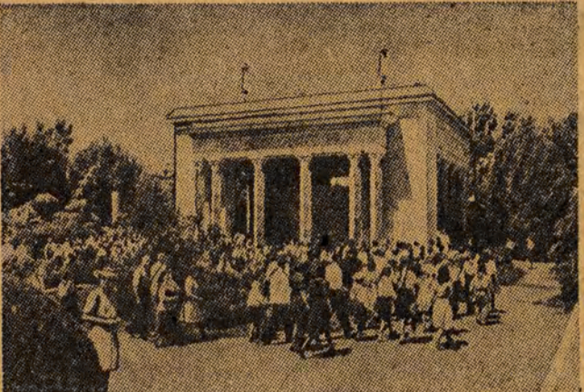
Niewielki domek-muzeum w gruzińskim mieście przyciąga tłumy odwiedzających z Kraju Rad i zagranicznych gości. Tutaj, dnia 21 grudnia 1879 roku urodził się Wielki Wódz Rewolucji Październikowej, najbliższy współpołojownik Lenina, Choraży Pokoju, Nauczyciel i Przywódca mas pracujących całego świata. Jak się nazywa to miasto?