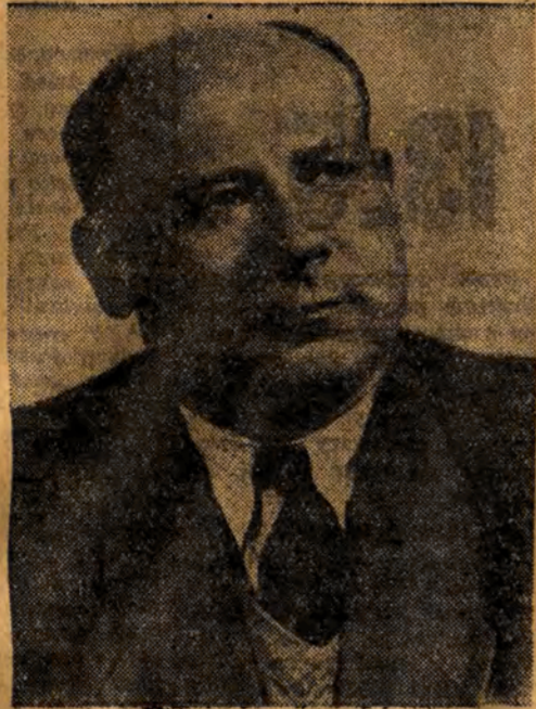
WŁADYSŁAW DWORAKOWSKI wiceprezes Rady Ministrów