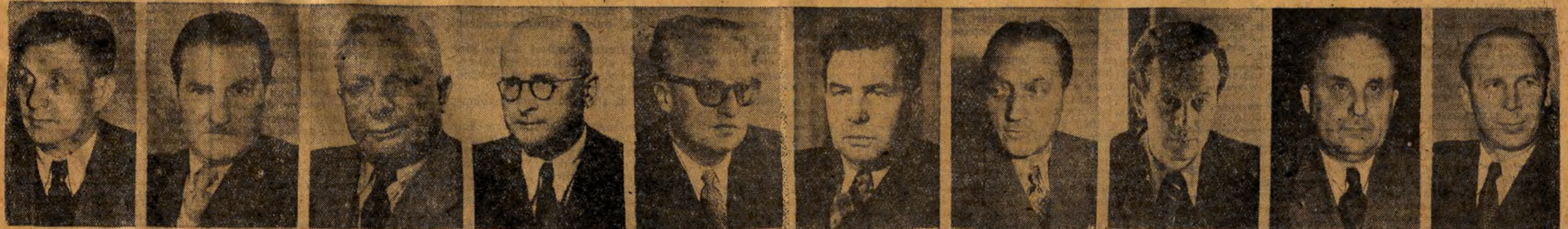
JULIAN TOKARSKI minister Przemysłu Maszynowego MIECZYSLAW HOFFMANN minister Przemysłu Rolnego i Spożywczego JAN DĄB-KOCIOL minister Rolnictwa HENRYK ŚWIĄTKOWSKI minister Sprawiedliwości STANISŁAW SKRZESZEWSKI minister Spraw Zagranicznych ADAM RAPACKI minister Szkolnictwa Wyższego JAN RUSTECKI minister Transportu Drogowego i Lotniczego JERZY SZTACHELSKI minister Zdrowia MIECZYSLAW POPIEL minister Żeglugi KAZIMIERZ MIJAŁ minister — szef Urzędu Rady Ministrów