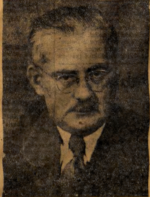
HILARY MINC wiceprezes Rady Ministrów i Przewodniczący Państwowej Komisji Planowania Gospodarczego