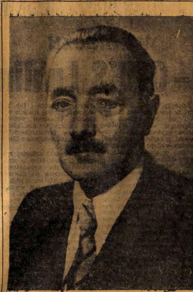
Prezes Rady Ministrów BOLESŁAW BIERUT