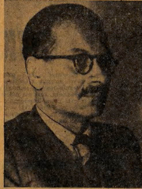
TADEUSZ GEDE wiceprezes Rady Ministrów