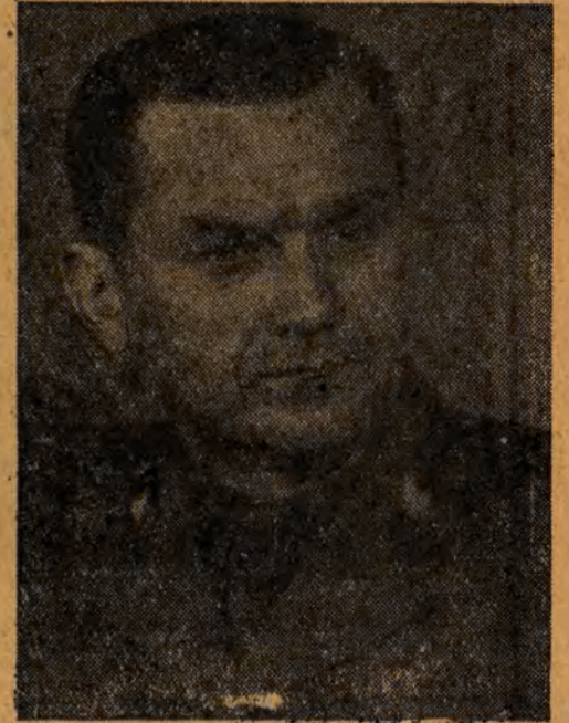
PIOTR JAROSZEWICZ wiceprezes Rady Ministrów