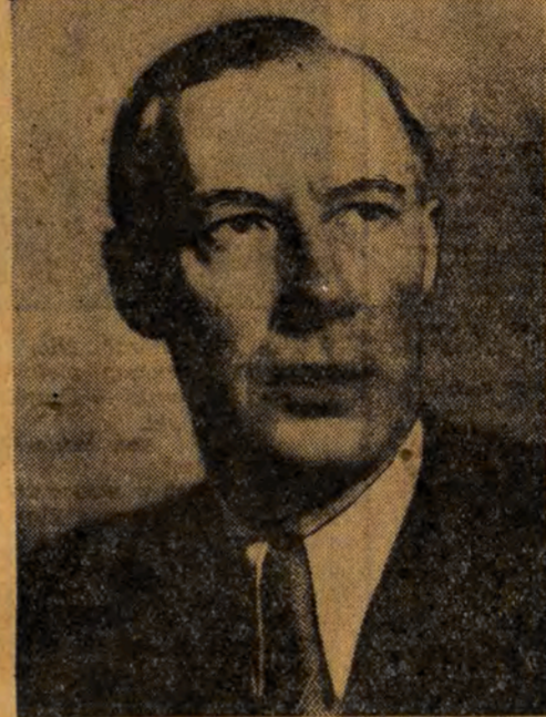
ZENON NOWAK wiceprezes Rady Ministrów