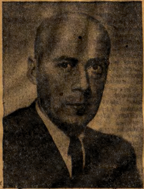
JÓZEF CYRANKIEWICZ wiceprezes Rady Ministrów