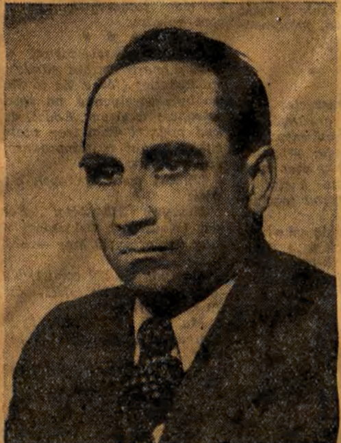
STEFAN JEDRYCHOWSKI wiceprezes Rady Ministrów