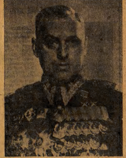
KONSTANTY ROKOSSOWSKI wiceprezes Rady Ministrów i minister Obrony Narodowej, Marszałek Polski