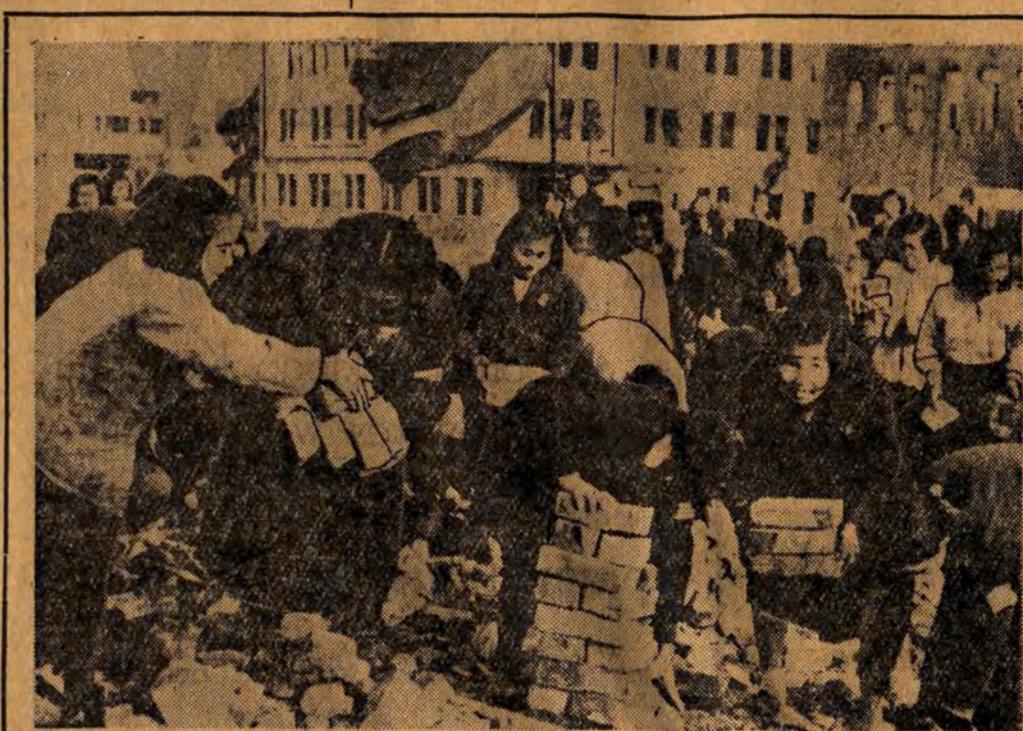
Po barbarzyńskim nalocie na Phenian