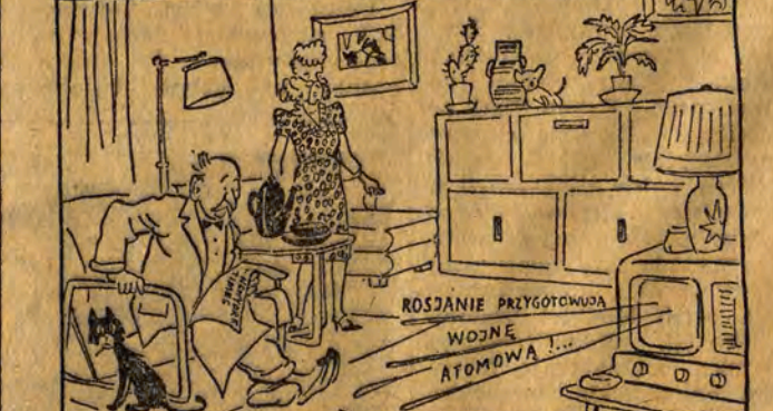
Nie, to głównodowodzący wojsk Stanów Zjednoczonych...