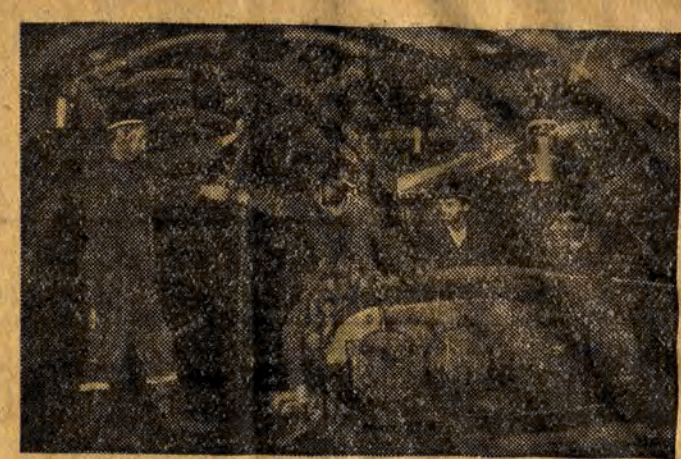
Uczniowie Technikum Górniczego Nr 2 w Zabrze odbywają przeszkolenie praktyczne w jednej z najbardziej zmechanizowanych kopalni - w kopalni Zabrze-Wschód. NA ZDJĘCIU: uczniowie Technikum Górniczego Nr 2 w Zabrzu przenoszą przenośnik pancerny w przodku kopalni.

„Górnictwo polskie znajduje się dziś na najbardziej odpowiedzialnym odcinku frontu w walce o podniesienie przemysłu węglowego, w walce o Plan 6-letni - plan uprzemysłowania Polski, plan zlikwidowania zaołania gospodarczego, plan stworzenia lepszych warunków życia i rozwoju kulturalnego dla całego polskiego ludu pracującego, plan utwardzenia pokoju i bezpieczeństwa Polski, plan pokrzyżowania machinacji