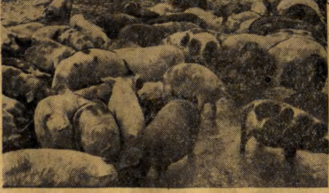
Ponad 300 sztuk trzody chlewnej utuczono już odpadkami pokonsumpcyjnymi w tuczarni PSS przy ul. Bema.

Wystarczy przejść się po kilku posesjach, zajrzeć do puszek od śmieci, aby przekonać się, ile marnuje się w naszym mieście cennych odpadków, ile pokarmu, który z powodzeniem mógłby być użyty do tuczenia trzody chlewnej, wyrzuca się po prostu na śmietnik.