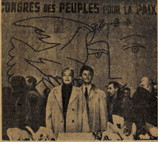
W Ogólnokrajowym Kongresie Pokoju we Francji wzięła między innymi udział delegacja postępowych artystów filmowych i teatralnych. NA ZDJĘCIU, znani aktorzy filmowi: Simone Signoret i Gerard Philippe w czasie przerwy w obradach.

Załoga farbiarni ZPW IM. BARLICKIEGO zrealizowała w dniu 6 grudnia br. swój plan roczny - pisze Iow. Zawadzka. Robotnicy farbiarni dumni są z tego sukcesu i wyrażają inne oddziały, aby również przed terminem wykonały swe plany. Na 24 dni przed terminem wykonały zadania planu rocznego załogi ŁÓDZKICH ZAKŁADÓW PIEKARNICZYCH. Na 5 dni przed terminem ustalonym w zobowiązaniach, w dniu 10 grudnia wykonał roczny plan operacyjny w 100,2 proc. pracownicy PSS ŁÓDŹ - WSCHOW.