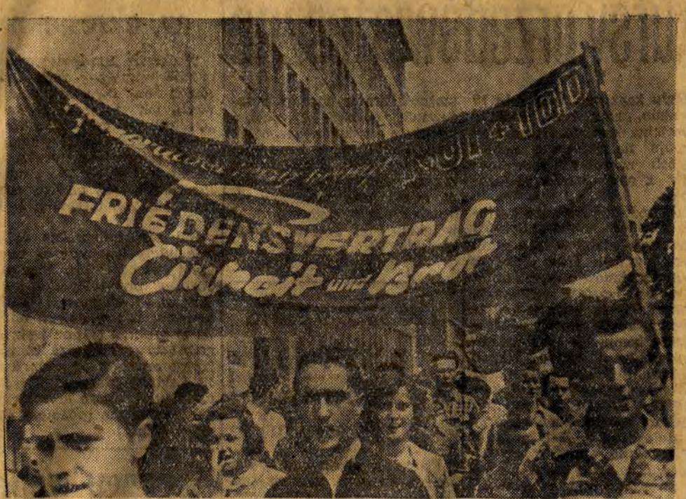
NA ZDJĘCIU: demonstracja młodzieży w okolicy Dworca Zachodniego w Kolonii przeciwko wojennemu układowi ogólnemu. Napis na transparentie głosi: „Układ ogólny oznacza nędzę i śmierć, traktat pokojowy — jedność i chleb”.