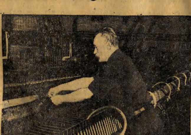
Pracownik Zielński współzawodniczy w wykonaniu planów dziennych z czołowymi przedownikami pracy.

A nawet... może jeszcze o dzień lub dwa wcześniej.