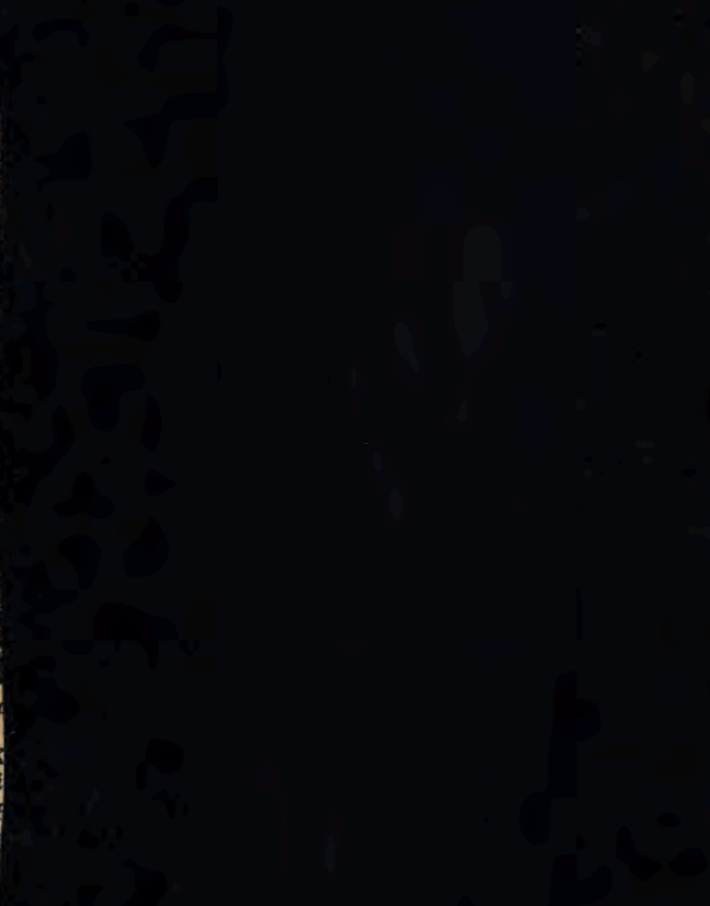
Rozprawa o materiałach Pałacu Kultury i Sztuki. NA ZDJĘCIU, widać dziewczynę.

„Gdzieś ma 31 dni. Dla załogi tkalni Zakładów im. Marchlewskiego będzie miał tylko 22. A potem, zaczęła już pracować na poczet czwartego roku Sześciolatki.