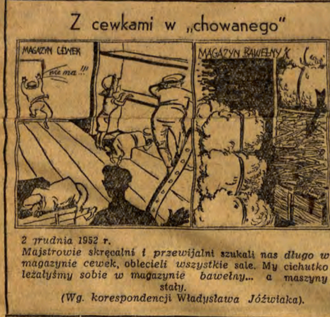
Z cewkami w „chowanego”