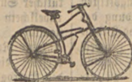
Verein Lodzzer Cyclisten.

Hiermit ersuchen wir die Mitglieder und eingeladenen Gäste zum heutigen Maskenballe pünktlich um 9 Uhr zu erscheinen.