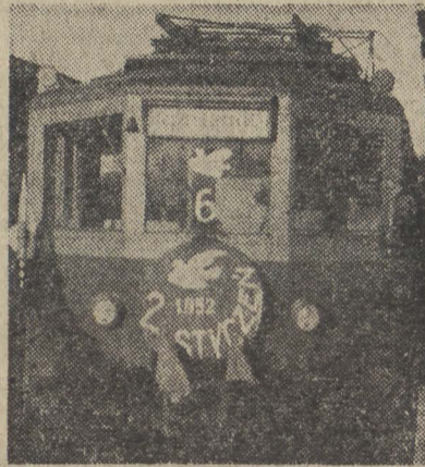
Trzeci rok Planu 6-letniego kolejarze gdańscy powitali oddaniem do użytku na cztery miesiące przed terminem kolei elektrycznej na trasie Gdańsk — Sopot. Nowa linia elektryczna została otwarta w dniu 2 stycznia 1952 roku. Na zdjęciu: Pierwszy pociąg elektryczny wyrusza z Gdańska do Sopot.

Wzdłuż trasy kanału buduje się szereg portów pasażerskich oraz przystani.