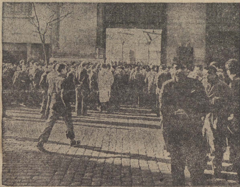
W walce przeciw odbudowie Wehrmachtu, przeciw knowaniom podżegaczy wojennych biorą udział wraz z nami miliony rzesze pracujących w krajach kapitalistycznych.

Przyrzekamy ci, Obywatelu Prezydencie, wykorzystując osiągnięcia metodologiczne konferencji, rozwijać polską naukę historyczną, krytycznie i samokrytycznie ustosunkować się do naszej pracy, aby dać narodowi polskiemu jak najpełniejszy obraz wielkiej przeszłości, bohaterskich walk polskich mas ludowych i wkładu polskiego w dzieje ludzkości, aby ujawnić przed narodem wszystkie te ciemne siły, które w służbie rodzimych i obcych wyzyskiwaczy ciągnęły wstecz nasz naród, aby przyczynić się do tym mocniejszego zespolenia ideowego wszystkich uczciwych Polaków przeciwko anglo-amerykańskiemu imperializmowi i ich polskimi najmitom, zespolenia naszego społeczeństwa w narodowym froncie walki o pokój i realizację Planu 6-letniego.