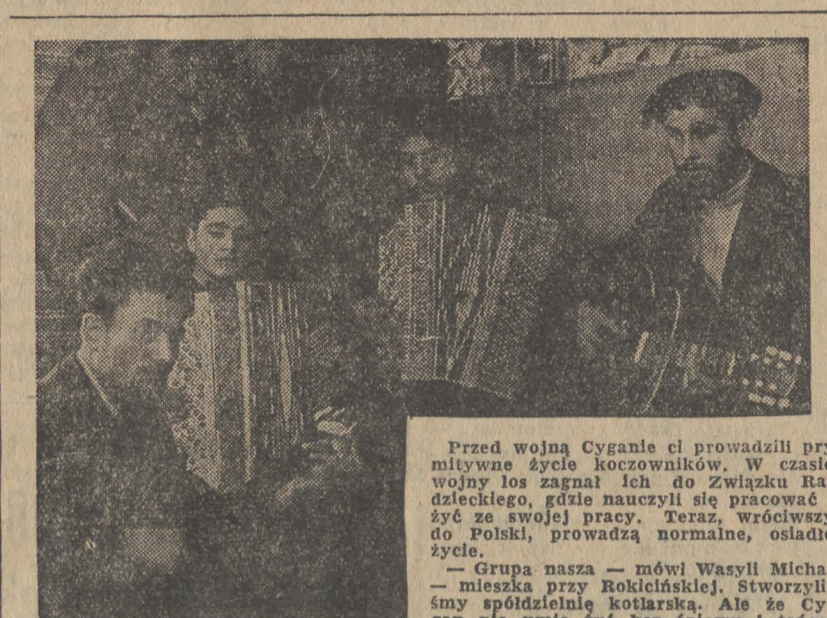
Przed wojną Cyganie ci prowadzili przytulne życie koczownicze. W czasie wojny los zagnał ich do Związku Radzieckiego, gdzie nauczyli się pracować i żyć ze swojej pracy. Teraz, wróciwszy do Polski, prowadzą normalne, osiadłe życie.

W związku z tym wydany został w dniu 10 stycznia br. okólnik prezesa Rady Ministrów w sprawie prawidłowego rozdziału urlopów według ustalonego rozdzielnika na każdy miesiąc.