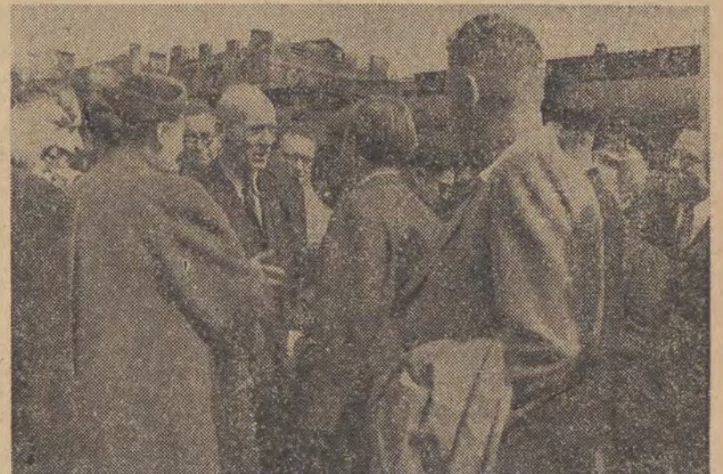
Na zdjęciu: powitanie delegacji francuskiej i belgijskiej obrońców pokoju na Dworcu Kaliskim.