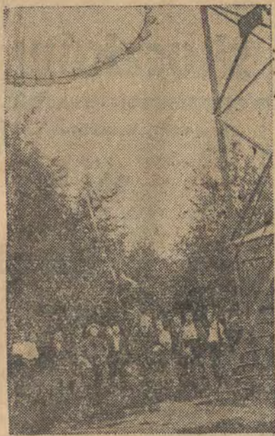
Jedną z wielu atrakcyjnych imprez organizowanych w ramach Tygodnia Lotnictwa są pokazy skoków spadochronowych ze specjalnej wieży. Na zdjęciu: moment lądowania.