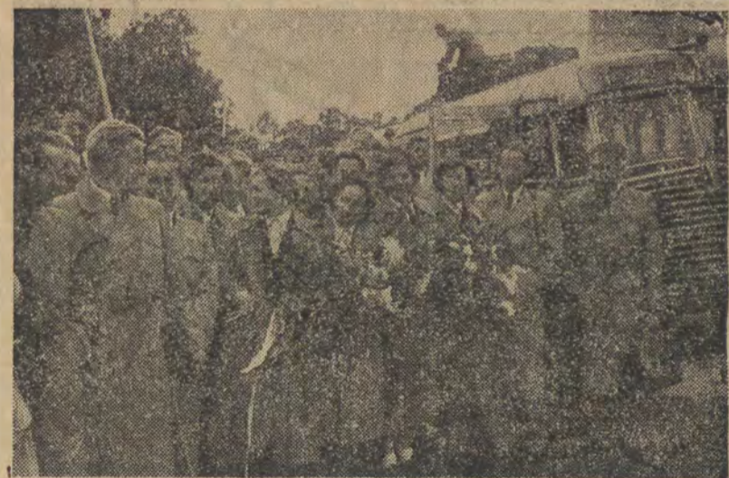
W dniu 4 września przybyli do Warszawy lekkoatleci NRD, którzy w dniach 5-7 września rozegrają w Warszawie międzynarodowe spotkanie z lekkoatletami polskimi. Na zdjęciu: lekkoatleci NRD na terenie AWF w Warszawie, gdzie zostali zakwaterowani.

Narady odbędą się w sali konferencyjnej WKKF przy ul. Curie-Skłodowskiej 28.