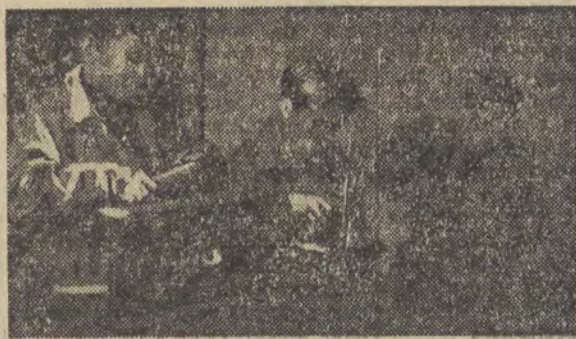
W pracowni ślusarskiej

Okazuje się, że młodzi harcerze zradiofonizowali sami całe przedszkole i, jak nas informują, nie jest to zbyt trudną sztuką — przynajmniej dla nich. Instruktor bowiem wtajemniczył ich w zawile arkana pracy radiotechnika.