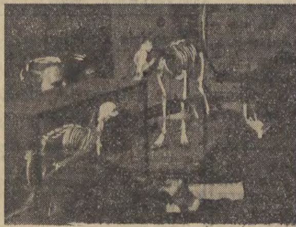
Biolog przy pracy

...PMT, wyrażając podziękowanie za ujawnienie galganka w papierosie, wyjaśnia, że skrawek ten pozostał w maszynie po jej wyczyszczeniu i nie zauważony przez obsługę maszyny — znalazł się wraz z mieszkanką tytoniową w zakwestionowanym przez naszego Czytelnika papierosie „Sport“. Wytwórnia wezwała załogę maszyny do zaostrzenia uwagi podczas produkcji.