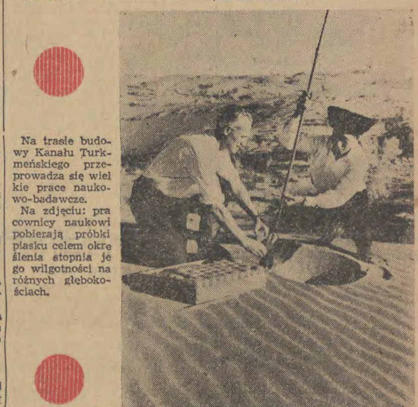
Na trasie budowy Kanału Turkmeneńskiego przeprowadza się wielkie prace naukowo-badawcze.

Niech żyje wieczysta i braterska przyjaźń między narodem polskim a narodami ZSRR!