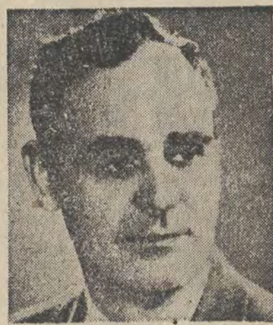
Prezes Rady Ministrów Rumuńskiej Republiki Ludowej GHEORGHIU-DEJA

W rządzie tych oddziałów ZPB im. F. Dzierżyńskiego, które wykonały już swój roczny plan, stanęła w dniu 29 grudnia, obok tkalni i wykończalni, także i przedziałnia średnio-przednia. Tym samym więc zakłady mogły złożyć w tym dniu zaszczytny meldunek o całkowitej realizacji planu na rok 1952.