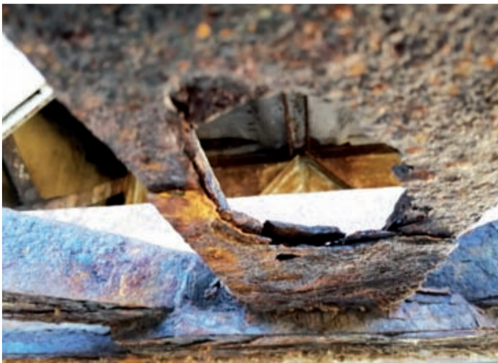
Skorodowany i dziurawy element kratownicy.

Naczelnik Wydziału Inwestycji i Remontów Grzegorz Pelka odpowiadał na zarzuty o zły stan mostu, że przy wykonaniu planowanych prac konserwacyjnych konstrukcja wytrzyma jeszcze