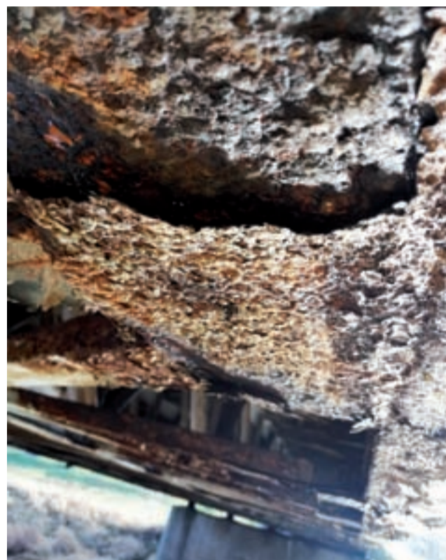
Płat skorodowanej, rozwarstwionej stali zwisający z jednej z belek.