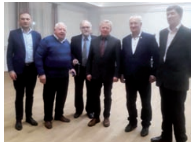
Przedstawiciele „Solidarności” Rolników Indywidualnych z powiatu łowickiego razem z unijnym komisarzem ds. rolnictwa Januszem Wojciechowskim.

Cena odbioru opadów została ustalona w gminie Zduny na sesji w listopadzie. Wynosi ona 23 zł/osoby miesięcznie. W przypadku zadeklarowania, że bioodpady będą zagospodarowane na terenie gospodarstwa, stawka będzie mniejsza o 5,50 zł, czyli wyniesie 17,50 zł. ■