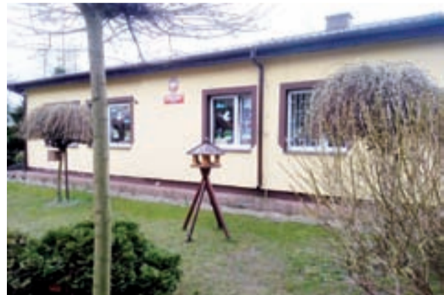
Przedszkole w Kiernozie ma zostać rozbudowane oraz zmodernizowane.

Na przebudowę sieci wodociągowej w Stępowie oraz budowę sieci wodociągowej i kanalizacji sanitarnej w ulicy Przytargowej w Kiernozie zaplanowane zostało w budżecie 650 tysięcy złotych. Przypomnijmy, że w tym roku gmina zakończyła trzeci etap budowy kanalizacji sanitarnej w Kiernozie. Do skanalizowania w tej miejscowości została tylko ul. Przytargowa, która została wydzielona w planie zagospodarowania i faktycznie powstała już po zaplanowaniu i zaprojektowaniu wszystkich trzech etapów budowy kanalizacji. – Liczymy na to, że uda nam się uzyskać dofinansowanie pieniędzmi unijnymi, ale na tę chwilę zabezpieczamy całość środków w naszym budżecie