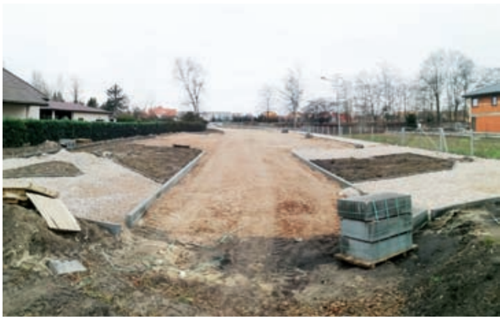
Widok na plac budowy ul. Bł. Bolesławy Lament od strony ul. Ułańskiej.

Łowicz | Wig-Kost buduje nawierzchnię na ul. Bł. Bolesławy Lament