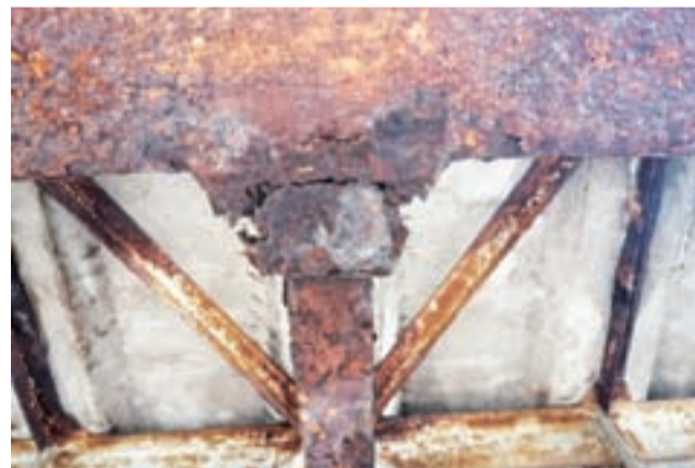
W górnej części zdjęcia skorodowana główna belka nośna , niżej kratownice.