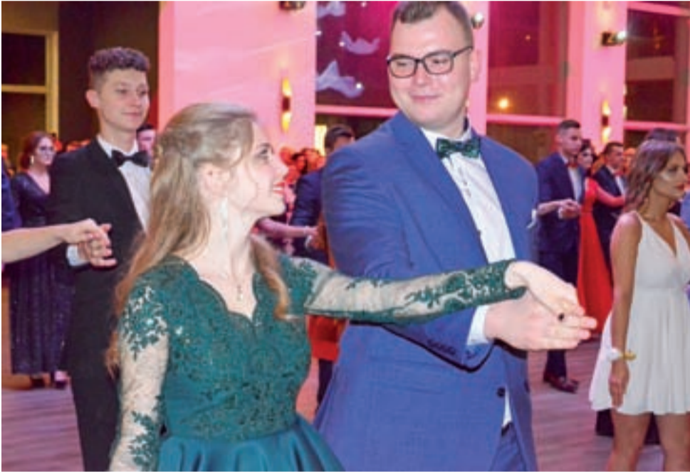
Polonez maturzystów z kl. IIIb.