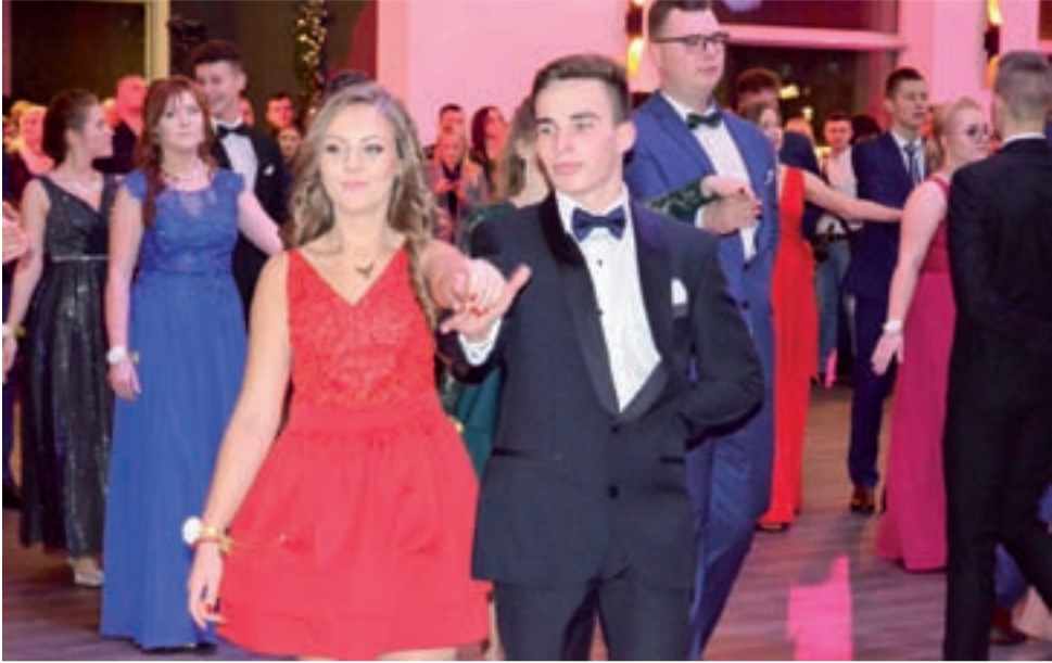
Jak widać chłopcy z Ekonomika zdecydowali się na garnitury i muchy pod szyją.