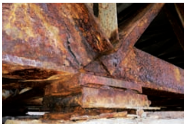
Skorodowane rolki – łożyska mostowe , na których opiera się most na jednym z filarów.

– Jestem w trudnej sytuacji, bo tutaj się z wszystkimi żyłem – bo ja przywiązuję się do ludzi – ale pracując bliżej domu będę miał więcej czasu dla rodziny – dodaje. Mówi też, że życie kierowało go do do różnych prac i każda była ciekawa. Jednak on jest typem samorządowca, dlatego sądzi, że pod koniec pracy zawodowej (a ma 63 lata) odnajdzie się w roli sekretarza w gminie Bedlno. Gminę zna, ponieważ jako kierownik ARiMR w Kutnie – a był nim 13 lat – często organizował tam szkolenia dla rolników właśnie na jej terenie. mwk