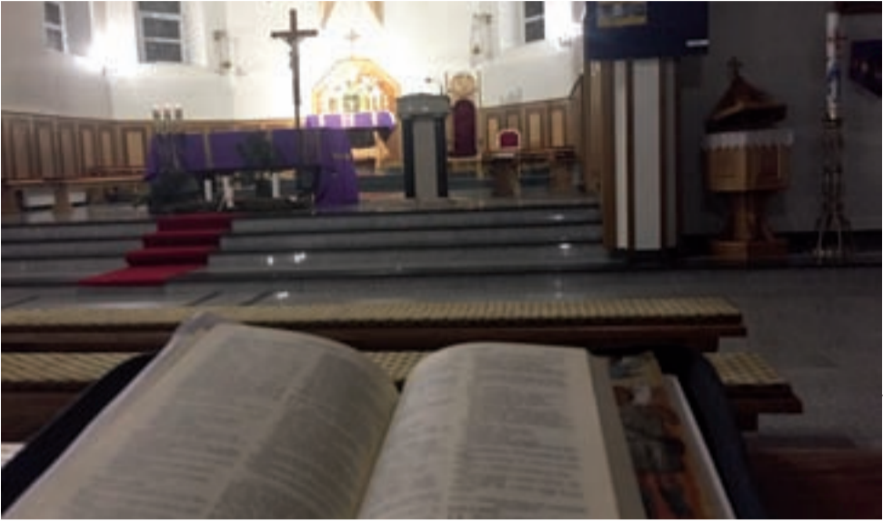
Noc. Pan jest blisko.

W zabieganiu dnia codzienniego nie jest łatwo znaleźć czas na dłuższą chwilę modlitwy. W potoku zdarzeń, obowiązków, zleceń, zaległości, w gorące załatwiania, nadrabiania, kupowania – Ten, który jest źródłem życia, dawcą wszelkiego sensu i ukojeniem, Ten, który „stoi u drzwi i kołaczę”, by Mu otworzyć, jest dziesiątym w kolejności „do załatwienia”. Może czasem nie mamy w „tej sprawie” komfortu, mamy wyrzuty sumienia: że nie tak powinno być. Czujemy, że to, co istotne w życiu, przechodzi jakoś obok.