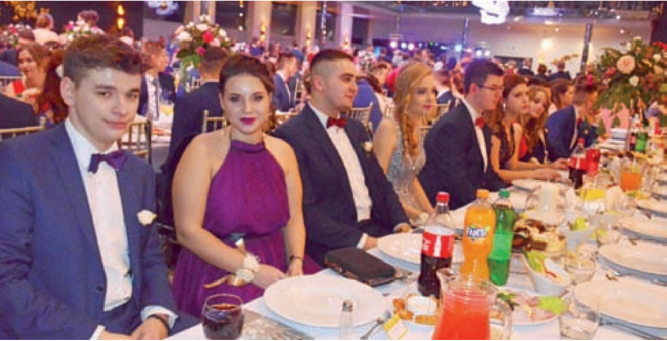
„Mediolan” oprócz rozległego parkietu zaoferował maturzystom z Ekonomika także suto zastawione stoły.