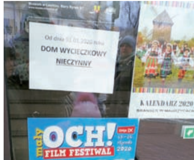
Na drzwiach wejściowych do Centrum Promocji od strony Starego Rynku pojawiła się kartka o tym, że dom wycieczkowy jest nieczynny.

Placówka funkcjonowała w tym miejscu 8,5 roku. W maju 2011, z wielkim rozmachem, z udziałem m.in. ówczesnego wicemarszałka województwa łódzkiego Doroty Ryl, odbyło się otwarcie wyremontowanej siedziby Centrum. Zasadniczą część jego powierzchni została przeznaczona na dom wycieczkowy.