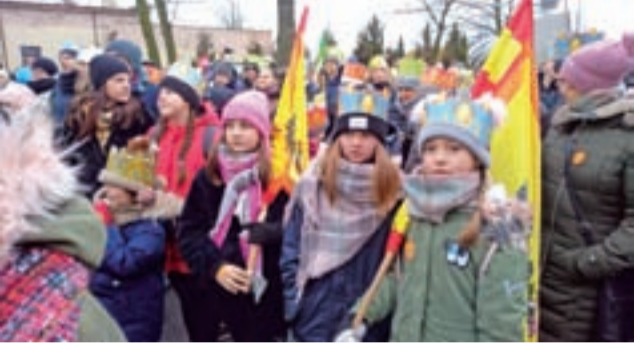
Dzieci i młodzież chętnie zakładała papierowe korony i niosła orszakowe flagi.

wcześniej grupa parafian z Korabki. – Głównym smakoszem i koordynatorem przygotowywania