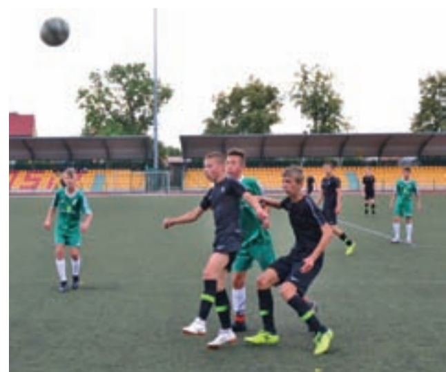
Drużyna Pelikana z rocznika 2005 awansowała do I ligi.