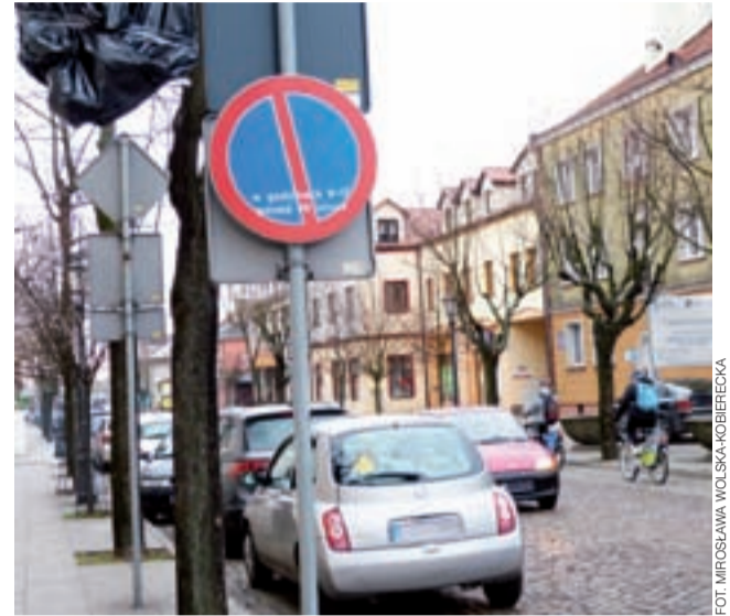
Znaki zakazu parkowania już się pojawiły. Na zdjęciu widać, że informacja dopisana na nich na biało nie jest zbyt czytelna.

Warto pamiętać, że bez ryzyka zapłacenia mandatu można parkować na Starym Rynku, na którym przez ostatnie lata obowiązywała strefa płatnego parkowania, ale tylko na wyznaczonych miejscach – a tych nie ma pośrodku głównej części parkingu, jedynie wokół niego, a także od strony wjazdu na rynek od strony ul. Zduńskiej (od pomnika