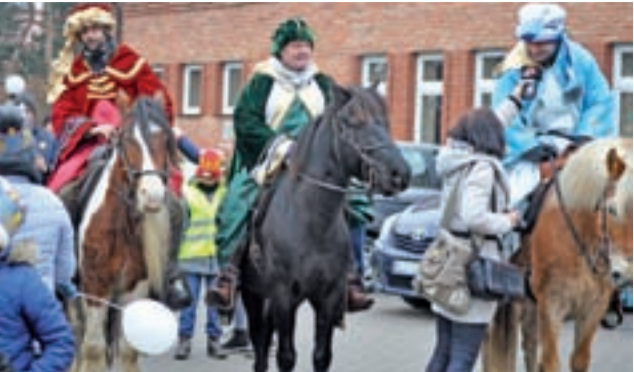
Od kilku już lat Trzej Królowie jadą w orszaku na koniach „wypożyczonych” ze stowarzyszenia „Karino”.

W trakcie orszaku, w czterech miejscach odegrane zostały krótkie, dosłownie kilkuminutowe scenki na temat Bożego Narodzenia i Objawienia Pańskiego, za każdym razem zaśpiewano też kil-