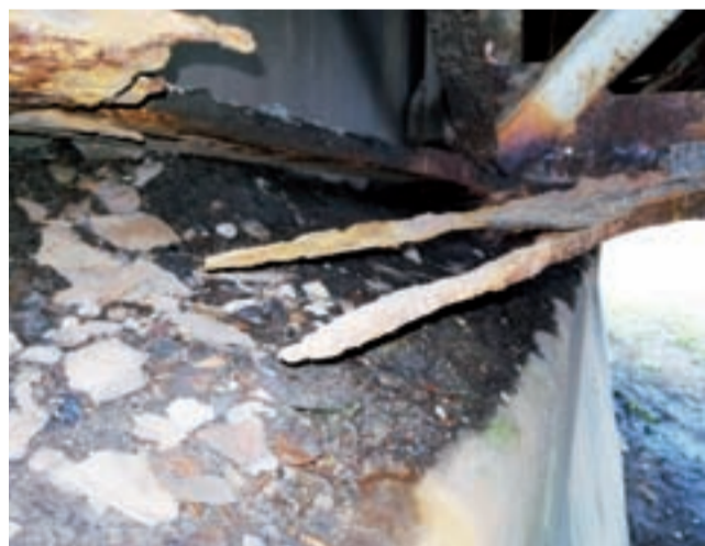
Półowa skorodowanego płaskownika kratownicy mostu – reszta odpadła.

Rolki winny pracować, tymczasem na Mostowej, przynajmniej na przyczółkach wątpliwe, aby tak było. Korozja i tu działa, rolki są zasypane błotem zmieszonym z fragmentami skorodowanej stali, która odpadła od konstrukcji. Tych płatów, czasami wielkości ludzkiej ręki, leży pod mostem sporo, niektóre są cienkie, ale zdarzają się też takie o grubości 0,5–1 cm – takie mieliśmy w ręku. Co ważne, tam gdzie doszło do rozwarstwienia stali, czy to na elementach kratownic czy belek wzdłużnych, wystarczy ręka, aby odrywać kolejne jej warstwy, prawdopodobnie używając śrubokręta czy