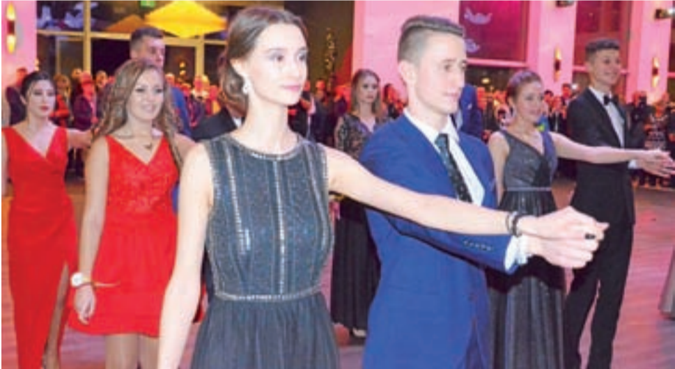
Uczniom przed polonezem życzone udanej zabawy i powodzenia na egzaminach. Na fotografii klasa IIIb.