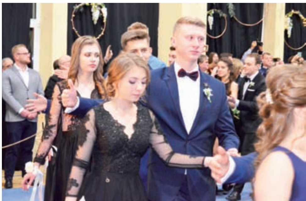
Trudno uwierzyć, że ci sami ludzie jeszcze kilka lat temu, napisali najlepiej w woj. łódzkim sprawdzian klas szóstych.