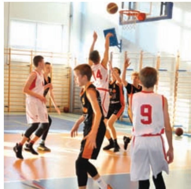
Kadeci Bzury walczą o pierwszą wygraną w lidze.