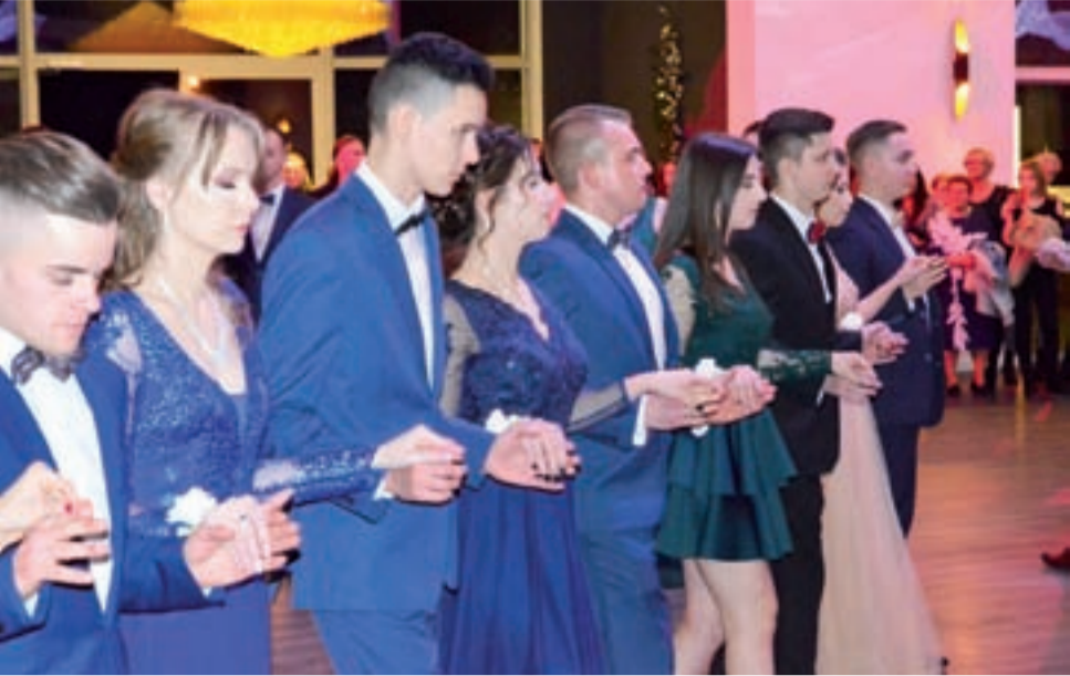
Uczniowie klasy IIIa LO w ZSP nr 4 w czasie poloneza.