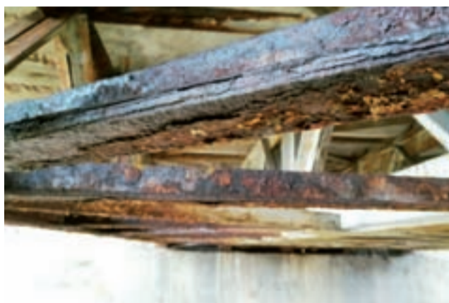
Widoczne rozwarstwienie stali na jednej z belek kratownic.

Łowicz | Fatalny stan mostu w centrum miasta