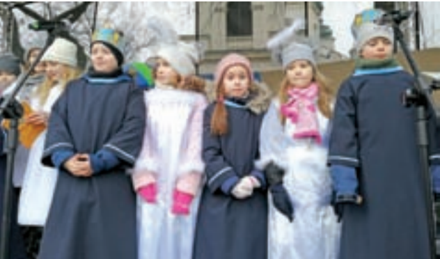
Na scenie na Starym Rynku wystąpili dzieci ze scholi pijarskiej i przedszkola Pod Tęczą.

Na uczestników orszaku na Starym Rynku czekała gorąca zupa i herbata. Orszakową tradycją stało się też, że zupę przygotowuje