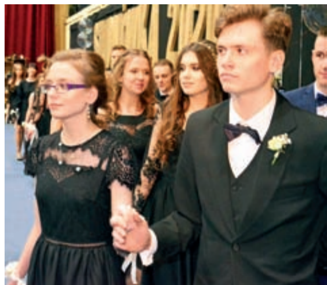
Tegoroczni maturzyści szkoły Pijarskiej samodzielnie przystroili salę gimnastyczną czerpiąc inspirację ze znanej sztuki Szekspira.