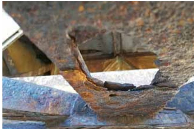
Skorodowany i dziurawy element kratownicy.

uważa się natomiast stan kratownic, na których znajdują się jezdnie (środkowe). Mówi też, że stan trzech betonowych podpór podtrzymujących most oraz przyczółków, czyli początku i końca mostu, jest dobry. Właściwie można