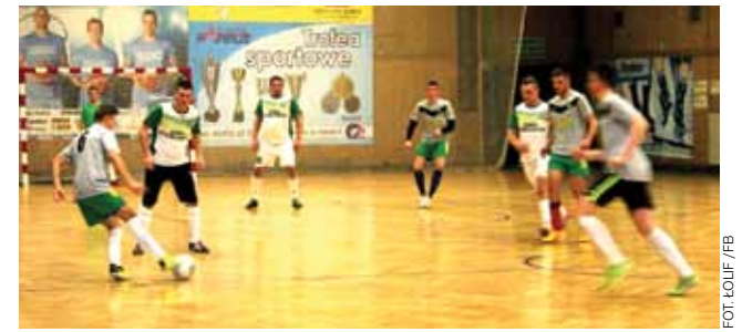
FC Jeziorko wygrało z Olimpią Junior 2:1.