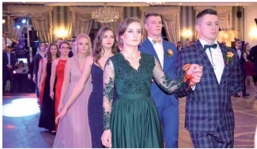
Polonez na studniówce uczniów ZSP nr 2 na Blichu w Łowiczu tańczony był w trzech odsłonach.