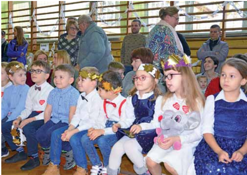
Dzieci z przedszkola w Bolimowie czekają na swój występ oglądając koncert Bolimowskiej Orkiestry Dętej.