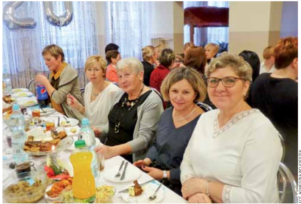
Spotkać się w tak wspaniałym gronie to sama przyjemność – zapewniały uczestniczki, którym tego dnia towarzyszył dobry nastrój.

– W tym roku również będziemy prężnie działać – zapewniają gospodynie. aw