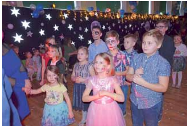
Na zabawę choinkową do szkoły w Błędowie wiele młodszych dzieci przyszło w przebraniach.

Zabawa zaplanowana do godz. 22, została na prośbę młodzieży przedłużona przez dyrektora o godzinę. – Ładnie się bawili, więc dlaczego miałam się nie zgodzić. Mamy fajną młodzież – powiedziała nam, dodając, że wła-