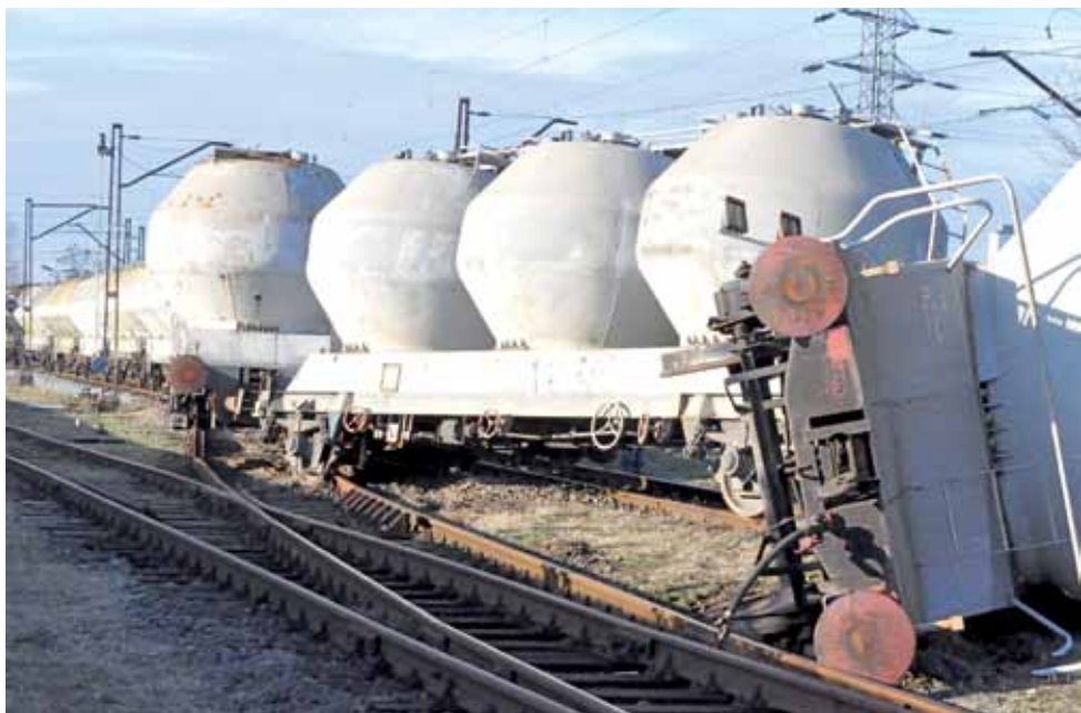
Wykolejony pociąg zajmował dwa torowiska.

CZWARTEK 16 stycznia 2020 | NR 3 (1385) | Rok XXX | ISSN 1231-479x