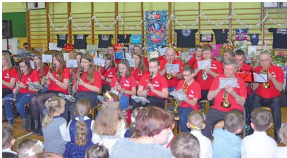
Bolimowska Orkiestra Dęta rozpoczęła program finału WOŚP w Bolimowie.