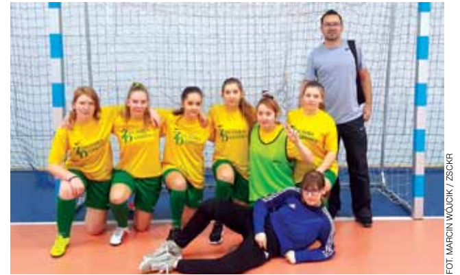
Najlepsza półfinałowa drużyna piłkarek szkół rolniczych.