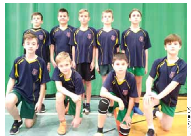
FOT. DOMINIK KUS

■ Półfinały: SP nr 2 w Łowiczu – SP w Domaniewicach 2:0, Pijarska