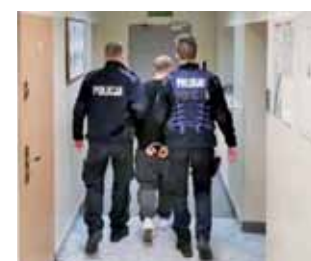
Starszy z napastników został tymczasowo aresztowany.

Napastnicy uciekli w nieznanym kierunku. Policjanci po zgłoszeniu rozpoczęli poszukiwania. Po penetracji pobliskiego terenu zatrzymali dwóch napastników w rejonie osiedla Tkaczev. Okazali się nimi dwaj łowiczanie w wieku 25 i 28 lat. Starszy jest