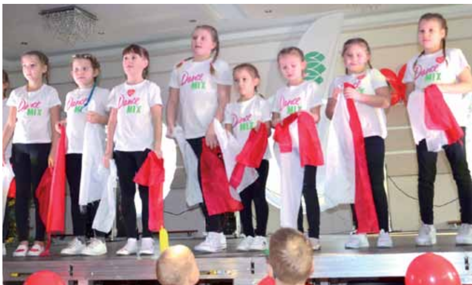
Na scenie ustawionej w restauracji Szkiełka jako pierwsze wystąpiły dzieci, które od niedawna uczą się tańczyć w Studiu Rampa.

otrzymywał sprzęt, m.in. inkubatory, kardiominitory, urządzenie do badania słuchu z 1., 4., 6., 7., 8., 9., 17., 21. i 25. finału, w sumie za około 272 tys. zł, oddział pomocy doraźnej otrzymał sprzęt z 5. finału za 8,3 tys. zł, a oddział chirurgiczny – kardiomonitor z pieniędzy z 26. finału (przekazany w 2019 roku) za 16 tys. zł.