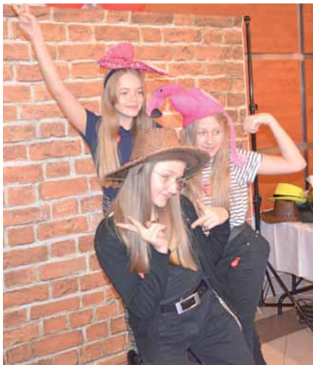
Jedną z atrakcji w sztabie w Łowiczu było magiczne lustro, które robiło zdjęcia na takiej samej zasadzie jak fotobudka. Tak wyglądało pozowanie do zdjęć.

Liczenie pieniędzy z puszek i wszystkich licytacji dało we wtorek po południu wynik 62.849,50 zł (w ubiegłym roku, również rekordowym, było 46.417,99 zł). Szefowa sztabu Katarzyna Kodrecka dzień wcześniej podała kwotę 58.291,50 zł, jeszcze przed wpłaceniem kwot, jakie zostały