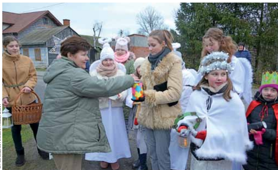
– Gdzie macie skarbnika? – zapytała mieszkanka Popowa, którą odwiedzili kolednicy i wsparła ich swoim datkiem.

Wybór nazwy to też świadectwo tego, że krwawa bitwa nad Rawką nie jest mocno zakorzeniona w świadomości mieszkańców. Szkoda. tb