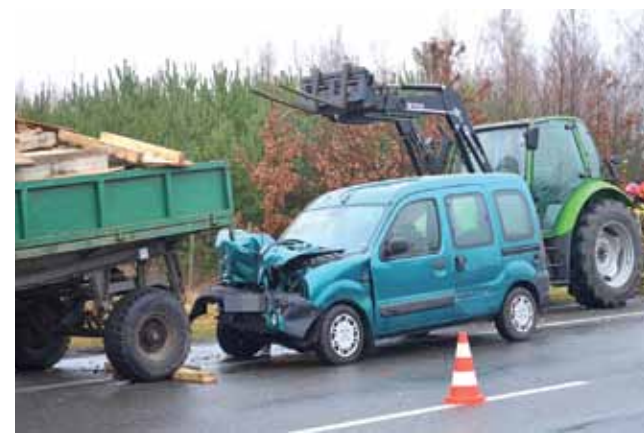
Renault Kangoo uderzył w tył przyczepy załadowanej drewnem.

Kierowca wyszedł z samochodu o własnych siłach jeszcze przed przyjazdem służb. Nie odniósł poważniejszych obrażeń, które wymagałyby hospitalizacji. Był trzeźwy. mak