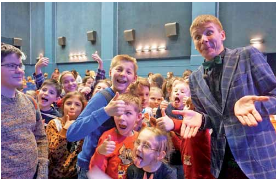
Zajęcia prowadzone w ŁOK i kinie Fenix w ramach Małego Och! Film Festiwalu cieszą się dużym zainteresowaniem. Na zdjęciu spotkanie z magikiem.

Biblioteka w Chaśnie zaprasza w sobotę, 18 stycznia, w godzinach od 10 do 12 na zajęcia breakdance. Spotkanie o 10.00 przeznaczony jest dla dzieci młodszych, a na godzinę 11.00 mają przyjść starsi tancerze (uczniowie klas od szóstej). Zorganizowane mają również zostać zajęcia plastyczne – biblioteka poinformuje