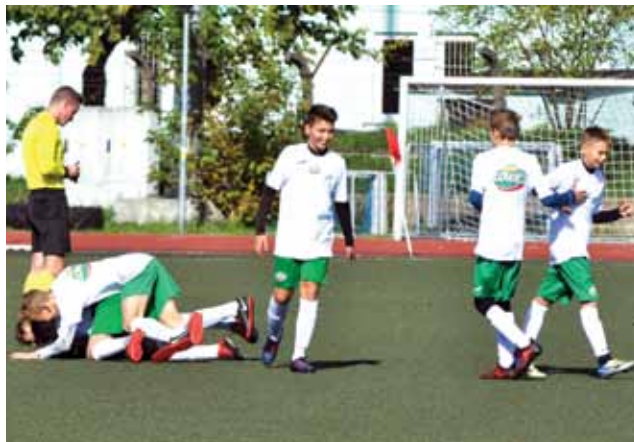
Pelikan 2006 często cieszył się ze zwycięstw.

Jeżeli chodzi o bramki stracone to łowiczanie razem z Sokołem stracili najmniej goli w lidze. Obie drużyny straciły po 16 bramek.