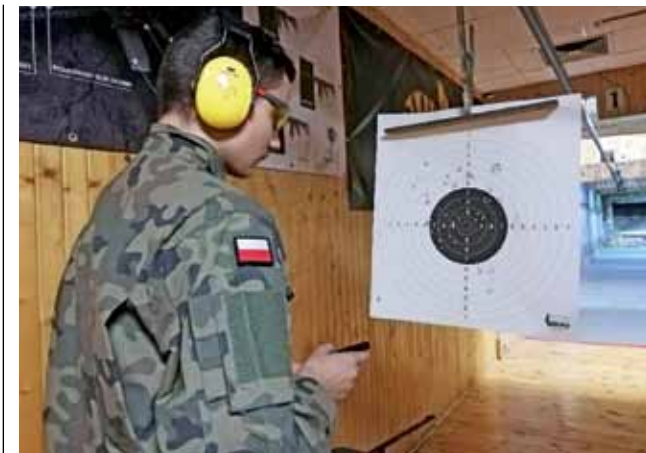
W strzelaniu do tarczy wzięli udział uczniowie z działającej w ZSP 1 „grupy mundurowej”.

Pijarskie LO zajęło 49. miejsce w rankingu szkół olimpijskich (odrębna klasyfikacja uwzględniająca tylko wyniki olimpiad). W tym samym rankingu Technikum w ZSP nr 2 jest na 146. miejscu. tm