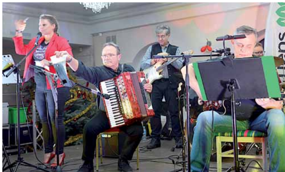
Jedną z ostatnich atrakcji programu w Łowiczu był koncert zespołu Green Craft ze Skierniewic, grającego szanty i bluesa.