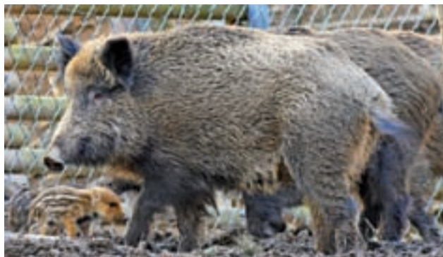
Dziki. ASF jest śmiertelnym zagrożeniem dla nich – i dla trzody chlewnej.

Wśród hodowców częste jest przekonanie, że odstrzał dzików jest prowadzony przede wszystkim zbyt późno, a poza tym na-