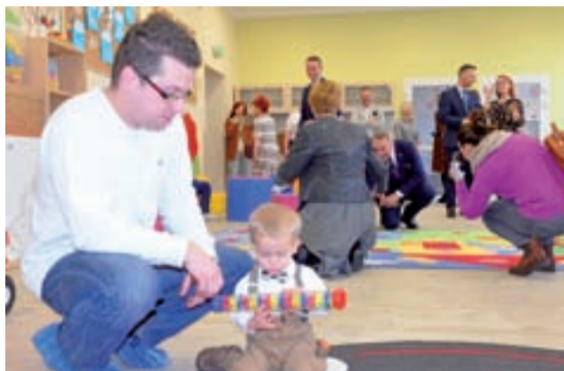
Żłobek w Zdunach dla 16 dzieci ruszył 27 stycznia, w ostatni weekend oficjalnie został otwarty.

– Żłobek dużo mi w życiu ułatwił, dzięki niemu udało mi się już wrócić do pracy, którą bardzo lu-