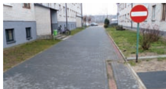
Od kiedy droga między blokami jest jednokierunkowa, sytuacja bardzo się poprawiła, ale jednak wyjście z klatki bloku 1B (na zdjęciu po lewej stronie) nadal nie jest do końca bezpieczne.