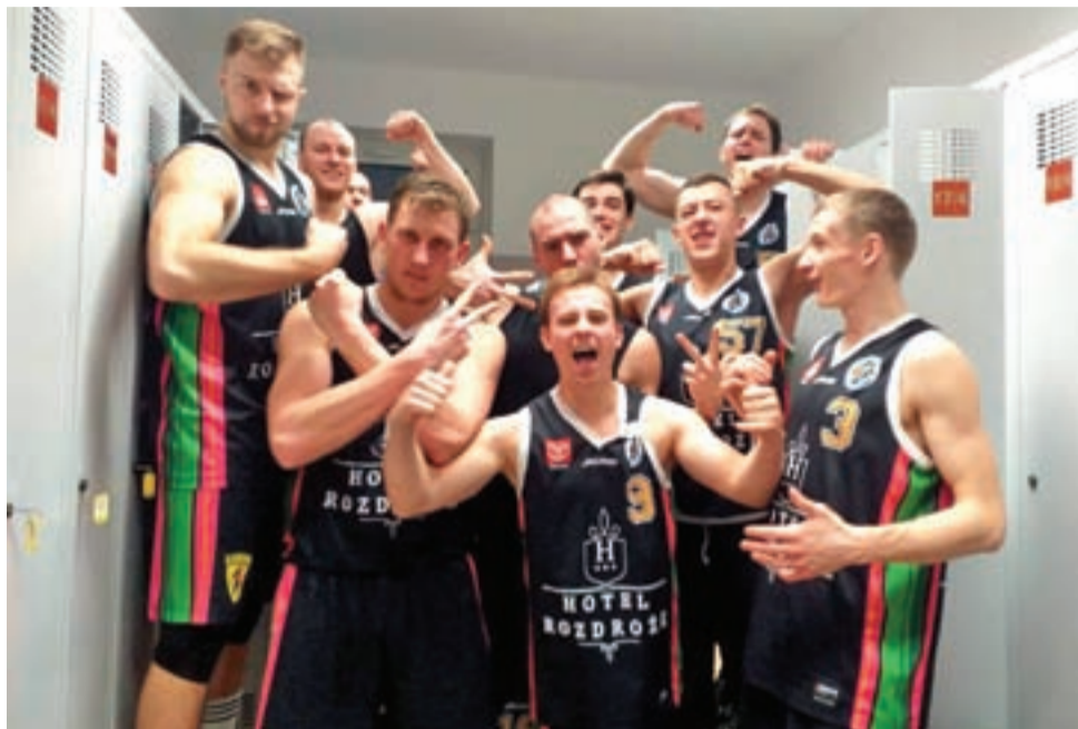
Radość w szatni po wygranej w Kłodzku.

Łowiczanie wygrali dwie pierwsze kwarty, ale przewaga wynosiła tylko cztery punkty (47:51), a w trakcie gry walka o punkty była bardzo zacięta i raz jedna, a raz druga drużyna przejmowały prowadzenie w grze. Po przerwie do głosu doszli gospodarze, którzy nie tylko odrobili straty, ale również zdobyli czteropunktową przewagę. Po 30 minutach walki Nysa prowadziła 75:71.