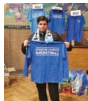
Kibice Księżaka zdołali zbierać sporo karmy dla potrzebujących zwierzątek.