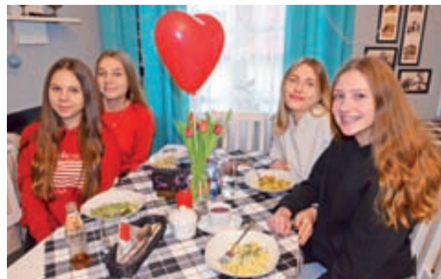
Z okazji Walentynek na przyjacielskiej kolacji w restauracji „Na Poddaszu” spotkały się po szkole koleżanki z jednej klasy z I LO.