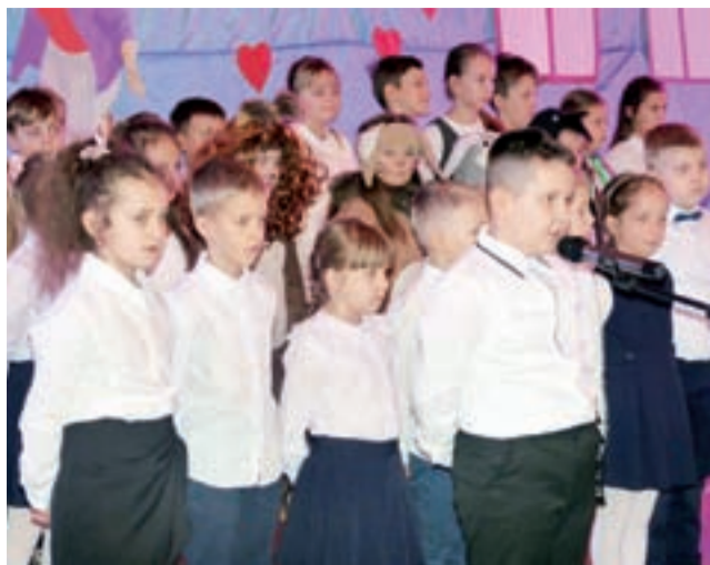
Tak prezentowały się dzieci podczas występów.