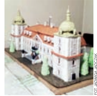
Praca Jadwigi Jadczyk to model pałacu w Nieborowie wykonany w skali 1:100.

Autorka piernikowego pałacu w Nieborowie powiedziała nam, że wyrazi zgodę na wysłanie jej do Szwecji, jeśli będzie taka możliwość, chciałaby, aby potem wróciła ona do Polski i była pokazana w Nieborowie – a zainteresowanie tym wyraziła kurator Muzeum w Nieborowie i Arkadii