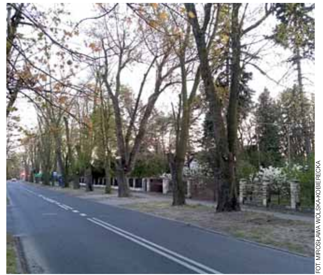
Drzewa przy ul. Armii Krajowej w Łowiczu już po przycince.