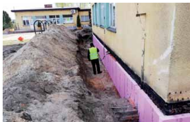
Prace przy ocieplaniu fundamentów Szkoły Podstawowej w Belchowie. Ta inwestycja będzie dofinansowana w 50% przez WFOŚiGW.

W przypadku każdej z placówek obejmą one wymianę okien, ocieplenie ścian zewnętrznych i stropów, wymianę całej instalacji centralnego ogrzewania oraz montaż paneli fotowoltaicz-