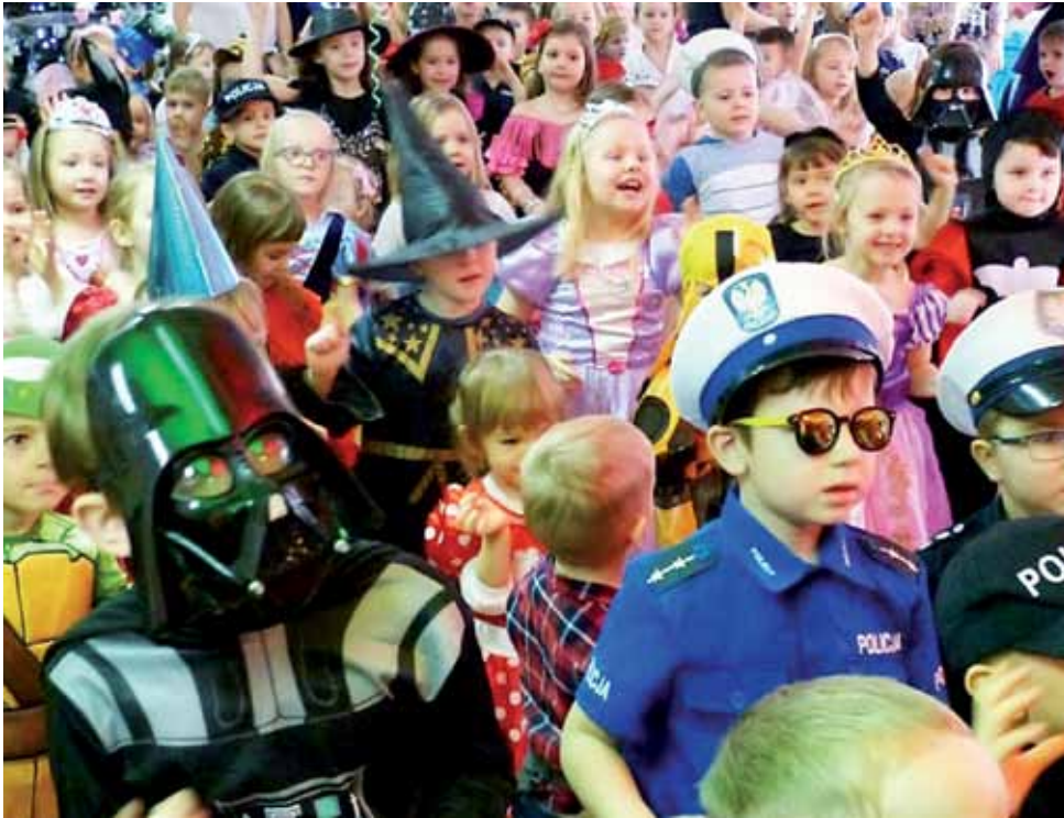
Na zabawy z taką liczbą dzieci, jak ta karnawałowa z Przedszkola nr 2 w Łowiczu, trzeba będzie jeszcze długo poczekać. Kwestia tygodnia, dwóch wydaje się natomiast przyjmowanie przedszkolaków pod opiekę w ograniczonej liczbie.

W Łowiczu zainteresowanie posłaniem dziecka już w tym tygodniu zgłosili rodzice ok. 150 dzieci.