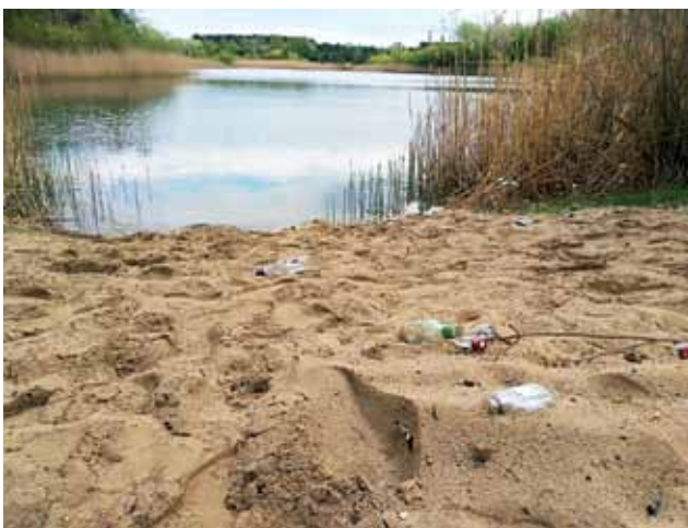
Jeden ze zbiorników wodnych w Dąbkowicach, po drugiej stronie drogi od miejsca, gdzie utonął mężczyzna. Na brzegu widoczne butelki po alkoholu.

Wędkarz zobowiązany jest utrzymać w czystości stanowisko wędkarskie w promieniu minimum 5 metrów, bez względu na stan, jaki zastał przed rozpoczęciem połowu.