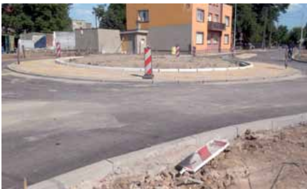
Budowa ronda na ul. 1 Maja w maju 2018 roku. Teraz, po dwóch latach, można się spodziewać, że prace będą kontynuowane od tego miejsca w stronę wiaduktu.

■ gmina Zduny – 70% kosztów przebudowy drogi Bąków Górny – Leśniczówka (odcinek od trasy krajowej nr 92 do grani-