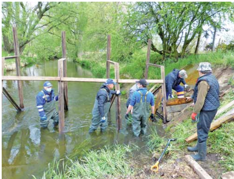
Montowanie zapory w Bełchowie powierzono pracownikom gminnej brygady. Wspierali ich przy tym pracownicy Wód Polskich.