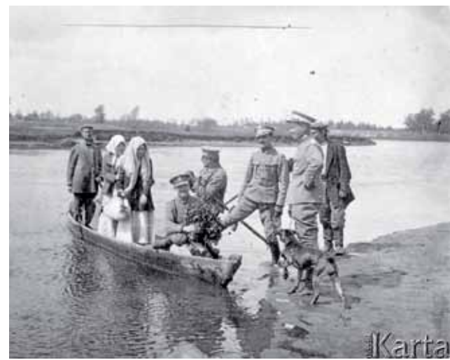
Wołyń, 1919-1920. Polscy żołnierze nad Stochodem.

Od wieków na Górnym Śląsku nie święcono tak narodowego święta, jak właśnie w ubiegłą niedzielę. Pod sztandarem narodowym zgromadziły się wszelkie partie i stronnictwa. Jak Górny Śląsk daleki i szeroki, wszędzie zebrały się wielkie rzesze rodaków i rodaczek naszych, aby przed całym światem dać dowód swej polskości. Zgromadzili się starzy i młodzi, wszyscy przejęci