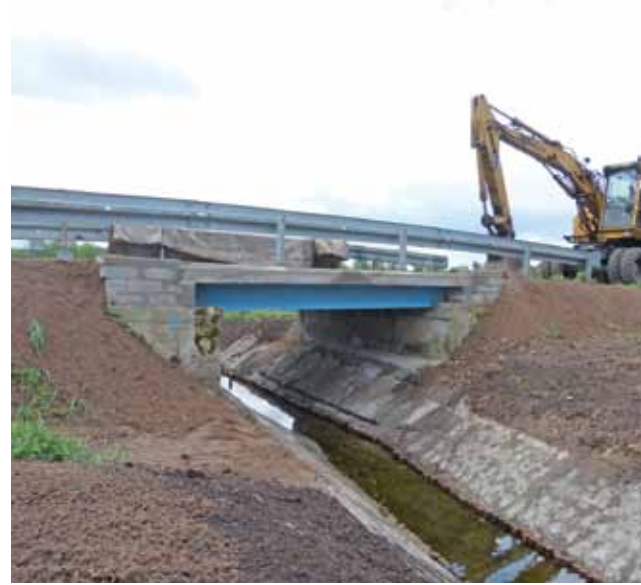
Odbudowany most ma bardziej wytrzymałą konstrukcję w porównaniu do poprzedniego. Nadal nie mogą na niego wjeżdżać pojazdy o masie ponad 6 ton.

Nawet jeśli zjawisko jest naturalne, a nie spowodowane pleśniawką lub inną chorobą, to w Ziemiarach powstał poważny problem. Nad zbiornikiem jest bardzo dużo ptaków, m.in. rybitwy, które roznoszą padlinę, stwarzając zagrożenie epidemiczne. Zanim problem uda się rozwiązać, lepiej unikać tego miejsca. mwk