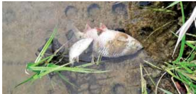
Wśród ryb, które masowo padły w Ziemiarach są m.in. płocie.

– Jak zauważyłem, padnięte ryby są różnej wielkości, więc są w różnym wieku. Zwierzęta po-