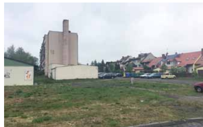
Budynek może powstać na tym placu. Widoczna, przyległa do istniejącego bloku stara kotłownia z kominem, jest do wyburzenia.

Za uchwałą głosowało 17 radnych, wstrzymało się 4 (z klubu Łowickie.pl). tm