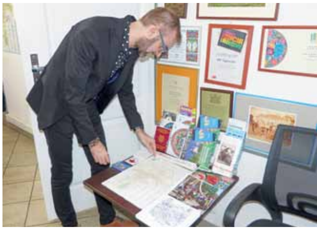
W prowadzonym przez Urząd Miejski w Łowiczu punkcie Informacji Turystycznej materiały już czekają na turystów, którzy – miejmy nadzieję – niedługo będą odwiedzać nasze miasto.