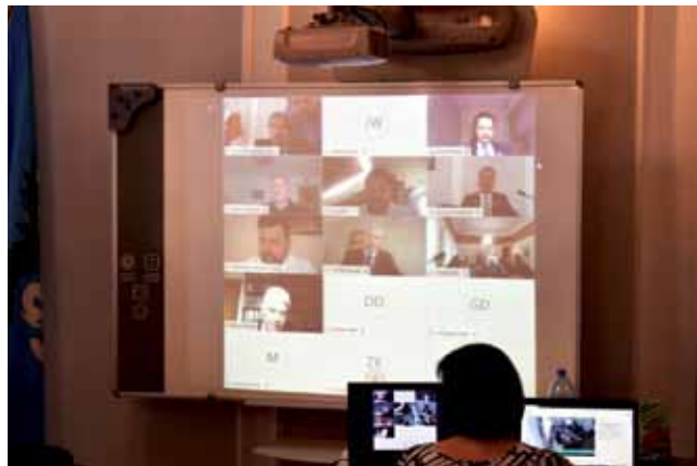
Radni włączają się do konferencji online po wznowieniu sesji po krótkiej przerwie.

Mechanik samolotowy – czy taka klasa powstanie na Podrzecznej. str. 9