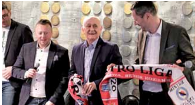
Projekt Retro Liga rozlosował grupy, ale czeka na odmrożenie.

Projekt Retro Liga czeka na swój czas. Planowaliśmy start w ostatni weekend marca. Koronawirus pokrzyżował wszystko. Do tej pory udało się tylko rozlosować zespoły do grup A i B. 10 Pułk Piechoty znalazł się w grupie z mistrzem Polski czyli Lechią Łwów (Dzierżonów)