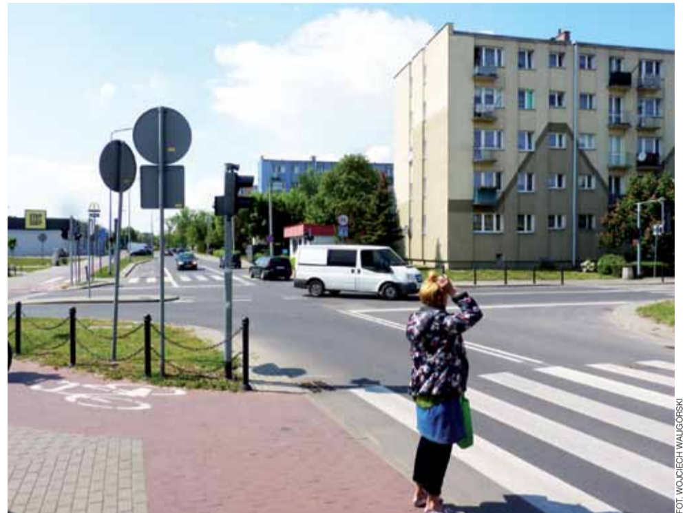
Skrzyżowanie Piłsudskiego i Sikorskiego. Tuż obok bloków os. Broniewskiego, tuż obok targowiska. I za ciasno, zdaniem ratusza, na rondzie.

Przed wszystkim jednak TIR-y muszą przejeżdżać wzdłuż kilkudziesięciu domów jednorodzin-