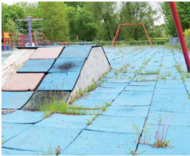
Płytki na placu zabaw odstają od ziemi, a pomiędzy nimi wyrastają chwasty. Widoczne na zdjęciu linarium nie ma liny i wózka, którym po niej jeżdżą.

Gruntowej renowacji poddane zostanie linarium na tym placu. Jego konstrukcja pozostanie bez zmian, ale zostanie odnowiona, wymieniona będzie stalowa lina