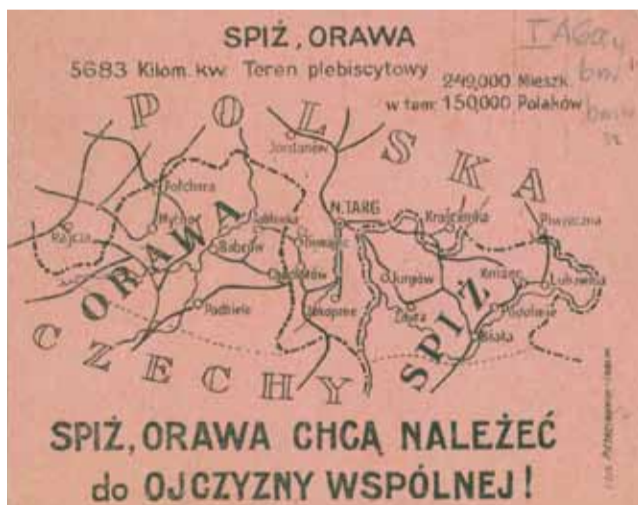
Ulotka z okresu plebiscytu na Śląsku Cieszyńskim.

Cykl przygotowany przez Ośrodek KARTA na zlecenie Biura Programu „Niepodległa” w ramach obchodów setnej rocznicy odzyskania przez Polskę niepodległości i odbudowy polskiej państwowości. Dowiedz się więcej: www.niepodlegla.gov.pl , www.karta.org.pl