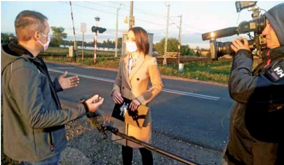
Ten mężczyzna przyjechał na ul. Płocką w trakcie trwania programu. Opowiedział o tym, jak dostał mandat na przejeździe w ciągu ul. Seminaryjnej.