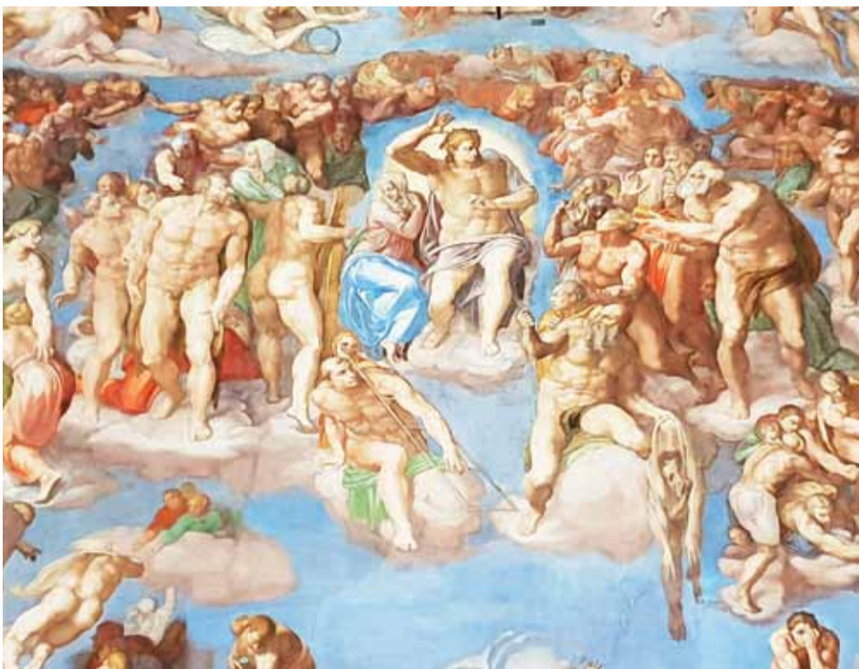
Sąd Ostateczny – jeden z bardziej znanych fragmentów fresków w Kaplicy Sykstyńskiej.

Obydwie wypowiedzi – prozą i wierszem – spowodowane zostały spektakularnym efektem prac konserwatorskich fresków, o których podjęciu zdecydował właśnie On – papież z Polski.