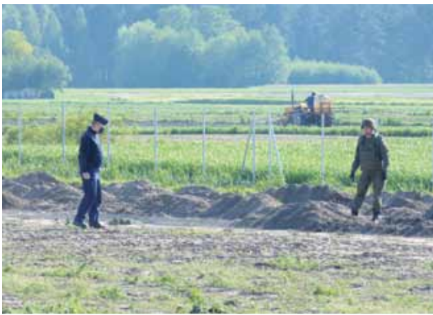
Saperzy oglądają miejsce, gdzie został znaleziony pocisk.

Jeśli Senat, przetrzymując przez miesiąc ustawę, którą w całości odrzucił, dał ilustrację tego, czym jest obstrukcja parlamentarna, to jak nazwać takie „tempo” prac: dwunastokrotnie wolniejsze, w sto razy prostszej sprawie? Wojciech Waligórski