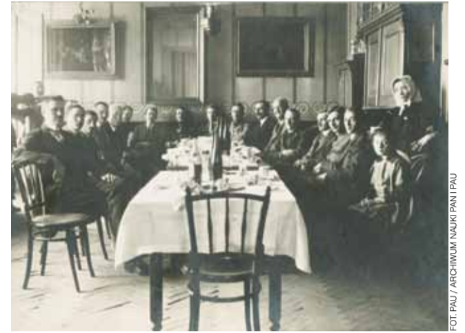
Członkowie Komitetu Plebiscytowego Spisko-Orawskiego, Trzciana, 1920.

[Polsko-sowiecka wojna 1919–1920, Moskwa 1994, tłum. Dorota Pazio]