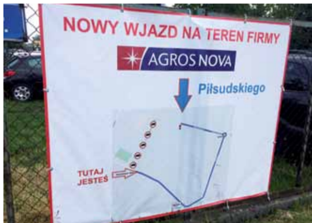
Gotowe są już banery pokazujące kierowcom jak mają dojeżdżać do zakładu. Dokładnie tą drogą, jakiej nie chcą autorzy interpelacji.