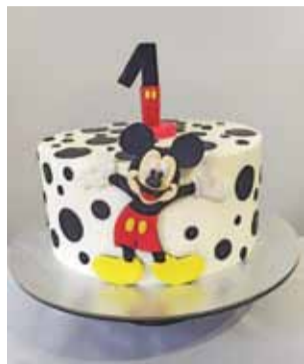
Idealny tort dla wielbiciela Myszkki Miki.