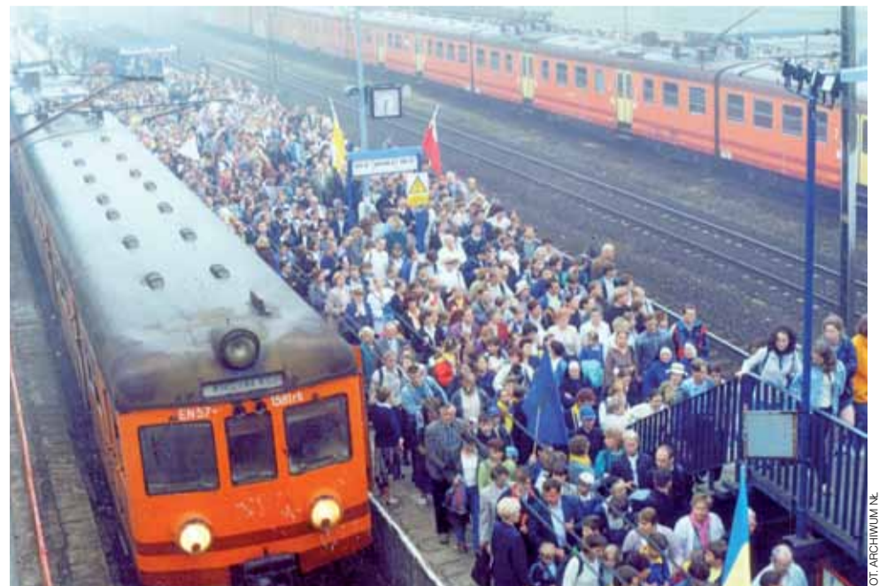
14 czerwca 1999 r., godzina 6.30. Na perony Dworca Głównego PKP w Łowiczu wylewały się z kolejnych pociągów tłumy ludzi. Czekali ich jeszcze długi marsz na miejsce spotkania z papieżem.