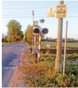
To gdzie te znaki? Stan obecny.

mandat. Później jednak „coś go tknęło” i pojechał sprawdzić: znaku nie było.