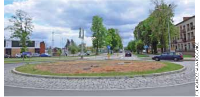
Rondo Księstwa Łowickiego jest porośnięte suchą trawą i chwastami, ale jeszcze w tym tygodniu ma się to zmienić.