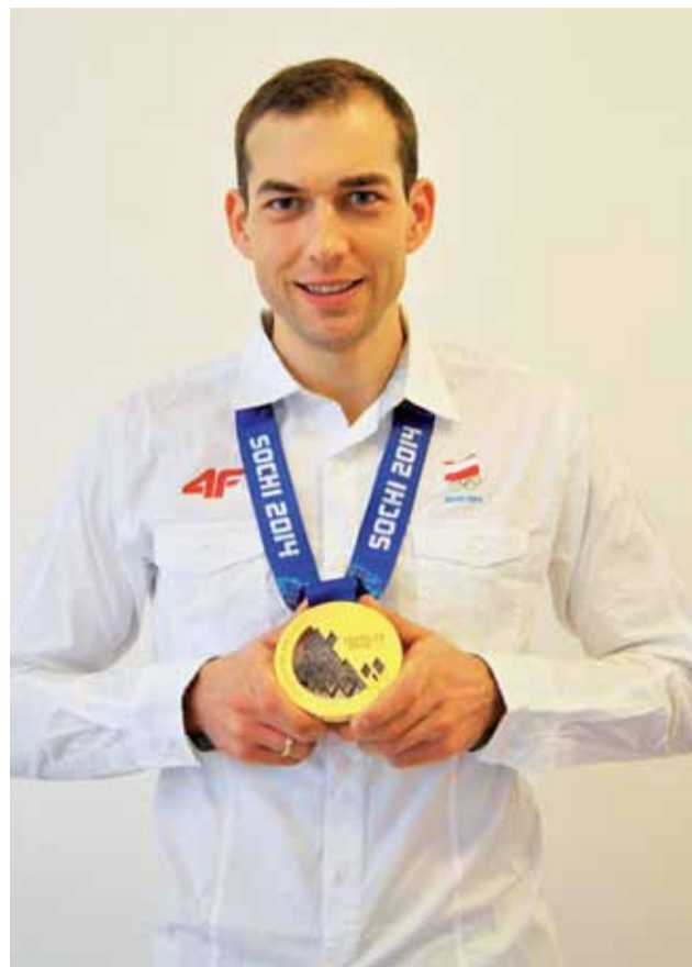
Mistrz Olimpijski z Soczi Zbigniew Bródka to najlepszy sportowiec Łowickiej Dziesiątki Stulecia.