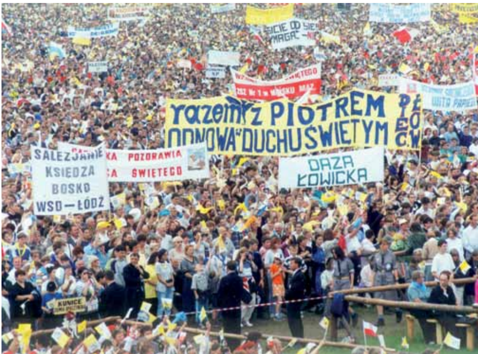
Na Bratkowicach spotkało się z Janem Pawłem II około 300 tysięcy ludzi.