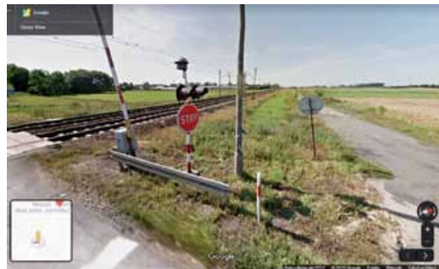
Podpowiadamy policjantom m.in. w jaki sposób można zweryfikować ile i gdzie było znaków STOP.

Na chwilę przed zamknięciem tego numeru gazety uzyskaliśmy z KPP Łowicz odpowiedź, z której wynika, że zgodnie z projektem organizacji ruchu „znak STOP widnieje jako obowiązujący z obydwu stron” oraz, że „jednostka wprowadzająca zmianę” do dzisiaj nie powiadomiła łowickiej policji o zmianach związanych z oznakowaniem w tym rejonie. Ponadto KPP ustala szczegóły związane ze sprawą wskazując też, że znak „STOP” został najprawdopodobniej przesunięty. „Obecnie ustalamy