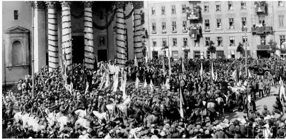
Uroczysta msza w kościele św. Aleksandra na cześć Naczelnego Wodza Józefa Piłsudskiego. 18 maja 1920.

Bolszewicy po zajęciu Żytomierza przez Wojsko Polskie nie byli pewni powodzenia na prawej [zachodniej] stronie Dniepru. W ciągu tygodnia ewakuowali Kijów, wywożąc co się da i zacierając wszelkie ślady swych