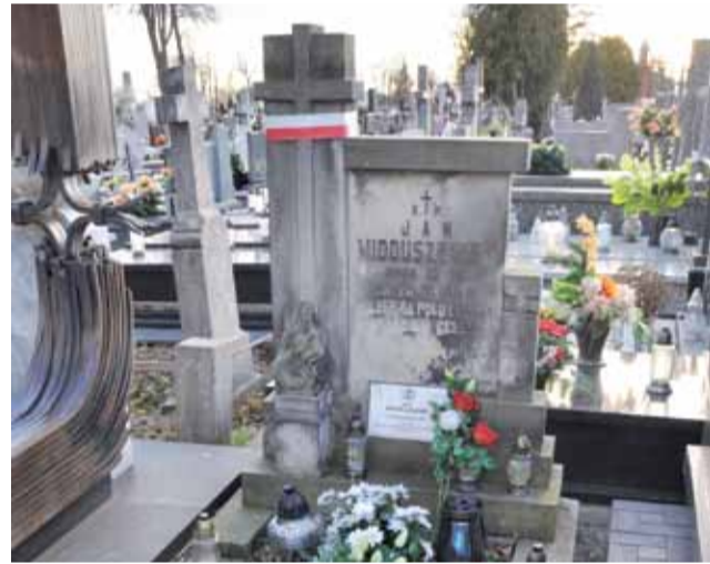
Grób Ferdynanda Eichhorna na cmentarzu ewangelicko-augsburskim.

Trudno dokładnie określić, w jakich miesiącach przeprowadzone zostaną wszystkie prace, ze względu na konieczność uzyskania zgody z Wojewódzkim Urzędem Konserwacji Zabytków. Na pewno przed kolejną kwestą pieniądze z poprzedniej będą już wykorzystane. Efekt prac każdy będzie mógł zobaczyć. mwk