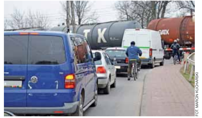
Tunel jeśli powstanie będzie rozwiązaniem bolączki wielu mieszkańców, jakim jest częste zamykanie przejazdu na ul. Mostowej.

Biorąca udział w pierwszym przetargu spółka Certus Via z Warszawy obniżyła cenę do 994.701 zł, ponieważ w pierwszym przetargu zaproponowała 1.266.887 zł. Ma ona 5 zrealizowanych tego typu projektów – co ma znaczenie, gdyż cena decyduje w 60%, a doświadczenie w pozostałych 40% – te dwa kryteria są brane pod uwagę przy punktowaniu ofert. Tym razem najdroższą ofertę złożyła spółka S.T.I