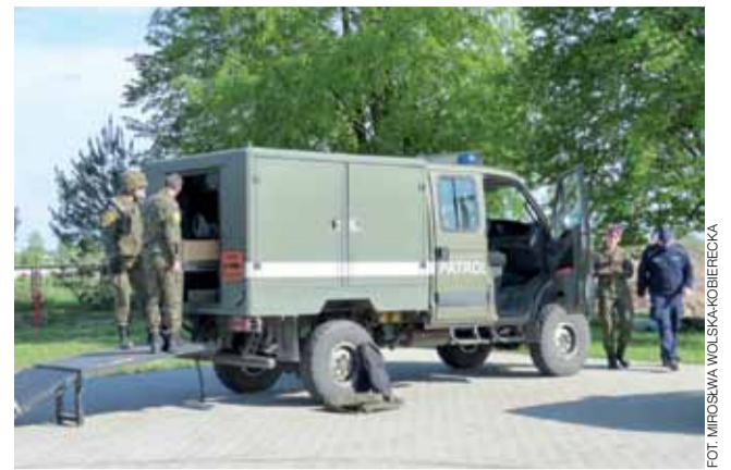
Niebezpieczeństwo minęło. Pocisk trafił do skrzyni w samochodzie 27. Patrolu Saperskiego z Tomaszowa Mazowieckiego.