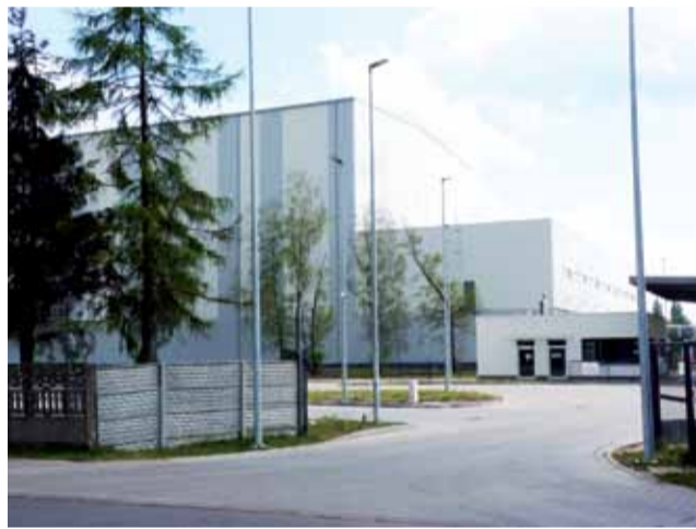
Wjazd do centrum logistycznego Agros Nova od strony ul. Piłsudskiego jest już gotowy.

Autorzy listu przypominają, że ruch samochodów powyżej 3,5 tony znacznie utrudnia funkcjonowanie w tej dzielnicy i stwarza realne zagrożenie bezpieczeństwa dla mieszkańców. Obawiają się, że jeszcze gorzej będzie po otwarciu centrum logistycznego, które powstaje na tyłach zakładu. Oceniają, że dziennie wjeżdża na teren fabryki ok. 60-80 ciężarówek, a doliczyć też trzeba ruch do firm Partners i SIB i firm na terenie Syntexu. Ten ruch w zamierzeniu planistów znajdującym odzwierciedlenie w oznakowaniu (zakaz wjazdu w ul. Sikorskiego dla samochodów o wadze ponad 2,5 tony), kierowany jest od Łodzi w ulicę Powstańców, a dalej