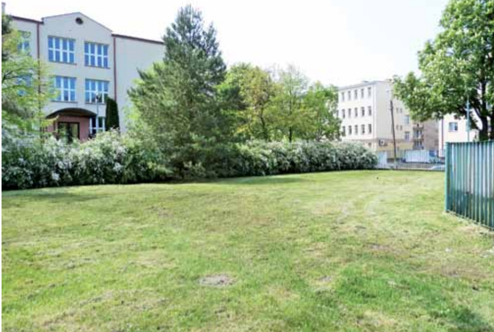
Powiat planuje pobudowanie sali gimnastycznej dla „Ekonomika” na miejskiej działce, która jest położona najbliższej przy ul. Kaliskiej.