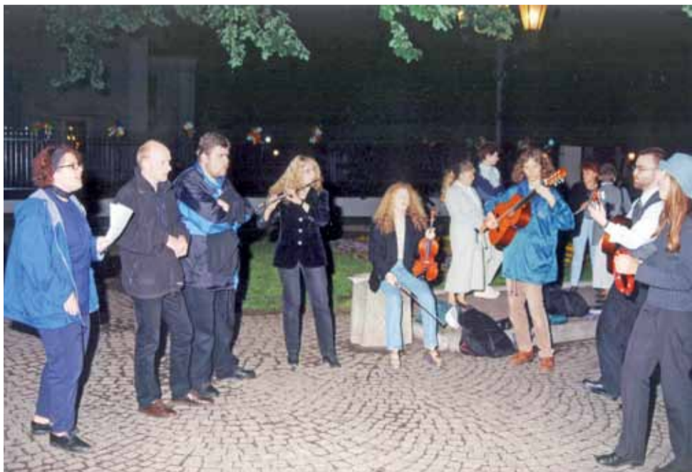
Niedziela, 13 czerwca 1999 roku, Stary Rynek. Noc przed przyjazdem Ojca Świętego – to był niesamowity czas radosnego oczekiwania.

Drodzy Rodzice, dobrze wiecie, że nie jest łatwo w dzisiejszych czasach stworzyć chrześcijańskie warunki potrzebne do wychowania dzieci. Musicie czynić wszystko, ażeby Bóg był obecny i czynny w waszych rodzinach. Nie zapominajcie o wspólnej modlitwie codziennej, zwłaszcza wieczornej;