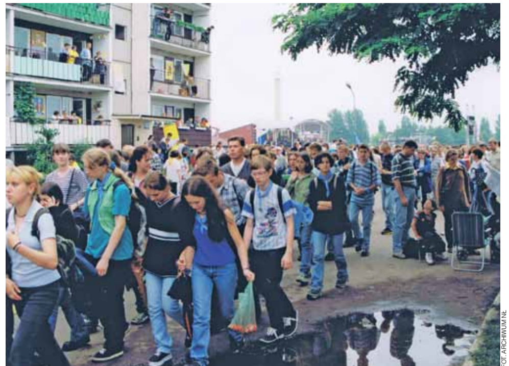
Młodych spotkało się w Łowiczu z papieżem bardzo wielu. Nauczycieli też nie brakowało.

o świętowaniu niedzieli i uczestnictwie we Mszy św. niedzielnej. Jesteście dla swoich dzieci pierwszymi nauczycielami modlitwy i cnót chrześcijańskich i nikt was w tym nie może zastąpić.