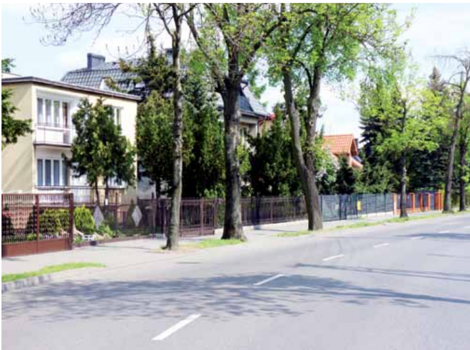
Ulica Powstańców. Tędy mieszkańcy nie chcą prowadzić ruchu ciężarówek do nowej fabryki.