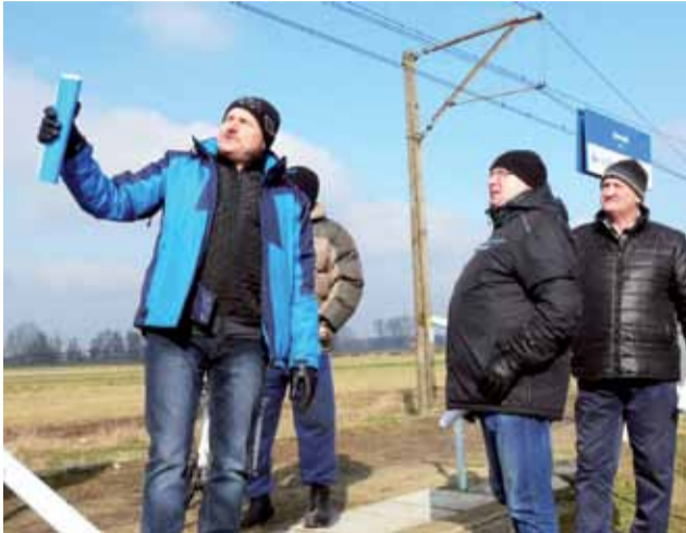
O pozostawienie przystanku w Starych Grudzach od lat walczą mieszkańcy tej miejscowości. Zdjęcie z 2018 roku.

Rekomendowana lista 200 przystanków jest katalogiem otwartym, co oznacza, że stro-