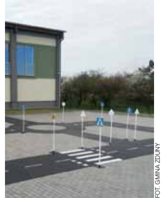
Miasteczko ruchu drogowego przy SP w Nowych Zdunach.

Temat stanowić jednak może też jeden z wątków kampanii wyborczej. Jeden z kontrkandydatów prezydenta Dudy, Rafał Trzaskowski, mówił już bowiem kiedyś, że jego zdaniem CPK nie jest potrzebny, bo: „W Berlinie udało się po latach, i będziemy mieli lotnisko, które... no trudno będzie z nim konkurować”. Obecnie podtrzymuje swe stanowisko przeciwne tej inwestycji. wal