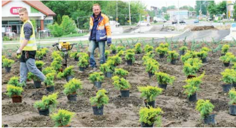
W poniedziałek 8 czerwca na rondzie na ul. Warszawskiej, podobnie jak wcześniej 5 czerwca na Bolimowskiej, zasadzono płożące się iglaki.

– Jeśli wszystko pójdzie zgodnie z planem, to termin ten jest jak najbardziej możliwy. W stosunku do całej inwestycji zostały nam niewielkie prace do zrealizowania. Kluczowym dla otwarcia ruchu jest jednak wykonanie oznakowania pionowego i poziomego. Na realizację tego jesteśmy umówieni z podwykonawcą na 17-19 czerwca – zdradza nam plany Galiński. Na 24 czerwca umówiona jest komisja, która dokona odbioru oznakowania i jeśli nie będzie żadnych