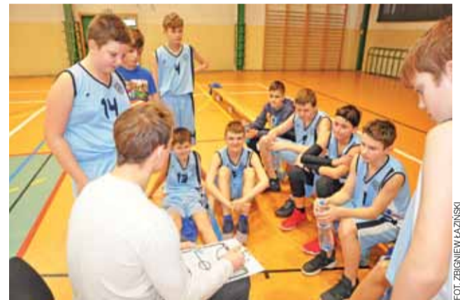
Książacy jednak już nie zagrają w tym sezonie.

SOBOTA, 13 CZERWCA: ■ 17.00 – Boisko GKS Olimpia Chaśno, Chaśno Drugie 44a; Sparingowy mecz piłki nożnej seniorów: GKS Olimpia Chaśno – LKS Orzeł Nieborów; NIEDZIELA, 14 CZERWCA: ■ 11.00 – Stadion Miejski im. 10PP w Łowiczu, ul. Jana Pawła II 3; Sparingowy mecz piłki nożnej juniorów młodszych B2: KS Pelikan-2003/04 Łowicz – RKS Mazovia Rawa Maz.; ■ 11.00 – ZSP nr 3 im. Władysława Stanisława Reymonta w Łowiczu, ul. Powstańców 1863 roku nr 12 d; 18. kolejka wojewódzkiej ligi koszykówki kadetów U16: KKS Bzura Łowicz – SKS Start Łódź. Gogo