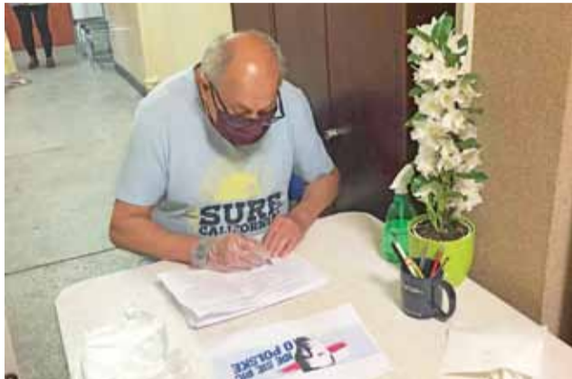
Głos poparcia dla Rafała Trzaskowskiego można było składać w Łowiczu przez trzy dni w siedzibie Stowarzyszenia Łowickie.pl.

Drugiego dnia tylko w ciągu pierwszej godziny podpisy zlo-