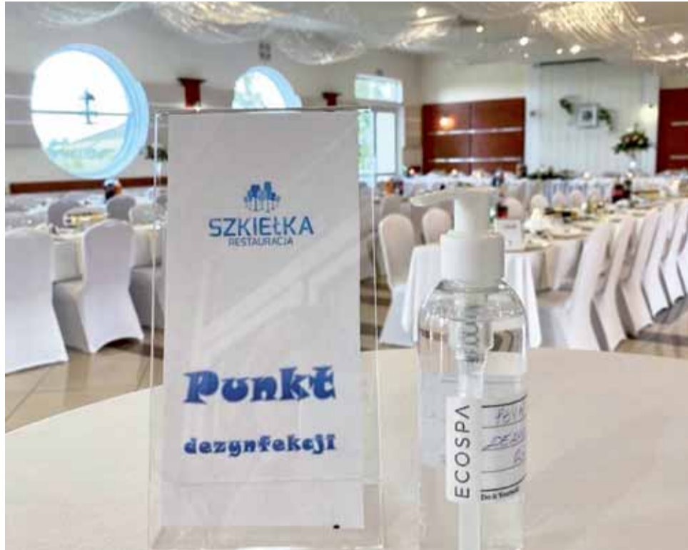
Sala weselna w „Szkiełkach” czeka na przybycie gości. Na pierwszym planie punkt dezynfekcji, na drugim stoły w rzędach.

– Nie wszyscy goście deklarują, że będą. Wiele osób jeszcze boi się epidemii i woli zostać w domu. Z tego względu czerwcowe wese-