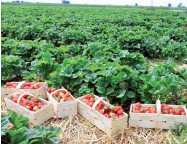
Truskawkowe pole Rafała Gawrońskiego z Karsznicy w gminie Chaśno ma powierzchnię 5 hektarów. Tegoroczne plony to 1/3 tego, czego rolnik się spodziewał.

Rafał Gawroński truskawki sprzedaje na rynkach hurtowych w Broniszach pod Warszawą lub na ul. Zjazdowej w Łodzi za około 18 zł za 2-kilogramową