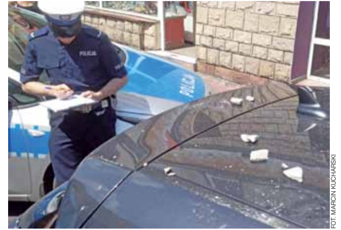
Właścicielka samochodu wezwała na miejsce policję, by mieć potwierdzenie tego, że doszło do takiego zdarzenia.