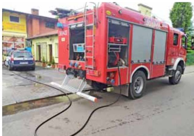
Strażacy z OSP Bolimów po dojechaniu na miejsce zastali patrol policji, który przy użyciu gaśnic zmniejszył zagrożenie.

– Podczas ćwiczeń na zbiorniku wodnym dostajemy dyspozycję ze Stanowiska Kierowania Komendanta Miejskiego w Skierniewicach: [...] Bolimów 22 udaj się ulica Farna – pożar radiowozu policyjnego... – relacjonowali strażacy z Ochotniczej Straży Po-