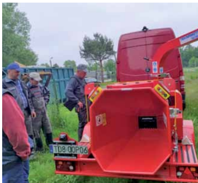
Rębak do gałęzi pozwoli sprawniej pracować i usuwać z poboczy wycinane przez krzewy.

Kolejna takie boisko, ale już wyłącznie na gruntach prywatnych istnieje w Wejściach. Niestety jego przyszłość już jest przesądzona, ponieważ spadkobiercy właściciela, który za życia wyraził zgodę na założenie boiska i podpisał z gminą umowę dzierżawy nie są zainteresowani kontynuacją umowy ani sprzedażem gruntu pod boiskiem. Umowa dzierżawy obowiązuje tylko do sierpnia 2021. mwk