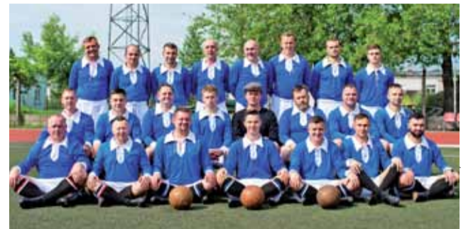
Łowicka drużyna 10 Pułku Piechoty na ten sezon wygląda bardzo groźnie.

Sparingi MUKS Pelikan-2009: ■ 2020.06.20 (sobota): MUKS Pelikan-2009 Łowicz – MKS Orkan Sochaczew ■ 2020.06.26 (piątek): MUKS Pelikan-2009 Łowicz – GLKS Zawisza Rzgów ■ 2020.07.12 (niedziela): MUKS Pelikan-2009 Łowicz – MKS Błękitni Gąbin.