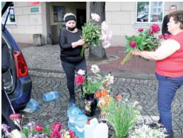
Panie ze Świerzyża II w czasie rozpakowywania bagażnika samochodu z kwiatami, które chwilę później stanęły na przygotowywanym przez tę miejscowość ołtarzu.