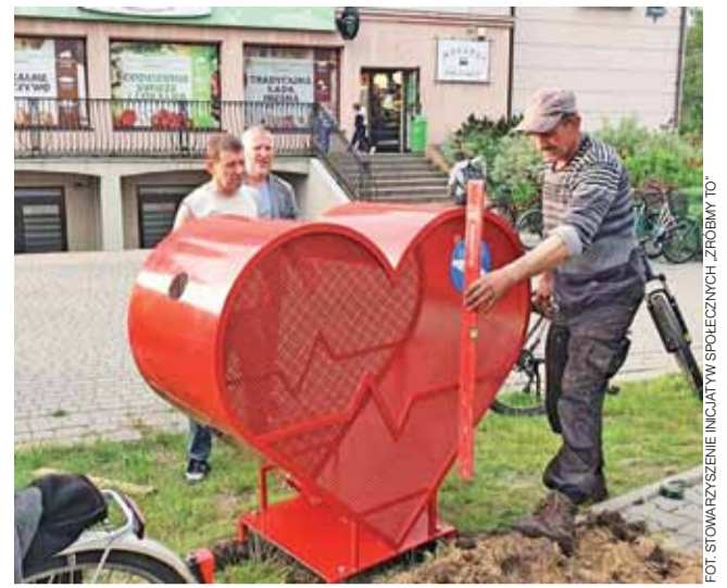
Moment ustawienia serca na nakrętki na bolimowskim rynku.