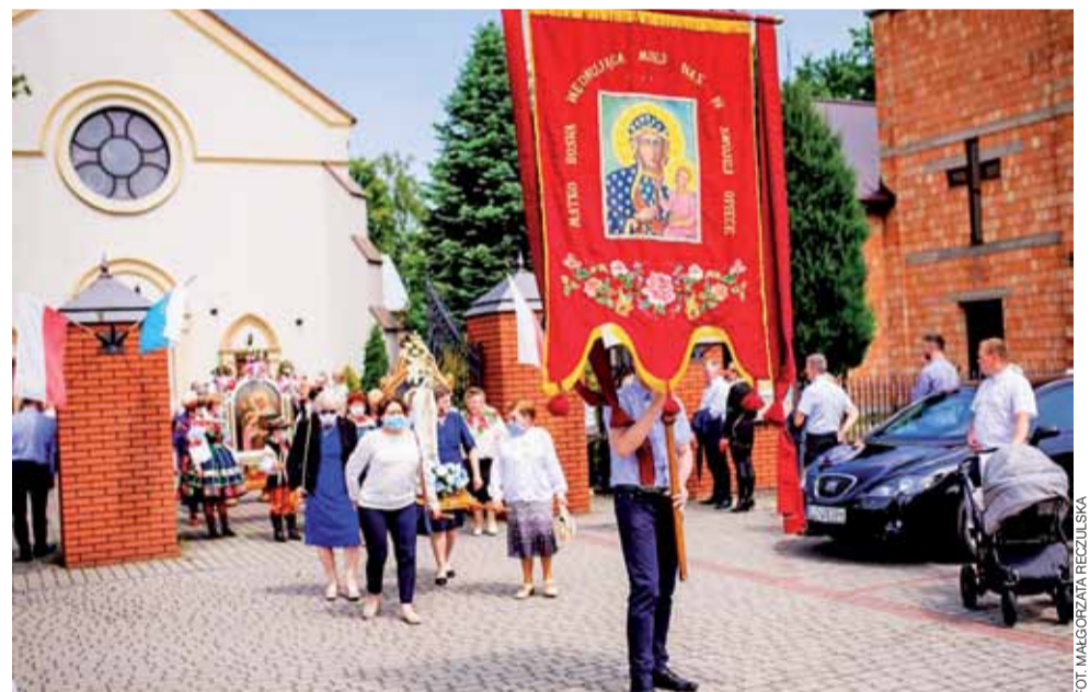
Łowicka procesja Bożego Ciała jest największa i najbardziej znana, ale również inne okoliczne parafie mają się czym pochwalić. Na zdjęciu udostępnionym nam przez Małgorzatę Reczulską – procesja wychodzi z kościoła św. Kazimierza Królewicza w Łyszkowicach, czyli dawnej letniej rezydencji prymasów. W przeszłości w erygowanej w 1928 roku parafii na uroczystościach religijnych bywali nawet arcybiskupi. Tym razem, z wiadomych względów, procesja była nieco mniej liczna niż zwykle, a większość uczestników zakryła twarze maseczkami. tm