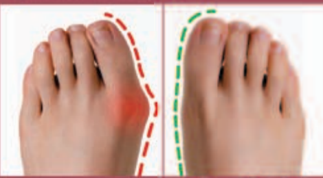
Efekty stosowania kuracji po 28 dniach

Po lewej stronie fotografia stopy dotkniętej tzw. koślawym paluchem. Po prawej zdjęcie tej samej stopy po 28 dniach korekcji szwajcarskim aparatem korekcyjnym prof. Rabiota.