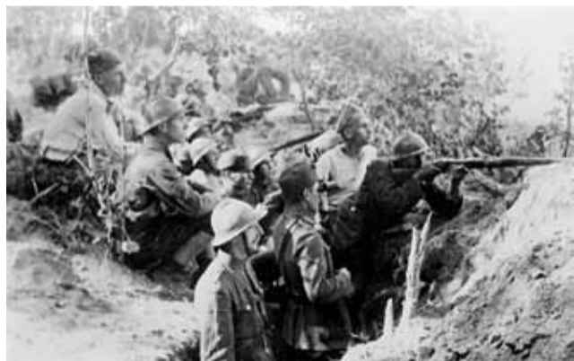
Auta (Białoruś), czerwiec 1920. Żołnierze 5 kompanii 28 pułku Strzelców Kaniowskich.

Cykl przygotowany przez Ośrodek KARTA na zlecenie Biura Programu „Niepodległa” w ramach obchodów setnej rocznicy odzyskania przez Polskę niepodległości i odbudowy polskiej państwowości. Dowiedz się więcej: www.niepodlegla.gov.pl , www.karta.org.pl