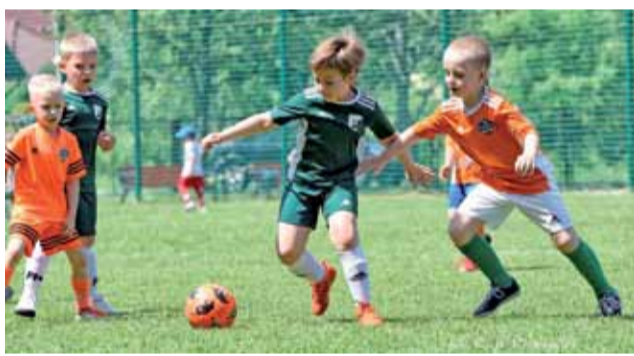
Soccer Kids 2014 podczas sparingu.

– Wrócili do wcześniejszego harmonogramu zajęć. Każdy z trenerów odrabia również zajęcia z marca. Zdecydowana większość zawodników wróciła już do treningów, pojedyncze osoby jeszcze się na to nie zdecydowały, ale jesteśmy zadowoleni z frekwencji na treningach – ocenił koordy-