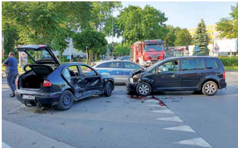
Kierowca Volkswagena Tourana uderzył w bok Seata Leona.

Po zbadaniu okazało się, że nikt z uczestników kolizji nie musiał być hospitalizowany, niegroźnych obrażeń ciała doznała pasażerka Volkswagena. Kierowcy byli trzeźwi. Sprawca kolizji został ukarany mandatem karnym. mak