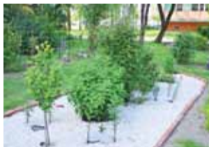
Drzewka i krzewy na naturalnym nawozie wciąż rosną, a ogródek jest dzięki temu coraz piękniejszy.

To całkiem spory i bogaty, nie tylko w roślinność, ogródek, głównie przy bloku nr 32 na osiedlu Bratkowice, w pobliżu bloków 28 i 31. W 2018 roku zdobył on pierwszą nagrodę w kategorii ogródków przy budynkach wielorodzinnych w konkursie „Zielone miasto”, zgłosiła go wtedy pani