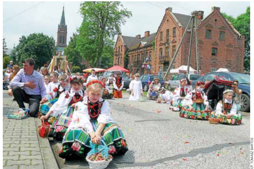
Po procesji Bożego Ciała w Złakowie Kościelnym nie było widać szczególnych ograniczeń związanych z koronawirusem, poza tym, że większość uczestników miała zasłonięte twarze i było ich wyraźnie mniej. Procesja przeszła tradycyjnym szlakiem, który zgodnie z tradycją został wyłożony przez parafian tatarakiem, były też bielanki i dziewczynki w ludowych strojach, syjące płatkami kwiatów. Dziewczęta i mężczyźni niosący chorągwie i feretrony (przenośna figura lub obraz w zdobionych ramach) szli w ludowych strojach, co jest co roku atrakcją przyciągającą turystów z okolicznych miast. Tych w tym roku było mniej, ale jednak byli. tb