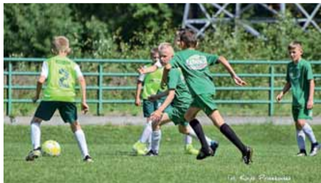
Pelikan-2009 Łowicz zagrał pierwszy sparing po przerwie.

Ten ostatni jest o rok młodszy od kolegów i reprezentuje barwy UKS Soccer Kids Łowicz, lecz dzięki współpracy obu klubów został zaproszony do gry w barwach „biało-zielonych” i wypadł dobrze