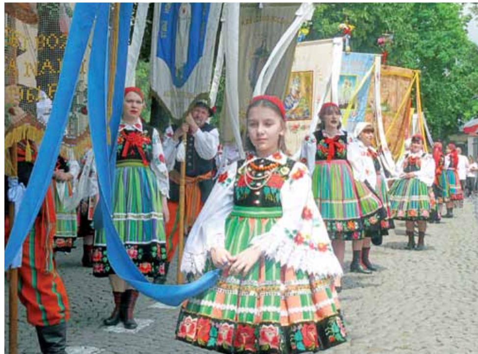
Przy chorągwiach, jak co roku, pięknie prezentowały się w strojach ludowych Księżta zarówno dziewczęta, jak i dojrzałe panie.