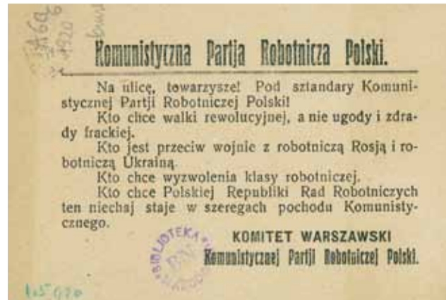
Ulotka Komunistycznej Partii Robotniczej Polski.

Zaczynamy się cofać, lecz to już za późno na regularny odwrót. Drogę mamy odciętą. Skręcamy w bok, w prawo, a tu zielona łąka. Na skraju łąki mamy pod sobą jeszcze dość silny grunt, choć już cośkolwiek miękki. Idziemy dalej – a to bagna! Konie grzęzną – błoto sięga im po brzuchy, a żołnierze wpadają po pas. [...] Cofać nie możemy się, bo bolszewicy już na skraju łąki, już strzelają do nas jak do kaczek, topiących się w błocie. Zabijamy więc konie wystrzałem z rewolweru. Na co mają się dłużej męczyć? Dla nich ratunku już nie ma. [...] Wszyscy wpadamy po pas w błoto. Kto mniejszy wzrostem, a grubszy, wpada po szyję w bagno i topi się. Śmierć z dwóch stron zagląda nam w oczy. [...] Nikt nikogo ratować nie może, przeciwnie – jeden drugiego