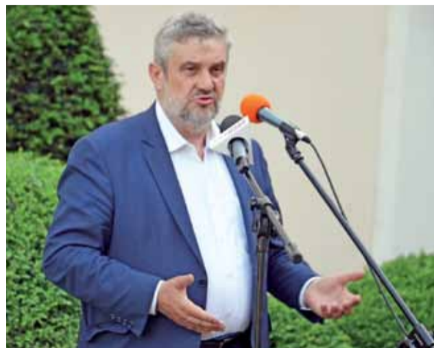
Minister Jan Krzysztof Ardanowski na dziedzińcu łowickiego Muzeum.

Mówił też o tym, że obecny prezydent nie jest „wykonawcą