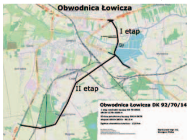
Planowany przebieg przyszłej szosy. Mieszkańcy Zatorza walczyli o to, co jest opisane jako etap I.

Niestety, komitet wciąż nie uzyskał informacji, czy uwagi do inwestycji, które zgłosił też z miastem