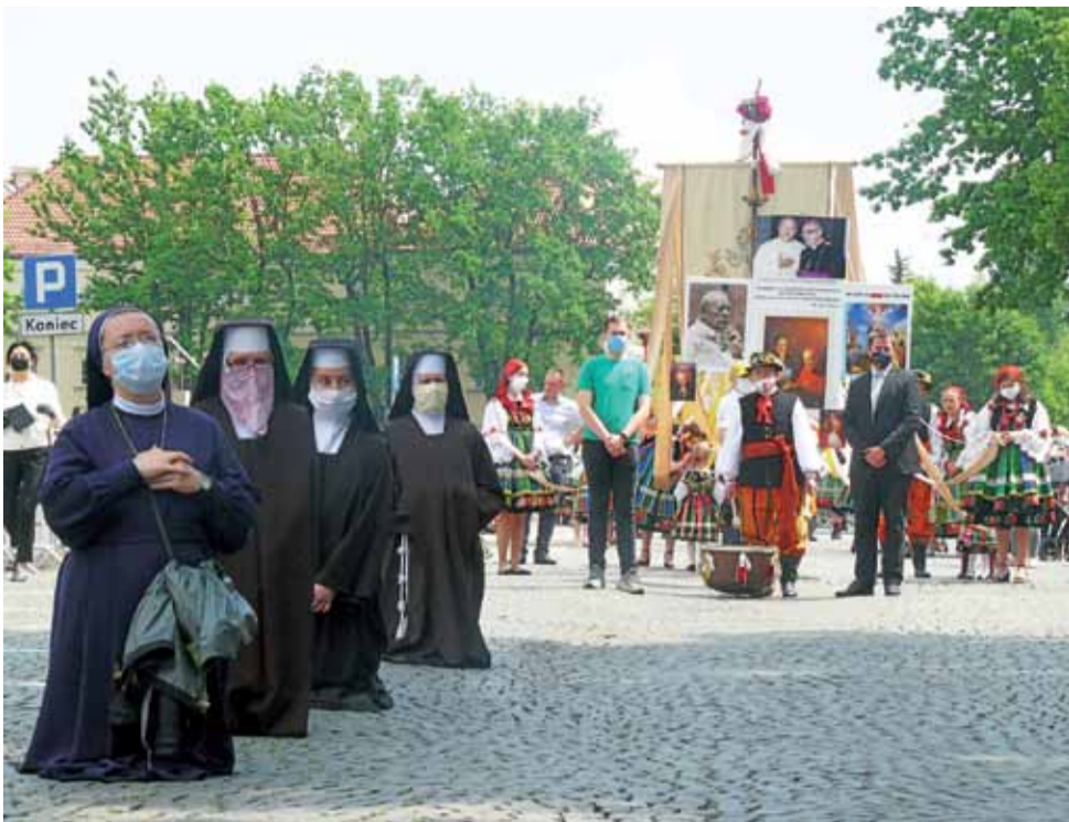
Na pierwszym planie siostry zakonne, m.in. łowickie bernardynki z zakrytymi twarzami, przed pierwszym ołtarzem przygotowanym przez pijarów.

do niej dopiero, gdy ta obok nich przeszła.