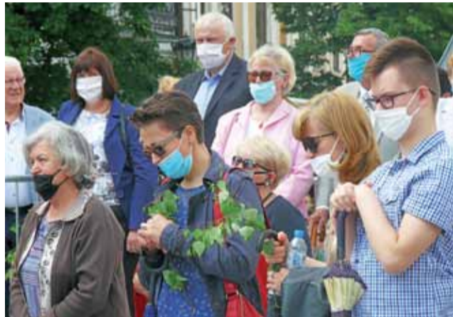
Choć w mediach ogólnopolskich pisano, że w czasie procesji w Łowiczu wiele osób nie przestrzegało nakazu zasłonięcia twarzy, to jednak osób stosujących się do niego było dużo więcej.

Trzeba przyznać, że część z nich była głucha na prośby du-