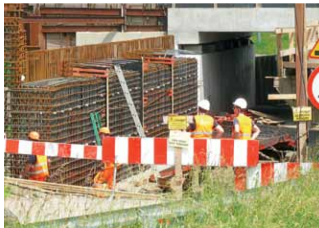
Widok na zbrojenie przyczółka wiaduktu od strony dworca kolejowego Łowicz Główny.

wania do wykonania płyt nośnych, na których ułożone docelowo zostaną torowiska. Na placu budowy zgromadzono już część elementów konstrukcyjnych, w tym stalowe tregry. Mimo widocznego postępu prac, nie należy spodziewać się, aby zakończyły się one prędko. Termin, który ostatnio pojawia się w rozmowach firmy Trakcja z ratuszem, to sierpień, niemniej bezpieczniej w tym przypadku mówić o wrześniu tego roku. I to pod warunkiem, że na budowie nie dojdzie do przestoju spowodowanego przez czynniki atmosferyczne czy obostrzenia związane z koronawirusem. Przypomnijmy, że w ubiegłym roku mówiło się o zamknięciu robót na wiadukcie w marcu 2020 roku.