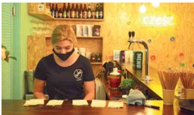
Barek w Nowej Pracowni pozostał w dotychczasowym miejscu.

– Odzew jest dobry, mamy pierwsze opinie ludzi zadowolonych z tego, że powstało takie miejsce. Mieliśmy wizję restauracji i klubokawiarni, w której będzie kładziony akcent na wydarzenia kulturalne i będzie tu przestrzeń dla wszystkich, którzy chcą przyjść, porozmawiać – chcemy zaspokajać potrzebę takich spotkań. mwk