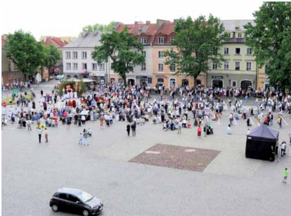
Stary Rynek w czasie procesji, która zatrzymała się przy drugim ołtarzu – widać, jak mało było jej uczestników i turystów – 1/4 tego, co w ubiegłych latach.