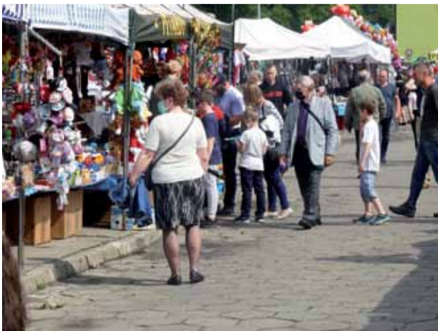
Bobiki w tym roku stanęły na miejskim targowisku. Z powodu pandemii handlujących było mniej niż w latach minionych, to jednak nie zniechęciło wielu osób do ich odwiedzenia jeszcze przed procesją.