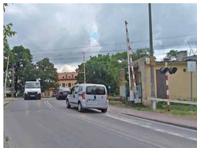
Ten przejazd nie będzie czynny przez tydzień.

W rozmowie z nami powiedział, że jest pogodzony z decyzją komisji i nie zamierza się od niej odwoływać. tm