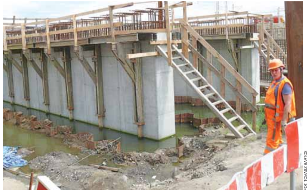
Na zdjęciu widoczne zalane już dwie wewnętrzne podpory wiaduktu, pomiędzy którymi płynie rzeka Zwierzyniec.