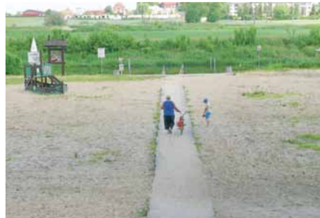
Plaża czeka na lepsze czasy, dziś prezentuje smutny widok.

wiedział nam, że trwają przygotowania do jej nowego zagospodarowania. Teren od strony zachodniej i wschodniej ma zostać ogrodzony lekką konstrukcją, a wzdłuż rzeki na wysokości plaży urządzona droga, po której będą jeździć np. ciągniki zwożące skoszoną trawę. – Liczymy, że do końca czerwca dostaniemy w tej sprawie decyzję z Wód Polskich. Bez wykonania tych zabezpieczeń trudno podejmować jakiegokolwiek działania na plaży. Dziś widać, że jeżdżące tam pojazdy zniszczyły pomost prowadzący z wału do rzeki. Chcemy uniknąć tak zniszczeń. Gdy tyl-