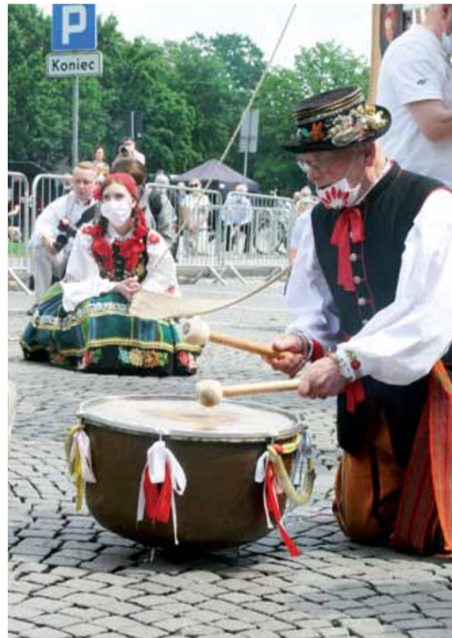
Tradycyjnie w czasie procesji Bożego Ciała nie zabrakło dźwięku bębna.