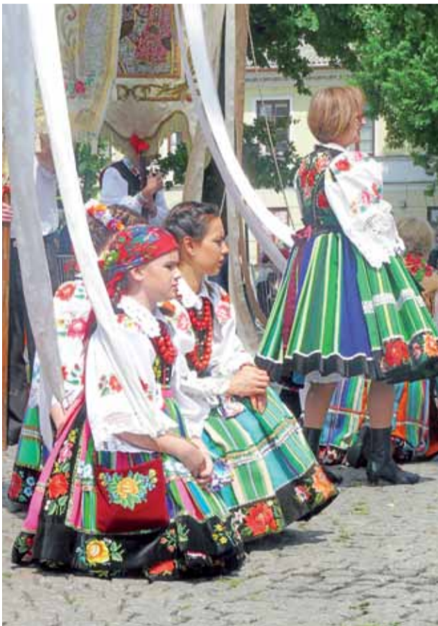
Procesja ustawiła się przed kościołem jeszcze przed zakończeniem mszy świętej w katedrze.

Kobiety przyjechały nieco później, bo, jak przyznały, po nocnych opadach deszczu zrywały mokre kwiaty. Śmiejąc się pokazały na mokre buty i spodnie.