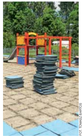
Płyty z tworzywa były w fatalnym stanie.

W planie przewidziane są pomieszczenia na gabinety: internistyczny, pediatrii, specjalistyczne, rehabilitacyjne, a także aptekę. tm