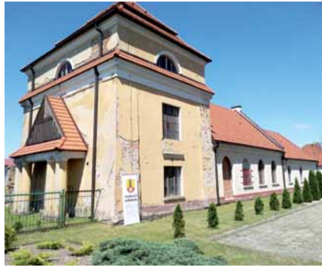
Zabytkowy budynek spichlerza na Blichu.

Z naszego terenu: Łowickiego Ośrodka Kultury, który dotyczył renowacji elewacji frontowej. Były też dwa wnioski Urzędu Miejskiego w Łowiczu – jeden na wymianę pokrycia dachowego, drugi na wymianę stolarki oraz wzmocnienie tylnej ściany w ka-