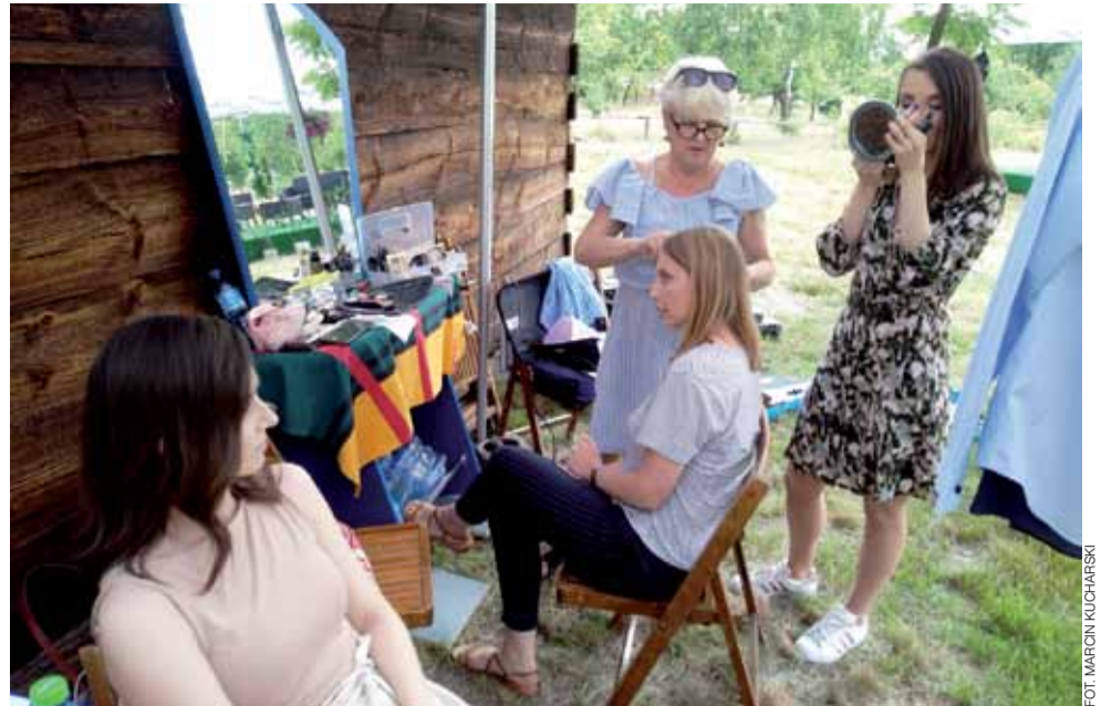
Makijaż można było poprawić w garderobie na świeżym powietrzu.

Maurzyce | Audycja śniadaniowa „Budzi się ludzie”