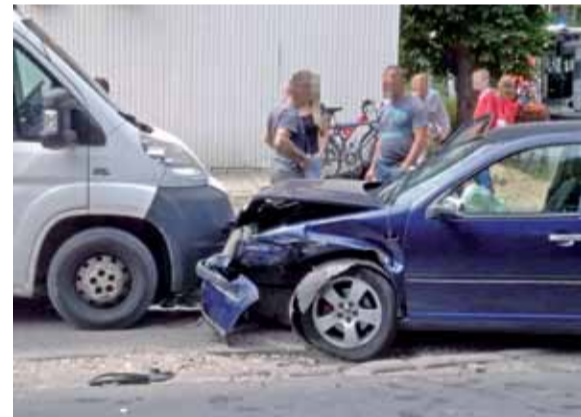
Volkswagen Bora, który uczestniczył w kolizji na ul. Armii Krajowej został poważnie uszkodzony.

W Dzierzgowie w gminie około godz. 12.20 doszło do poważnie wyglądające-