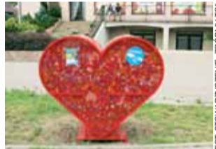
Serce stojące na bolimowskim rynku po raz drugi się wypełniło.