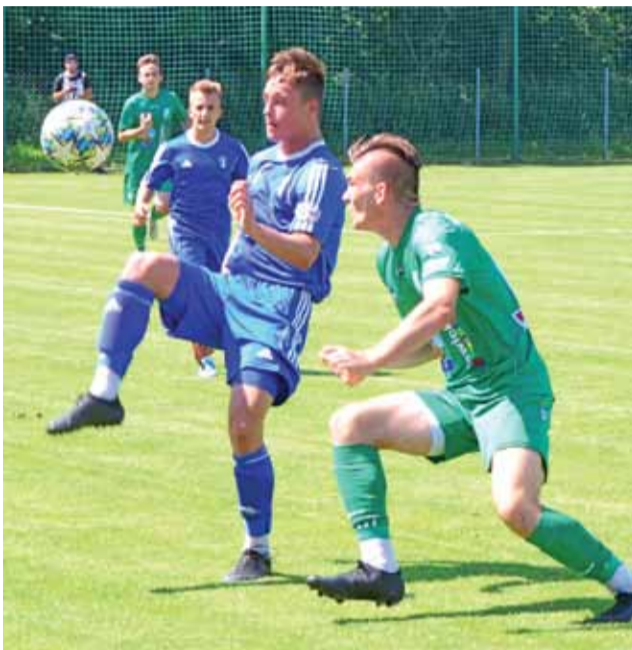
Pelikan w pierwszym sparingu tego lata okazał się lepszy od IV-ligowej Wisły II Płock. Kibice zobaczyli aż siedem bramek.