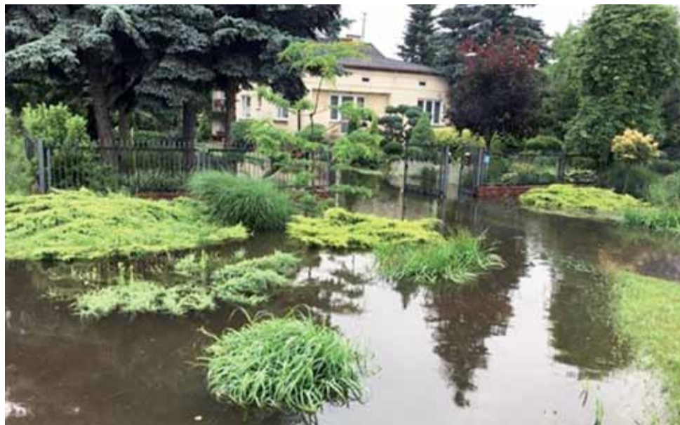
Zalane Bobrowniki po nocnej ulewie, 24 czerwca 2020 r.