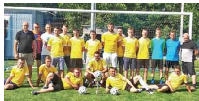
Dar Placencja okazał się najlepszy w Pucharze Wójta Gminy Łowicz.

Rodzice, którzy myślą o zapisaniu dzieci na zajęcia już mogą planować czas. Księżak planuje organizację treningów w grupach: przedszkolaki, klasy 1-3, klasy 4 dziewczynki (rocznik 2010), klasy 4 chłopcy (rocznik 2010), dziewczynki U14 (2008) i U15 (2007), chłopcy U14 (2007 i młodsi), chłopcy U17 (2004 i młodsi). Dodatkowo będą treningi indywidualne i motoryczne dla wszystkich chętnych zawodników. zł