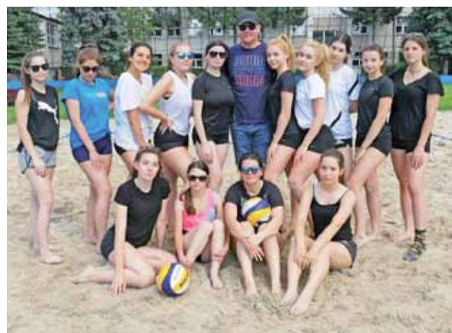
Siatkarki z „Chełmońskiego” aktywnie spędziły czas na „plaży”.

– Przy pięknej pogodzie siedem par rywalizowało w systemie „każdy z każdym”, łącznie rozegrano 21 meczów. Większość