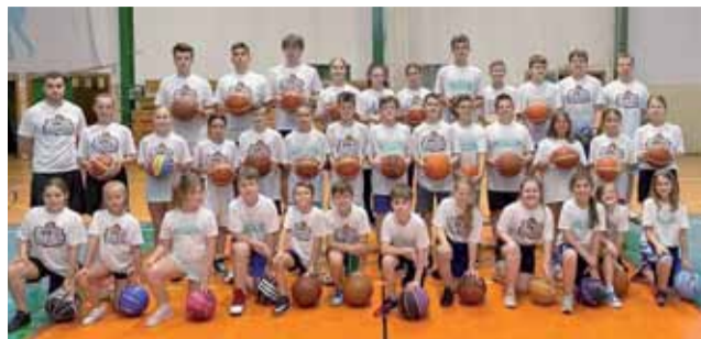
Koszykarska ekipa Księżaka na Summer Camp 2020.