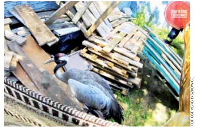
Nietypowa interwencja w Łyszkowicach.

Dotację otrzymają również OSP Przemysłów w gminie Chąśno (73.794 zł – w tym przypadku jest to połowa szacowanych kosztów) oraz OSP Osiny w gminie Kiernozia (72 tys. zł – to będzie 45% kosztów). mwk