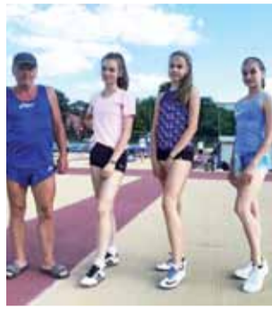
W Łodzi nasze lekkoatletki nie miały za wielu rywali.

Mało chętnych było do sprawdzenia formy w konkurencji pchnięcia kulą w kategorii wiekowej U18 3 kg i już przed startem wiadomo było, że konkurs wygra zawodniczka Błyskawicy, ponieważ wystartowały w nim jedynie dwie podopieczne trenera Szy-