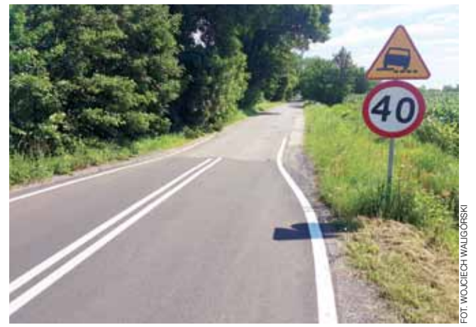
Miejsce, gdzie w ubiegłym roku zakończyły się prace modernizacyjne na drodze do Miedniewic. Widoczna jest różnica w szerokości obu odcinków.

Jeszcze gorszy jest on na terenie powiatu żyrardowskiego. Droga nie tylko jest wąska, ale spekana, dziurawa i mocno połatana, zwłaszcza na odcinku pomiędzy granicą powiatów a Miedniewicami (ok. 2 km). Jak się jednak okazuje, powiat żyrardowski myśli o modernizacji właśnie tego