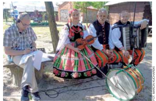
Muzyczny trzon Kszinżoków w oczekiwaniu na występ w Maurzycach.

że ty nas fotografujesz, ja cię za-uwazam i zapraszam do nas na scenę. Wchodzisz tędy, uważaj na kable, a o czym porozmawiamy, to zobaczysz – usłyszał na 2-3 minuty przed wejściem na antenę nasz reporter. Kilka minut wcześniej został natomiast zaproszony do zaaranżowanej w cieniu za zabytkową kuźnią garderoby. Tam