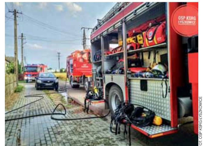
Strażacy weszli do pomieszczeń w aparatach ochrony górnych dróg oddechowych.

W tym czasie dwóch innych strażaków ubranych w aparaty ochrony dróg oddechowych z pomocą „szybkiego natarcia” przeszło do garażu wejściem od środka mieszkania i rozpoczęło gaszenie. – Początkowo nasze działania skupiły się na opanowaniu płomieni,