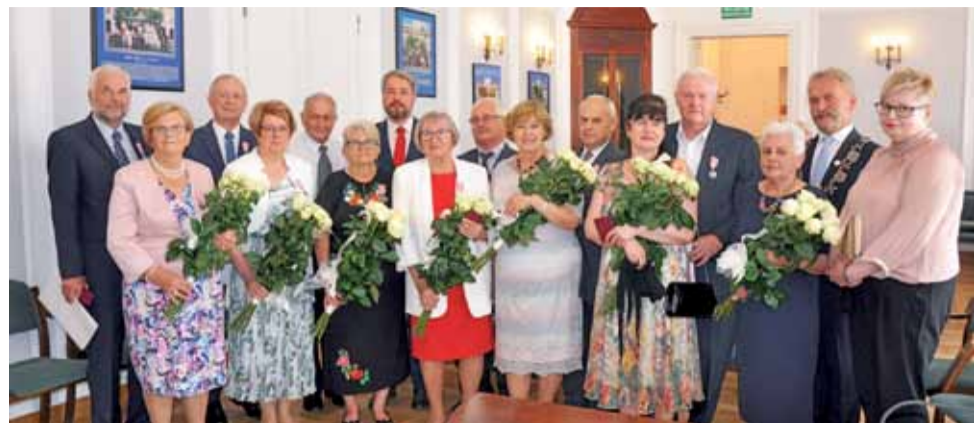
Pamiątkowe zdjęcie z uroczystości w ratuszu.

Od kilkunastu lat są na emeryturach, czas wolny często spędzają