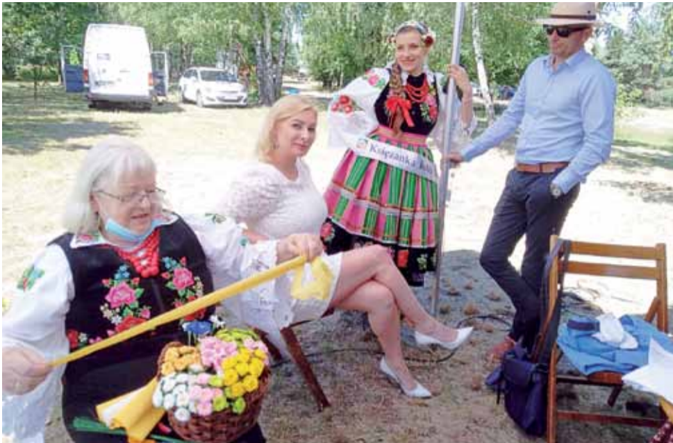
Międzypokoleniowe spotkanie w miejscu, gdzie poprawiany był makijaż.