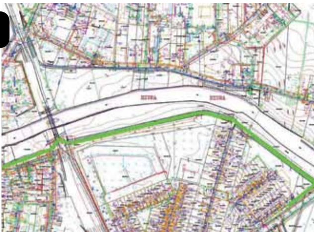
Planowany przebieg ścieżki rowerowej po wale przeciwpowodziowym nad Bzurą pomiędzy Zatorzem a Starym Miastem.

bowiem jest znaczny, wstępne szacunki mówią o 700 tys. zł. Sam Wiśniewski deklaruje, że będzie aktywnie brał udział w poszukiwaniu źródła dofinansowania. Uważa on także, że w przyszłości uzupełnieniem tej ścieżki winno być połączenie z ciągami komunikacyjnymi w parku Błonie, pod mostem w ul. Mostowej. Ścieżka ma przebiegać po wale przeciwpowodziowym od ul. Mostowej, zagospodarowanym przejazdem pod mostem kolejowym, do ul. Wyzwolenia – równoległej do ul. Warszawskiej. Rowerzyści będą mogli dojechać ulicą Wyzwolenia na ścież-