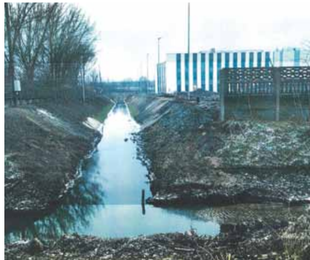
Kanał Kostka, zdjęcie ze stycznia 2019 roku.