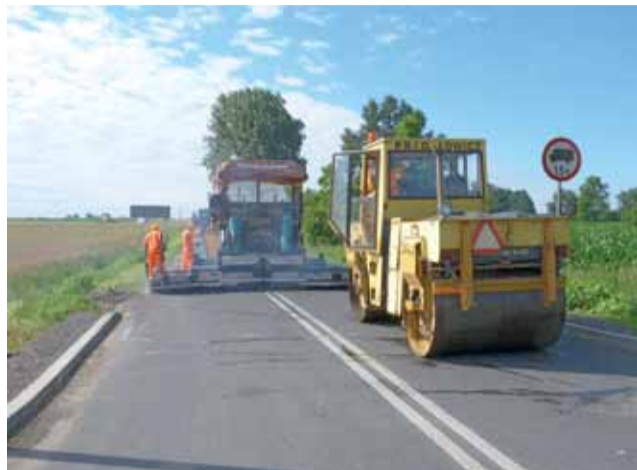
PRID rozpoczął w tym tygodniu asfaltowanie drogi Krępa – Chruślin, zamknięty jest odcinek pomiędzy Chruślinem a Lisiewiczami.

W poniedziałek 6 lipca około godz. 9 rano maszyny PRID widać było w Chruślinie, już przy pracy, bo od tej miejscowości rozpoczęto kładzenie warstwy wyrównawczej asfaltu, począwszy od drogi wojewódzkiej 703 w kierunku