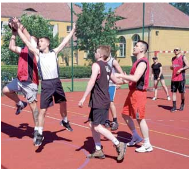
Najbardziej zacięta walka była w kategorii Open.