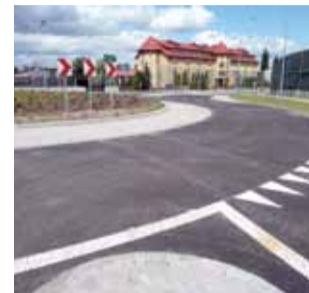
Rondo na Warszawskiej jest prawie gotowe.