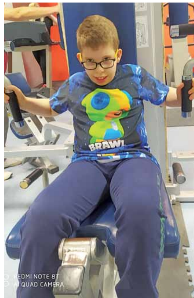
Podczas zajęć rehabilitacyjnych w ramach jednego z turnusów.