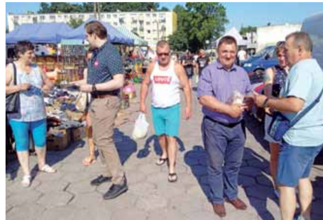
Wojewodę łódzkiego Tobiasza Bocheńskiego zastaliśmy na targowisku w Łowiczu z radnym sejmiku Waldemarem Wojciechowskim.

Reakcje osób na targowisku, którym proponowano ulotki, były raczej stonowane. Zdarzało się, że niektórzy mówili wprost, że „to nie mój kandydat” i po prostu nie brali ulotek. W chwili, gdy fotografowaliśmy i filmowaliśmy