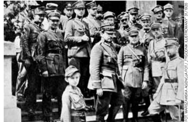
Warszawa, lipiec 1920. Generalny Inspektor Armii Ochotniczej, generał Józef Haller, w otoczeniu oficerów swego sztabu.