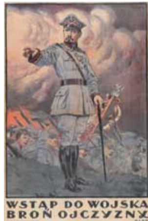
Plakat z 1920 roku autorstwa Stanisława Sawiczewskiego.

Wczoraj był straszny dzień. [...] Wszystko uciekało w zupełnym pomieszaniu. Piechurzy w hełmach różnych kształtów i barw pędzili z karabinami maszynowymi oraz z aparatami i centralami telefonicznymi. Mijały ich