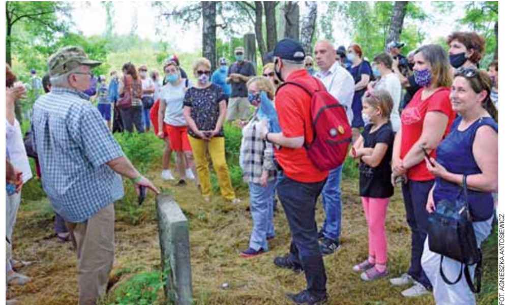
Spacer po cmentarzu żydowskim w Łowiczu cieszył się ponownie dużym zainteresowaniem.

Przewodnik przybliżył uczestnikom spaceru specyfikę nekropolii przy ul. Łęczyckiej i symbolikę motywów na macewach, czyli kamiennych tablicach nagrobnych. Na cmentarzu zachowanych zostało kilkaset macew, najstarsza z nich pochodzi z 1831 roku. Już