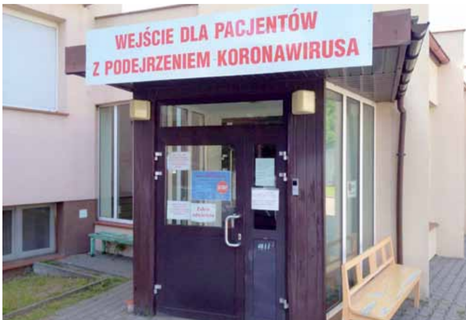
W łowickim szpitalu wydzielone są wejścia dla pacjentów z „normalnymi” chorobami oraz z podejrzeniem koronawirusa.

– Będziemy musieli przywyknąć do tego, że do takich zdarzeń będzie czasami dochodziło. Nie-