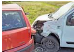
Samochody zostały poważnie uszkodzone.

Policjanci ustalili, że samochody jechały w przeciwnych kierun-