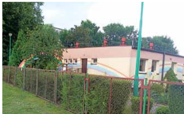
Mieszkańcy osiedla Starzyńskiego nie chcą, aby Przedszkole nr 2 zostało przeniesione do budynku po gimnazjum – a także plany ma Rada Miejska. W budynku przedszkola chce ulokować żłobek.

Jedna z mam popierających akcję powiedziała nam, że decyzja przeniesienia przedszkola na I piętro budynku po gimnazjum