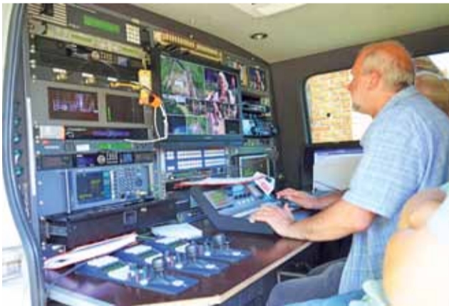
Program był na żywo montowany w samochodowym studio, które zaparkowało w taki sposób, by nie wchodziło kamerzystom w kadr.