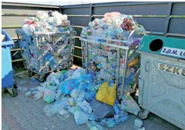
Kontener na osiedlu Bratkowice przy bl. 32 i zalegające pod nim plastikowe opakowania.

Oprócz tego zaznaczył, że w związku z upałami wzrosła ilość odpadów plastikowych, przede wszystkim butelek po wo-