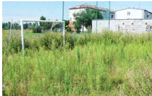
Były czasy, gdy taki widok byłby niemożliwy. I nie chodzi tu o brak zainteresowania boiskiem ratusza czy ZGM...

Boisko powstało kilka lat temu, w miejscu dzikiego placu do gry, który na ten cel zagospodarowała sama młodzież. Obecnie boisko