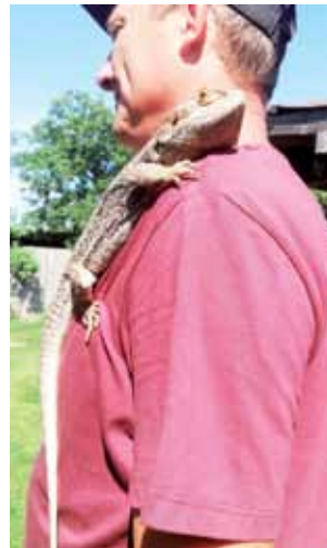
Pan Sylwester powitał naszą reporterkę z Napoleonem na ramieniu.