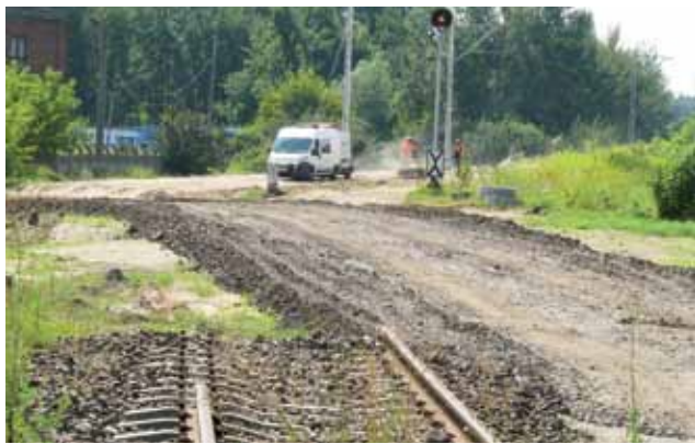
Widoczne rozebrane tory w kierunku do Łodzi, a po ich prawej stronie tymczasowa droga na czas planowanych robót.

Prace w obrębie przejazdu będą obejmować nie tylko kwestie konstrukcyjne tego obiektu.