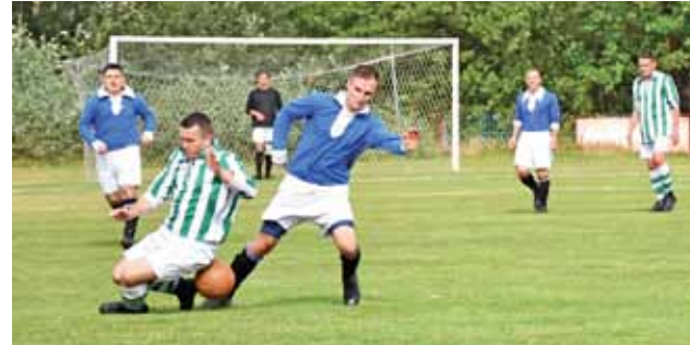
Mecz był bardzo wyrównany, ale minimalnie przegrany.

Po przerwie to Lechici przejęli kontrolę nad meczem i z każdą minutą atakowali coraz groźniej. Ataki przyniosły efekt w 88. minucie gry. Po strzale Pawła Sibika