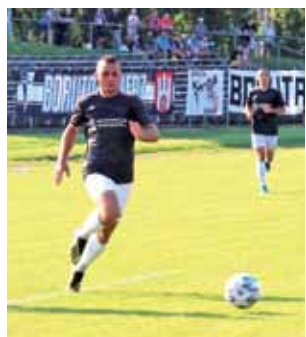
Rozgrywany w wielkim upale mecz stał na niezłym poziomie.