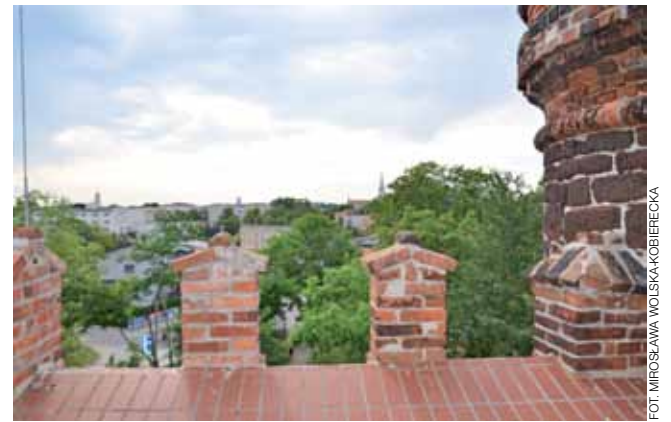
Z baszty gen. Klickiego nie zobaczymy takiej panoramy miasta, jak z wieży katedry, bo wysokość jest nieporównywalna. Warto jednak odwiedzić ten zabytek i z góry zobaczyć jego otoczenie.