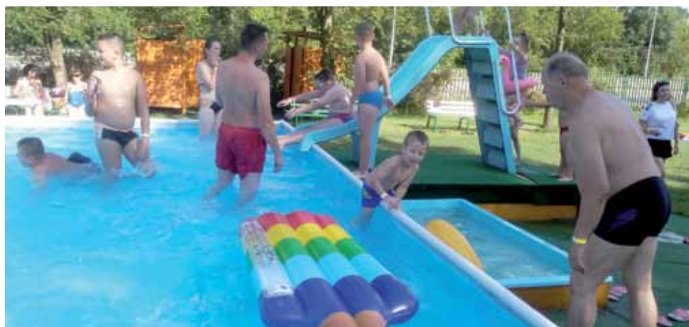
W upalne dni z odkrytych basenów korzysta mnóstwo osób.

Nad ich bezpieczeństwem czuwało dwóch ratowników. Jeden odpowiadał za basen o głębokości 60 cm, a drugi za basen o głębokości 1,20 m. „W użyciu” było też