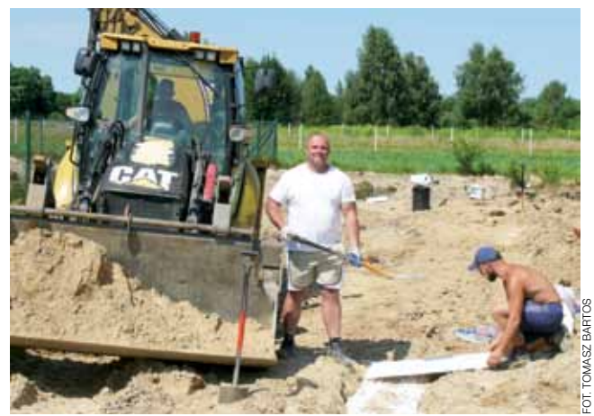
Pracownicy łowickiej firmy Cewogaz przy zasypywaniu drenażu na terenie SP w Bobrownikach.