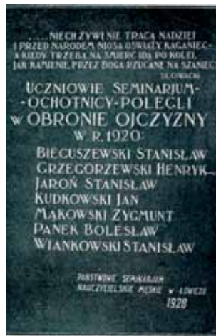
Tablica pamiątkowa poległych w 1920 roku uczniów Seminarium.