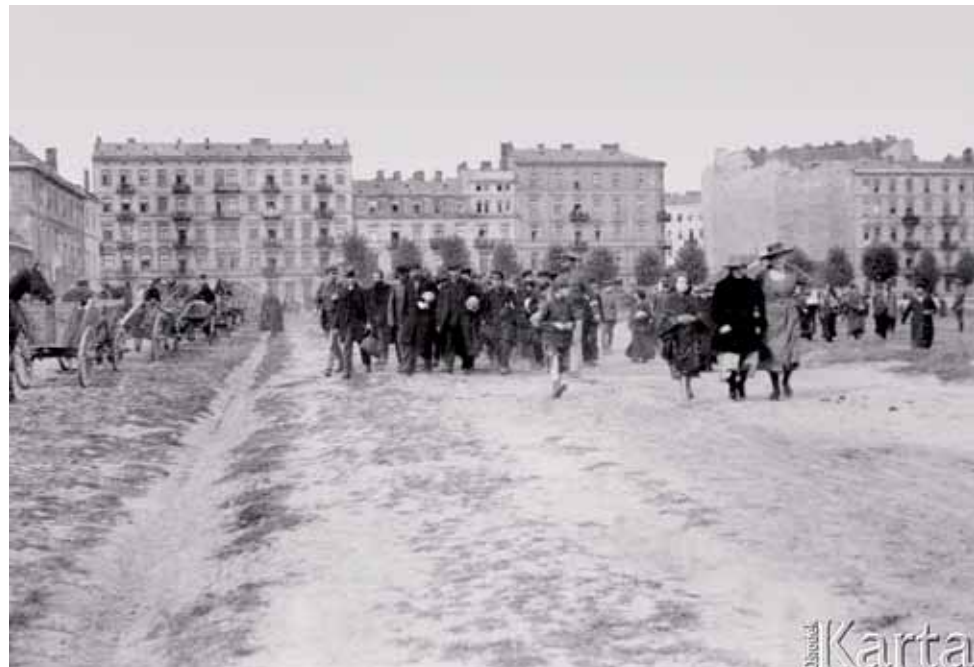
Warszawa, sierpień 1920. Wymarsz ludności cywilnej do budowy okopów.

W sekcji radio-łączności zawrzała robota i plan przygotowany przez pułkownika Jawora oka-