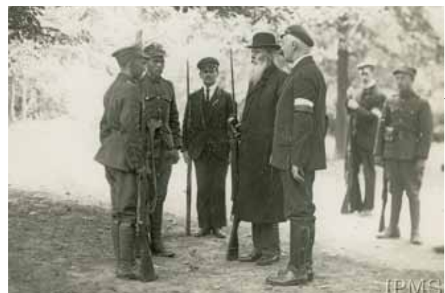
Warszawa, sierpień 1920. Szkolenie Straży Obywatelskiej w czasie bitwy warszawskiej.

13 sierpnia 1920 [Franciszek Latinik, Bój o Warszawę. Rola Wojskowego Gubernatora i I-szej armii w bitwie pod Warszawą w 1920 r., Bydgoszcz 1931]