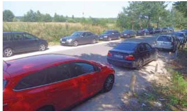
W sezonie, a szczególnie w weekendy, żeby zaparkować przy głównej drodze trzeba przyjechać do Guźni z samego rana.

I rzeczywiście, nie trzeba było długo czekać. Przed południem w niedzielę na drodze za laskiem i plażą pojawił się patrol policji i kilku kierowców zostało ukaranych mandatami za parkowanie na zakazie. Sęk w tym, że poprawnie i zgodnie z przepisami zapar-