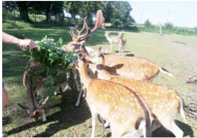
Karmienie danieli to jedna z atrakcji cieszących się największym zainteresowaniem w mini zoo.

A w tym miejscu zwierzęta są naprawdę różne – od domowych