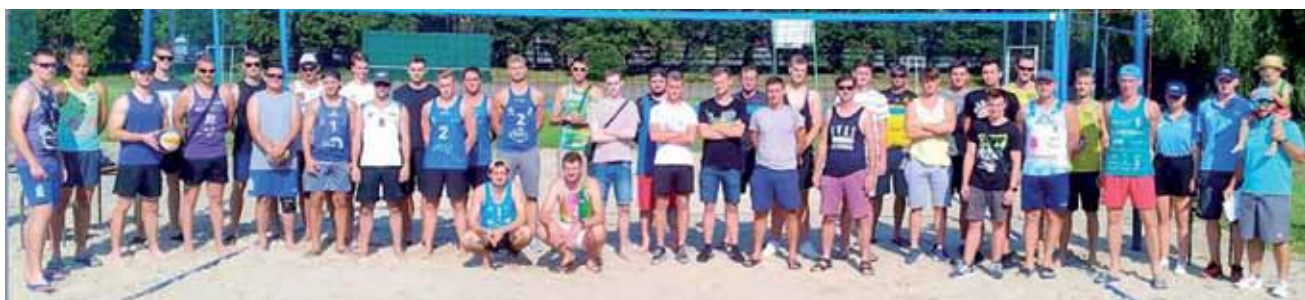
18 par zagrało na „plaży” przy I LO o tytuł mistrza Łowicza.

Siatkówka plażowa | XIX edycja Otwartych Mistrzostw Łowicza