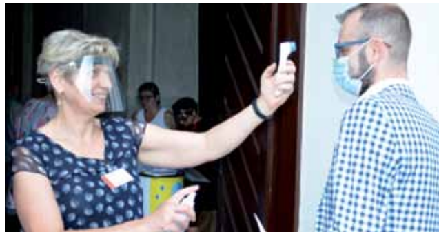
Przed wejściem do kościoła wszystkim zmierzona została temperatura.

Zanim jednak melomani weszli do kościoła, każdemu z nich sprawdzono temperaturę oraz przypomniano o konieczności założenia maseczki zakrywającej usta i twarz. Jeśli ktoś jej nie posiadał, otrzymał jednorazową maseczkę od organizatorów. Prowadzący poprosił też, żeby maseczek nie zdejmować do końca koncertu. Ponadto zarówno przed wejściem, jak i wychodząc z ko-