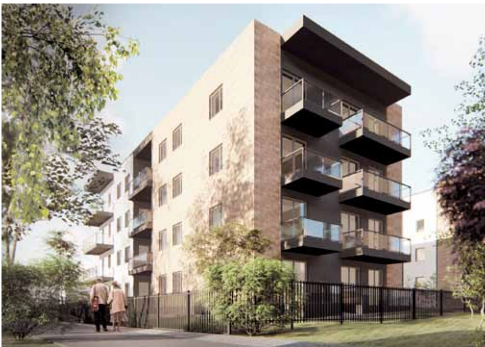
Tak ten budynek będzie wyglądał od strony ulicy Akademickiej.

Należy jednak pamiętać, że jeszcze nie wszędzie możemy z tego bonu skorzystać. Pełna lista miejsc uznających bon znajduje się na stronie www.pot.gov.pl