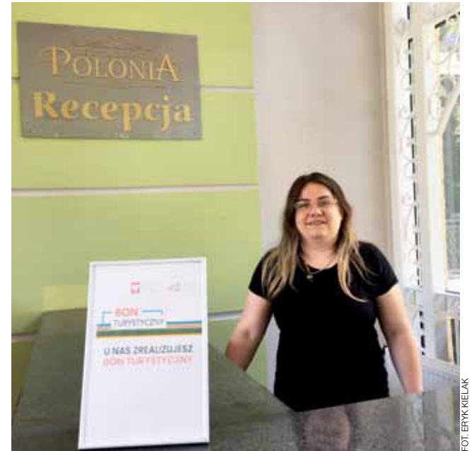
W restauracji „Polonia” już można skorzystać z bonu turystycznego.

Teraz kolejne ryzyka inwestycyjne będzie podejmował już w Łodzi. Choć w Łowiczu zostaną jego firmy: Budowa i ECO Resort. I dwaj synowie: Franciszek, też budowlaniec, który w tym roku rozpoczął swą samodzielną działalność deweloperską od budowy szeregu domków jednorodzinnych na Blichu i który w przyszłości będzie inwestował przy Podrzecznej – i Bolesław, który prowadzi hotel ECO w Piaskach pod Nieborowem. Więc nazwisko w Łowiczu pozostanie. ■