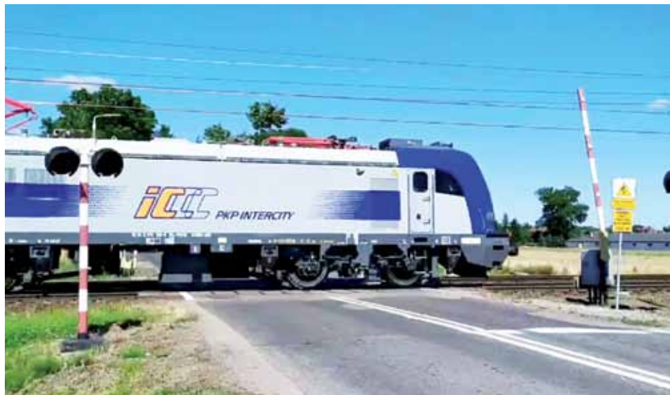
Na nagraniu zamieszczonym na facebooku „Łowicz 112” widzimy pociąg Intercity, który przejeżdża przez przejazd kolejowy w ul. Płockiej, mimo, że roгатki nie są opuszczone.