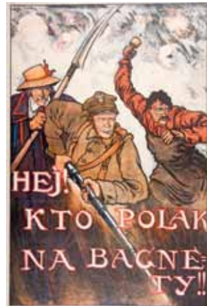
Plakat z 1920 roku autorstwa Kamila Mackiewicza.

zał się tak sprawny, że przez te dwie krytyczne doby cały front Tuchaczewskiego nie był w stanie nadać czy odebrać ani jednej depeszy radiowej. Nasz podstęp, znając na pamięć fale i sygnały wywoławcze wszystkich stacji bolszewickich, pozwałał im tylko wywoływać siebie nawzajem i nawiązywać łączność. Lecz z chwilą, gdy tylko rozpoczęli nadawanie depesz, nasze stacje nadawcze rozpoczęły zagłuszanie na tej samej fali [czytaniem fragmentów Biblii].