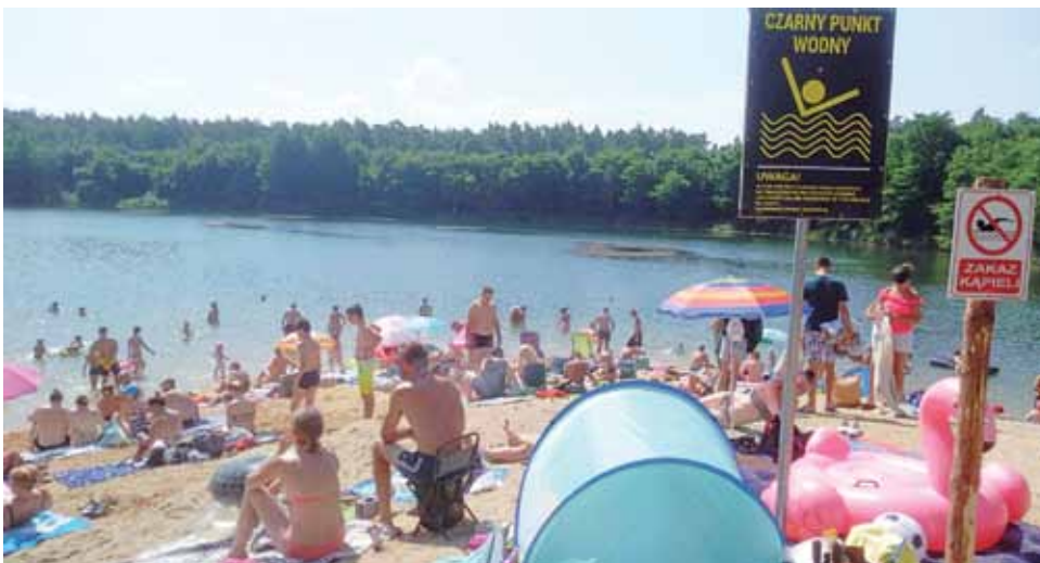
Czarny punkt oraz tabliczka o zakazie kąpeli nie zniechęciły części plażowiczów do wchodzenia do wody.

Co ciekawe Serhij nie kąpie się w zbiorniku w Guźni i nie pozwala też kąpać się dzieciom. – Prze-