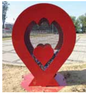
Pojemnik na nakrętki w parku Błonie.