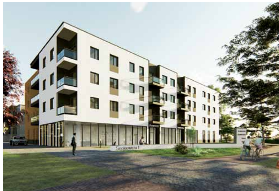
Ten budynek zacznie powstawać za kilka tygodni. Tak będzie wyglądał widziany od strony ronda na skrzyżowaniu Alei Sienkiewicza i ul. 11 Listopada.