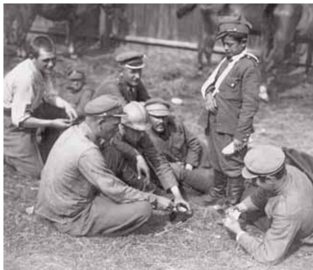
Okolice Warszawy, sierpień 1920. Odpoczynek na froncie.

Celem podniesienia na duchu ludności stolicy, władze duchowne wydały zarządzenie publicznych modłów we wszystkich kościołach. Ołbrzymie tłumy ludności chodziły z procesją i chorągiewkami przez dwa dni po ulicach Warszawy, śpiewając pieśni i prosząc Boga o zwycięstwo. Wyszędłem do miasta, żeby się przyjrzeć tym dziesiątkom tysięcy ludzi różnego stanu, wieku i zawodu, które spacerowały całymi dniami [...], ale ani rusz nie dały się użyć do prac koniecznych dla obrony tak ciężko zagrożonej stolicy [...]. Zaprosiłem do siebie ministra spraw wewnętrznych, [Leopolda] Skulskiego, by nie dopuścił, żeby tylu zdrowych ludzi łążyło po mieście bezmyślnie w obliczu największego zagrożenia państwa [...]. Minister [...] jednak musi się liczyć z nastrojami ludności, jak i znaczącej części duchowieństwa. [Wincenty Witos, Moje wspomnienia, Paryż 1975]