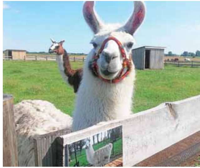
Melman, alpako-lama i jego towarzysza Gloria witają odwiedzających uśmiechem.

Jak powiedział nam pan Sylwester, przejażdżka na kucyku cieszy się wśród dzieci największą popularnością. Ale w „Pawim oczku” nie tylko dzieci mogą się dobrze bawić – dla dorosłych to też może być dobre miejsce na spędzenie wolnego dnia. Gospodarstwo otwarte jest w soboty i niedziele od 10.00 do 18.00, warto więc zarezerwować sobie choć kilka godzin i wybrać się do Łasiecznik – z pewnością uroczym lamy, danieli i małe kózki skradną Wasze serca. A czasu jest coraz mniej, bo sezon tutaj kończy się – w zależności od pogody – jesienią, między wrześniem a listopadem.