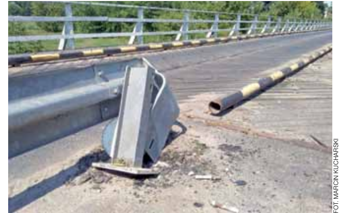
Policja otrzymała zgłoszenie, że ktoś rozbiera drewniany most w Kompinie. Okazało się, że kombajnista musiał odkręcić barierkę przy moście.

Do nietypowego zdarzenia drogowego doszło w ostatnią sobotę, 8 sierpnia przed godziną 11 na drewnianym moście nad Bzurą w Kompinie w gminie Nieborów. Na moście zaklinował się kombajn zbożowy, co spowodowało już po kilku minutach korek z obydwu stron mostu.