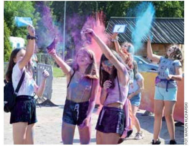
Kolorowe proszki w słońcu – radość lata.

Na miejscu można kupić proszki w 9 kolorach po 10 zł za sztukę – tak samo, jak rok temu. DJ zapraszał przed scenę do wspólnego posypywania się proszkami o każdej pełnej godzinie. W przerwach serwował muzykę oraz zachęcał do zabawy. Przed wejściem na wydzielony teren, gdzie można było posypywać się proszkami, uczestnicy musieli zdezynfekować ręce. mak