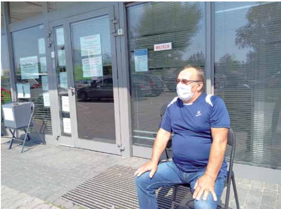
Pacjent czekający w kolejce do lekarza pod przychodnią „MediCenter”.

Niekiedy leki należy przyjąć natychmiast i nie ma czasu czekać, że lekarz odbierze telefon.