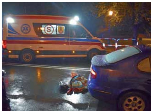
ZRM interweniuje na miejscu potrącenia. Potrącona kobieta wymagała natychmiastowej pomocy.

Przez ulicę Stanisławskiego, w rejonie skrzyżowania z ul. Wojska Polskiego przechodziła 65-letnia kobieta, mieszkanka Łowicza. Zarówno relacje świadków na miejscu, jak i wstępne ustalenia policji są zgodne co do tego, że przechodziła na przejściu dla pieszych, tym na wysokości Żabki. Wtedy właśnie została po-