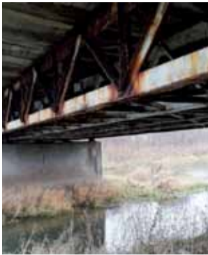
Most na ulicy Mostowej od dołu, na stalowej konstrukcji widać korozję.

Od spodu mostu zaplanowano konserwację betonowych płyt utrzymujących nawierzchnię, kompleksowe piaskowanie stalowej konstrukcji i jej zabezpieczenie przez malowanie. Najbardziej skorodowane elementy mostu, przede wszystkim poprzeczne, zostaną wycięte i zastąpione nowymi. Nie planuje się wymiany wzdłużnych elementów stalowych pomiędzy przyczółkami i filara-