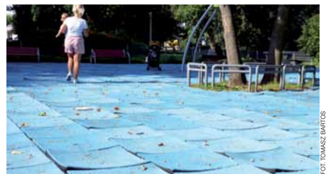
Tę nawierzchnię na placach zabaw w parku Błonie, zastąpi piach.

Prawdopodobnie już w listopadzie okaże się, czy wniosek miasta zyska akceptację prezesa Rady Ministrów i trafi do grona wniosków zakwalifikowanych do dofinansowania. Naczelnik Pełka mówi, że jeśli decyzja będzie pozytywna, ratusz ruszy z projektowaniem i uzgodnieniami prac na moście i do budowy ronda, w przypadku ścieżki rowerowej prace przygotowawcze już trwają. – Nasz wniosek określa łączny koszt tych prac na kwotę 9 mln zł, z czego dofinansowanie rządowe o które się staramy to 8,1 mln zł, reszta pochodząca będzie z budżetu miasta – mówi. tb