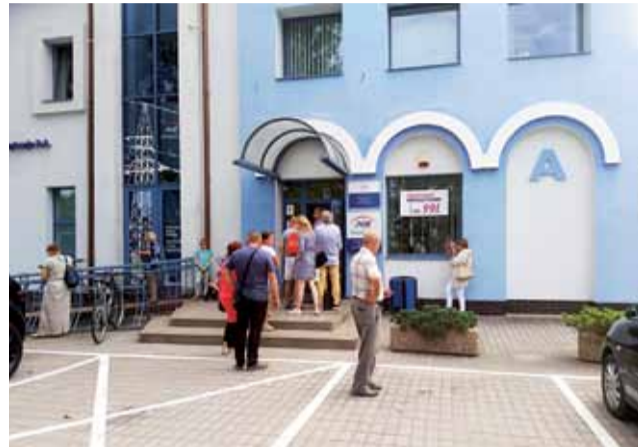
Kolejki przed Biurem Obsługi PGE w Łowiczu nie są nowością, jednak to nie jest wystarczający powód do tego, aby klienci się do nich przyzwyczaili i uznali, że zawsze tak być musi.

Być może części z tych problemów dałoby się uniknąć, gdyby klienci mogli starannie przygotować się do wizyty w placówce. Każdy wolałby zaoszczędzić sobie czasu i nerwów i do tej wizyty dobrze się przygotować, jednak materia jest dla nich zbyt skomplikowana, a wspomniane próby uzyskania informacji telefonicznej o tym jak to zrobić, też mogą skończyć się niepowodzeniem.