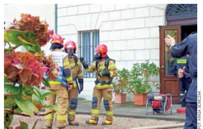
W czasie ćwiczeń strażacy wykonywali te same czynności, co na prawdziwych akcjach.

Okolo godziny 10 strażacy z PSP Łowicz, OSP Nieborów i OSP Bednary udali się na teren pałacu. Najpierw wynieśli z budynku kobietę, która udawała wymagającą przeprowadzenia resuscytacji krążeniowo-oddechowej. Potem, korzystając z podnośnika, pomogli wydostać się z pokoju na drugim piętrze kobietę, która została tam „uwięziona”. Na koniec wynieśli z pałacu repliki cennych przedmiotów – obrazu i fotelu. Celem ćwiczeń było doskonalenie umiejętności strażaków, które by-