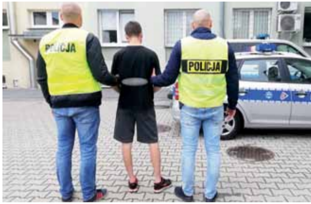
Zatrzymanie 23-latkę. Już wcześniej mężczyzna był notowany za konflikty z prawem.