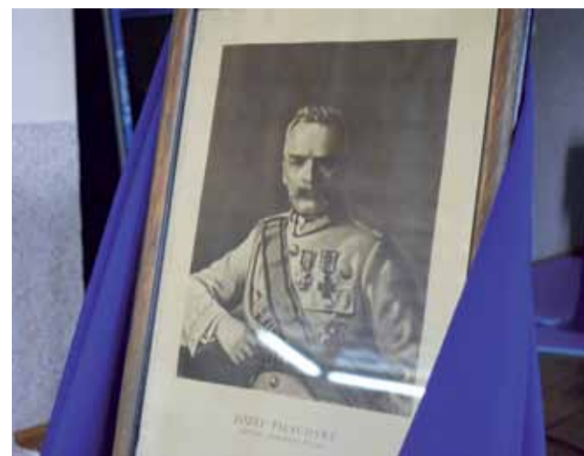
Historia tego portretu jest w pewnym sensie paralełą ostatnich stu lat dziejów Polski.