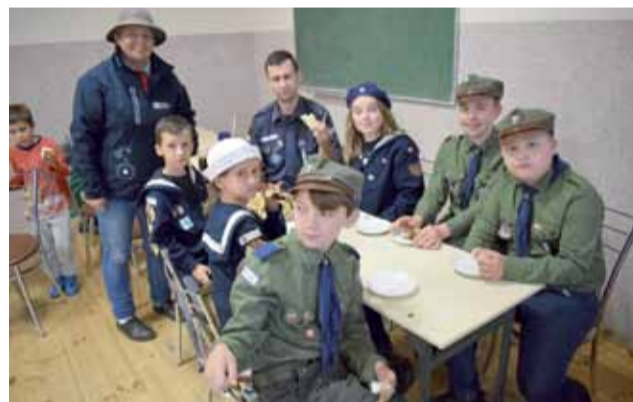
Harcerze hufca ZHP w Głownie podczas poczęstunku w Skaratkach.