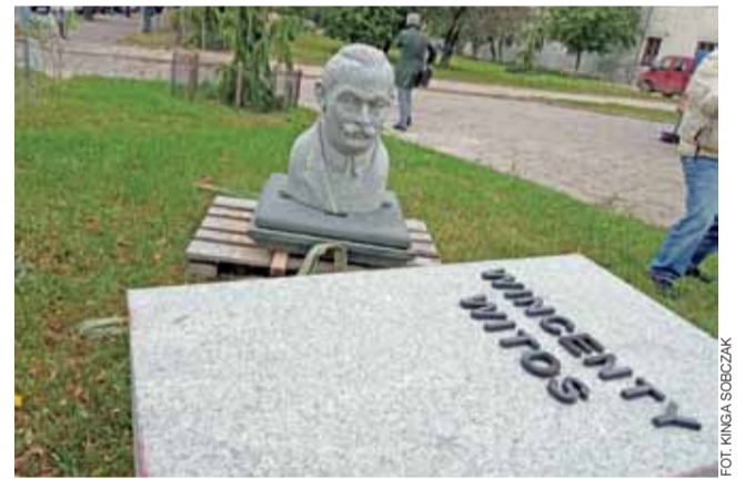
Pomnik Wincentego Witosa był stawiany we wtorek w godzinach popołudniowych.

To w roku 1920 powstał Rząd Obrony Narodowej, czyli gabinet rządzący, który miał zjednać wszystkie najważniejsze w Polsce ugrupowania polityczne i ukazać zgodę narodową ponad podziałami i – co najważniejsze – wygrać wojnę, a potem zawrzeć pokój z sowiecką Rosją. Wincenty Witos był premierem RON, a na czele rządu stawał potem jeszcze dwukrotnie, w latach