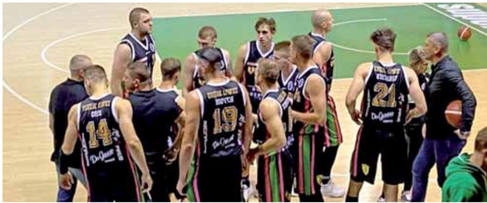
Księżacy nie mieli powodów do radości po inauguracji Suzuki I ligi.

Koszykówka | 1. kolejka Suzuki I ligi koszykówki