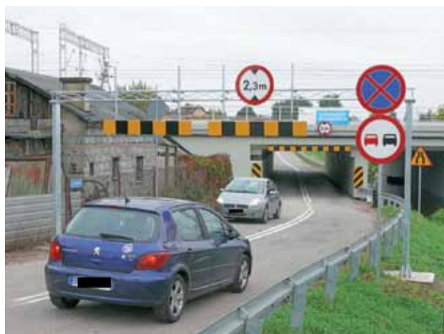
Po 20 miesiącach, w końcu możemy dojechać bezpośrednio z ul. Klickiego do ul. Arkadyjskiej oraz Żwirki i Wigury.

Korzystając z tunelu należy bowiem pamiętać o ograniczeniach: prędkości – do 30 km/h i wysokości – do 2,3 m. Przed każdym z wjazdów ustawione są bramownice, które będą ostrzegać kierowców samochodów ciężarowych przed wjazdem zbyt wysokimi samochodami. tb