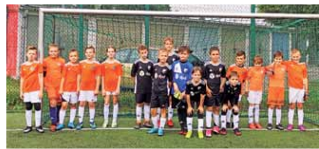
UKS Soccer Kids 2010 po meczu ligowym z Widokiem II.