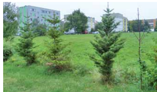
Działka na Bratkowicach przeznaczona do zabudowy ma powierzchnię 6.800 m 2 . Położna jest w rejonie ulic Bursztynowej i bł. Bolesławy Lament.

Przedmiotowa działka zostanie w ramach przygotowań do inwestycji wyceniona przez rzeczoznawcę. Nabywcy lokali będą kupować udziały w niej. Pieniądze uzyskane przez spółdzielnię,