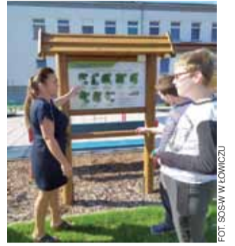
W „Zielonym zakątku” odbywają się już zajęcia.

Najbliższą akcją organizowaną przez ZHP Łowicz jest wycieczka rowerowa, która ma się odbyć 27 września. ksł