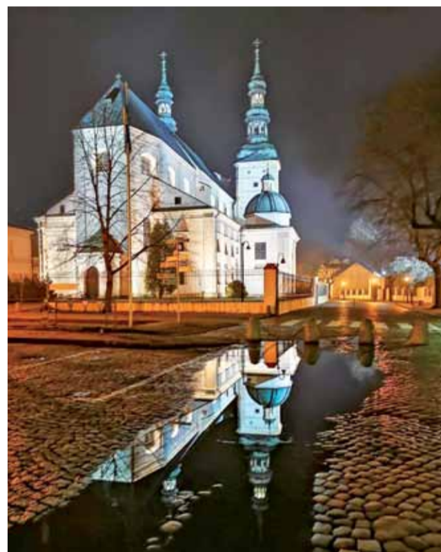
Piękno katedry zwielokrotnione po deszczu. To też Maciej Burzykowski.