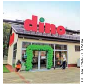
Dino przy ul. Bolimowskiej w dniu otwarcia.

– Sąsiedztwo sklepów Biedronka czy Delikatesów Centrum nie doprowadziło do tego, że nasze obroty się drastycznie zmniejszyły, to może i teraz to nie nastąpi