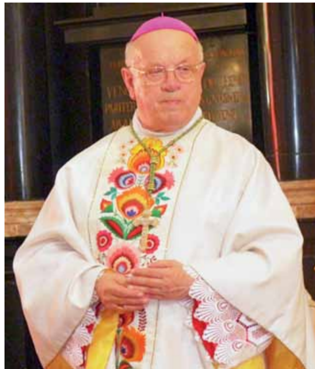
Ks. biskup Józef Zawitkowski w czasie dziękczynnej mszy św. jubileuszowej z okazji 50-lecia kapłaństwa, 20 maja 2012 r.

Transmisje niemal nieprzerwanie są nadawane przez „Jedyn-