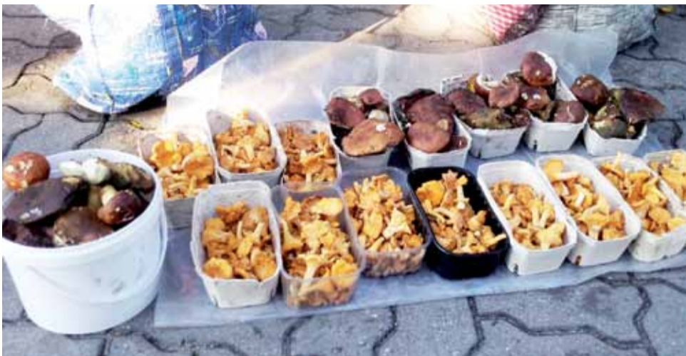
Grzyby na łowickim targowisku można było kupić w ostatnią sobotę od kilkunastu osób. Każdy ze sprzedawców miał ich co najmniej kilka pudełek.

Na dużych targowiskach, gdzie odbywa się na większą skalę niż w Łowiczu handel grzybami, ad-