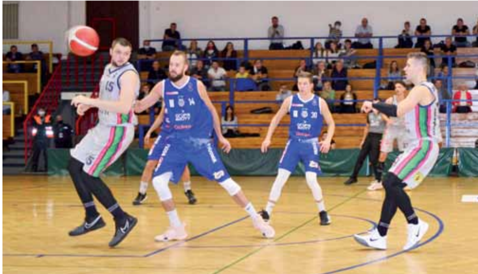
Księżacy zagrali dobry mecz i pewnie pokonali Pogon Prudnik.

– Wynik ładny i nie ukrywam, że bardzo się cieszymy, że to pierwsze zwycięstwo i to takie spokojne. Mogło być jeszcze lepiej, ale jak będziemy pewne rzeczy wykonywać jeszcze dokładniej, to będziemy wtedy spokojniejsi. Założenie na ten mecz było, żeby grać bardzo szybko i zdobywać łatwe punkty, szczególnie w kontrataku, niezależnie od tego, czy to było po straconym