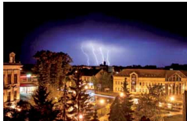
Tę burzę nad miastem uchwycił Maciej Burzykowski.