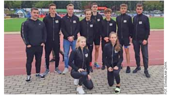
Reprezentacja Łowickich Sztafet w barwach UKS Błyskawica Domaniewice zrobiły super wyniki na Mistrzostwach Polski.