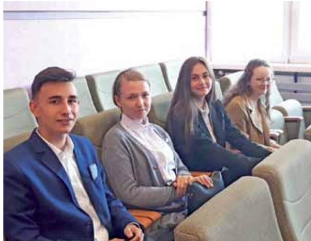
Reprezentanci II LO w konkursie wiedzy o Żołnierzach Wykłych.