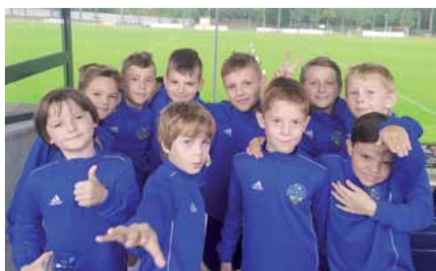
Piłkarze UKS Soccer Kids 2011 mogą być zadowoleni z formy.