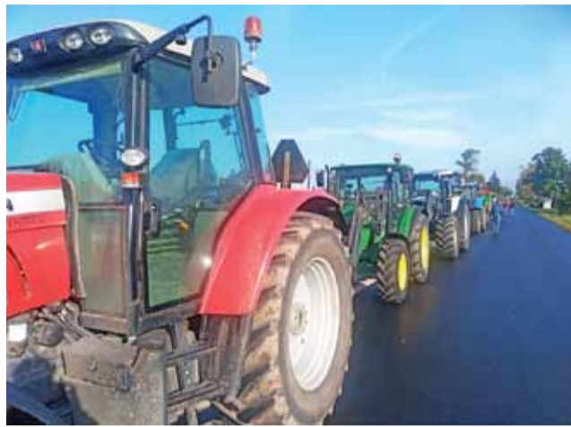
Rząd ciągników w Błędowie, w gotowości do wyruszenia na protest.

– Tęgo rządu nigdy by nie było, ci ludzie nie byliby u władzy, gdyby nie masowe poparcie rolników, w tym hodowców zwierząt mięsnych, udzielone im w wyborach – mówiła nam grupa młodych uczestników protestu. – Teraz, jak