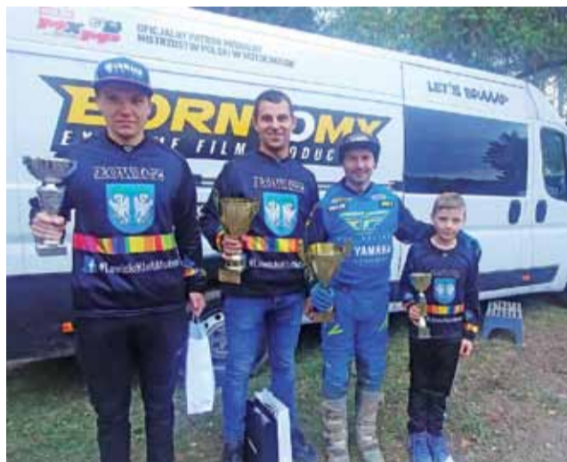
Łowiczanie świetnie zaprezentowali się na zawodach w Kowali.

Ostania runda Mistrzostw Strefy Centralnej zaplanowana jest na niedzielę 11 października na torze w Serokach. Warto przybyć na taką imprezę. Będzie głośno, będzie wiele emocji i ciekawych wyścigów. Wyścigi zaczynają się od godz. 11.00 i będą trwać aż do 16.00.