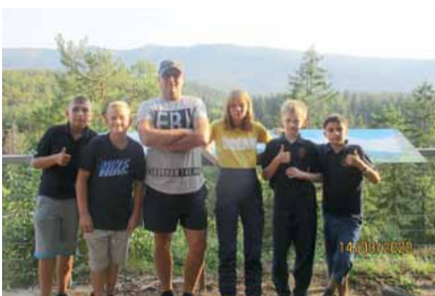
Ekipa Szkoły Pijarskiej podczas wycieczki pieszej w Szklarskiej Porębie.