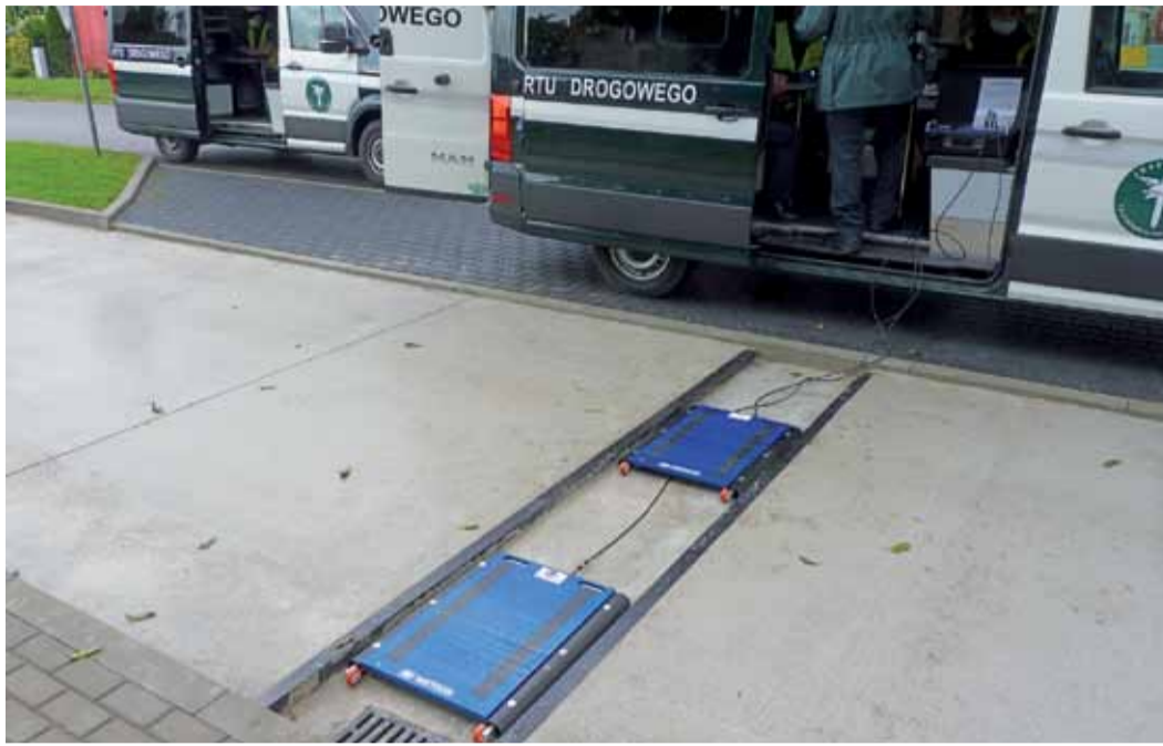
Procedura ważenia samochodu do 3,5 tony trwa ok. pół godziny, w przypadku większych pojazdów nawet do 3 godzin (nie tyle ze względu na sam proces techniczny, co na liczne formalności).

sta z drogi krajowej nr 14. Do tej pory najbliższe Łowicza miejsca, gdzie można było skorzystać z wagi znajdowały się w Kutnie oraz na MOP Główny przy autostradzie A1. Teraz funkcjonariusze łowickiego oddziału mają go praktycznie pod swoją siedzibą. – Mamy broń i nie zawahamy się jej użyć – żartował jeden z nich.