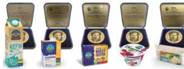
Nagrodzone złotymi medalami produkty OSM Łowicz.