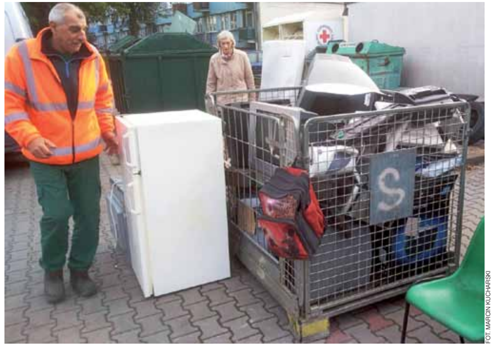
Kontener na parking przy ul. Starzyńskiego szybko się zapelniał już w godzinach porannych.