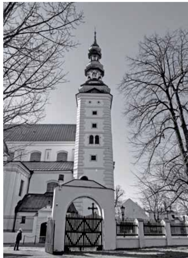
Pustka zupełnie nie niedzielna. Niedziela Palmowa 2020. Nie ma palm, jest wirus.