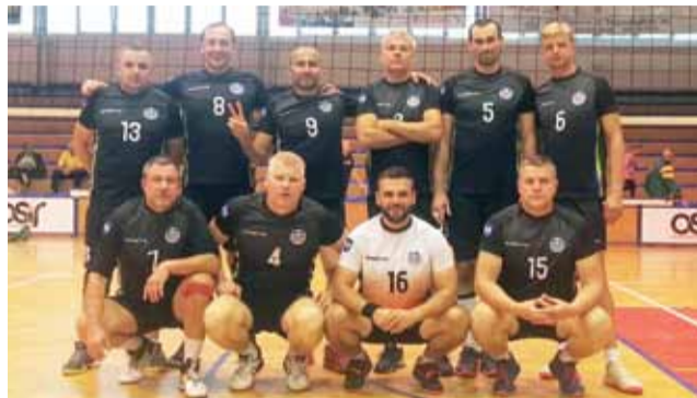
Siatkarze ŁAGS Awanturnik Łowicz byli bardzo blisko mistrza.

Łowiczanie zagraли systemem „każdy z każdym” i stoczy-