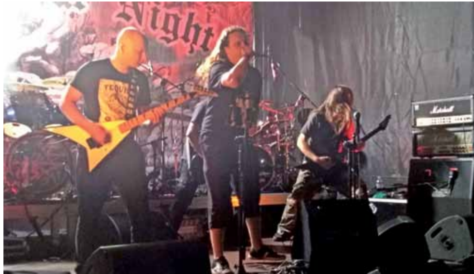
Odi Profanum Vulgus jako wystąpił pierwszy.

Odi Profanum Vulgus, który przyjechał do Łowicza z południowo-wschodniej Polski zagrał jako pierwszy i od razu zaproponował mocną dawkę black / death metalu z progresywnym podej-