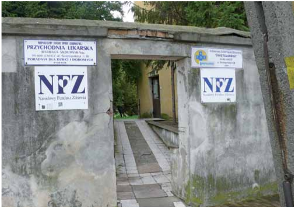
Do lekarzy rodzinnych przyjmujących przy ul. Świętojańskiej nietatwo jest się dodzwonić. Ale nie jest to problem w Łowiczu odosobniony.

Pacjent ma prawo do wizyty osobistej w gabinecie lekarza rodzinnego.