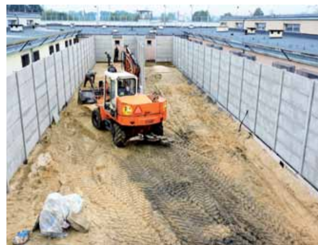
Na tym etapie prac wyraźnie widać już zarys kształtu przyszłego placu spacerowego.

Place spacerowe przeznaczone będą zarówno dla osadzonych odbywających karę pozbawienia wolności w warunkach zakładu typu zamkniętego, jak również osadzonych z oddziału typu pół-