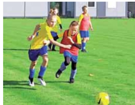
Starania zespołu Akademii zakończyły się porażką.

■ RKS Mazovia Rawa Mazowiecka – MUKS Pelikan-2009 I Łowicz 2:4 (2:4); br.: Mateusz Melon