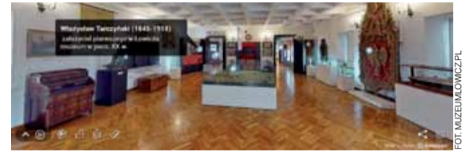
Sala na piętrze muzeum - wirtualnie.

Aby wirtualnie zwiedzić muzeum w Łowiczu, należy wejść na stronę internetową placówki muzeumlowicz.pl, a następnie w zakładkę „wirtualne zwiedzanie”. Można zobaczyć Kaplicę św. Boromeusza, Izbę Pamięci Żydów, wystawę historyczną, gabinet kolekcjonerski czy wystawę etnograficzną. Można także się udać do skansu w Maurzycach, gdzie do obejrzenia są m.in. chałupy ze Złakowa Borowego, kościół św. Marcina czy kuźnia.