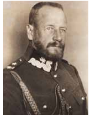
Generał Lucjan Żeligowski.

Lublin, 5 października 1920 [Wartość rosyjskich pokojowych propozycji, „Ziemia Lubelska” nr 428/1920]