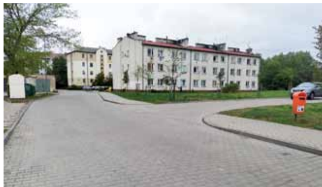
Skrzyżowanie ul. Krudowskiego z drogą wewnętrzną. To tutaj doszło do wypadku.

Poruszająca się rowerem doznała poważnych obrażeń, w tym złamania kości udowej prawej z przemieszczeniem, złamania kości ramiennej prawej z przemieszczeniem oraz urazu głowy.