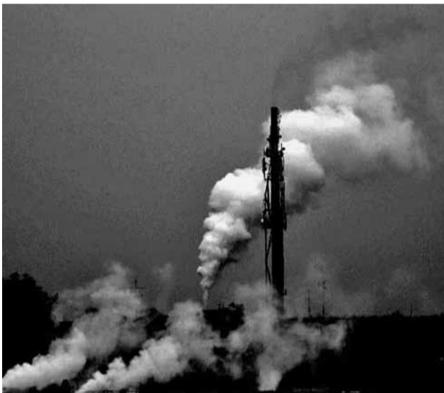
Łowicz przemysłowy w obiektywie Pawła Kaczmarka. Druga nagroda.