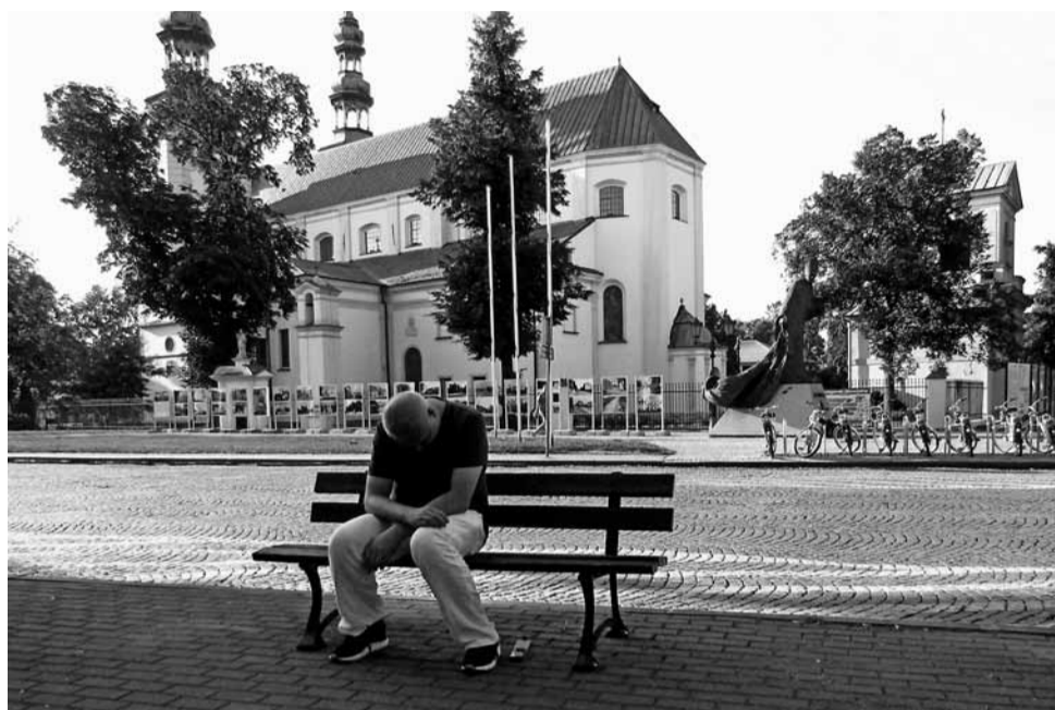
Samo życie. To zdjęcie najbardziej podobało się zwiedzającym wystawę.