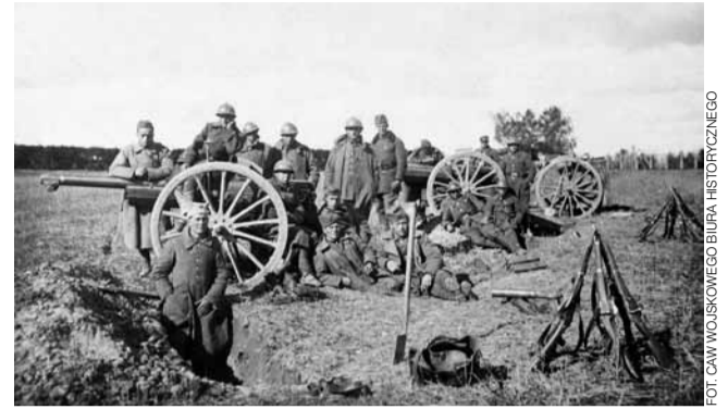
Okolice Stołpców (Nowogródzka), październik 1920. Odpoczynek po bitwie niemeńskiej.

Wilnianie i kresowiaci stanowili zaledwie trzecią część pułku, lecz nastrój był bardzo dobry i wszyscy się cieszyli, że z każdym dniem zbliżamy się do swego Wilna. Już koło Lidy poczęły krząć głuche wieści i pogłoski, że na Wilno nie pójdziemy, że jest jakaś umowa suwalska [podpisana 7 października] z Litwinami oddająca im