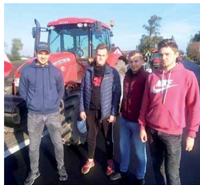
– Trzeba wierzyć, że to coś zmienia, inaczej nie byłoby sensu protestować – przekonywali w Błędowie młodzi uczestnicy protestu.

Rolnictwo | Rolnicy z Łowickiego protestują