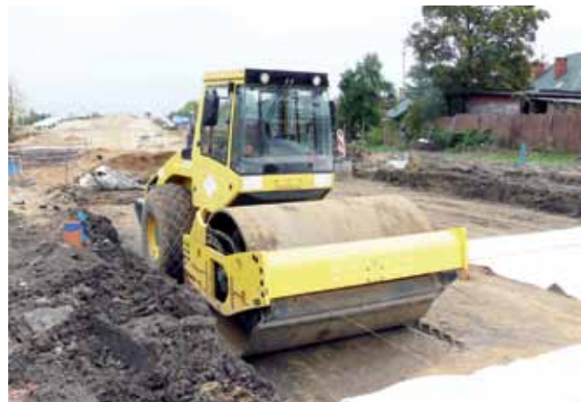
Plac budowy drogi dojazdowej na wiadukt, nasyp na niego prowadzący widoczny jest w tle.

Wjazd na podzielony parking będzie możliwy – na mniejszą jego część, od strony dawnego pawilonu spożywczego Kasia, tak jak do tej pory bramą, zaś na większą część, od strony dworca kole-