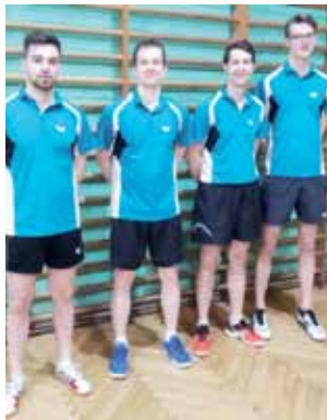
Drużyna UMKS Książek Łowicz walczy o dobrą lokatę w nowym sezonie II ligi.

W niedzielę, 11 października, Księżacy rozegrali swój drugi mecz w 2 lidze mężczyzn. Nasi reprezentanci pokonali na wyjeź-