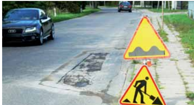
We wrześniu Zakład Utrzymania Miasta naprawiał nawierzchnię na ul. Nadburzańskiej, w miejsca spęknięcia i dziur położono nowy asfalt.