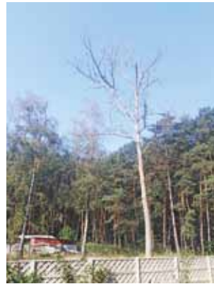
Czy jest jakiś sposób na legalne wycięcie tego drzewa?