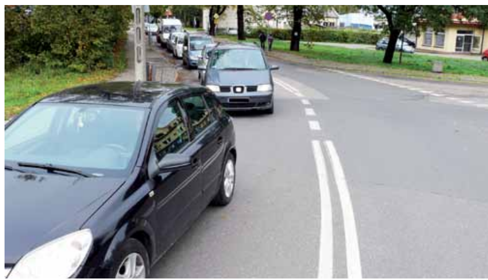
Codziennie przez przejazd kolejowy w ciągu ulic: Mostowa – Armii Krajowa, Chełmońskiego przejeżdżają setki samochodów, zamknięcie rogatek za każdym razem zatrzymuje wielu kierowców.

Równie poważnym tematem jest odcinek ul. Armii Krajowej od skrzyżowania z ul. Chełmońskiego do przejazdu kolejowego. Skoro nie będzie tunelu, to aż się prosi, aby poważnie myśleć o poszerzeniu tej ulicy i budowie lewoskrętu dla kierowców, którzy zdecydują się na jazdę do centrum ul. Nadburzańską. Obecnie, niemal codziennie, dziesiątki kierowców łamią przepisy o ruchu drogowym, decydując się na przekroczenie znajdującej się tam podwójnej linii i jazdę pod prąd, aby wymijając oczekujących przed przejazdem kierowców skręcić w ul. Nadburzańską. Można więc przypuszczać, że w przyszłości takie zachowanie kierowców będzie nagminne.