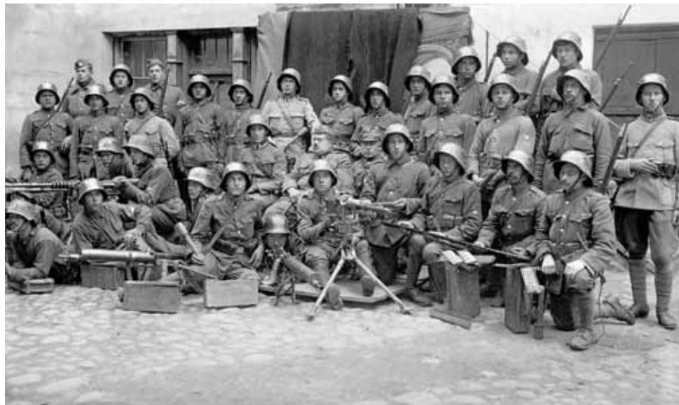
Wilno, 15 października 1920. Wileński Pułk Strzelców.

Marsz na Wilno odbywał się prawie spokojnie, z wyjątkiem kilku małych utarczek niemających większego znaczenia w akcji bojowej pułku. Zobaczyliśmy nareszcie cel naszych dążeń – Wilno. W szeregach pułku zapanowała radość, wszyscy bez wyjątku oczekiwali chwili wkroczenia do miasta z wielką niecierpliwością. Przed murami Wilna na twarzach żołnierskich widoczne były oznaki silnego wzruszenia. Każdy odruchowo