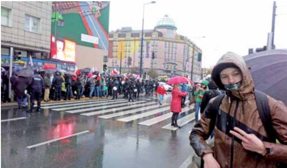
Protestujący rolnicy w Al. Jerozolimskich w Warszawie, w tle widoczny hotel Radisson Blu Sobieski.

Wiele osób przyjechało na protest z racami, syrenami i transparentami, na których najczęściej były wypisane hasła „Nie dla piątki Kaczyńskiego”, „Obronimy polską wieś”. Zdarzały się też transparenty na temat walki z ASF, które przywieźli ze sobą członkowie Związku Hodowców Trzody Chlewnej. Była sztuczna krowa prowadzona wózku, z napisem „Dla Morawieckiego”, kosy,