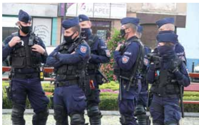
Ściągnięty do Łowicza oddział prewencji z Komendy Policji w Łodzi ubrał się, jakby miał szturmować pozycję niespełna 50 antycovidowców. Co ciekawe policja cały protest filmowała dwiema kamerami.

Dyrektor mówi też, że szpital musi się odbić od dna, którego dosięgnął, żeby dalej służyć pomocą dla pacjentów. – Mam nadzieję, że koronawirus zjednoczy załogę we wspieraniu się, wzajemnym zrozumieniu tej sytuacji i przekonaniu, że wygramy tę walkę. Bo to jest walka o zdrowie naszych pacjentów, nas samych i naszych rodzin – mówi dyrektor. Jest pełna wiary, że tą walkę można i trzeba wygrać. mwk