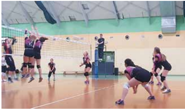
Juniorki Asika już grają w lidze wojewódzkiej.

go ŁKS, która w tamtym sezonie był finalistą Mistrzostw Polski Kadetek. Asik przegrał ten pojedynek 0:3, ale gra nie była zła.