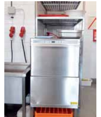
Nowa zmywarka w szkolnej stołówce.

Wszystko to kosztowało około 100 tys. zł, ale tylko 20 tys. zł