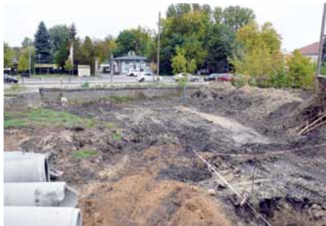
Widok z powstającej ulicy dojazdowej do drogi wiodącej bezpośrednio na wiadukt w kierunku ul. 3 Maja i parkingu na dawnej rampie kolejowej.

Naczelnik ratuszowego wydziału inwestycji Grzegorz Peł-