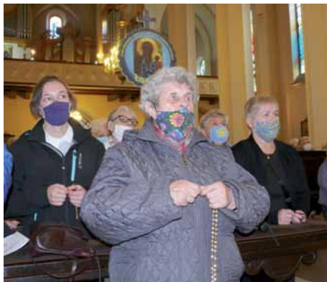
Jednym z elementów pielgrzymki Kół Żywego Różańca do Domaniewic była wspólna modlitwa różańcowa.