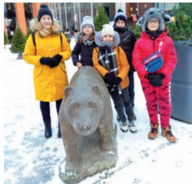
To była wspólna przygoda! – zapewniają uczniowie „Jedynki”.