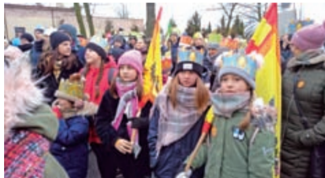
Dzieci i młodzież chętnie zakładała papierowe korony i niosła orszakowe flagi.

wcześniej grupa parafian z Korabki. – Głównym smakoszem i koordynatorem przygotowywania