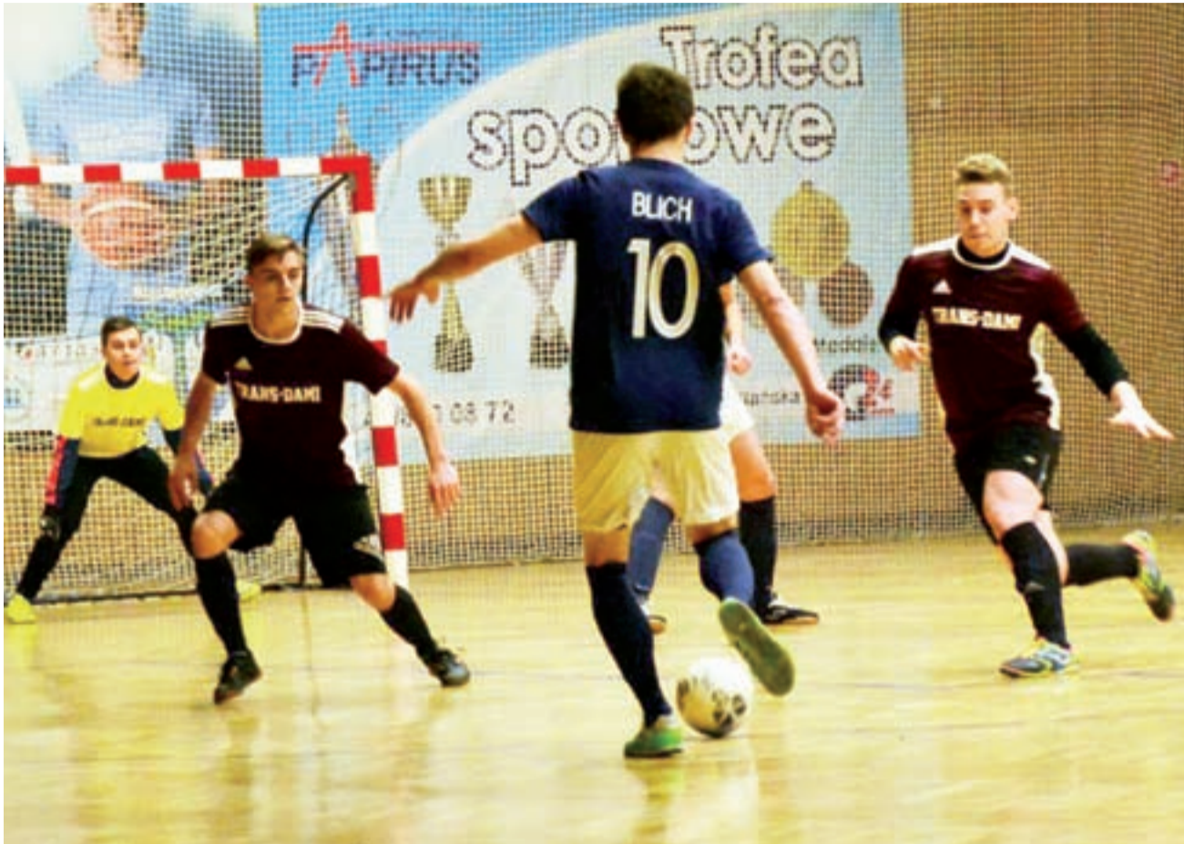
Spotkania najniższej klasy Robkol IV Łowickiej Ligi Futsal stoją na wysokim poziomie.

Drink Team już po pierwszych kilku minutach przegrywał kilkoma bramkami i nic nie wskazywało, że to się jeszcze odmie-