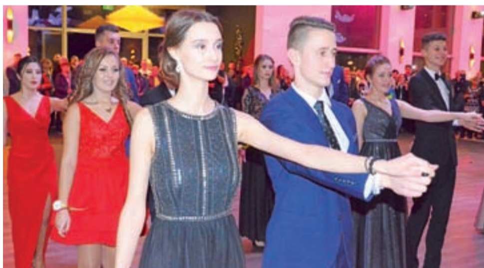
Uczniom przed polonezem życzone udanej zabawy i powodzenia na egzaminach. Na fotografii klasa IIIb.