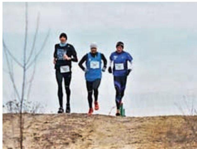
Biegacze na trasie Biegu Powstańca znajdują się w tym roku w niedzielę, 23 lutego.

Celem imprezy jest wspieranie i popularyzowanie imprez biegowych w okolicach Łodzi, zachęcanie do aktywnego, zdrowego i sportowego trybu życia mieszkańców Gminy Stryków i Ziemi Łódzkiej, uatrakcyjnienie oferty imprez rekreacyjno-sportowych na terenie Ziemi Łódzkiej oraz integracja biegaczy oraz instytucji i klubów sportowych. Szczegółowy regulamin i mapa trasy dostępne na kbpowstaniec.pl . wp