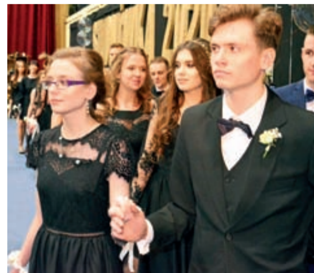
Tegoroczni maturzyści szkoły Pijarskiej samodzielnie przystroili salę gimnastyczną czerpiąc inspirację ze znanej sztuki Szekspira.