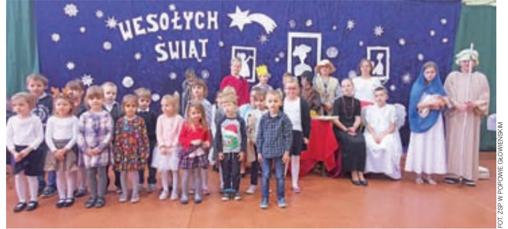
Mali aktorzy wcielili się w rolę profesjonalnych aktorów.