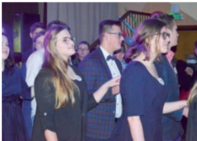
Bal rozpoczął się polonezem, w którym udział wzięli wszyscy uczestnicy zabawy.