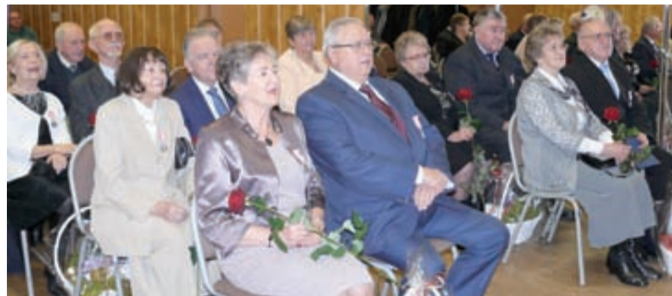
Obchodzące swój wielki jubileusz małżeńskie pary udekorowane medalami Za Długoletnie Pożycie Małżeńskie, obdarowane kwiatami i upominkami z rąk burmistrza Strykowa.