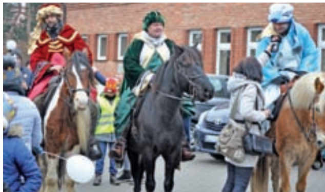
Od kilku już lat Trzej Królowie jadą w orszaku na koniach „wypożyczonych” ze stowarzyszenia „Karino”.

W trakcie orszaku, w czterech miejscach odegrane zostały krótkie, dosłownie kilkuminutowe scenki na temat Bożego Narodzenia i Objawienia Pańskiego, za każdym razem zaśpiewano też kil-