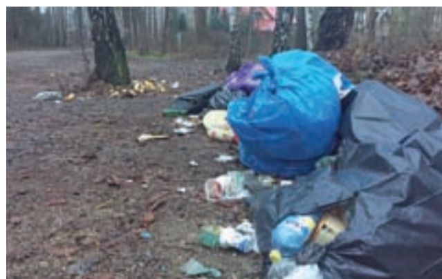
Tak było przy ul. Leśnej przez kilka dni.

Kontenerów nie ma na ich stałych miejscach (np. przy ul. Leśnej) dlatego, że dotychczasowa umowa z firmą odbierającą śmieci obejmowała tylko okres do końca października – choć właściciele domków i tak płacili bardzo dużo: w roku 2018 opłata roczna za wywóz śmieci wynosiła 318 zł od jednego siedliska. A przecież ogromna większość właścicieli korzystała z nich przez zaledwie kilka tygodni w roku, bytujących w Joachimowie od maja do października było niewiele.