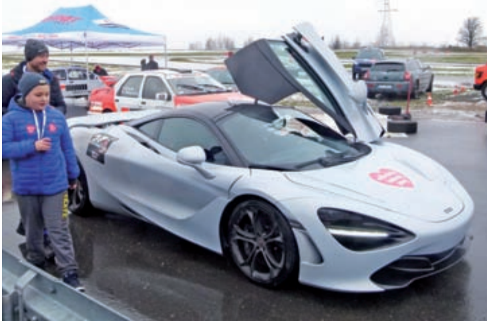
McLaren jak marzenie. Tym super samochodem w 27. Finale WOŚP, w styczniu 2019 roku, można było przejechać się po Torze Łódź. Chętnych nie brakowało.

Sobota, 11 stycznia, od rana należy będzie do imprez sportowo – rozrywkowych. Tradycyjnie