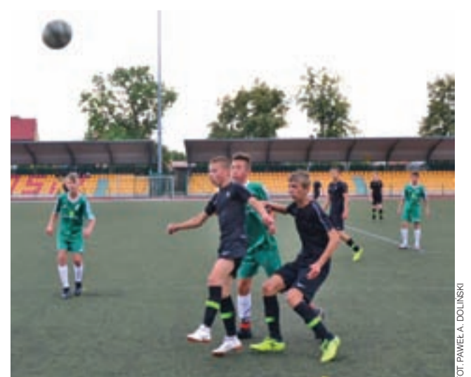
Drużyna Pelikana z rocznika 2005 awansowała do I ligi.

w domowym meczu z Wartą Sieradz, gdzie łowiczanie rozgromili rywali w stosunku 8 do 2.