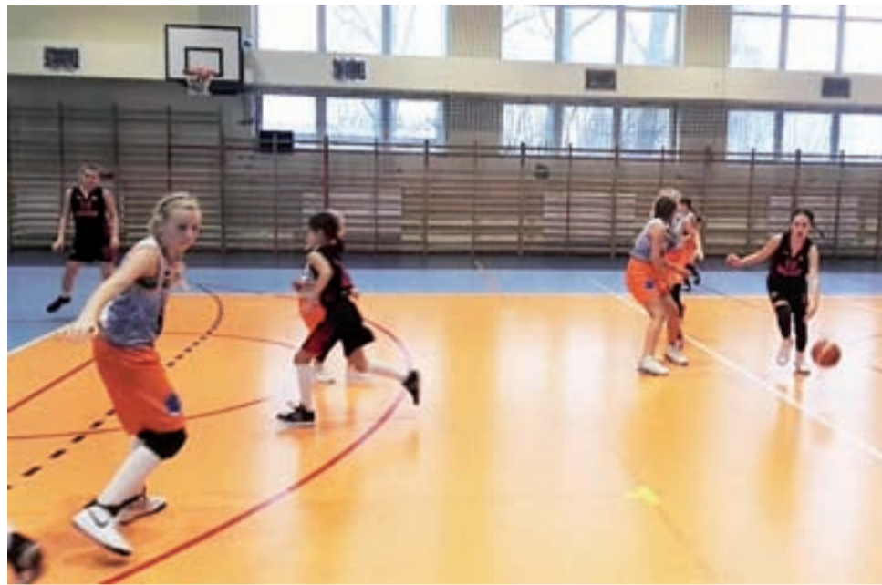
Koszykarki TK Basket Stryków (biało-pomarańczowe stroje) walczą w lidze kilku kategoriach wiekowych. Opiekunami strykowianek są profesjonalni trenerzy.