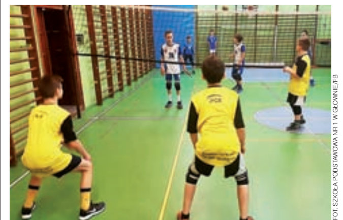
Mecz siatkówki w SP 1 Głowno dostarczył uczniom wiele zabawy.