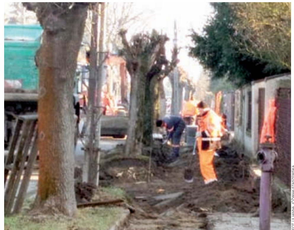
Prace przy modernizacji chodnika przy ul. Targowej mają potrwać do lutego.