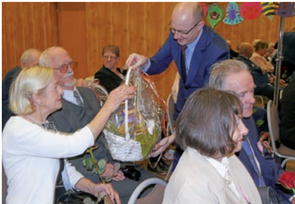
Pary zostały obdarowane przez burmistrza Strykowa m.in. koszami słodkich upominków.

Jubilaci otrzymali pamiątkowe listy gratulacyjne, kwiaty oraz