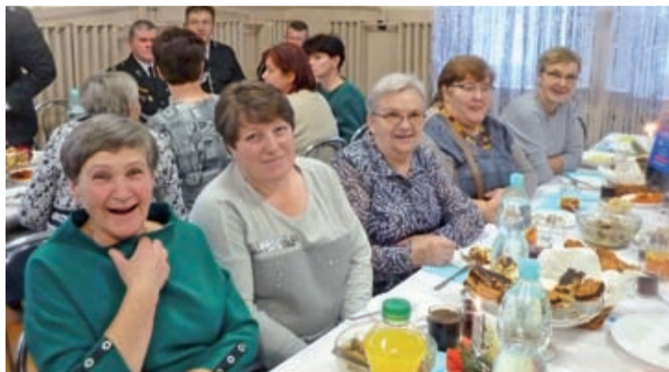
Spotkać się w tak wspaniałym gronie to sama przyjemność – zapewniały uczestniczki.

Uczestniczki świątecznego wydarzenia zadbały o jego życzliwą