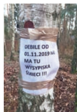
Widać, że ktoś się zdenerwował.

Teraz gmina będzie zmuszona rozwiązać problem jeszcze inaczej, bowiem nowelizacja ustawy wprowadziła stałą w całym kraju opłatę za wywóz śmieci z działek letniskowych w wysokości niepełna 160 zł rocznie.