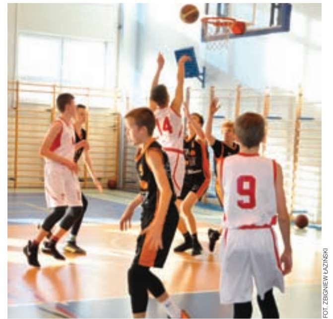
Kadeci Bzury walczą o pierwszą wygraną w lidze.