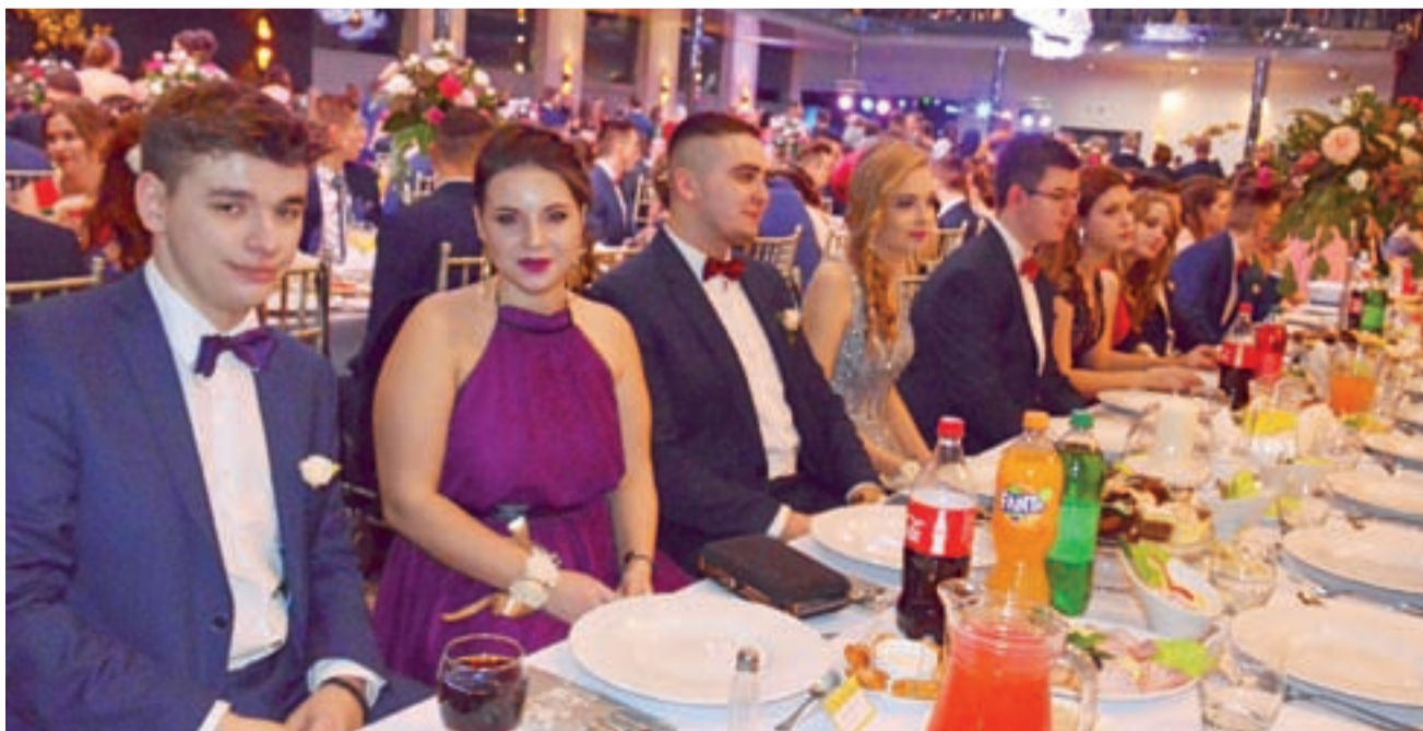
„Mediolan” oprócz rozległego parkietu zaoferował maturzystom z Ekonomika także suto zastawione stoły.

Do pracy w głowieńskiej mutacji naszego tygodnika