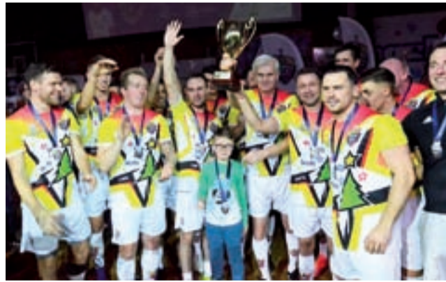
Zwycięska drużyna GnG Team podczas XVI edycji Turnieju Gwiazdy na Gwiazdkę prezentuje zdobywcę, która nie była tego dnia najważniejsza.