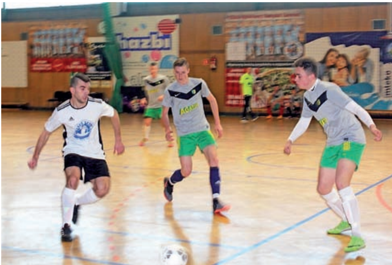
W Zina III Łowickiej Lidze Futsal w górze tabeli panuje dość mocny ścisk.

Do tej pory drużyna Vagatu Domaniewice była niezwyciężona i dalej by tak było, gdyby nie gol w ostatniej minucie.