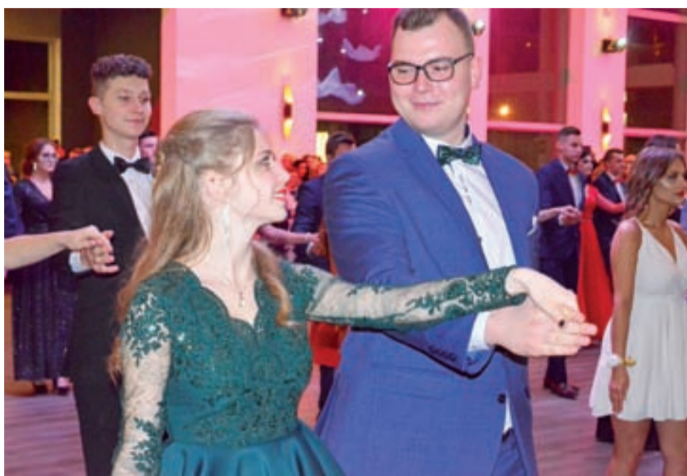
Polonez maturzystów z kl. IIIb.