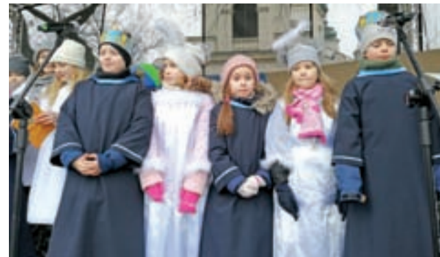
Na scenie na Starym Rynku wystąpiły dzieci ze scholi pijarskiej i przedszkola Pod Tęczą.

Na uczestników orszaku na Starym Rynku czekała gorąca zupa i herbata. Orszakową tradycją stało się też, że zupę przygotowuje