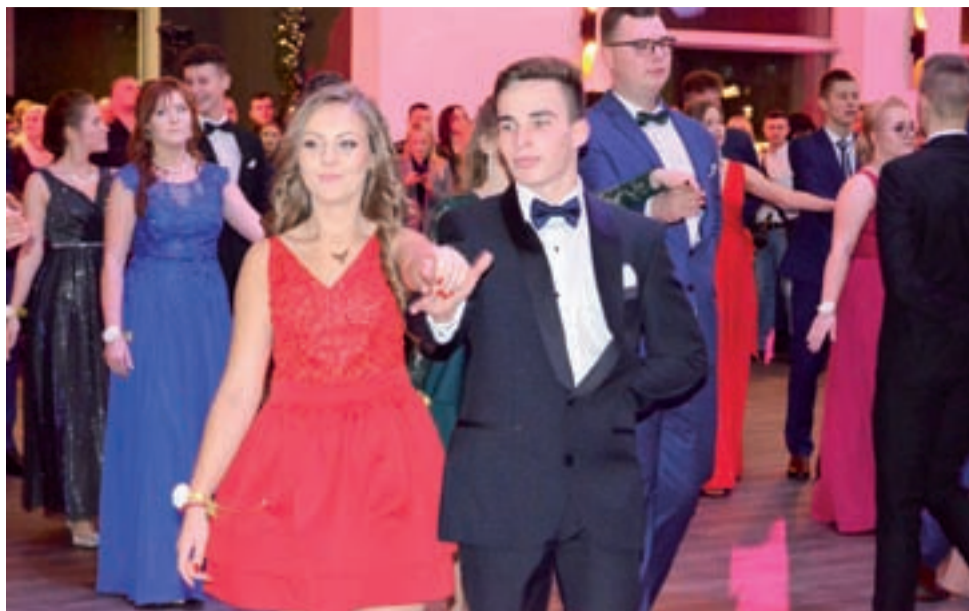
Jak widać chłopcy z Ekonomika zdecydowali się na garnitury i muchy pod szyją.