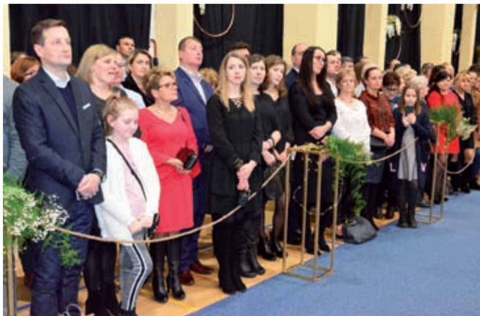
Rodzice, rodzeństwo, a nawet dziadkowie, wujowie i ciotce przyszli zobaczyć poloneza swoich wyróżnionych pociech.