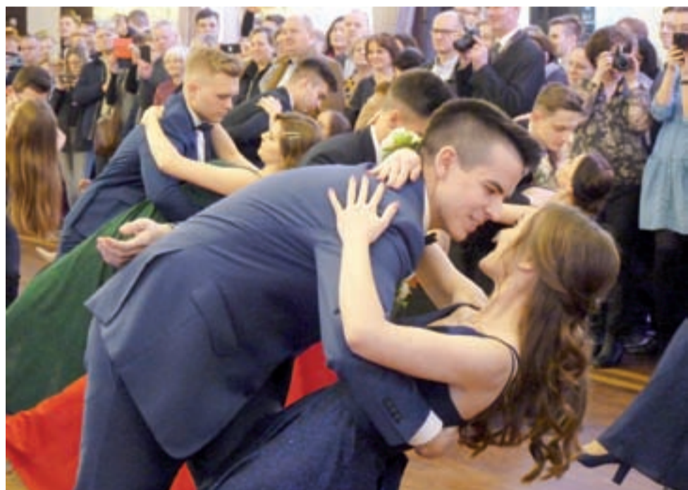
Tę figurę z poloneza publiczność nagrodziła gromkimi brawami.

W tym roku Orszak Trzech Króli przeszedł ulicami 872 miejscowości w Polsce i 21 poza jej granicami. Zapraszamy do obejrzenia galerii zdjęć i filmów na stronie www.lowiczanie.info. mak