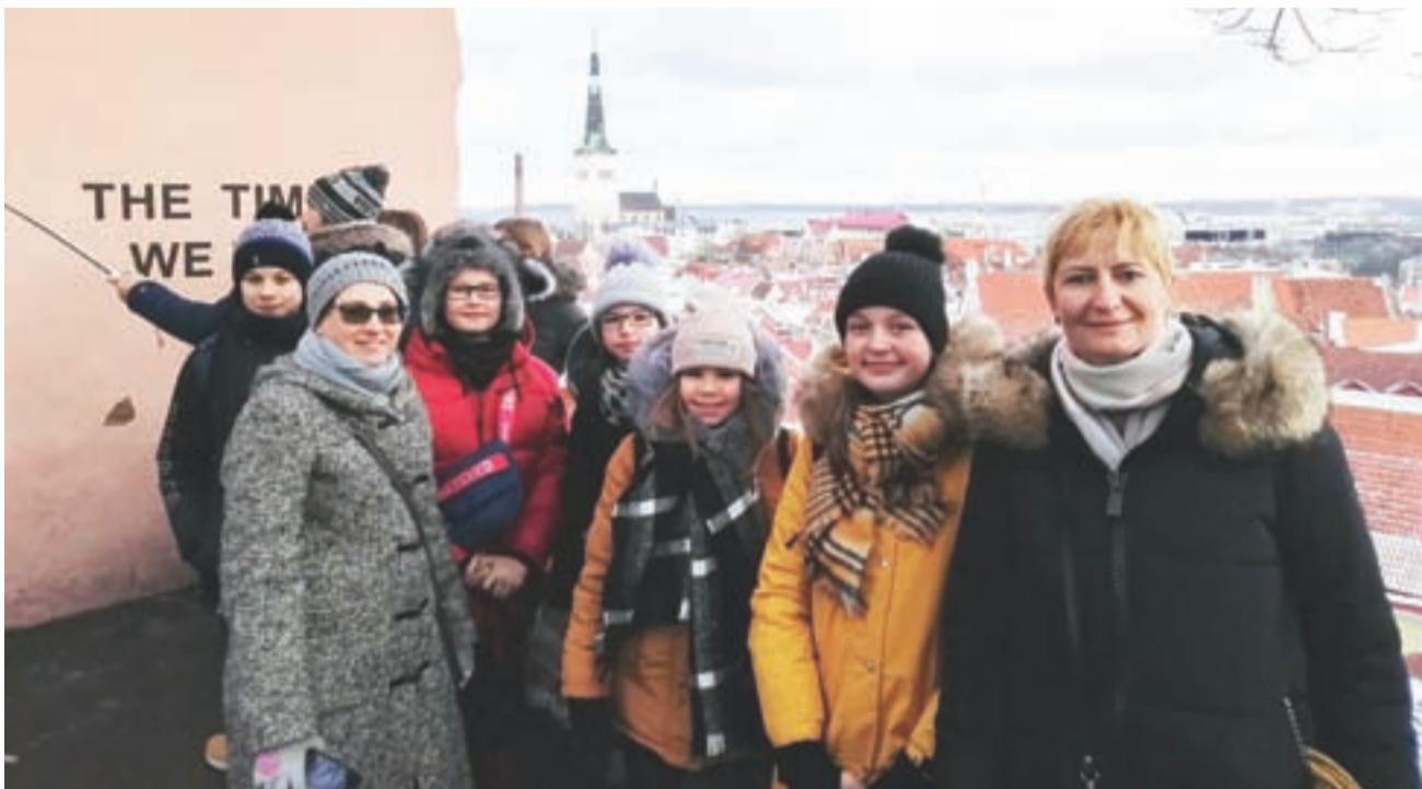
Podczas grudniowej wyprawy uczniowie mogli podziwiać wiele malowniczych zakątków Estonii.

– Z odzieży używanej, czyli starych koszulek i dzinsów, przygotowaliśmy stroje ozdobione wzorami ludowymi. Wspólnie zdobiliśmy ubrania we wzory łowickie i z motywami kwiatowymi. Naszym przyjaciółom z Wielkiej Brytanii najbardziej spodobały się