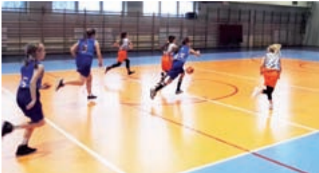
Akcja zespołu TK Basket Stryków (biało-pomarańczowe stroje) w Wojewódzkiej Lidze do lat 12 dziewcząt.

■ 3. kolejka WLK U-12 K: UKS Basket Aleksandrów Łódźki – TK Basket Stryków 33:35 (10:6, 6:12, 8:5, 9:12), TK Basket Stryków – KKS