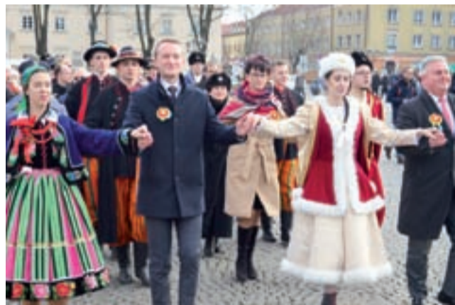
Wszystkie pary miały wdzięk i elegancję, a te na czele poloneza dodatkowo zachwycały strojem.