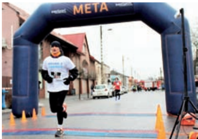
Start i meta Biegu po Zdrowie po Strykowie będzie mieścić się, jak zawsze przy pl. Łukaszińskiego. Zmieni się tylko kierunek biegu.

Limit miejsc został błyskawicznie zapełniony i w niedzielne popołudnie do rywalizacji staną dokładnie 103 osoby w dwóch kategoriach wiekowych. W biegu głównym na dystansie 5 km (2 rundy) zgłoszonych jest 85 uczestników, natomiast w grupie młodzieżowej 10-15 lat wystartuje 18-tka dzieci, które przebiegną dystans 1 rundy, a więc 2,5 km. Stałych bywalców czeka nowość i bieg parkiem przylegającym do rzeki Moszczenica, a ponadto biegacze będą przemierzać się w odwrotną stronę niż dotychczas, a więc ze startu przy pl. Łukaszińskiego kierować się będą w ul. Grunwaldzką. Dla każdego uczestnika przewidziano pamiątkowy medal, a ponadto osoby