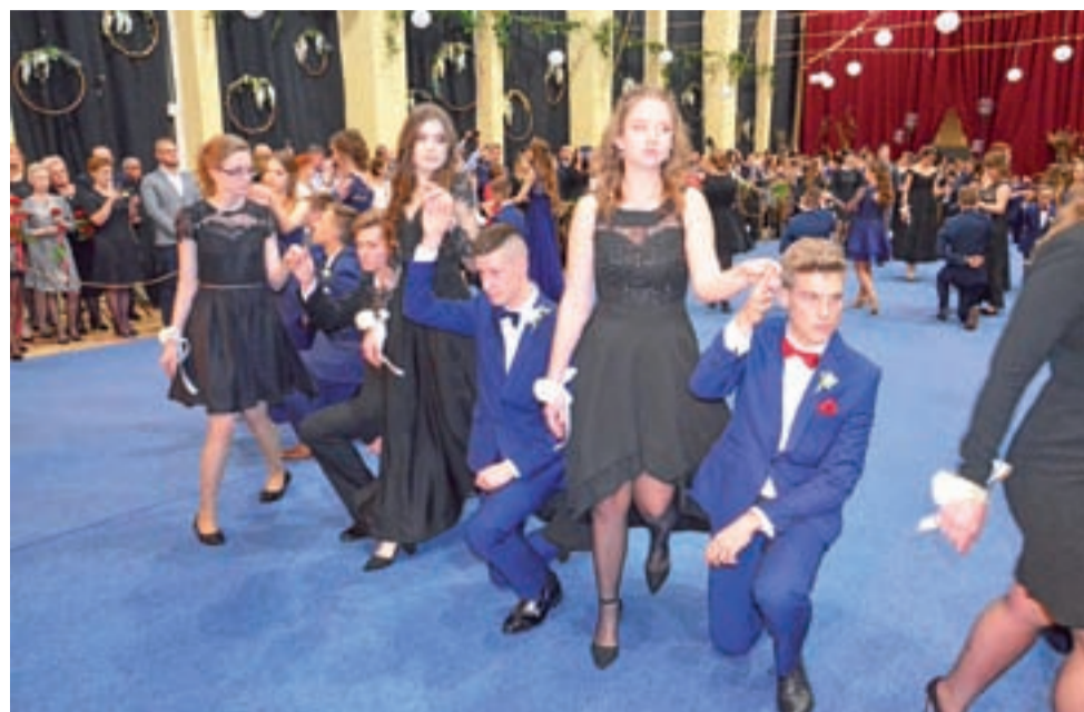
Maturzyści tańczyli na sali gimnastycznej, stąd też na parkiecie niebieska wykładzina, która miała zadanie chronić go przed zniszczeniem.

Łowicz | Studniówka licealistów w pijarskiej