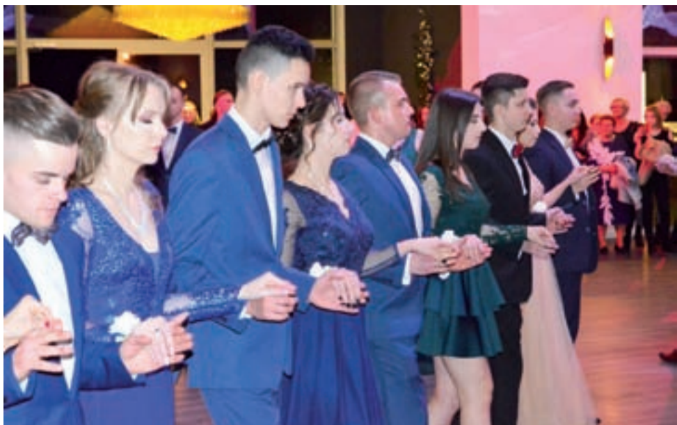
Uczniowie klasy IIIa LO w ZSP nr 4 w czasie poloneza.