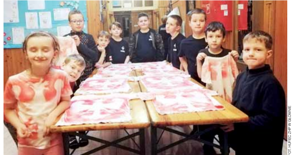
Każdy już koszulę z orłem na piersi nosi – zapewniają mali harcerze.

Dodajmy, że tematycznie wyjazd podporządkowany jest późniejszej wyprawie na Grunwald, bowiem Hufiec Główno przystąpił do zdobywania odznaki Grunwaldzkiej. – Chcemy dokonać wyczynu i uczcić przypadające w tym roku dwie istotne rocznice: 610.