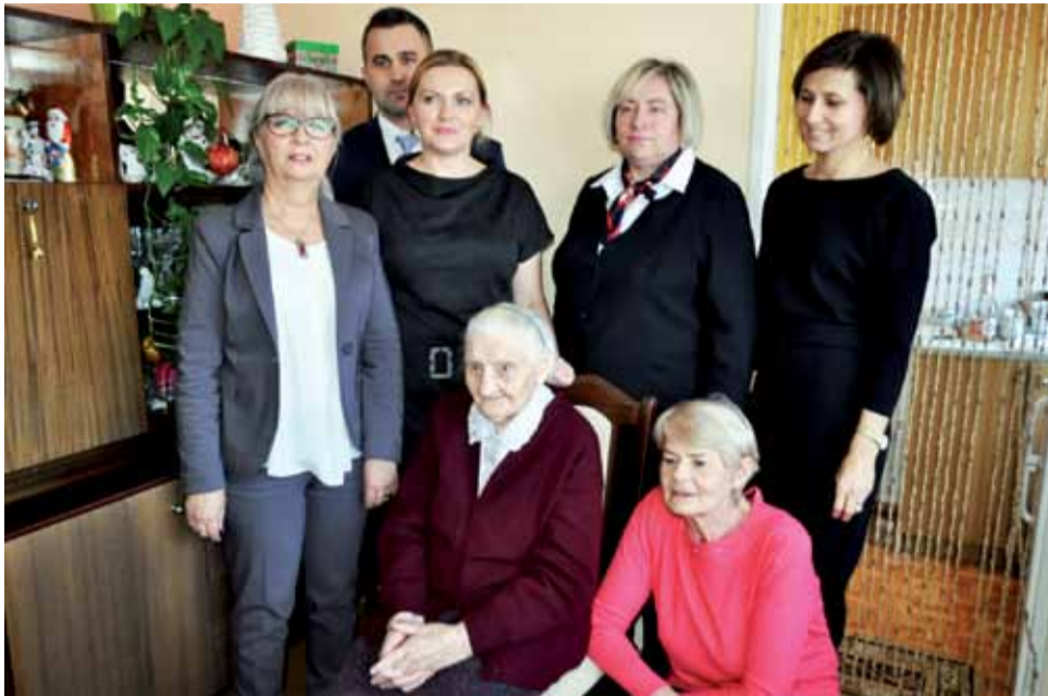
Jubilatka z córką i delegacją z gminy Chaśno i KRUS.

Najpierw wspólnie gospodarowali u męża, a po latach wrócili na gospodarstwo rolne po rodzicach jubilatki. – Na jednym gospodarstwie urodziło się troje dzieci (Ge-