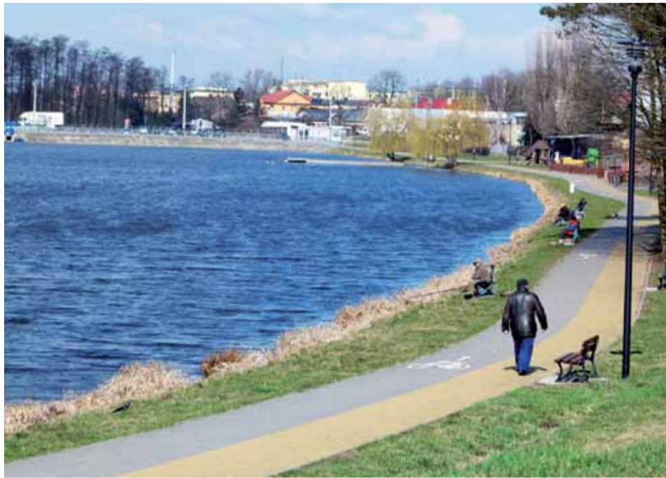
Zalew w Strykowie – widok od strony ul. Wczasowej. Otoczenie zalewu może być jeszcze bardziej atrakcyjne, ale najpierw potrzebne są prace w samym zbiorniku.

Burmistrz wyjaśnił, że potrzeba przeprowadzenia prac na zbiorniku podyktowana jest dwoma względami. Po pierwsze, już w tej chwili wiadomo, że potrzeb-