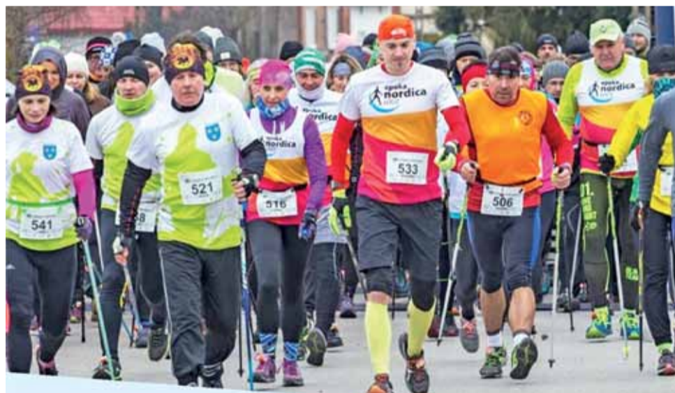
Start Marszu Nordic Walking. Już po raz siódmy w Dobrej odbędzie się taka forma rywalizacji sportowej. Uczestnicy będą mieli do pokonania dystans 6,5 km marszu z kijkami.

Organizatorem VIII Biegu Powstańca i VII Marszu Nordic Walking jest Stowarzyszenie Klub Biegowy Powstaniec, Ośrodek Kultury i Rekreacji w Strykowie, Gmina Stryków oraz Szkoła Podstawowa im. 24 lutego 1863 r. w Dobrej, gdzie tradycyjnie zloka-