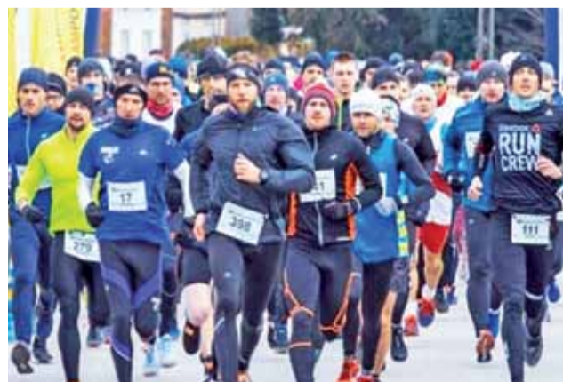
Uczestnicy Biegu Powstańca nie boją się mrozu, deszczu, wiatru, błota i śniegu. Do tej pory na trasie panowały już chyba każde możliwe warunki.

lizowane będzie biuro zawodów. Obok Biegu i Marszu, których trasy wytyczono w malowniczej scenerii Parku Krajobrazowego Wzniesień Łódzkich, w programie znajdują się również biegi dla dzieci i młodzieży oraz liczne atrakcje dla wszystkich uczestników imprezy. Po zawodach w szkolnej stołówce na uczestników będzie czekał ciepły posiłek, a po ukończeniu rywalizacji każdy otrzyma pamiątkowy medal. Parkingi zostały zlokalizowane na terenie szkoły i OSP w Dobrej oraz wzdłuż ulicy Wodnej i Witanówek. Poniżej szczegółowy harmonogram imprezy,