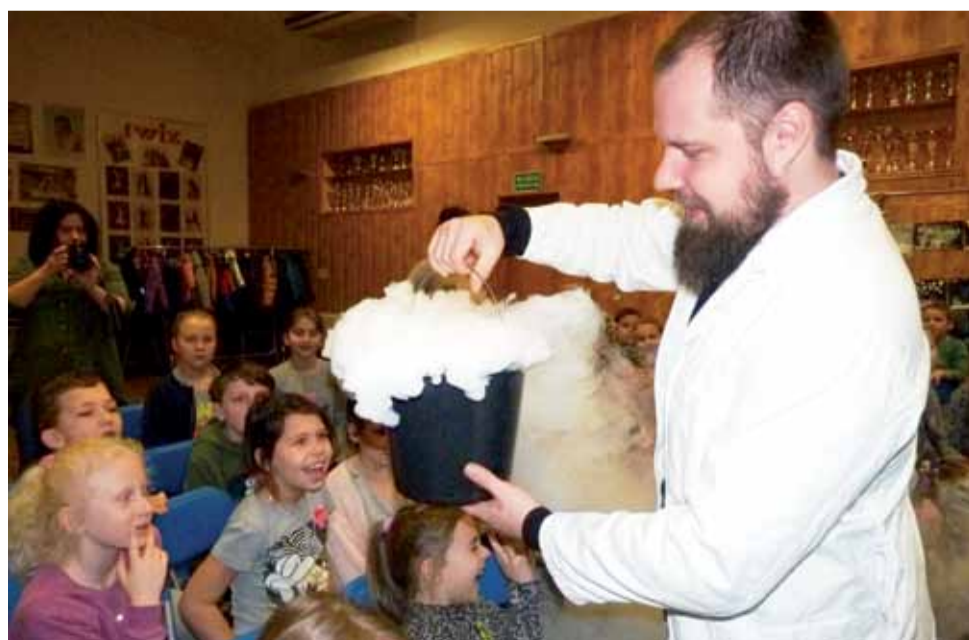
Dymiące wiadro wyczarowane przez magików z krakowskiej Famigi było jednym z wielu doświadczeń wzbudzających podziw ferioviwców.

przedmiotów, m.in. jarzeniówki. Za pomocą nadmanganianu potasu oraz barwników spożywczych ferioviwce zamienili wodę w kolorową ciecz, a wrzucając do niej suchy lód mogli się cieszyć dodatkowym spektakularnym efektem. W powietrzu unosiły się magiczne piteczki, a na głowach dzieci osiadały leciutkie jak piórko bańki. To tylko niektóre z niezwykłych doświadczeń wykonywanych dla małych strykowian przez magików z krakowskiej Famigi. Począwszy od prostych doświadczeń, które można samodzielnie wykonać w domu, a skończywszy na bardziej skomplikowanych, wykonywanych z użyciem specjalistycznego sprzętu, wszystkie budziły jednakowe zainteresowanie. str. 9