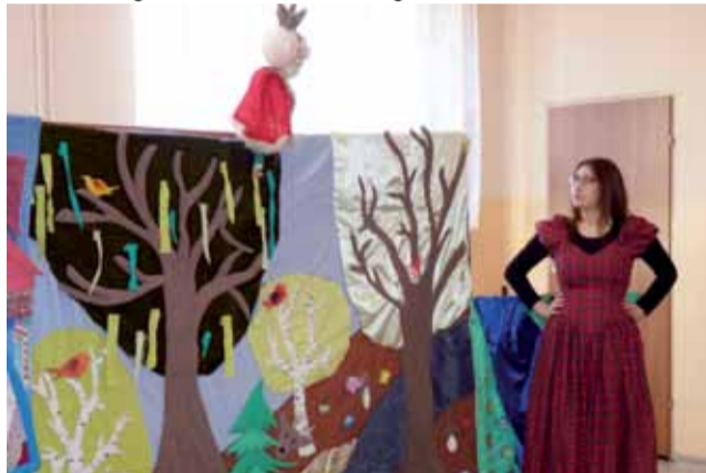
Bajkę o perypetiach z zaginionym szczęściem zaprezentowali najmłodszym aktorzy z białostockiego studia artystycznego Arlekin.

Bohaterka zaskarbiła sobie sympatię publiczności miłością i oddaniem, z jakimi troszczyła się o swojego dziadka – króla, szukając odpowiedzi na pytanie, gdzie