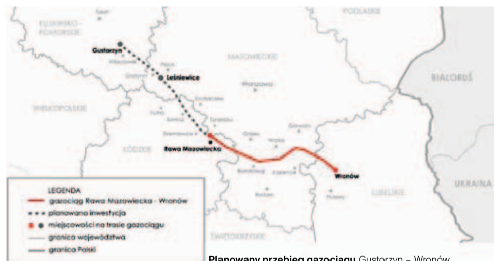
Planowany przebieg gazociągu Gustorzyn - Wronów.

bliższe lata, bo wraz z nowym gazociągiem planowana jest sieć nowych gazociągów w zachodniej, południowej i wschodniej części Polski.