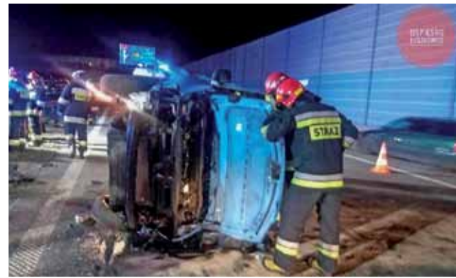
Nie da się przeliczyć na pieniądze ryzyka, jakim są dla strażaków wyjazdy na akcje (jak do wypadków na autostradę A2), ale nie ulega wątpliwości, że jednostkom należy się za to ekwiwalent.

Podkreślają, że nie jest ich zamiarem pobieranie ekwiwalentów do własnej kieszeni, ale przeznaczanie ich na utrzymywanie gotowości bojowej jednostki, szkolenia, zakupy, naprawy i inne wydatki związane z jej funkcjonowaniem.