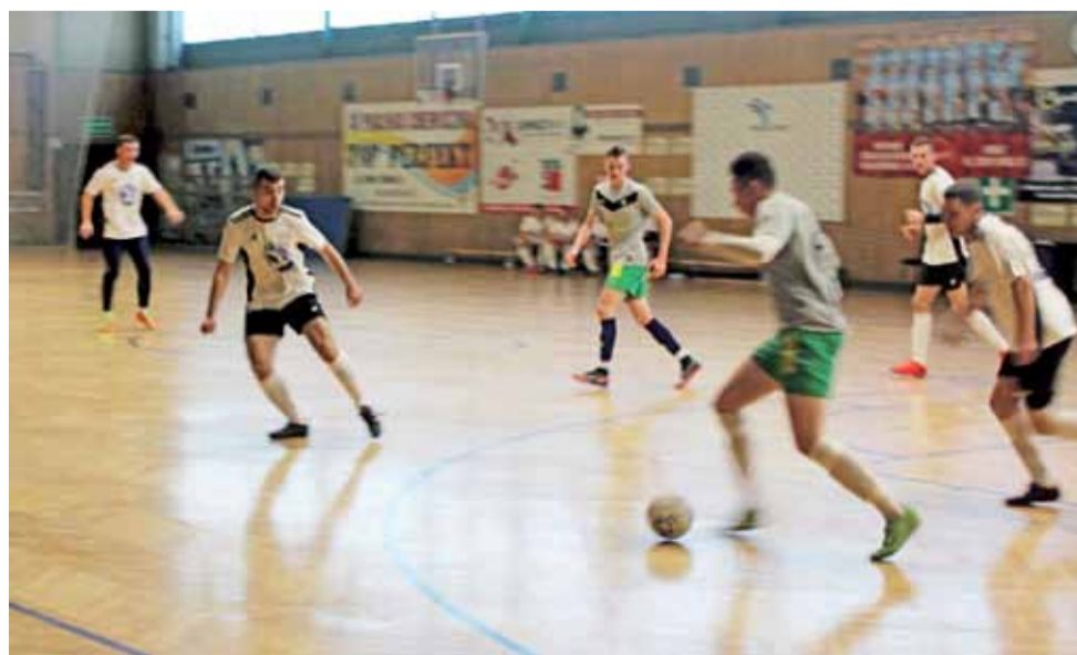
Rozgrywki w łowickiej hali OSiR z udziałem drużyn Zina III Ligi ŁoLiF są jednymi z najbardziej zaciętych.

1. Mal-Bud Łowicz 6 18 23-5 2. Bezedura Łowicz 7 16 21-13 3. Vagat Domaniewice 6 13 18-11 4. OSP Seligów 7 12 15-13 5. FC Jeziorko 7 12 16-17 6. Mikoba United Kiewków 6 11 15-9 7. Start Złaków Borowy 6 10 18-14 8. Kolejarz Łowicz 6 10 19-16 9. Imprezowy Klimat Zielkowice 7 9 12-20 10. Victoria Zabostów 6 7 13-16 11. Fenix Boczki Chelmońskie 6 3 15-23 12. OSP Soccer Stachlew 7 0 8-21 13. Olimpia Junior Chąšno 7 0 11-25