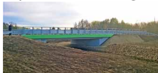
Nowy most w Smolicach budowało Warszawskie Przedsiębiorstwo Mostowe Mosty Sp z o.o., Budownictwo Sp. komandytowa.

Przebudowa mostu polegała na całkowitej rozbiórce istniejącego i wybudowaniu w jego miejscu nowego obiektu. Łączny koszt to 1.798.164,06 zł, z czego 50% zostanie dofinansowane z FDS.