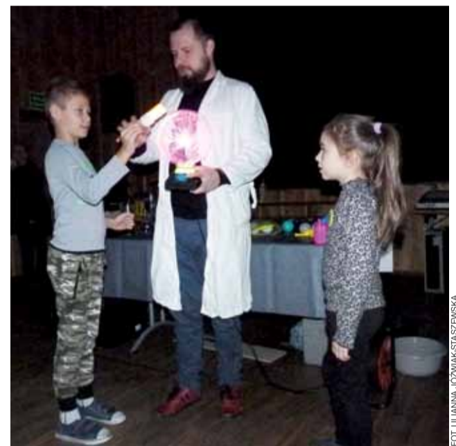
Przy użyciu kuli plazmowej najmłodszy sprawdzali właściwości elektromagnetyczne różnych przedmiotów, m.in. jarzeniówki.

Podobnie było ze wszystkimi zajęciami, jakie podczas tegorocznych ferii proponowały dzieciom Dom Kultury i Gminna Biblioteka Publiczna, a były to również m.in. zajęcia z robotyki, zajęcia kulinarne czy malowanie biżuterii. Niemal codziennie na zajęcia zgłaszał się komplet chętnych, a czasami nawet ich ilość przekraczała możliwości lokalowe organizatorów. Jutro, 24 stycznia, czyli na zakończenie, wystawione zostanie przedstawienie teatryku, w którym zagrają sami feriiowicze, a później odbędzie się tradycyjny już bal karnawałowy dla najmłodszych. ijs