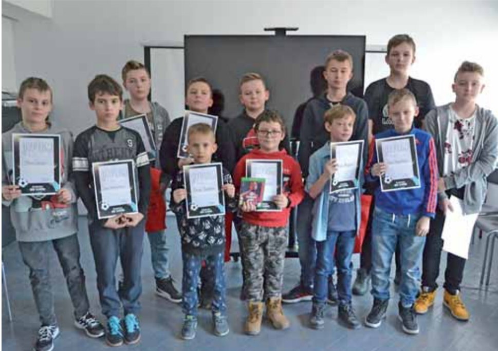
Uczestnicy turnieju FIFA na zakończenie otrzymali pamiątkowe dyplomy.