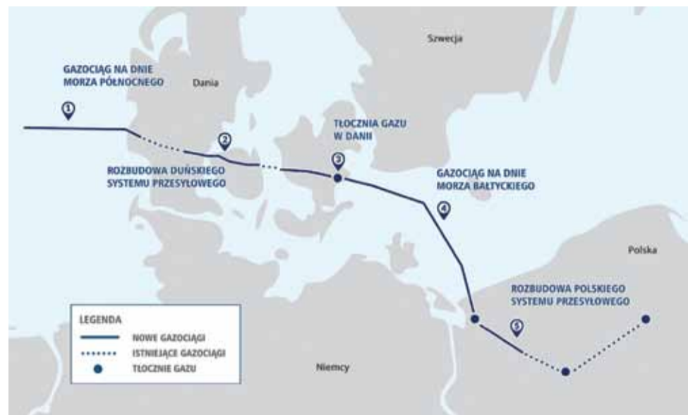
Projekt Baltic Pipe na mapie poglądowej spółki Polski Gaz.

Na głównym projekcie Baltic Pipe nie kończą się plany inwestycyjne Gaz Systemu na naj-