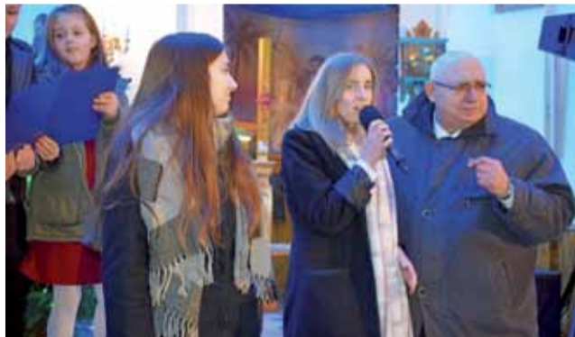
Piosenka finałowa, śpiewana przez wszystkich uczestników.