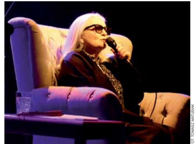
Magda Umer zaprezentowała w Łowiczu to wszystko, za co cenią ją fani, płynnie przechodząc pomiędzy anegdotami i żartobliwymi piosenkami a nastrojową, melancholijną poezją.

Warto dodać, że w tym roku Magda Umer świętuje 50-lecie debiutu na scenie. Z publicznością sobotniego koncertu podzieliła się wspomnieniami z początku drogi