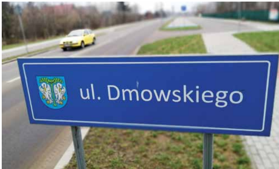
Tablica z nazwą ul. Romana Dmowskiego wydaje się być na tyle duża, że imię też powinno się zmieścić.

Podniósł on w niej kwestię skrótów używania na tablicach z nazwami ulic w sposób jego zdaniem nieuzasadniony. Podał przykład jednej z nowszych ulic, gdzie na tablicy widnieje tylko nazwisko patrona – „ul. Dmowskiego” a winno być „ul. Romana