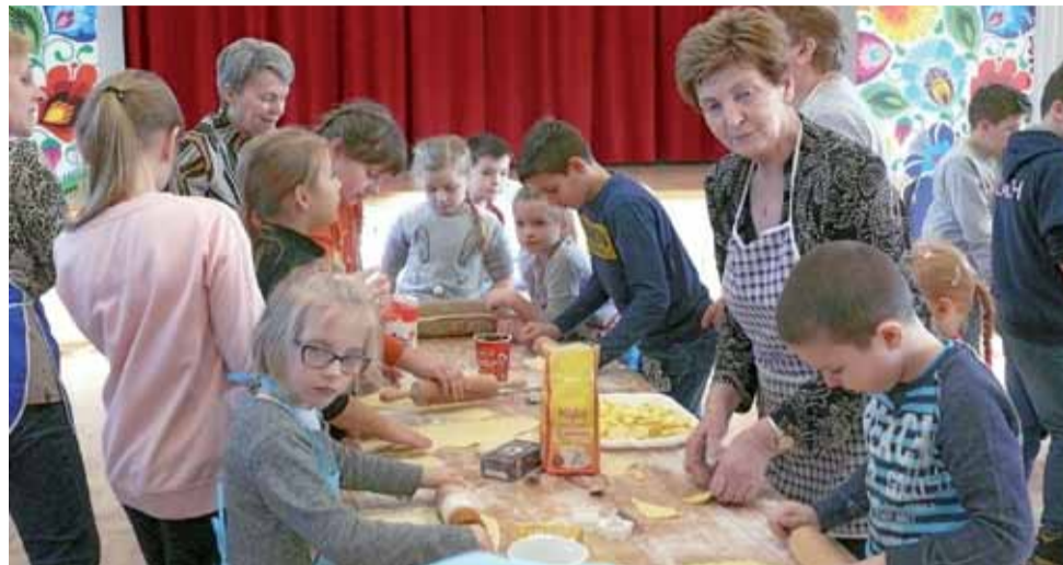
– Dziś się pouczymy, a przepisy zabierzemy do domu, żeby dalej ćwiczyć – mówili uczestnicy.

To zajęcie dla dzieci w każdym wieku. Ciasteczka są dość proste w wykonaniu, więc przy odrobinie pomocy każdy maluch sobie poradzi.