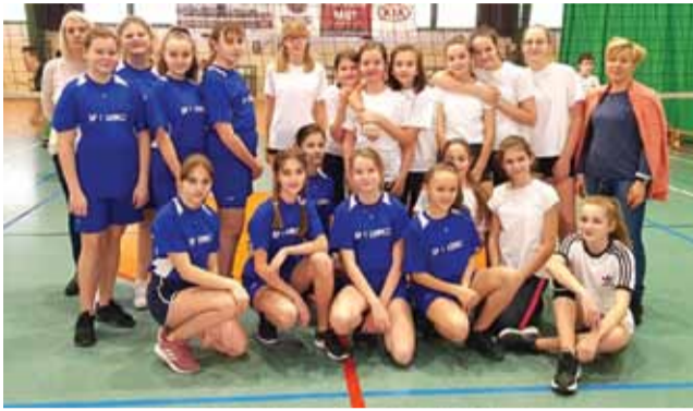
O mistrza Łowicza zagrały tylko Jedynka i Dwójka.