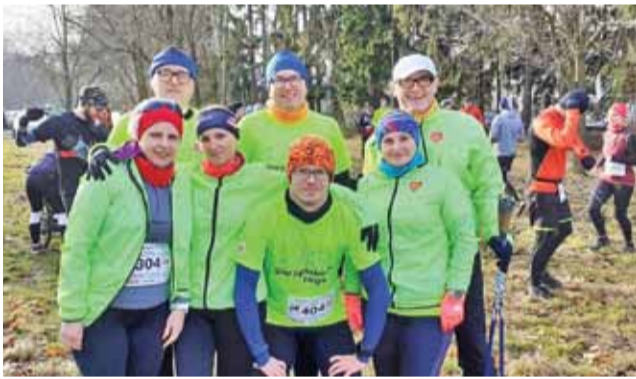
Ekipa ze Starzyńskiego Biega lubi pobiegać po łódzkich górkach.