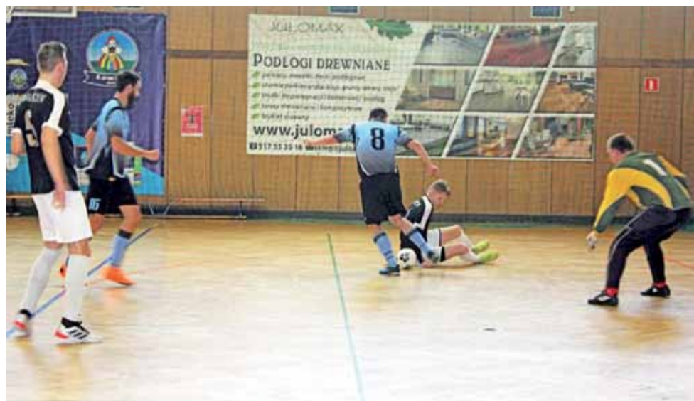
Głowieńscy piłkarze Nieobliczalnych (niebieskie koszulki) nie mogą odnaleźć zwycięskiej drogi.

6. Chińska Haczykowsky Łowicz 11 11 33-44 7. Błękitni II Dmosin 11 9 30-33 8. Bo-Dach Grudze 10 6 29-30 9. Blokery Łowicz 10 6 33-43 10. Victoria Bielawy 11 4 15-58