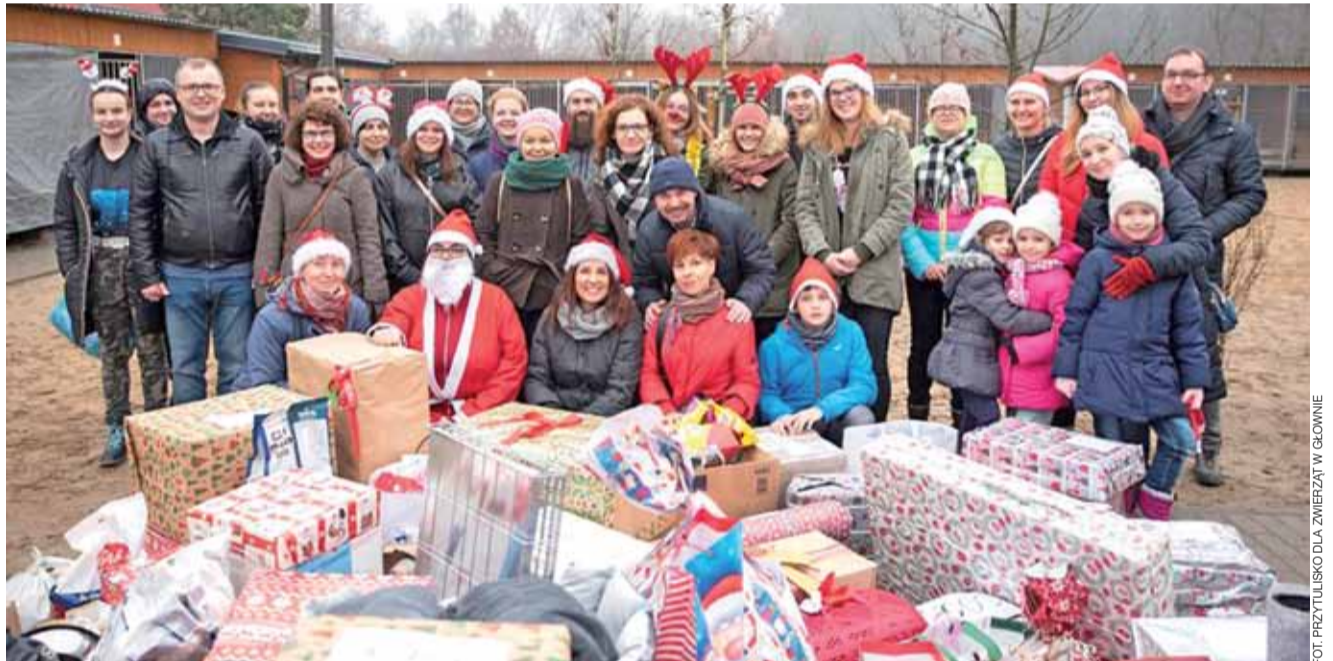
Góra prezentów i świąteczny klimat – tak finał akcji „Paczka dla Zwierzaczka” zapamiętają ci, którzy się w nią włączyli.

– Dla naszej organizacji każda pomoc jest ważna, dlatego nawet najmniejszy gest ze strony miłośników czterech łap jest dla nas na wagę złota. Dzięki tej akcji zwierzętom, które zmuszone są na po-