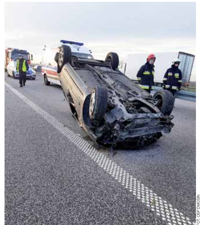
Samochód zatrzymał się na dachu.

– Generalnie widać poprawę, ale nadal jest co robić – podkreśla rzecznik. aw