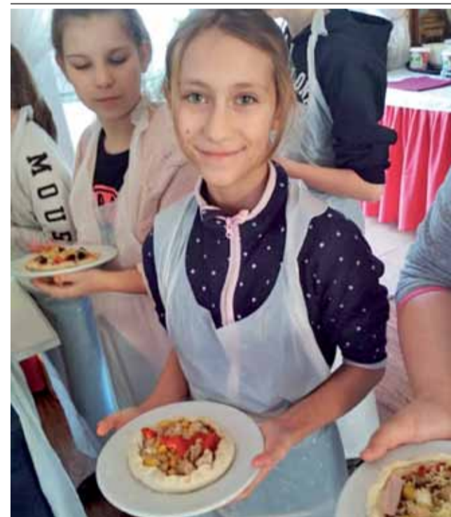
W wycieczce niespodziankę wzięli udział uczniowie Szkoły Podstawowej w Kocierzewie Południowym, którzy osiągnęli najwyższą średnią ocen za I półrocze. W czwartek, 16 stycznia, pojechali oni w nagrodę do Karczmy Bednarskiej, by wziąć udział w warsztatach, w czasie których samodzielnie wykonywali pizzę według własnego przepisu oraz ze smakiem ją zjedli. – Patrząc na puste talerze należy stwierdzić, że pizza była bardzo smaczna, a uczniowie zdobyli nowe umiejętności kulinarne – relacjonują organizatorzy. aa