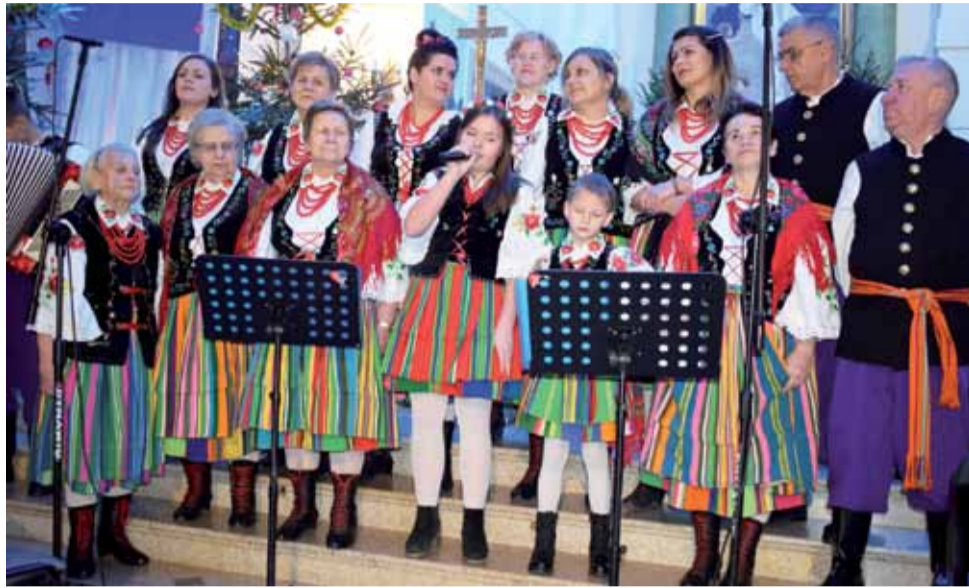
Grzybowianki i Grzybowiaci rozpoczęli koncert od mocnego, ludowego akcentu.