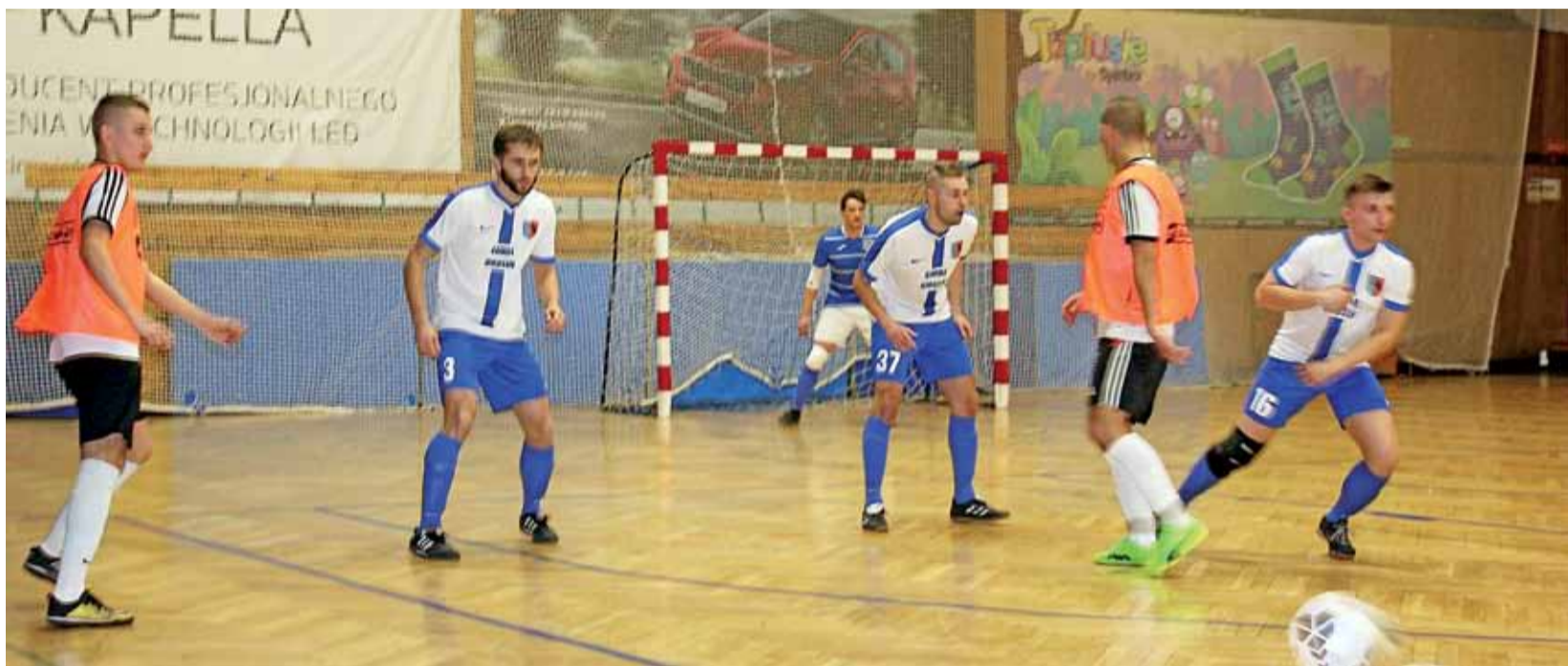
Mecz Błękitnych I Dmosin (biało-niebieskie stroje) i Fantazji Głowno toczył się tylko do jednej bramki. Głownianie wygrali aż 6:0 i nadal pozostają w grze o podium w rozgrywkach XXVII edycji KIA Open I Łowickiej Ligi Futsal.

Z kolei w grupie spadkowej do końca trwać będzie walka o utrzymanie. Miłowy krok w tym kierunku poczynili piłkarze halowi z Dmosina. Błękitni II po emocyjnym meczu pokonali 6:4 Blokery Łowicz, choć do przerwy przegrywali 1:2. Do zwycięstwa