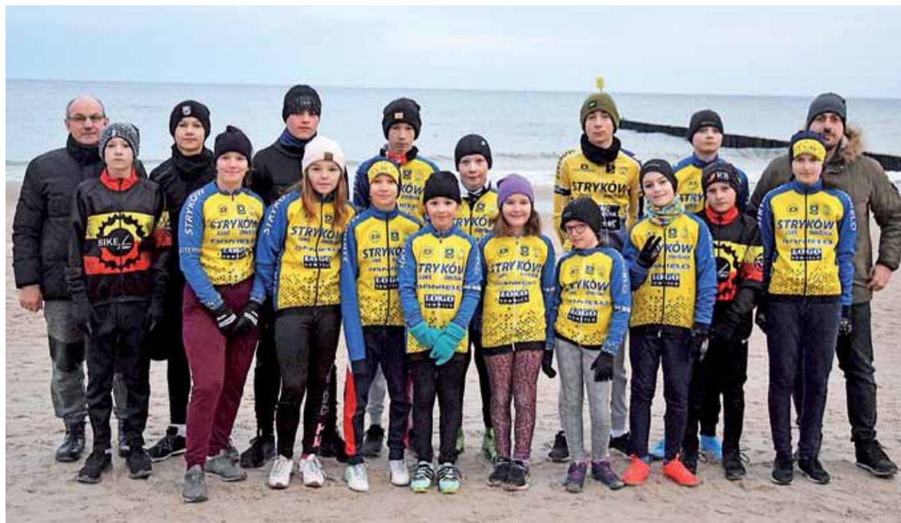
LUKS Dwójka Stryków podczas zimowego obozu przygotowawczego do sezonu 2020 czas spędzał nad Morzem Bałtyckim w Kołobrzegu.

16-tka uczestników kołobrzegskiego zgrupowania podzielona była na dwie grupy. Starsi trenowali na rowerach szosowych, a młodszy na rowerach górskich. Wszyscy mieli jeden cel – podnieść wytrzymałość tlenową, która będzie stanowiła dla nich bazę do dalszego etapu przygotowań i mieć fundamentalne znaczenie podczas całego sezonu.