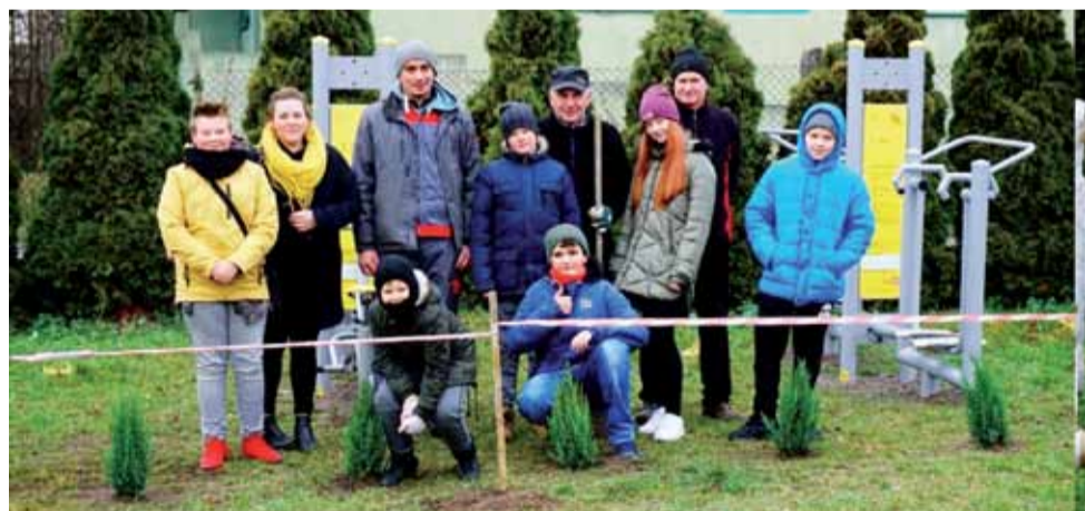
Sport i rekreacja królować będą dzięki nowym siłowniom pod chmurką. Dzięki zaangażowaniu mieszkańców okolice nowych obiektów się zazieleniły.

Na zakończenie przygotowano „Literackie szarady nie od parady”, czyli zabawy czytelnice. Odbędą się one dziś, 23 stycznia, o godzinie 11.00. Wstęp wolny. aw