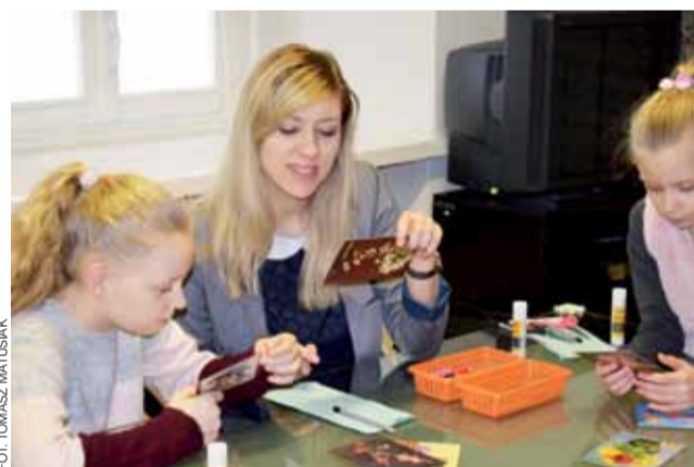
Najpierw uczestnicy obejrżeli oryginalne karty pocztowe, w których szukali inspiracji dla własnych prac, wykonywanych w części warsztatowej.