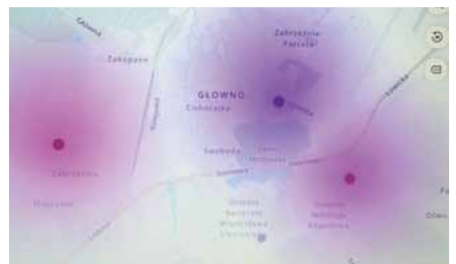
Jakość powietrza w Głownie w czwartek, 16 stycznia, w godzinach wieczornych. Ciemny kolor świadczy o bardzo złej jakości powietrza.