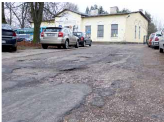
Tak wygląda nawierzchnia, którą każdego dnia jeżdżą setki samochodów oraz autobusy zastępcze ŁKA.

Znają go mieszkańcy osiedla oraz liczni pasażerowie ŁKA, którzy zmuszeni są korzystać z tego przystanku z powodu pro-