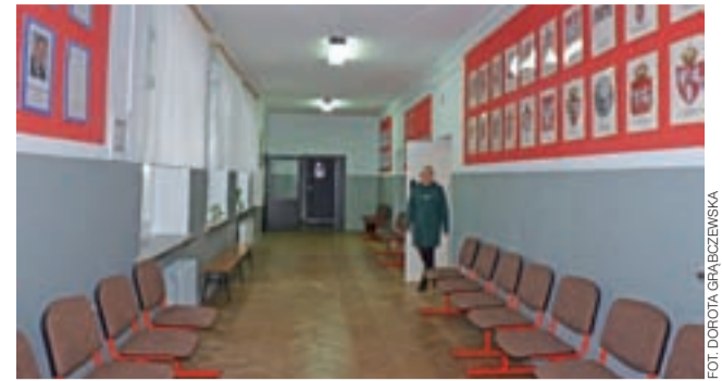
Szkolne korytarze są teraz w tonacji szarości.

Zdaniem Barbary Sitkiewicz kwota 10.000 zł pozwoliłaby, aby raz w roku wysłać pracowników na szkolenie. Na razie żadne decyzje w tej sprawie nie zapadły. W budżecie MGOPS, póki co, nie ma środków na szkolenia. dag