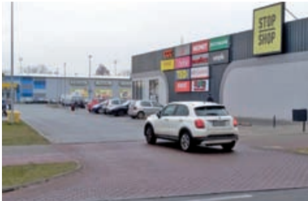
To na tym skrzyżowaniu doszło do kolizji. Nie pierwszej, oby ostatniej.

Tajemnicą poliszynela jest, że nocą na tym parkingu (podobnie jak na parkingu za ratuszem) zbiera się wieczorami i nocą zmortyzowana młodzież. Zapewne jeszcze nie raz będziemy pisali o zdarzeniach drogowych w tym rejonie. Na była to zresztą pierwsza kolizja w tym rejonie. mak