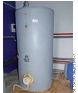
17-letni bojler na ciepłą wodę w Zespole Szkół nr 1.

– Na szczęście zadziałały systemy bezpieczeństwa i prąd w pomieszczeniu został automatycznie odcięty – mówi Janusz Głuszczyk, p.o. dyrektora ZS nr 1 w Żychlinie. – Okazało się, że po latach eksploatacji rdza przeżarła dno bojlera. Dno odpadło, zalewając pomieszczenie. Zwróciłem się do burmistrza o zabezpieczenie środków na zakup nowego bojlera.