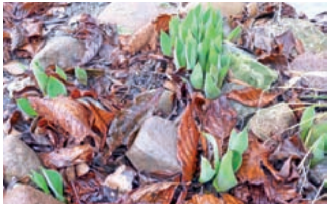
Tulipany już dawno wyszły z ziemi. Mają 10 cm wysokości. Zwykle kwitną koniec kwietnia początek maja

Gdyby jednak policzyć dochody gmin na podstawie 1 mln zł za km gazociągu, o którym mówił projektant, to w 2024 roku gmina Żychlin, która ma 12,6 km gazociągu mogłaby liczyć na dodatkowy dochód w wysokości 252.000 zł rocznie, gmina Oporów za 5 km gazociągu mogłaby otrzymywać 100.000 zł rocznie, a gmina Bedlno za 1,2 km gazociągu otrzymywałaby 24.000 zł rocznie. Dorota Grąbczewska