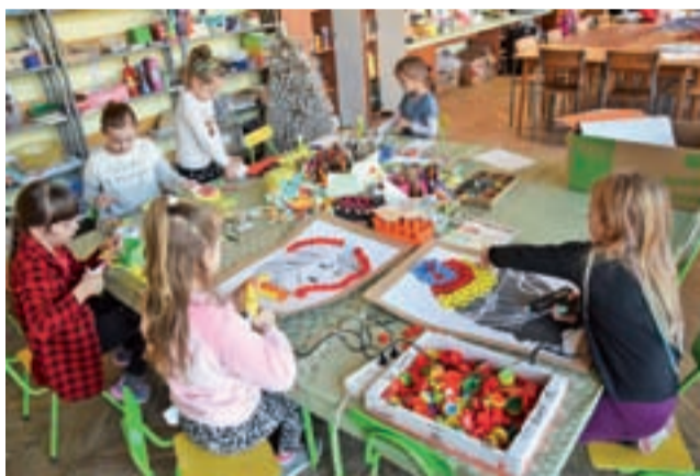
Podczas zajęć plastycznych dzieci wykorzystują kolorowe zakrętki od butelek.

Do wymiany pozostało jeszcze kilkanaście drzwi wejściowych do klas, do sekretariatu, które wciąż przypominają czasy z lat 80-tych. dag