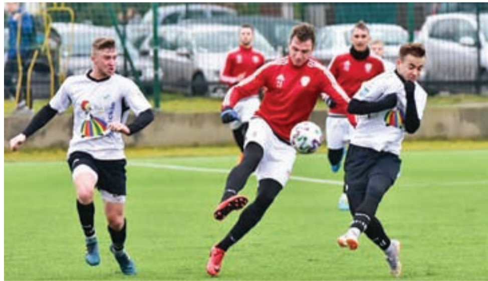
Łowiczanie dwukrotnie obejmowali prowadzenie, ale nie potrafili go utrzymać.