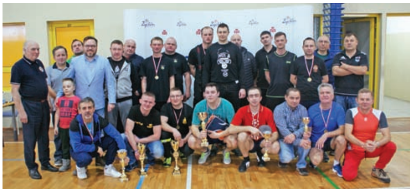
Uczestnicy drugiej edycji Turnieju Tenisa Stołowego Ochotniczych Straży Pożarnych RP w Żychlinie.

Również pucharami nagrodzono pierwszych czterech zawodni-