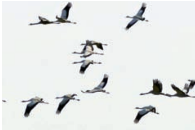
Klucze żurawii w Dolinie Słudwi i Przysowy.