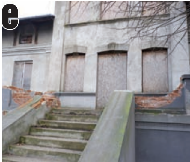
Stylowy dworek przy ul. Narutowicza 61 jest systematycznie dewastowany.

Urząd Gminy w Żychlinie kompletuje materiał dowodowy niezbędny do złożenia wniosku o zasiedzenie.