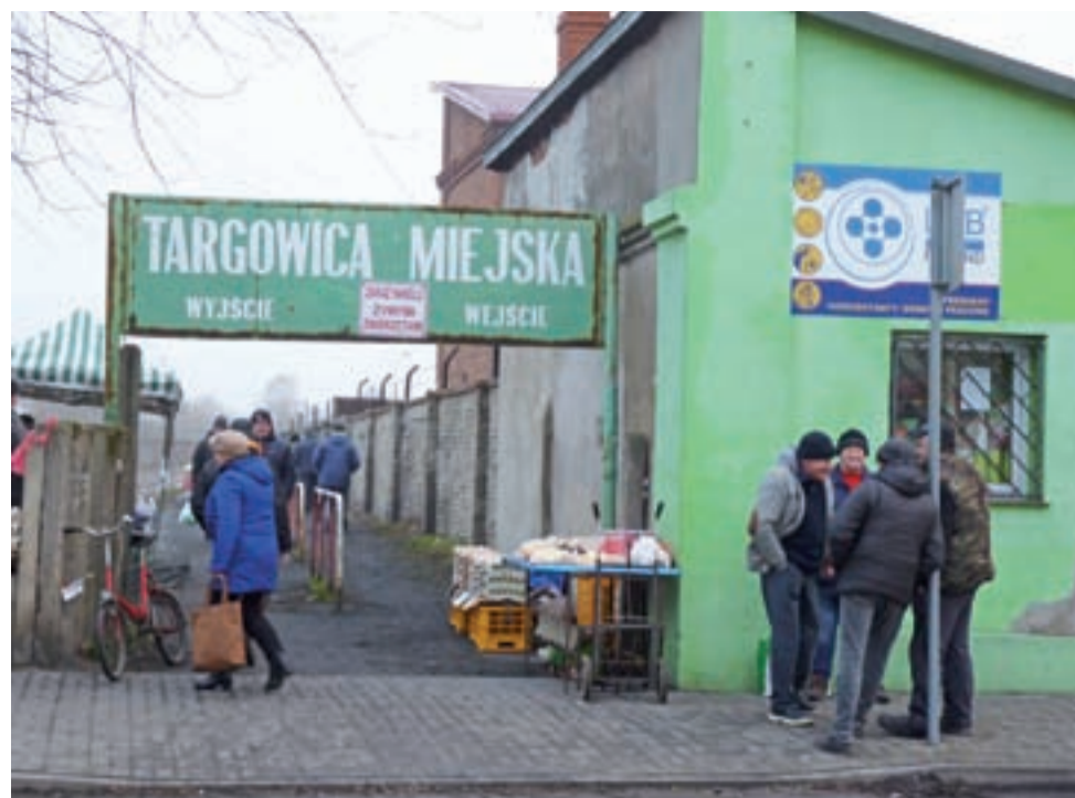
Mieszkańcy dopominają się modernizacji miejskiej targowicy. Od kilku lat kończy się tylko na obietnicach.

Na przestrzeni lat widać, że targowisko zaczyna przynosić coraz mniejsze dochody.