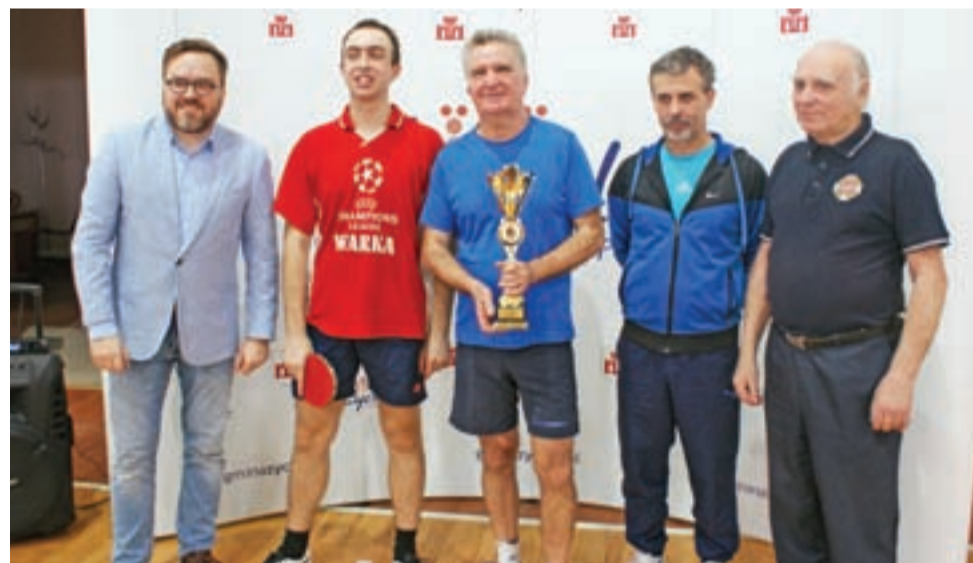
Zwycięska drużyna OSP „Cukrownia” Dobrzelin podczas II Turnieju Tenisa Stołowego Ochotniczych Straży Pożarnych, rozegranych w Żychlinie.