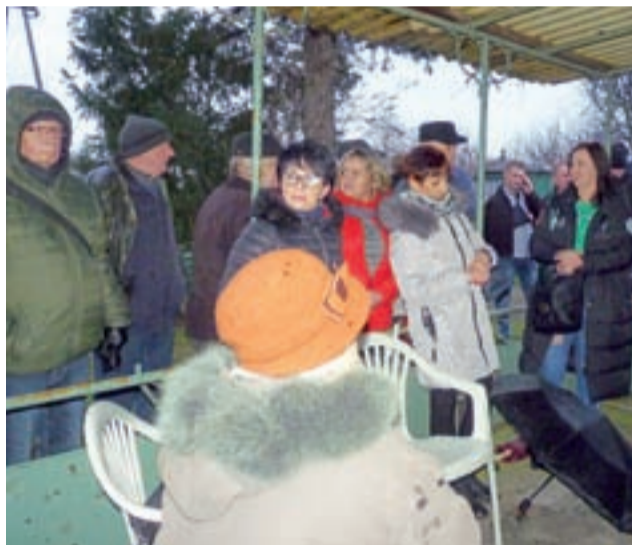
We wtorek o godz. 17.00 działkowcy z Ogrodu nr 5 spotkali się u jednego z działkowców, by rozmawiać o przyszłości ogrodu.

kowcy zaniepokojeni sytuacją – mówi nam Włodzimierz Kęsicki, prezes Emitu. – Pokazałem działkowcom pismo wystosowane 2 grudnia 2019 roku (przyjęte przez prezesa Banasiaka 9 grudnia 2019 r. – przyp. red.) i wyjaśniłem nasze stanowisko i dlaczego chcemy od działkowców opłaty za dzierżawę gruntu pod ogrodami.