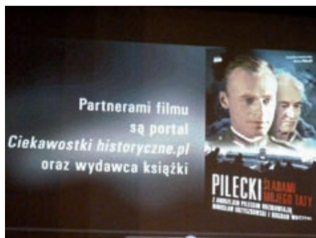
Film Pilecki to autobiografia człowieka, który całe życie walczył o wolną Polskę.

90-tych nikt nie chciał w Polsce słyszeć o Pileckim. Zebrała się jednak grupa młodych ludzi zafascynowanych tą postacią. Założyli stowarzyszenie Auschwitz Memento, zbierali pieniądze, by w 2000 roku najpierw wydać książkę, a w 2014 roku nakręcili film biograficzny o Pileckim. Darczyńcy przekazali nam na zrobienie filmu 200.000 zł. Teraz go prezentujemy w różnych częściach Polski. Wy żyjecie w kraju