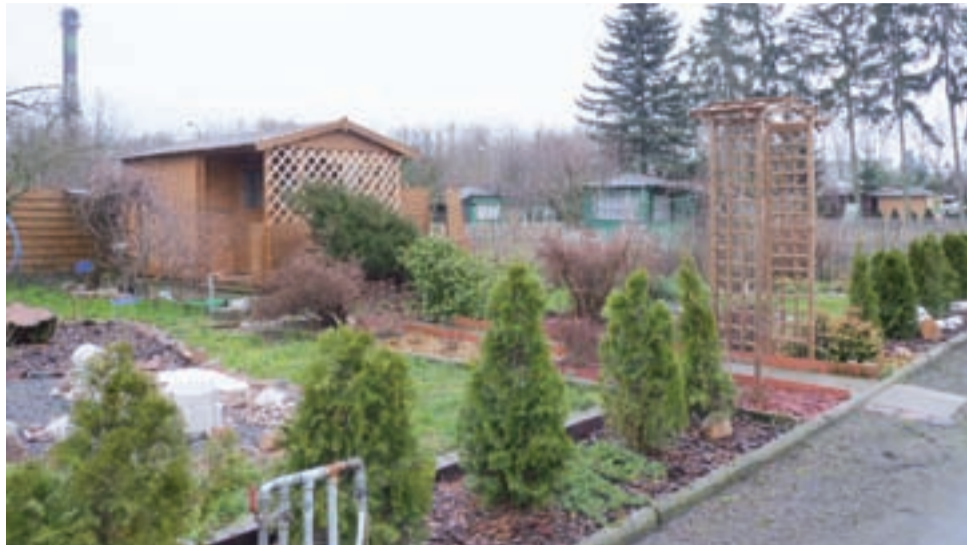
50 lat temu Emit dał ludziom niezagospodarowany teren pod ogrody działkowe. Teraz dla wielu to oaza spokoju i odpoczynku, zielone płuca Żychlina. Powstały ich wysiłkiem.