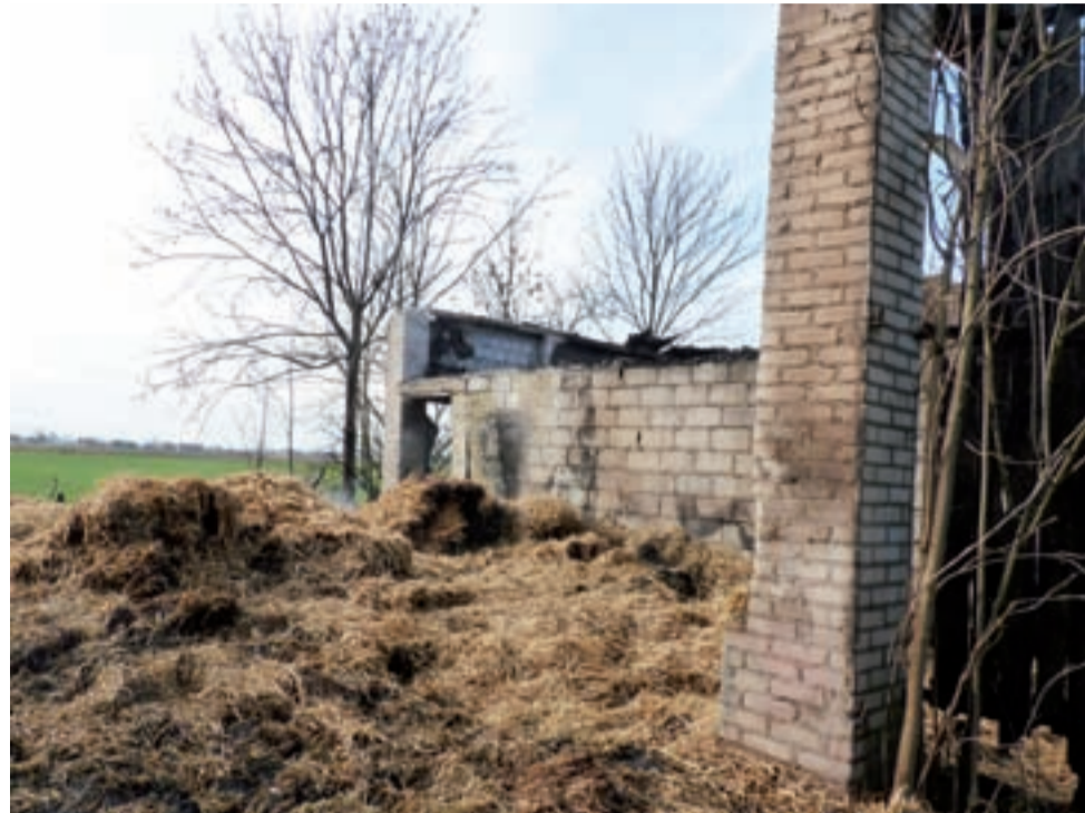
W niedzielę, 1 marca słoma na pogorzelsku sprzed tygodnia znów się paliła.

– Podczas spotkania dowiedzieliśmy się od komendanta policji, że podpalenia w gminie Bedno są traktowane jako priorytetowe