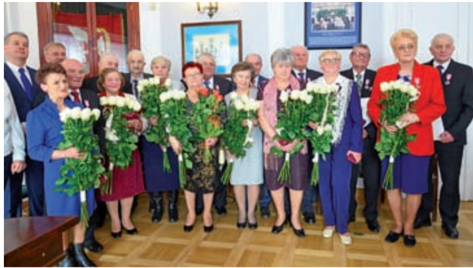
Pary małżeńskie pozują do wspólnego zdjęcia z uroczystości Złotych Godów w ratuszu.

Codziennie bycie ze sobą to też codzienna praca i codzienne „docieranie się” wciąż od nowa.