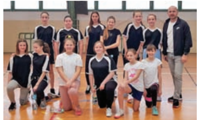
Dziewczyny z Siódemki najlepsze w Łowiczu.

Zespoły zagrały systemem „każdy z każdym” a w decydującym meczu reprezentacja SP 7 Łowicz pewnie pokonała ekipę dziewcząt ze Szkoły Podstawo-