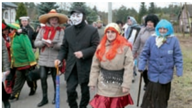
Doroczny korowód widać było z daleka.

Korowód od wielu lat łączy społeczność lokalną, pojawiając się każdego roku w innej miejscowości. Tym razem zapustnicy odwiedzali mieszkańców Dzierżgówka, błogosławiąc im i zapraszając do wspólnej zabawy. Uczestnicy, których tego dnia spotkał nasz reporter podkreślali, że w ten sposób wracają do atmosfery zapustów z przeszłości