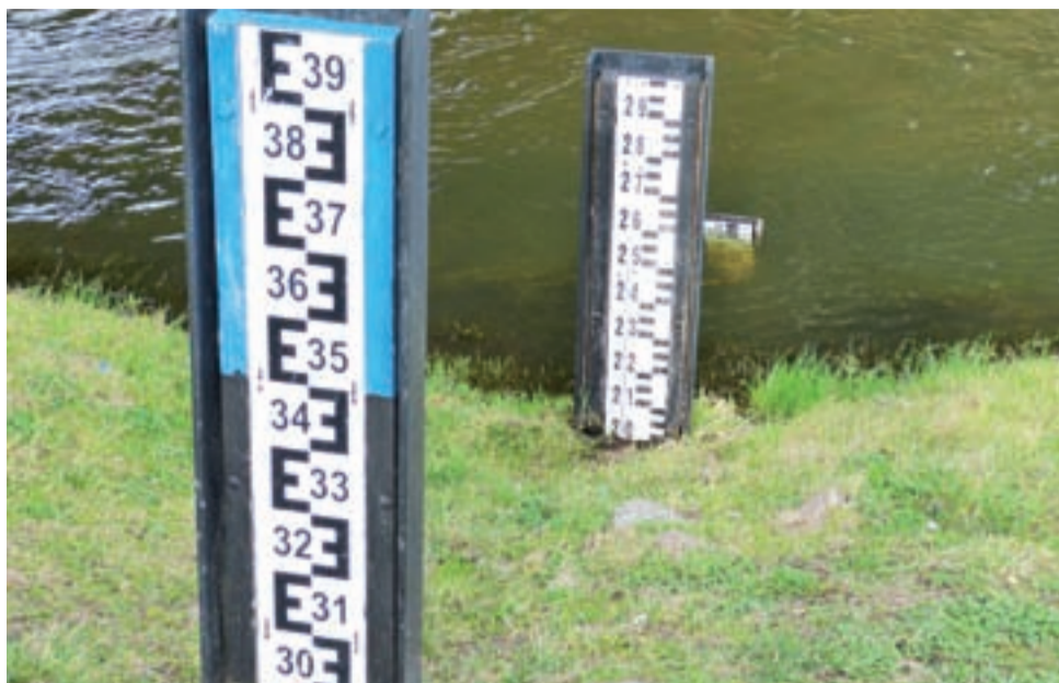
Zwykle wiosną te wodowskazy stały w wodzie.

Pamiętamy jednak, jaki był poziom wody w Bzurze w latach wilgotnych, kiedy czymś normalnym było jej wylewanie się z koryta.