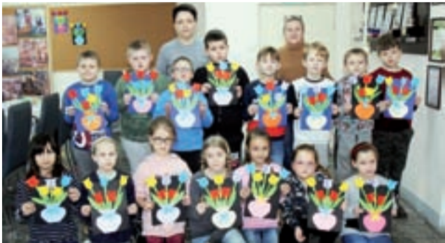
A tak wyglądał efekt warsztatów w GOK w Kiernozi: powstały barwne prace, przedstawiające tulipany w wazonie.