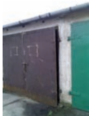
Ktoś odciął zawiasy wrót garażowych przy Żeromskiego.

Poprosiliśmy rzecznika KPP w Kutnie, by ustaliła szczegóły obu zdarzeń, które nie uszły uwadze mieszkańców. Rzeczywiście, było włamanie do garażu przy ulicy Żeromskiego, uszkodzony był również znajdujący się tam samochód, ale właściciel nie chciał ścigania sprawcy – mówiła nam wczoraj Edyta Machnik, rzecznik KPP w Kutnie.