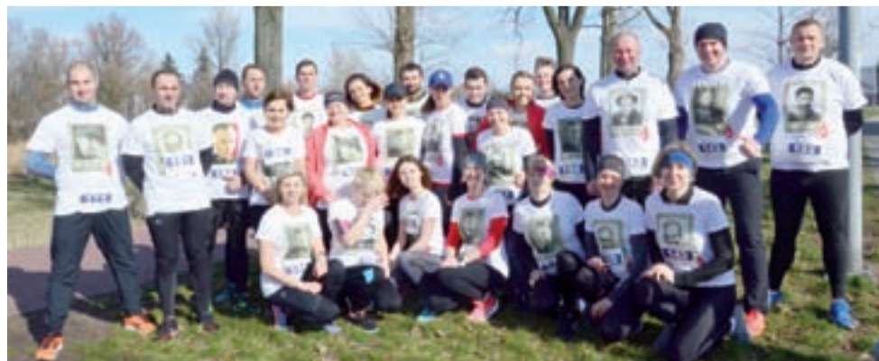
Łowicki bieg na 5 km okazał się świetną opcją dla 30-osobowej ekipy z klubu Running OSP Polesie.