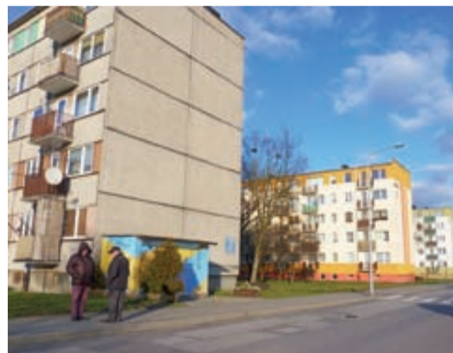
W tym roku termomodernizacji ma być poddany blok Łąkowa 3. Wcześniej docieplono bloki Łąkowa 5 i 7.

Ofertę będą mogli przystąpić do przetargu jeśli do godz. 12.00 w dniu 31 marca wpłacą wadium