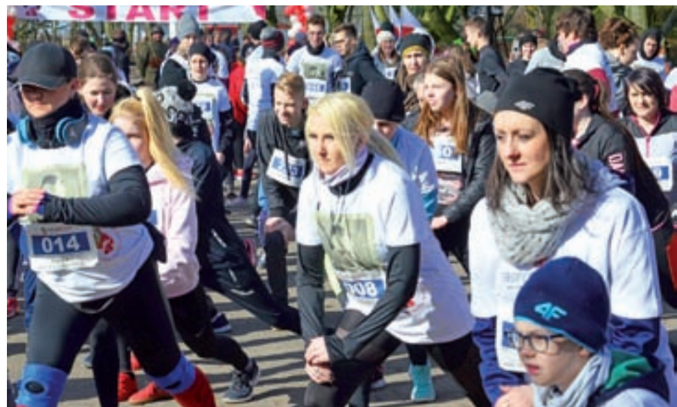
Aż 270 osób wzięło udział w biegu „Tropem Wilczym zorganizowanym 1 marca w Zdunach.

To był jeden z wielu biegów w całym kraju, upamiętniających Żołnierzy Wyklętych. Na zdjęciu: rozgrzewka przed biegiem. Więcej – str. 16