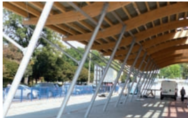
Wiata na targowisku. Gdyby była tańsza, opłata też byłaby niższa.

czynszu rynkowego to miasto miałyby możliwość odliczenia od wartości inwestycji 23% podatku VAT. Wynajęcie jednak budynku o pow. 900 m 2 klubowi po cenach rynkowych, może oznaczać koszt w wysokości kilkunastu tysięcy złotych miesięcznie. Dlatego w ratuszu rozważane ma być zwiększenie dotacji dla Pelikana, aby wyrównać poniesione w straty. Radny Robert Wójcik mówi jednak, że to wątpliwe rozwiązanie, bo to co miasto zaoszczędzi – wyda na zwiększoną dotację. tb