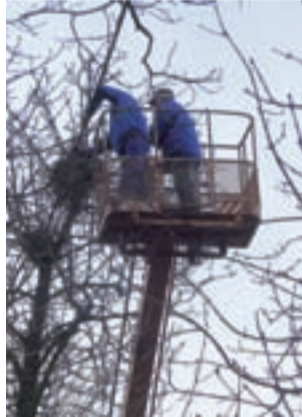
Wzdłuż alei kasztanowej zrzucano ptasie gniazda.

Prace wykonywane są do końca lutego, gdyż tylko w tym terminie są dopuszczalne. Spółdzielnia robi to od kilku lat, gdyż ptasich gniazd na drzewach było tak dużo, że trudno było przejść kasztanową aleją, aby na głowie lub ubraniu nie wylądowały ptasie odchody.