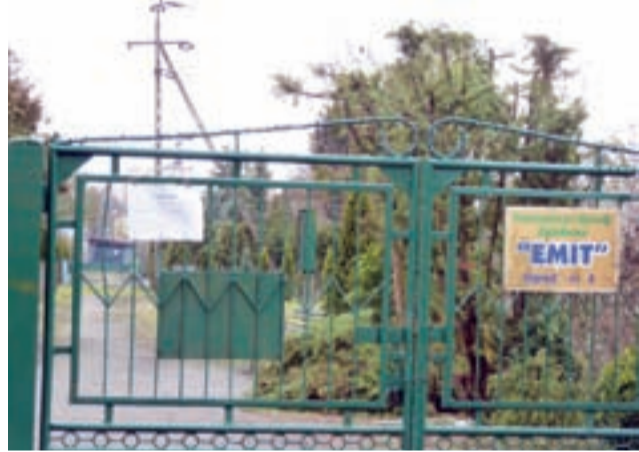
Za tą bramą kilkudziesięciu działkowców znajduje zajęcie – i odpoczynek.

Żychlin | Spółdzielnia Mieszkaniowa Wspólny Dom