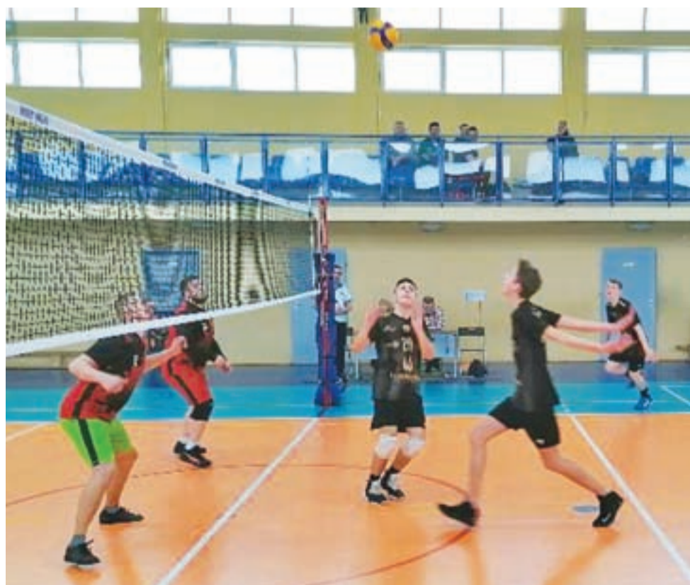
Drużyna Akademii Siatkówki Żychlin podczas sobotnich rozgrywek II ligi piłki siatkowej mężczyzn KALS wygrała dwa spotkania 2:0 przeciwko Grodzkiej Łęczyczy i Januszom Siatkówki, niestety przegrała 1:2 z UKS Rutki Płońsk.