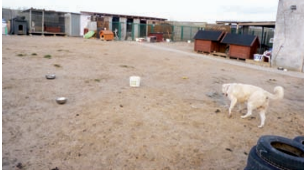
Dotychczasowy azyl stowarzyszenia 4 Łapy Żychlin, znajdujący się koło oczyszczalni ścieków, jest już za mały. Stowarzyszenie chce budować nowy, większy.

– Dzięki współpracy z Fundacją Młodzi Młodym, od ubie-