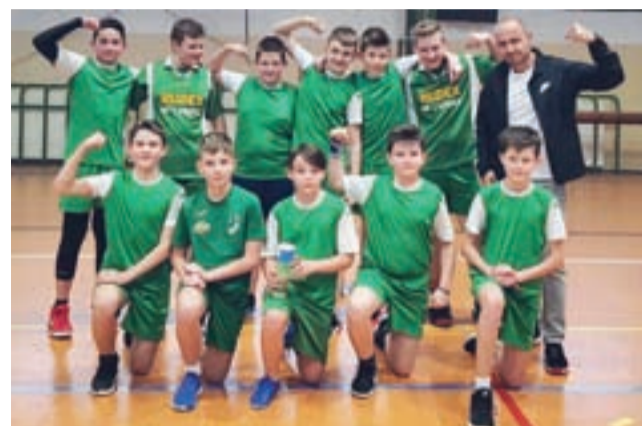
Ekipa SP 7 Łowicz najpierw pewnie zdobyła mistrza Łowicza, potem została mistrzem powiatu i awansowała na półfinał wojewódzki.

Podobnie jak rok temu, faworytem miejskich mistrzostw była SP 7 Łowicz, w której szeregach jest najwięcej zawodników trenujących koszykówkę w klubie UMKS Książek Łowicz. Po losowaniu organizatorzy zdecydowali, że przeprowadzone będą mecze w systemie „każdy z każdym” czyli w sumie rozegrano 6 meczów, a każda drużyna zagrała trzy pojedynki.