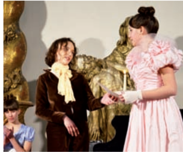
Scena, w której Fryderyk Chopin wspólnie wykonuje utwór z Konstancją, którą darzył szczególnym uczuciem.

Był to dopiero drugi pokaz widowiska, które swoją premierę miało 5 lutego w sali Mazowieckiego Instytutu Kultury. Większość występujących w nim wykonawców uczy się gry na instrumentach w Państwowej Wyższej Szkole Muzycznej I St. Nr 1 im. Oskara Kolbergera w Warszawie. Ci, z którymi udało nam się porozmawiać, przyznali zgodnie, że mniejsza trema towarzyszyła im podczas warszawskiej premie-