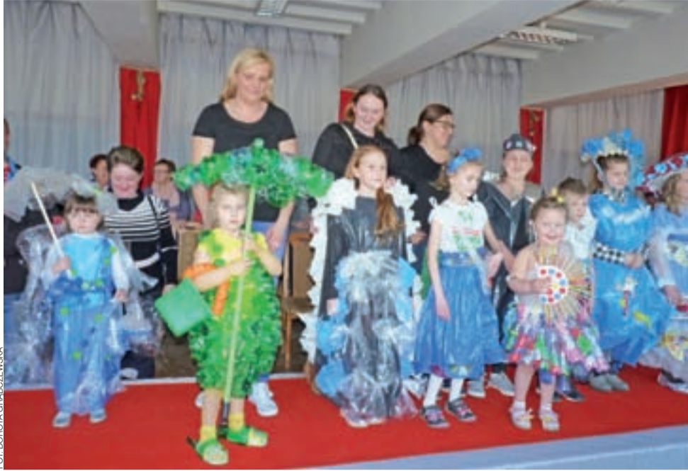
Tak prezentowały się dzieci w strojach ekologicznych w pierwszej edycji konkursu, w kwietniu 2018 roku.