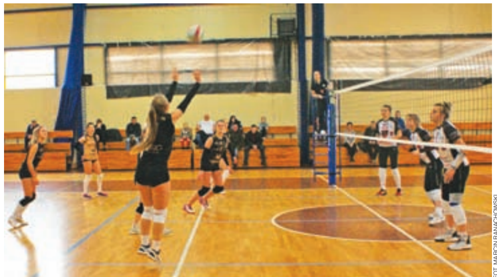
Siatkarki Volley Team Żychlin zostały pokonane 0:3 we własnej hali sportowej przez liderki Libero VIP Gwarant Aleksandrów Łódzki w ramach rozgrywek Wojewódzkiej III Ligi Piłki Siatkowej Kobiet.

Nowy Łowiczanie Tygodnik Ziemi Łowickiej członek Stowarzyszenia Gazet Lokalnych