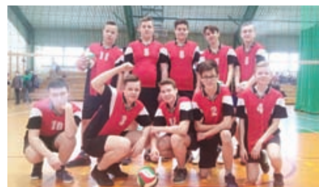
Siatkarze z SP 3 Łowicz wygrali miejskie eliminacje.