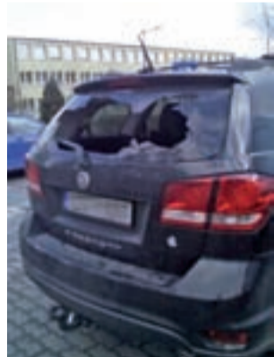
Właściciel pojazdu nie zgłosił na policję wybitcia szyby w aucie.

Od Czytelników otrzymaliśmy zdjęcia potwierdzające zdarzenia. Przy garażach, przy ul. Żeromskiego była nawet policja. – To było dziwne włamanie. Ktoś odciął zawiasy drzwi garażowych i je odchylił, a przecież prościej by było, gdyby odciął tylko kłódkę – mówi mieszkaniec Żychlina.