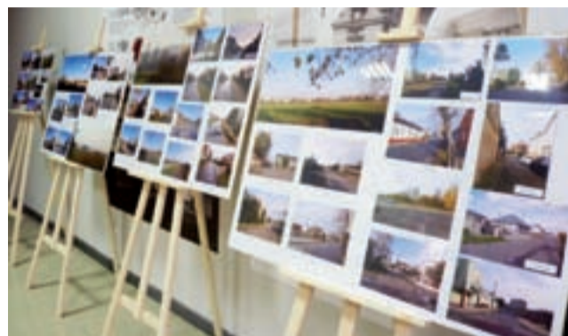
Wystawa TMHŻ Fotograf Żychlina gościła na korytarzu biura promocji podczas sesji Rady Miejskiej w Żychlinie.