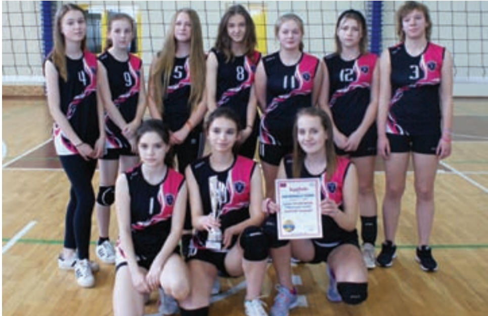
Reprezentacja dziewcząt Szkoły Podstawowej Nr 2 w Żychlinie podczas Finału Powiatowego w Mini Piłce Siatkowej Szkół Podstawowych, jaki odbył się w żychlińskiej hali sportowej – uzyskała awans do rozgrywek półfinałowych na szczeblu wojewódzkim.

Natomiast w rywalizacji dziewcząt udział wzięły szkoły: Szkoła Podstawowa Nr 2 w Żychlinie, Szkoła Podstawowa w Łaniewicach, Szkoła Podstawowa Nr 9