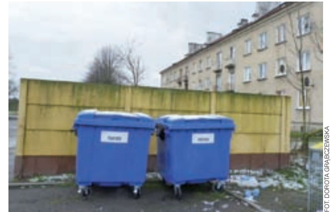
Do segregacji papieru, firma PreZero już przywoziła i ustawiła nowe pojemniki. Tym razem stoją za ogrodzeniem.

Trzy lata temu drzewa wzdłuż alei kasztanowej też zostały podcięte. Systematyczne usuwanie ptasich gniazd sprawia, że oczekiwany efekt został osiągnięty. Mieszkańcy mogą spokojnie spacerować kasztanową aleją. dag