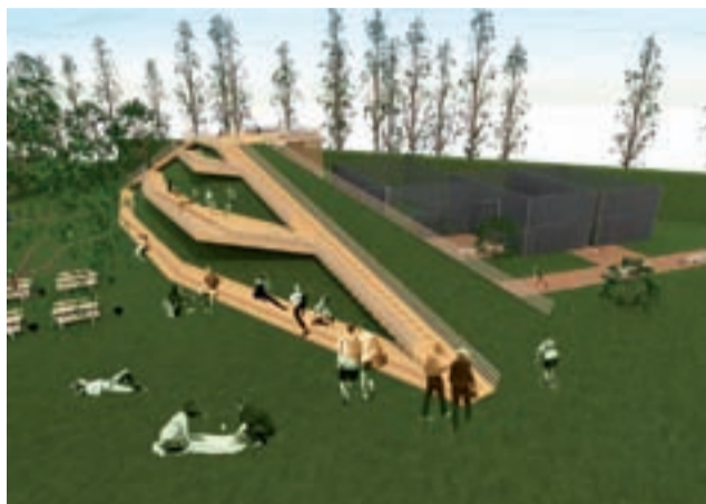
Wizualizacja Górki Frajdy w parku Błonie z 2017 roku, gdy znalazła się wśród propozycji do budżetu obywatelskiego na 2018 rok.

Przypomnijmy, że zagospodarowanie wzniesienia na Błoniach wygrało w głosowaniu spośród propozycji o wartości do 300 tys. zł, zgłoszonych do miejskiego budżetu obywatelskiego jeszcze na rok 2018. Propozycja „Budowa placu do minigolfa, wyciągu saneczkowego oraz „Góra Frajdy” (podest na górze ze zjeżdżalnią i schodami) na górze w parku Błonie” zgłoszona została przez Stowarzyszenie Łączy nas Łowicz.