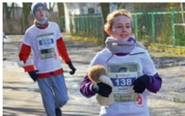
Radość z finiszu, po pokonaniu dystansu honorowego w Zdunach.