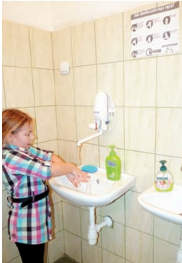
Uczniowie w SP2 mają w sanitariatach mydło, instrukcje mycia rąk oraz papierowe ręczniki.