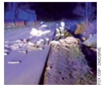
Suche drzewo przewróciło się na łuku drogi.

Na miejsce zostali wysłani przez dyspozytora stanowiska kierowania komendy PSP w Brzeziny. Drzewo przewróciło się na jezdnię i blokowało przejazd drogą, straż pożarną zaalarmowali miejscowi mieszkańcy, którzy usłyszeli huk upadającego drzewa. Dodatkowym zagrożeniem dla kierowców było to, że drzewo przewróciło się na łuku drogi. mak