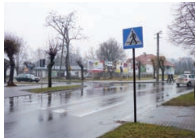
Skrzyżowanie ul. Swoboda z ul. Piątkowską. Pionowy znak informuje o przejściu dla pieszych, jednak poziome pasy są prawie niewidoczne.

Niewykluczone, że bezpieczeństwo na wspomnianym odcinku niebawem nieco się poprawi. Wszystko to za sprawą wykony-