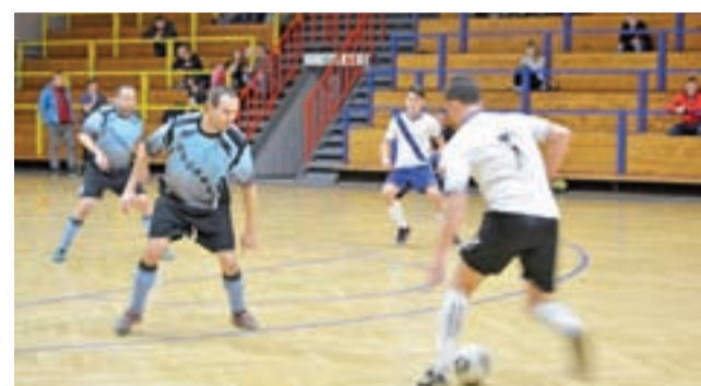
Nieobliczalni Głowno żegnają się z Julomax II Ligą ŁoLiF.

wicz 2:4, ŁKS II Łódź - LKS Kwiatkowie 6:0, MKP Boruta Zgierz - GKS Orkan Buczek 1:1, KAS Konstantynów Łódźki - Zjednoczeni Stryków 1:4, Lider Włocławek - KS Sand Bus Kutno 1:3, Pelikan II Łowicz - KS Teresin 1:2, Szczerbiec Wobórz - KS Paradyż 2:7, KS Sand Bus II Kutno - Orzeł Parzęczew 3:1, GKS Ksawerów - Stal Głowno 2:1, Zawisza Rzgów - Tęcza Brodnia 3:4, AKS SMS Łódź - MKP Boruta II Zgierz 0:0, Pogoń Zduniska Wola - Włóknarz Żelów 4:1.