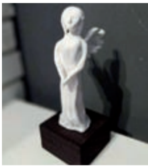
Rzeźba Zofii Aftewicz.

Temat anioła był w konkursie narzucony, ale ujęcie zostawiało całkowitą dowolność. – Zaczęłam od szukania w internecie obrazów, które mogłyby być inspi-