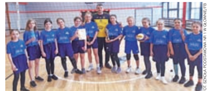
W minisiatkówce głównianie z SP nr 1 pokazali, że są wielcy.