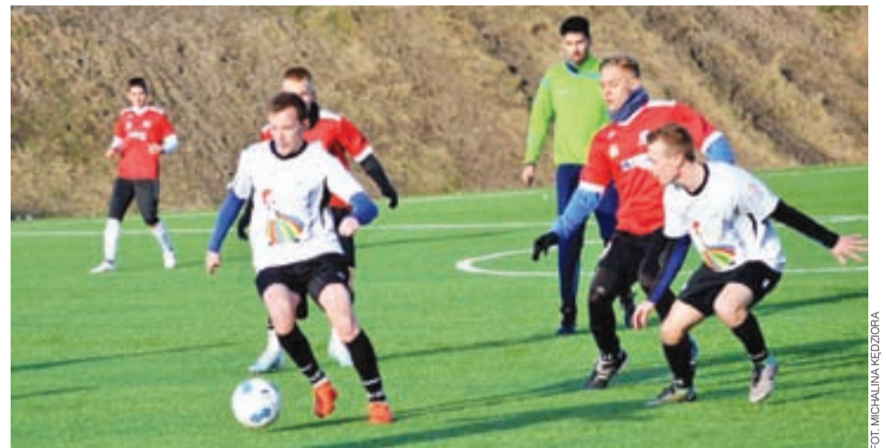
Białozieloni w meczu sparingowym w Łodzi zmierzyli się z wiceliderem IV ligi – Liderem Włocławek.

W zespole Ptaków zagrało dwóch testowanych zawodni-