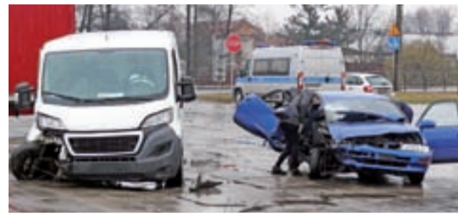
Dwa spośród trzech pojazdów były poważnie uszkodzone.