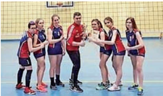
Zespół z Głowna znów pokazał siatkarską moc.