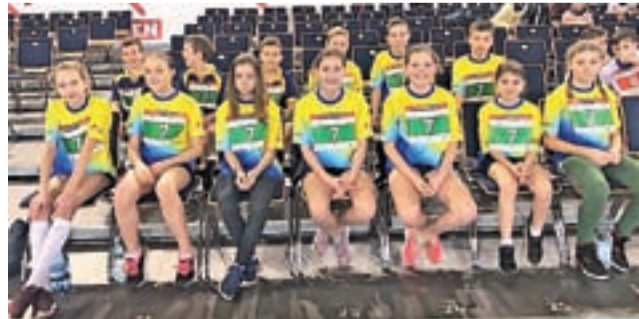
Grupa głównian podczas zawodów w Atlas Arenie.