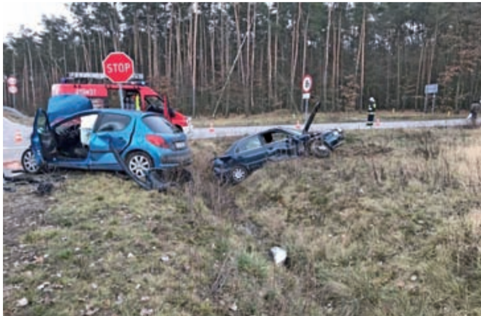
Wymuszenie pierwszeństwa zakończyło się w rowie.

Uczestnicy zdarzenia byli trzeźwi. Trwa postępowanie w tej sprawie. aw