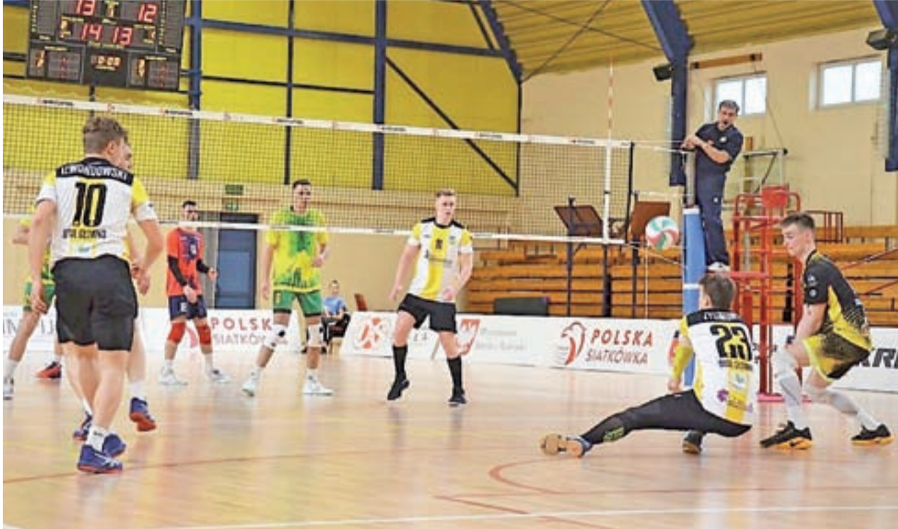
Siatkarze Stali Głowno (biało-żółto-czarne stroje) mają zapewniony udział w Turnieju Finałowym III Ligi.