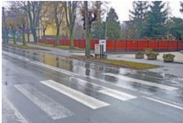
Przejście dla pieszych przy ul. Swoboda. Wytarte pasy nie zawsze są widoczne dla kierowców.

W obu rolach, zarówno pieszych, jak i kierowców, czasami