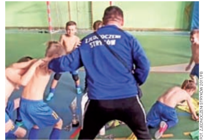
Szalona radość zespołu Zjednoczonych po Turnieju w Tomaszowie.