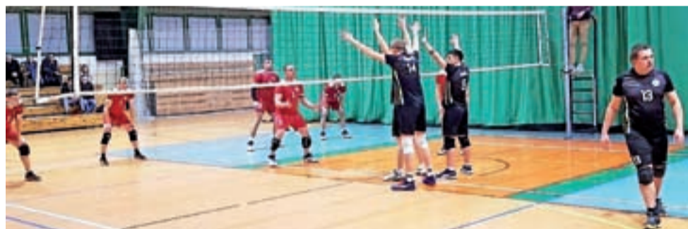
W lidze SAM walka o mistrzostwo toczyć się będzie do końca.

“Rywale zaskoczyli głowieńskich siatkarzy mocną zagrywką. Była szansa na tie-break, ale gospodarze mieli przewagę wzrostu.”