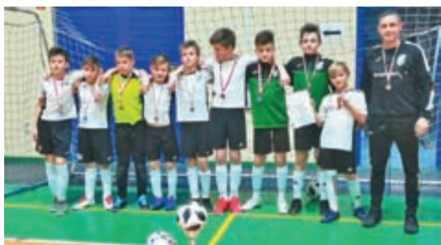
Pelikan 2007 zajął trzecie miejsce w turnieju halowym.

pią – pozostało już niewiele ponad dwa tygodnie. Pelikan ma w tym czasie zaplanowane jeszcze dwa sparingi. Przedostatni z nich rozegrany zostanie już w tę sobotę. Podopieczni Dremliuka zmierzą się w Pruszkowie z II-ligowym Zniczem. Próba generalna tydzień później w Łowiczu – z I-ligową Jutrzenką Warta. Mateusz Lis