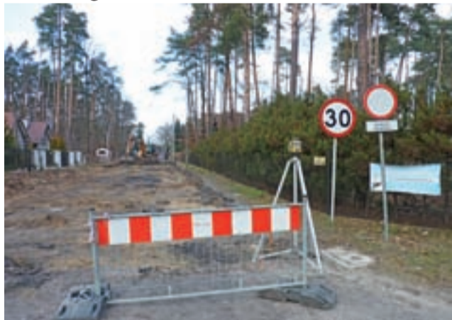
Tak prezentowała się ul. Południowa tuż po rozpoczęciu prac.

Koszt inwestycji to 516.827,80 złotych. W całości zostanie on pokryty ze środków miasta. Remont wykonuje firma BUDMAX To-