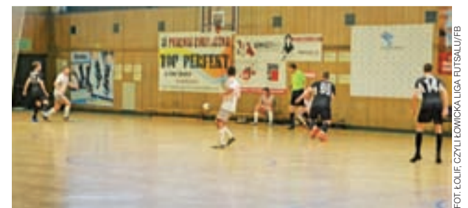
W Robkol IV Lidze ŁoLiF wszystkie karty już zostały rozdane.