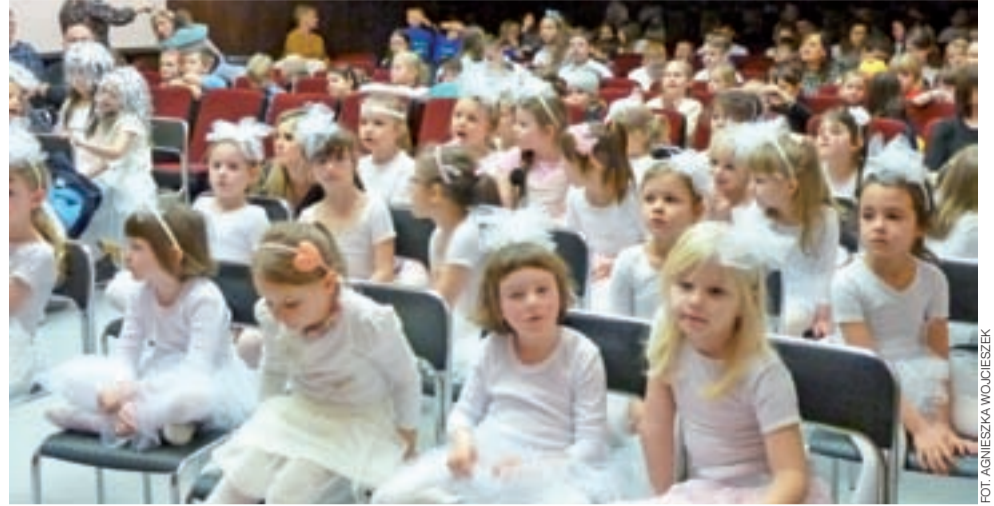
Widowiskową salę wypełniły małe aniołki. Dzieci zachwyciły pomysłowością w przygotowaniu strojów.