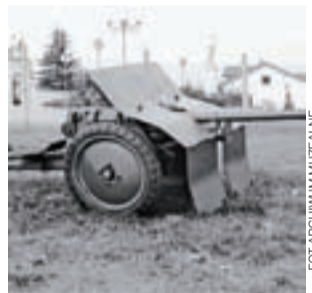
Armaty Bofors 37 mm