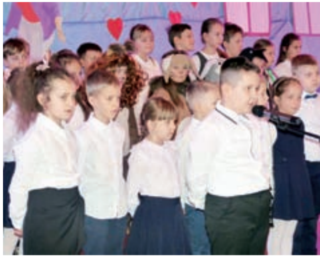
Tak prezentowały się dzieci podczas występów.