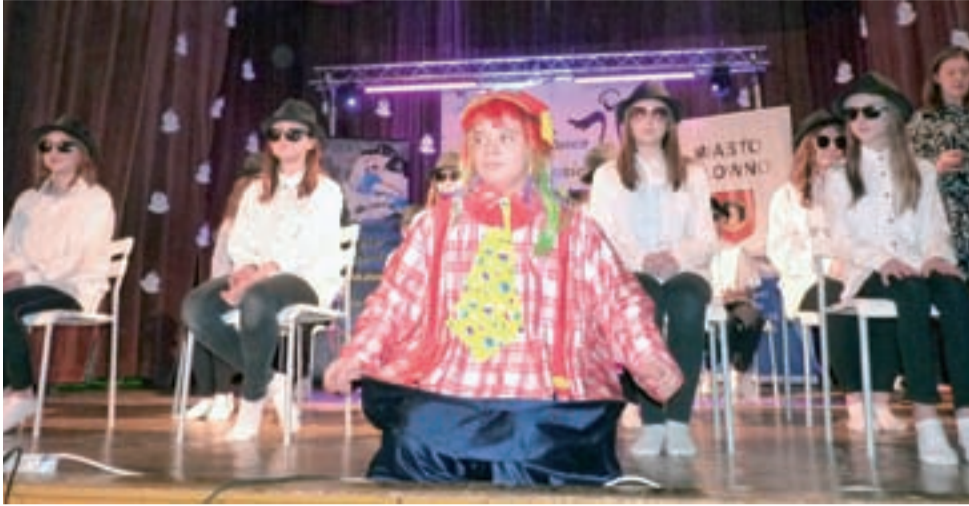
Taniec dżentelmenów w wykonaniu uczniów ZSP w Lubiankowie zaskakiwał oryginalnością.