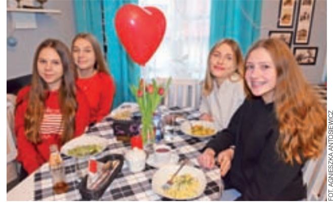
Z okazji Walentynek na przyjacielskiej kolacji w restauracji „Na Poddaszu” spotkały się po szkole koleżanki z jednej klasy z I LO.