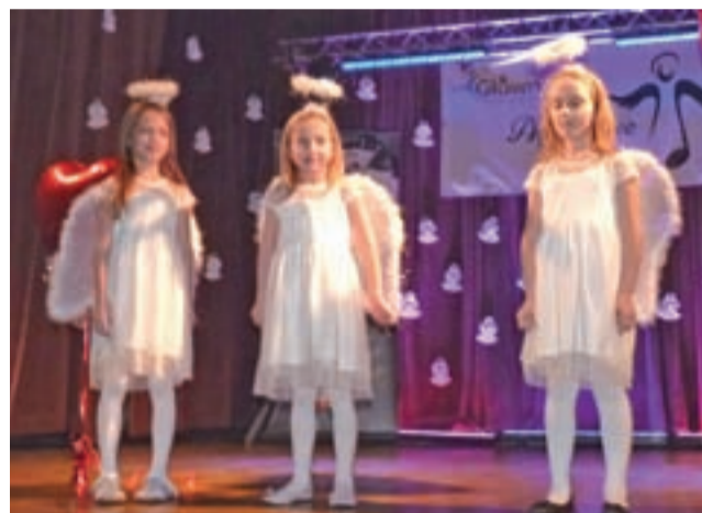
Aniołkowe stroje i ogromne serca królowały podczas gali w MOK-u.

Z zapewnień naszej rozmówczyni wynika, że uczniowie „Dwójki” chętnie angażują się w akcje charytatywne, dlatego