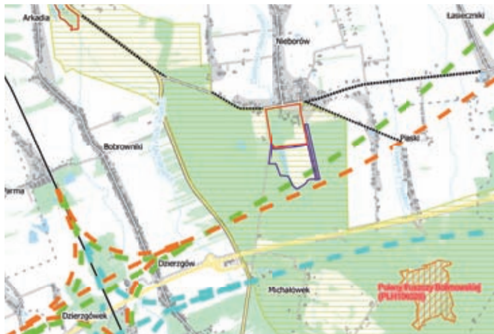
To tylko jedno ze spornych miejsc: okolice Nieborowa. Wariant zielony prowadzi przez Pole Nieborowskie, niebieski przez Michałówek.

– Żaden z wariantów, jaki przedstawiono na mapach pro-