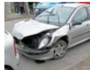
To nie pierwsze

Tym razem kierująca Peugeotem 206, 19-letnia mieszkanka gminy Dmosin, wjeżdżając