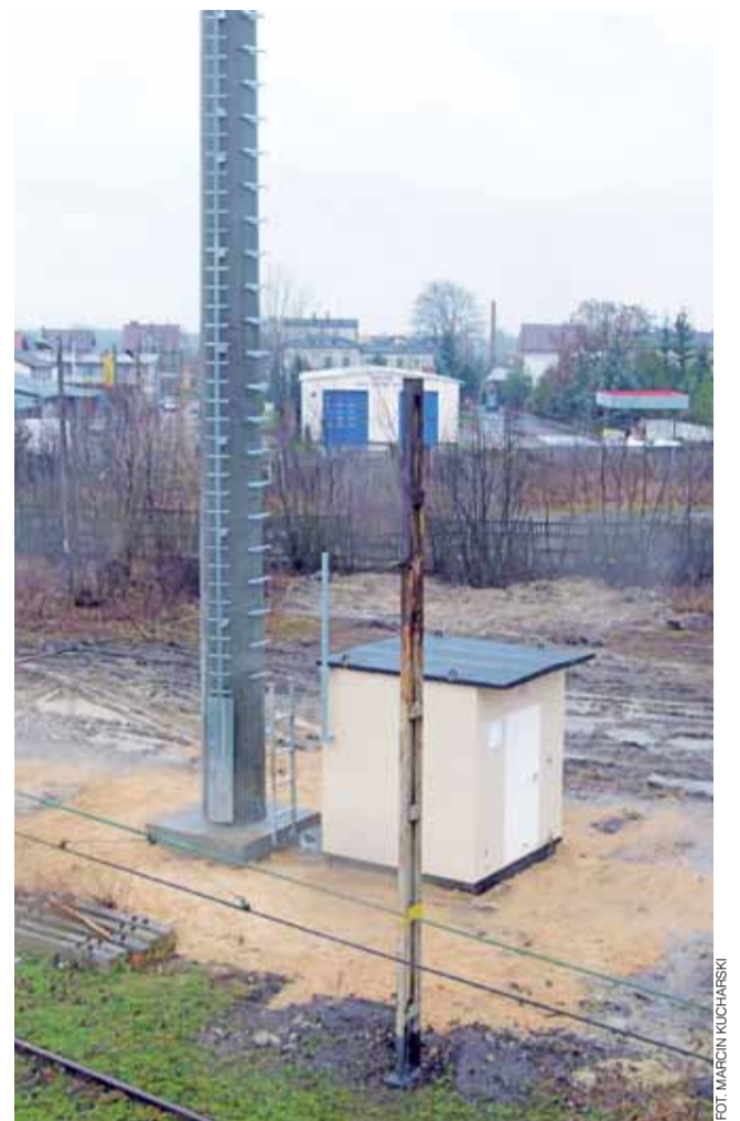
Maszt przy dworcu PKP Łowicz Główny ustawiono w grudniu 2014 roku. Wkrótce potem zakładano nadajniki GSM.

– W systemie GSM-R sterowanie ruchem odbywa się poprzez stałą dwukierunkową wymianę informacji za pomocą komunikacji radiowej pomiędzy pociągiem a systemem sterowania ruchem kolejowym. Umożliwia to szybszą i dokładniejszą wymianę informacji pomiędzy personelem kolejowym – czytamy w odpowiedzi.