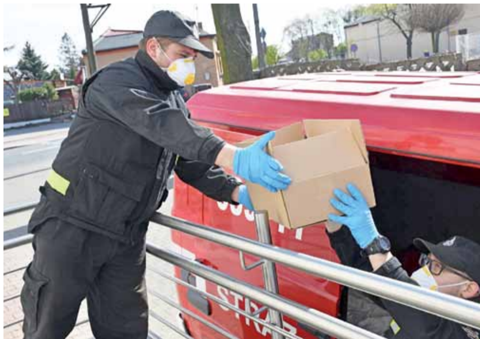
Strażacy z OSP Stryków przygotowują się do rozwożenia maseczek.

Maseczki trafiły do mieszkańców miasta w czwartek, 16