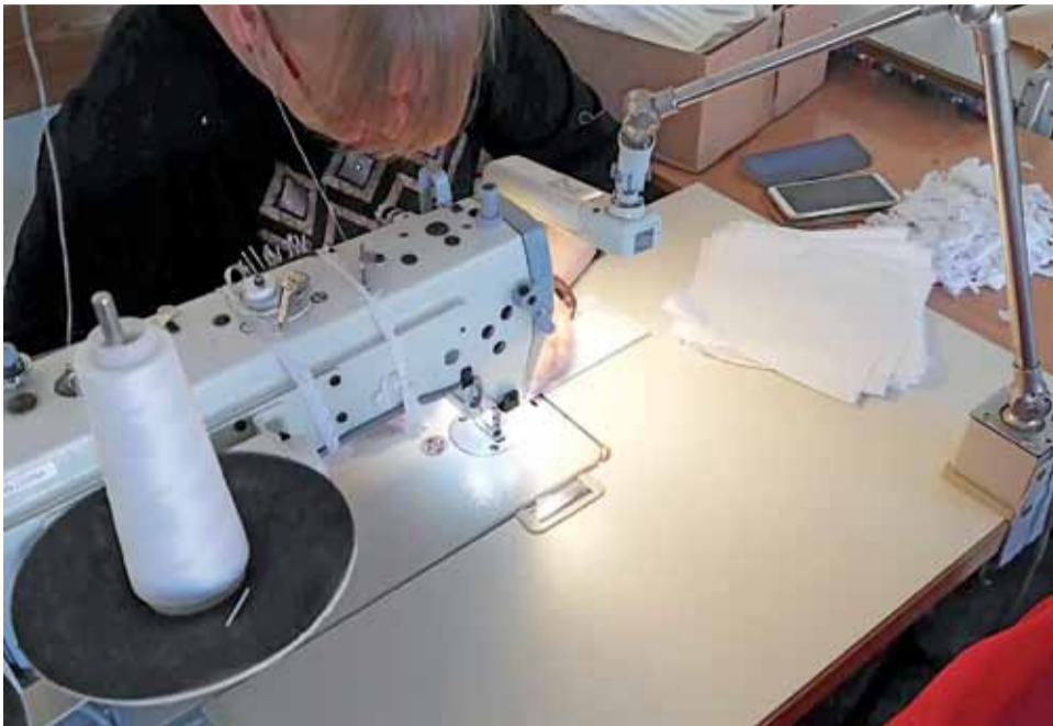
W szwalni przy ul. Sikorskiego w Głownie trwa produkcja maseczek w ramach projektu #PolskieSzwalnie.