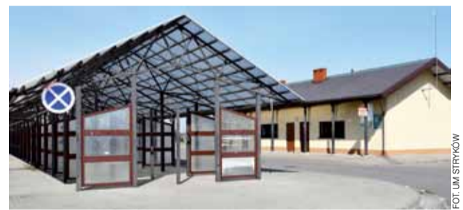
Wiaty targowe na targowisku w Strykowie.

Jak teraz będzie zorganizowany handel na placu przy ul. Targowej w Strykowie? – Wydzielamy sektory z zachowaniem większej