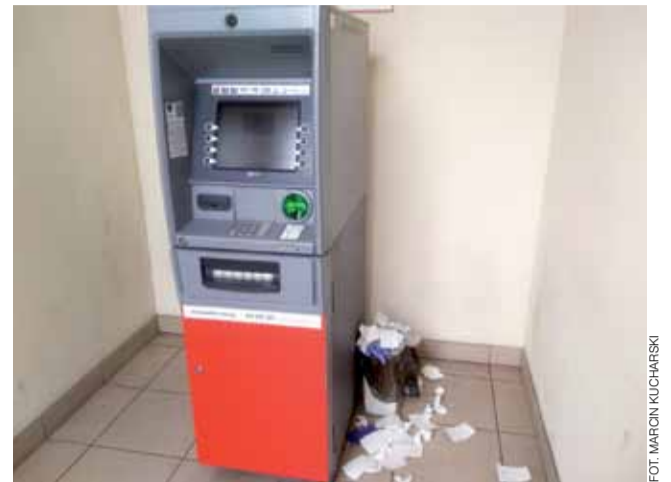
Bankomat działał. Szkoda tylko, że śmieci wokół nie były posprzątane.

Burmistrz Głowna zapowiedział, że w miarę zmieniającej się sytuacji oraz stanu prawnego podejmie kolejne stosowne działania, mające na celu pomoc dla przedsiębiorców z naszego miasta. aw