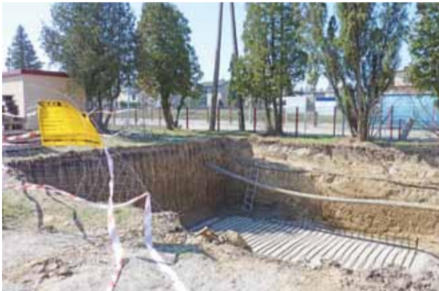
Plac budowy przy stacji kolejowej w Głownie. Widać już pierwsze efekty prowadzonych robót i to właśnie one zaniepokoiły mieszkańców.

Sygnal emitowany przez antenę zawieszoną na maszcie GSM-R nie ma wpływu na otoczenie poza koleją. Emitowany jest wzdłuż linii kolejowej, od jednego masztu do drugiego, a nie promieniście na całą okolicę.