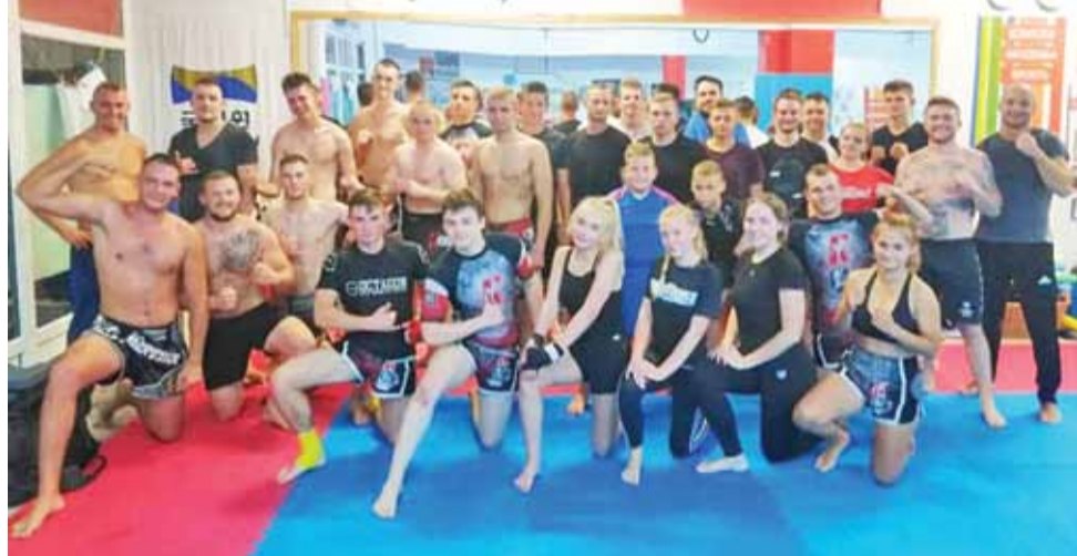
Mocna sekcja wojowników z Khroo-Gym czeka na koniec kwarantanny.

Dyscyplina ta zmieniała się przez setki lat. Ważnym krokiem w historii Muaythai było pojawienie się formuły amatorskiej. W ten sposób tak piękny sport, pozwalający na tak szeroką gamę dozwolonych technik podczas walki stał się bardzo bezpieczny, a co za tym idzie uprawiany na jeszcze większą skalę. Wprowadzono w tej formule obowiązkowe ochraniacze na głowę, klatkę piersiową, łokcie, krocze, golenie, szczękę i rękawice. Niezależnie od zmian historycznych, Muaythai nie straciło egzotycznego uroku i tajemniczości. Muaythai było, jest i będzie sprawdzianem ducha walki. To