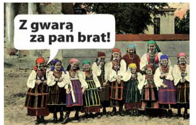
Ministerstwo Kultury i Dziedzictwa Narodowego. Dofinansowano ze środków Narodowego Centrum Kultury w ramach programu „EtnoPolska 2020”

W związku z obecną epidemią termin zajęć przewidziany jest na wrzesień i październik. Finałem projektu będzie natomiast otwarty konkurs „Mistrz Mowy Książac-