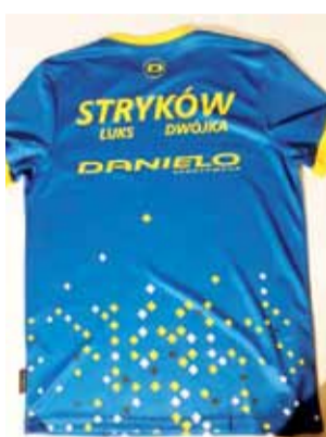
Koszulki będą służyć kolarzom podczas podróży i dekoracji.

Swoje robią także działacze LUKS Dwójki, którzy pozyskali dla kolarzy oficjalne koszulki klubowe. Młodzież będzie w nich mogła przemieszczać się na co dzień podczas dojazdów do klubu, czy też na wyścigi. Ze środków gminy pozyskano do tej pory komplety wyścigowe, które zawodnicy ubierają podczas startów. Dzięki oficjalnym koszulkom, a w planach jest także pozyskanie dresów klubowych, promocja klubu i miasta będzie stała na jeszcze większym poziomie. Klub ze Strykowa otrzymał koszulki