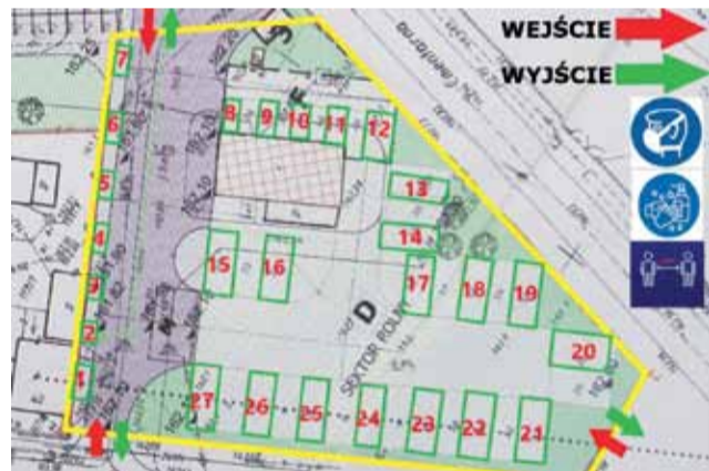
Na planie zaznaczone są stanowiska, na których będzie prowadzony handel (27) oraz wejścia i wyjścia z targowiska.

Poprzednie zarządzenie w sprawie przedłużenia do odwołania zamknięcia strykowski targowiska burmistrz Strykowa Witold Kosmowski wydał 1 kwietnia. Targowisko zostało wtedy zamknięte do odwołania. Burmistrz argumentował, że decyzja ta była spowodowana troską o zdrowie i bezpieczeństwo mieszkańców – a nie chęcią utrudnienia sprzedaży płodów rolnych. Wskazywał też wtedy na sprzeczne informacje płynące z rządu, kiedy to z jednej strony płynęły wezwania do pozo-