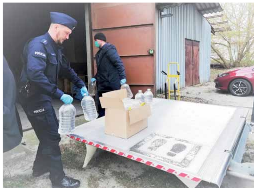
Nielegalny alkohol pomoże w walce z koronawirusem. Gdyby nie trafił do medyków, zostałby zutyliзовany.