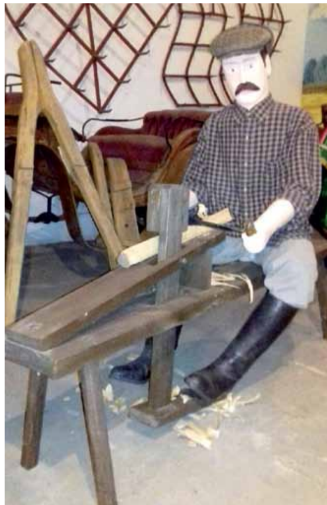
Stelmach z Muzeum Ludowego w Sromowie na ławce kobylcy – to nowa rzeźba przygotowana w tym sezonie.