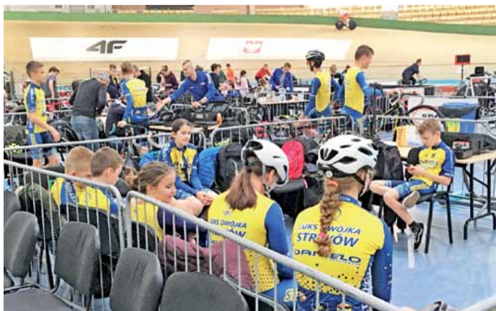
Strykowscy kolarze czekają na swój pierwszy start w sezonie 2020.

Przed wszystkim mowa tutaj o eliminacjach do Ogólnopolskiej Olimpiady Młodzieży, która w lipcu miała odbyć się w Strykowie. Jeżeli kolarski sezon ruszy w czerwcu to jest szansa rozegrać kilka Pucharów Polski w odstępie kilku tygodni i wtedy OOM jest możliwa w planowanym terminie. Wszystko musi jednak być podporządkowane imprezom rangi mistrzowskiej, dlatego też pozostałe klasyki zostaną przełożone na później lub odwołane. wp