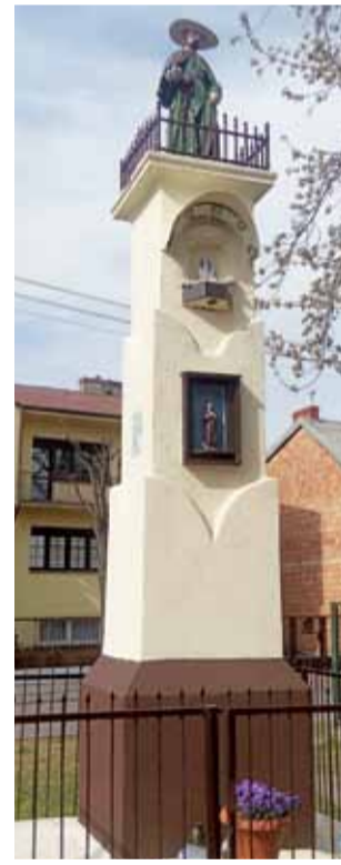
Kapliczka św. Rocha z 1852 r.