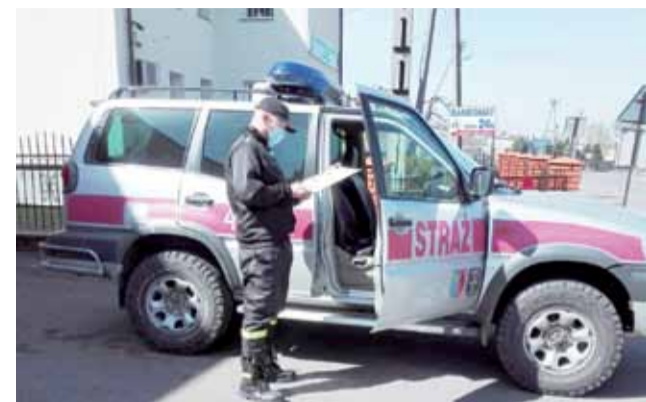
Strażacy z Dmosina na chwilę przed wyjazdem w związku z rozwożeniem maseczek.