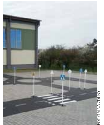
Miasteczko ruchu drogowego przy SP w Nowych Zdunach.

Temat stanowić jednak może też jeden z wątków kampanii wyborczej. Jeden z kontrkandydatów prezydenta Dudy, Rafał Trzaskowski, mówił już bowiem kiedyś, że jego zdaniem CPK nie jest potrzebny, bo: „W Berlinie udało się po latach, i będziemy mieli lotnisko, które... no trudno będzie z nim konkurować”. Obecnie podtrzymuje swe stanowisko przeciwne tej inwestycji. wal