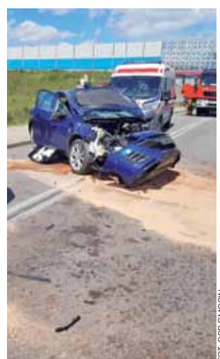
Miejsce zdarzenia. Na tym skrzyżowaniu podobne sytuacje nie należą do rzadkości.

■ Na wysokości 10 metrów uwieczony został kot, który w sobotę, 30 maja, chwilę po południu zauważony został na drzewie w Kalinowie. Zwierzę udało się zjechać z drzewa dopiero po przybyciu strażaków ze strykowski JRG, którzy uwolnili je, dzięki interwencji podjętej z podestu podnośnika hydraulicznego.