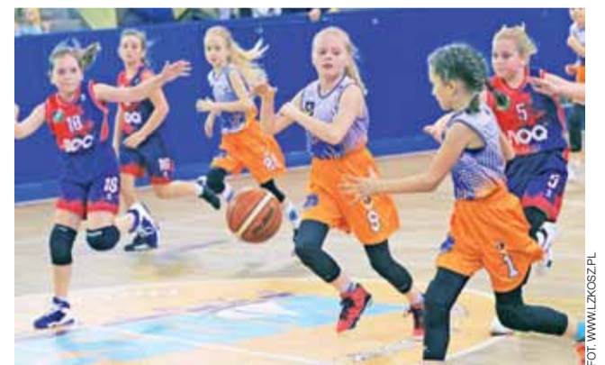
Koszykarki Strykowa (pomarańczowo-niebieskie stroje) w akcji.