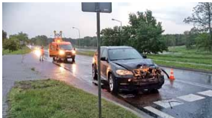
Widoczne na zdjęciu czarne BMW nie zachowało bezpiecznej odległości od białej Toyoty jadącej przed nim i uderzyło w jej tył.

W dniu świątecznym, a więc w Boże Ciało, przypadające w tym roku 11 czerwca, mieszkańcy Głowna po raz pierwszy będą mogli się wybrać na rowerki wodne. Tego dnia ruszy wypożyczalnia sprzętu wodnego nad zalewem Mrożyczka. Korzystanie z niego możliwe będzie w godzinach 11.00-19.00 pod warunkiem zachowania szczególnej ostrożności ze strony użytkowników. W trosce o ich bezpieczeństwo prowadzona będzie również dezynfekcja sprzętu. aw