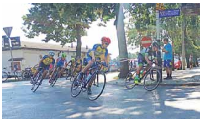
Kolarze ze Strykowa znów pojawią się na starcie wyścigu.