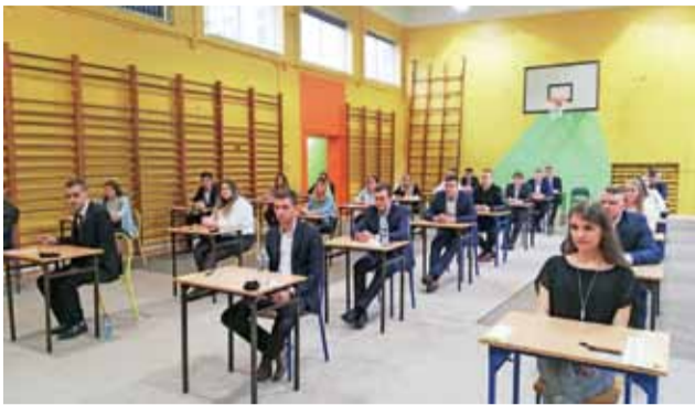
Matura z języka polskiego w ZS Nr 1 w Bratoszewicach.

Alarm covidowski odebrali we wtorek, 9 czerwca, pracowni-