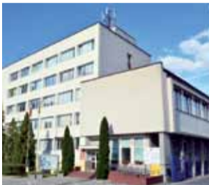
Budynek starostwa powiatowego w Zgierzu , w którym pracowała osoba, u której stwierdzono zakażenie koronawirusem.

Wyniki badania 14 pracowników nadchodziły szybko (5 czerwca), choć sływały o różnych porach do kolejnych osób.