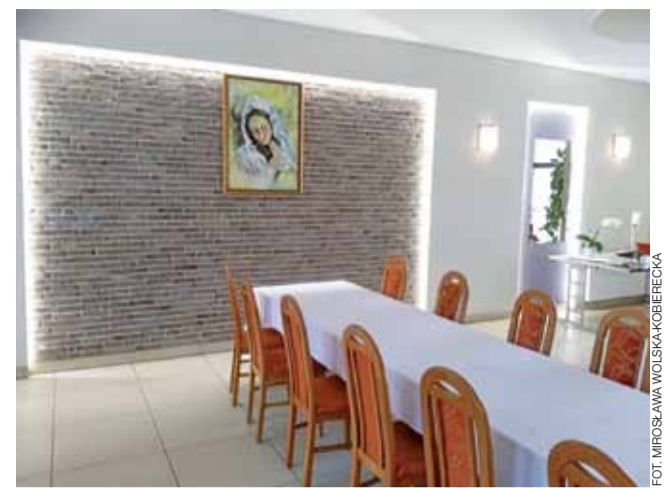
Sala weselna „Wiedeń”. Standardem ma być, że przy jednym stole siedzą najbliżsi.

– Postawiliśmy na okrągłe stoły, które będą od siebie oddalone. Umożliwi to zachowanie bezpiecznej odległości i zapew-