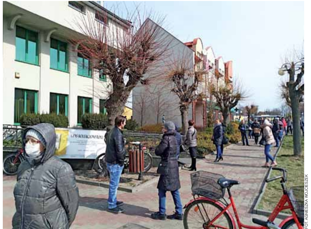
Tak było w najtrudniejszym okresie. Kolejka do Banku Spółdzielczego w Głównie w czwartek 26 marca.

Nie mniej ważny od sposobu robienia zakupów, niektórym wydaje się ich czas. W trakcie rozprzestrzeniania się epidemii, ze względu na bezpieczeństwo wybierali oni moment mniej-