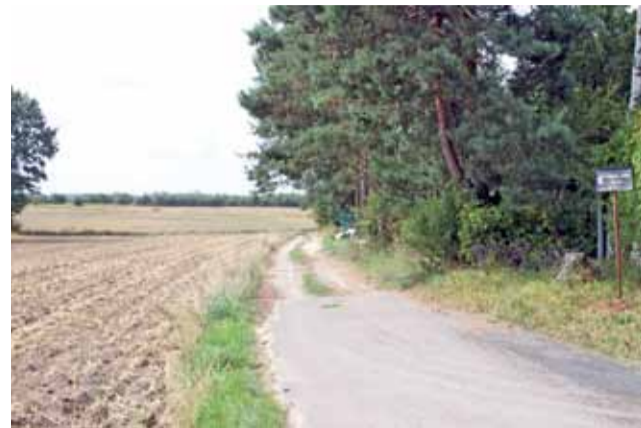
Ta droga zostanie wykonana jeszcze w tym roku.