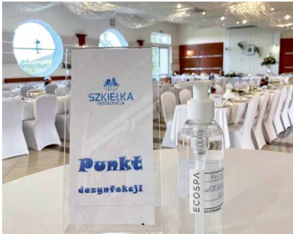
Sala weselna w „Szkiełkach” czeka na przybycie gości. Na pierwszym planie punkt dezynfekcji, na drugim stoły w rzędach.

– Nie wszyscy goście deklarują, że będą. Wiele osób jeszcze boi się epidemii i woli zostać w domu. Z tego względu czerwcowe wese-