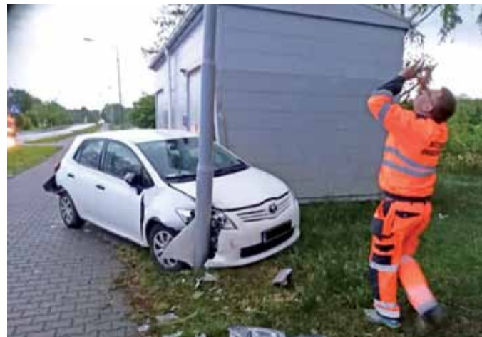
Toyota Auris wbiła się pomiędzy stację transformatorową a latarnię oświetlenia ulicznego.

W miejscu zdarzenia było spore zamieszanie i przez kilka godzin ruch odbywał się jednym pasem, ponieważ BMW zatrzymało się na pa-