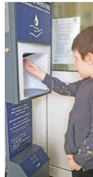
Urządzenie w SOSW im. Kornela Makuszyńskiego w Zgierzu.

Od 30 czerwca możliwość składania wniosków o bezpłatne automatyczne dyspensery i płyny do dezynfekcji mają także dyrektorzy szkół ponadpodstawowych. Urządzenia są przekazywane w bezpłatne użytkowanie na okres 18 miesięcy. Są objęte gwarancją i serwisem producenta, którym jest Polfa Tarchomin.