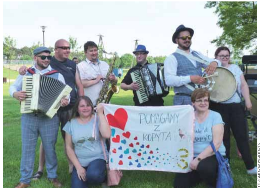
Spotkanie nad strykowskim zalewem. Zainteresowanie biesiadą było spore.