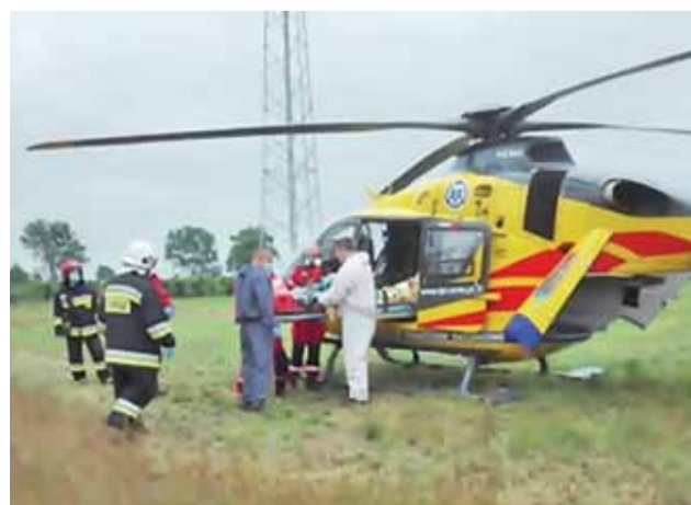
Maszyna LPR uległa awarii. 17-latek został więc ponownie przetransportowany do karetki pogotowia.