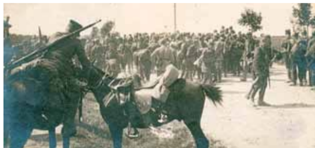
Kijów, czerwiec 1920. Polskie oddziały opuszczają miasto.

Walcząca dotychczas bez większych rezultatów 1 Armia Konna Budionnego zmienia taktykę i uderza 5 czerwca w jednym punkcie – na styku 3 i 6 Armii WP na Ukrainie. Przełamuje polską linię obrony na odcinku Samhorodek–Nowochwastów. 7 czerwca oddziały Budionnego zajmują Żytomierz i Berdyczów, następnie zwracają się w kierunku Kijowa. Podjęta zostaje decyzja o wycofaniu 3 Armii WP z tego obszaru. 8 czerwca w Warszawie dymisja premiera Leopolda Skulskiego. 10 czerwca oddziały polskie opuszczają Kijów, unikając groźby otoczenia.