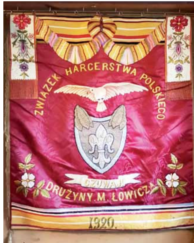
Historyczny sztandar łowickiego harcerstwa ma już 100 lat.

Sztandar miał być na stołcu barwami łowickimi, wykonanie oparte na motywach łowickich, bardzo oryginalny, z jednej strony posiada sokoła w locie i godło skautów – lilijkę, a z drugiej świętego Jerzego, patrona harcerzy. Na drzewcu u góry srebrny orzeł z rozpostartymi do lotu skrzydłami. Sztandar wykonany został przez zakład św. Kazimierza na Tamce w Warszawie. Projekt dał p. Nasterski. Dyrektor Jacyna, trzymając sztandar przed „orłami polskimi”, przemówił do nich płomiennie, wykazując wielkie umiłowanie młodzieży i ich ideałów. (...) Mówca nawoływał tych, którym wręczał sztandar, do umiłowania sztywnych ideałów Polaka – obywatela i wiernej służby ukochanej Ojczyźnie.