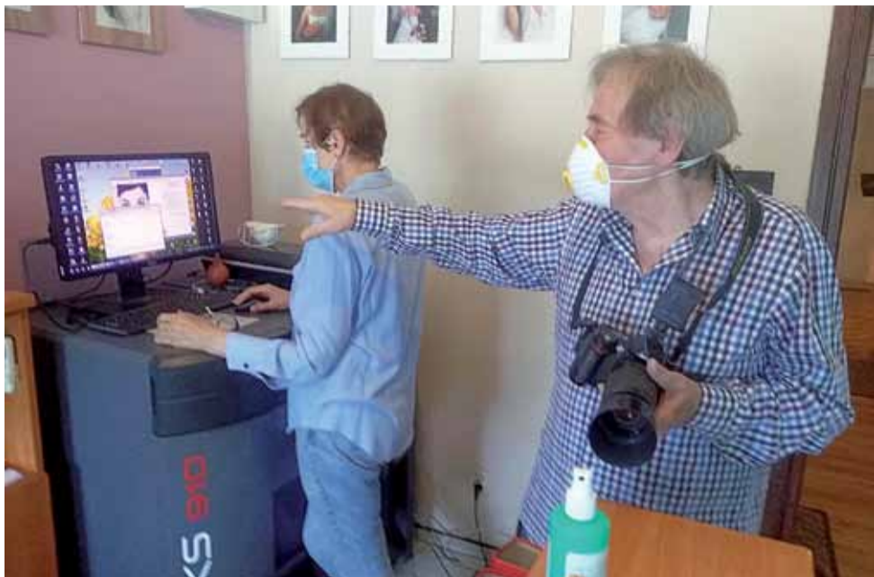
Właściciele zakładu Foto Norek w Głowniu uważają, że podjęli dobrą decyzję o czasowym zawieszeniu działalności i mają nadzieję, że niedługo będą mogli powiedzieć, że decyzja o odwieszeniu też była właściwa.

do swoich placówek, a to ma wpływ na obroty sklepu z odzieżą, gdyż rodzice mogą nie potrzebować np. nowej koszuli dla dziecka na zakończenie roku w szkole czy przedszkolu. Ubrania nie są też produktami pierwszej potrzeby. Tego rodzaju zakupy czasami można wstrzymać, odsunąć w czasie i z obserwacji osób pracujących w tej branży wiele osób tak czyniło – zwłaszcza w pierwszym okresie epidemii.