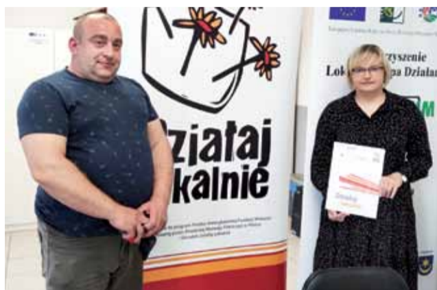
W poniedziałek 8 czerwca umowę podpisali w głowieńskiej siedzibie Polcentrum m.in. przedstawiciele Ochotniczej Straży Pożarnej z Głowna.

Stowarzyszenie „Senior” z Głowna swój grant zamierza wykorzystać na zakup materia-