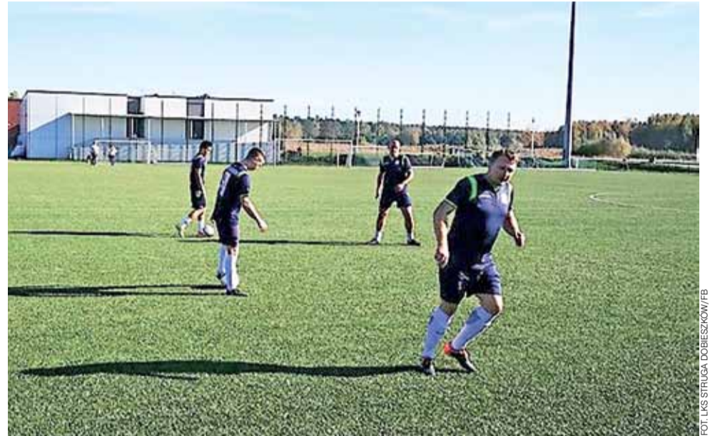
Piłkarze Strugi Dobieszków utrzymali się w A-klasie jako beniaminek, zajmując 6. miejsce.

Oprócz typowo ekonomicznych przyczyn owych zmian ŁZPN zwraca również uwagę, że znacząco zmniejszono także dysproporcje w liczebności poszczególnych grup, co pozwoli na rozgrywanie porównywalnej liczby spotkań przez drużyny występujące na tym samym szczeblu rozgrywkowym. Nie jest jeszcze znany szczegółowy terminarz rozgrywek na kolejny sezon, ten będzie prawdopodobnie przedstawiony w najbliższych tygodniach przez Wydział Gier i Ewidencji Łódzkiego Związku Piłki Nożnej, więcej na stronie internetowej www.lzpn.org . wp