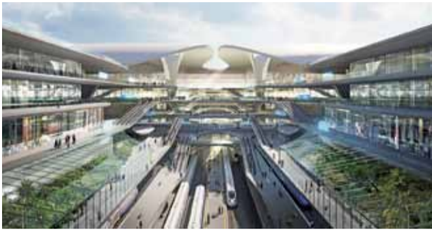
Centralny Port Komunikacyjny. Koncepcja biura projektowego Zaha Hadid.

Program CPK finansowany ma być w większości ze źródeł kapitału zagranicznego i rozwojowych Unii Europejskiej. Pierwsze samoloty mają wystartować stąd w 2027 roku. Trwają też prace nad