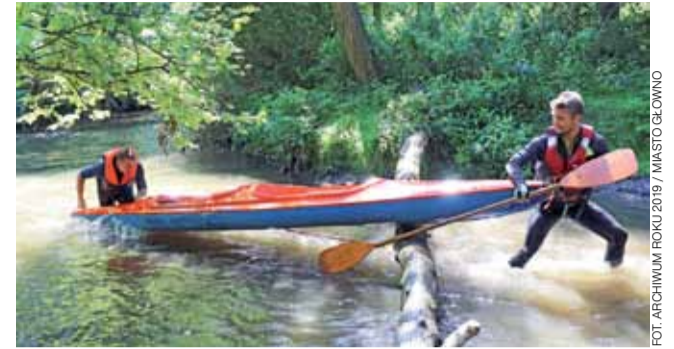
Mroga to ciągle niespodzianki. Kajakiem nie zawsze da się przepłynąć.