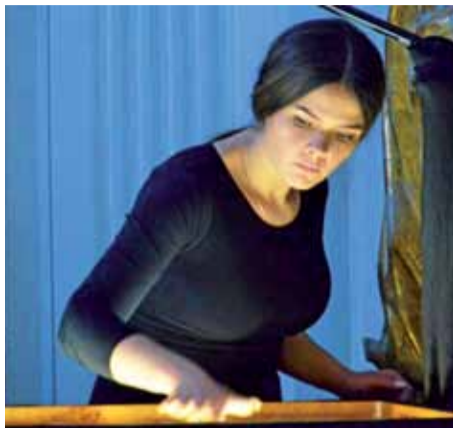
Zwycięzcy 6. edycji programu Mam talent! z 2013 roku Tetiana Oleksandriwna Halicyna malowała piaskiem w Muzeum w Łowiczu.

niu przez rówieśników. Spotkanie odbędzie się w sali widowiskowej, ze względów sanitarnych będzie można w niej zająć połowę miejsc siedzących. Wstęp bezpłatny. tb