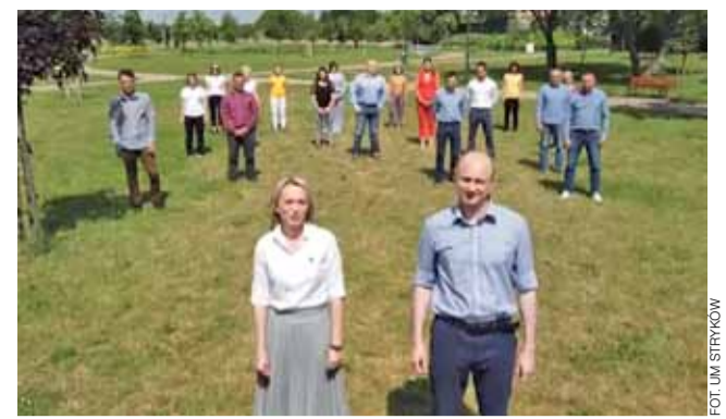
Kadr z filmu opublikowanego przez UM Stryków.

Czy ciesząc się powrotem w sezonie letnim kąpielisko w Głownie, w najbliższych tygodniach ponownie wypełni się plażowiczami? W ubiegłym roku kąpiele w tym miejscu przez sporą część sezonu uniemożliwił zakwit sinic. Niewiele brakowało, a w tym roku plany na plażowanie w Głownie pokrzyżowałby koronawirus. Jeszcze kilkanaście dni temu samorząd rozważał, czy plażę w ogóle w tym roku otwierać, o czym pisaliśmy na łamach WG. W Strykowie sezon kąpielowy ma ruszyć 1 lipca. mak