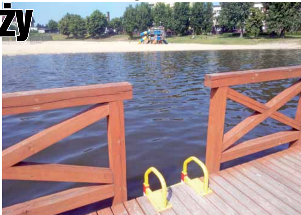
Czy ciesząc się powrotem w sezonie letnim kąpielisko w Głownie, w najbliższych dniach ponownie wypełni się plażowiczami? Wiele zależy po prostu od pogody, ale też od od Sanepidu, który bada wodę.

Wiadomo już natomiast jak zbliżający się sezon kąpielowy nad Mroźczką będzie zorganizowany. Otóż, wzorem poprzednich lat, nad Mroźczką dyżurowali będą przez osiem godzin w ciągu każdego dnia dwaj ratownicy. Teren kąpieliska będzie