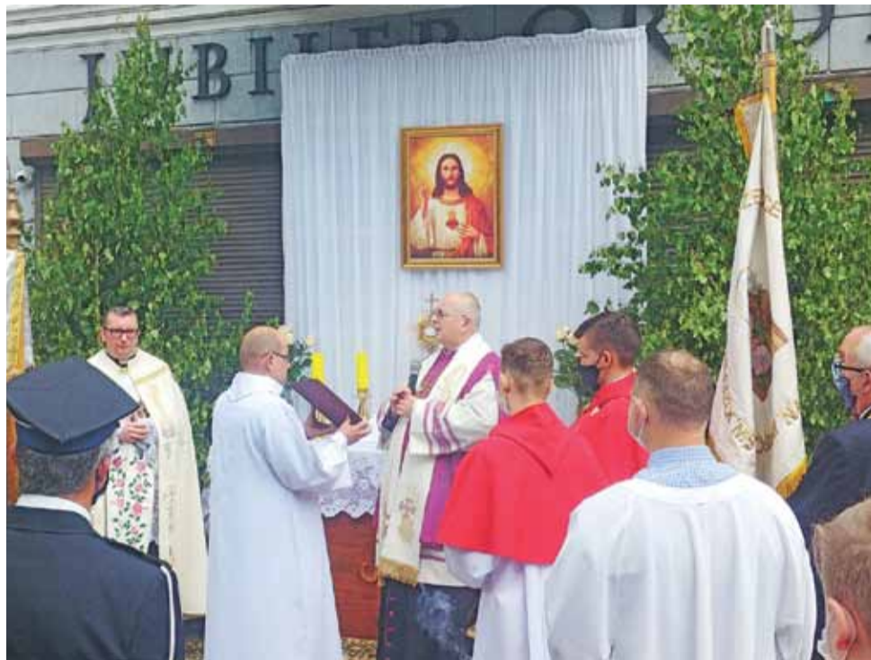
Dekorację tradycyjnych ołtarzy na Boże Ciało rozpoczęto we wczesnych godzinach porannych.

Nad bezpieczeństwem uczestników przez cały czas czuwa-