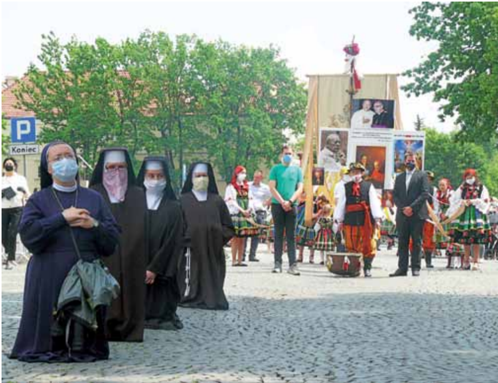
Na pierwszym planie siostry zakonne, m.in. łowickie bernardynki z zakrytymi twarzami, przed pierwszym ołtarzem przygotowanym przez pijarów.

do niej dopiero, gdy ta obok nich przeszła.