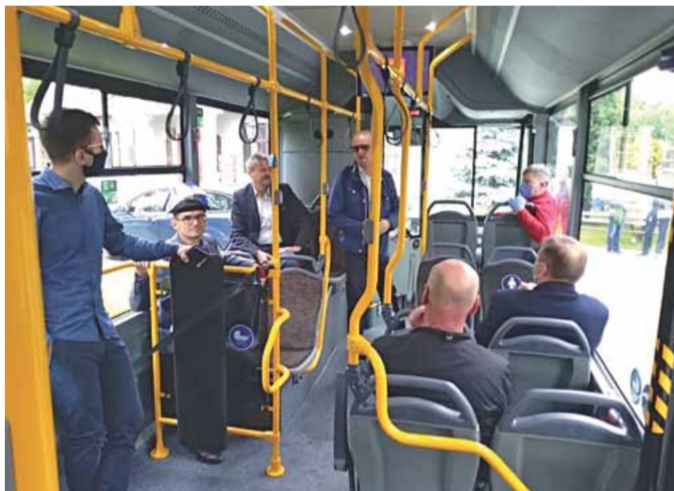
Była teoria, czas na praktykę. Inauguracyjny przejazd z udziałem radnych.

– Autobus jest nowy, więc wiele mechanizmów musi się po prostu dotrzeć w praktyce i wtedy przejazd będzie bardziej komfortowy. Obecnie jesteśmy w fazie testowania i regulacji. Zrobimy wszystko, by przewozić pasażerów pojazd