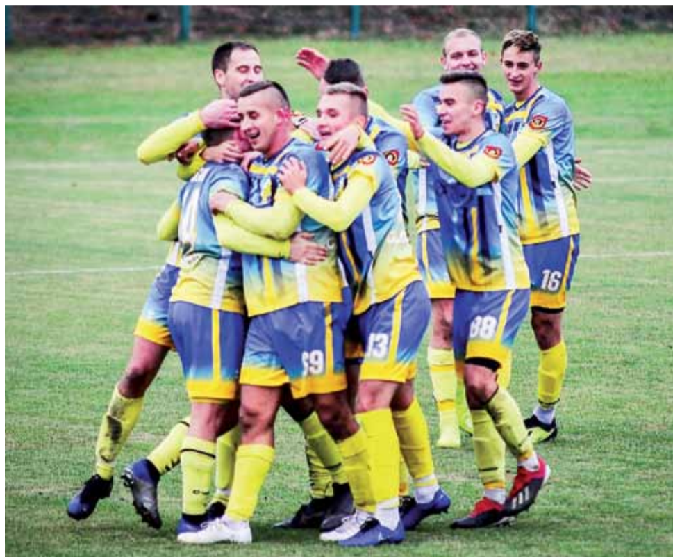
Piłkarze Stali Głowno tworzą świetną drużynę, która jest skuteczna i głodna sukcesów.

W tym wirtualnej piłkarskiej rzeczywistości znaleźli się również głowieńscy piłkarze Mistrza Łódzkiej Okręgówki z Głowna. W kategorii piłkarskich talentów umieszczono piątkę zawodników, z czego pierwsze trzy miejsca zajęli zawodnicy Stali. PlayMaker najwyżej ocenił 16-letniego Pa-