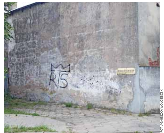
Tak dziś prezentuje się ściana przy ul. Rynkowskiego. Wkrótce pojawią się na niej motywy inspirowane światem pszczół.