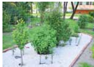
Drzewka i krzewy na naturalnym nawozie wciąż rosną, a ogródek jest dzięki temu coraz piękniejszy.

To całkiem spory i bogaty, nie tylko w roślinność, ogródek, głównie przy bloku nr 32 na osiedlu Bratkowice, w pobliżu bloków 28 i 31. W 2018 roku zdobył on pierwszą nagrodę w kategorii ogródków przy budynkach wielorodzinnych w konkursie „Zielone miasto”, zgłosiła go wtedy pani