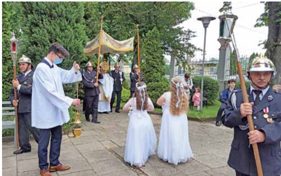
Procesja wokół kościoła Mariawitów w Lipce.

Wzorem lat ubiegłych nie zabrakło uroczystej oprawy mszy świętej w wykonaniu Orkiestry Dętej Kościoła Starokatolickiego Mariawitów w Lipce. – Graliśmy w tym roku tylko przed kościołem, nie przemierzaliśmy się, bo nie było takiej potrzeby. Zagraliśmy w nietypowych okolicz-