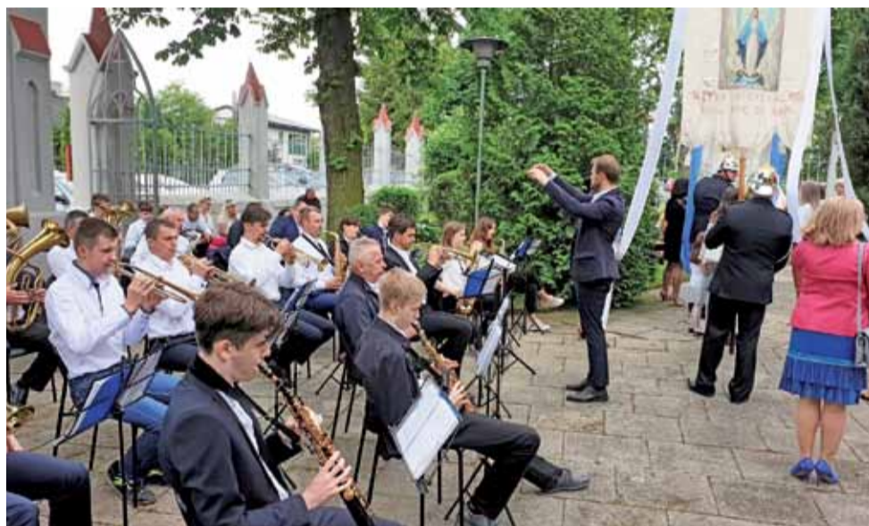
Wzorem lat ubiegłych nie zabrakło uroczystej oprawy mszy świętej i procesji w wykonaniu Orkiestry Dętej Kościoła Starokatolickiego Mariawitów w Lipce.