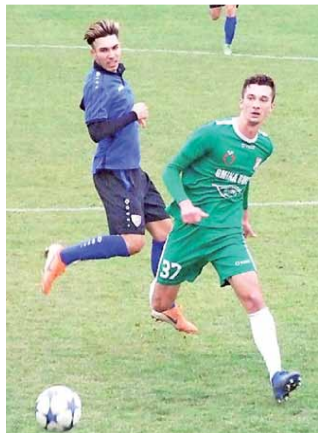
Piłkarze Zjednoczonych (niebieskie koszulki) wykazali się bardzo dobrą skutecznością w pierwszym od dawna meczu.