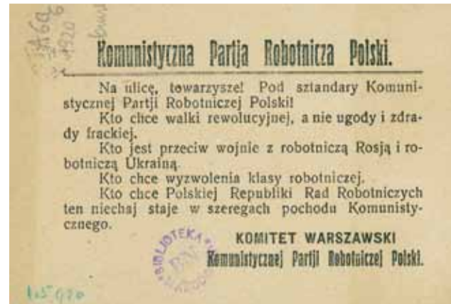
Ulotka Komunistycznej Partii Robotniczej Polski.

Zaczynamy się cofać, lecz to już za późno na regularny odwrót. Drogę mamy odciętą. Skręcamy w bok, w prawo, a tu zielona łąka. Na skraju łąki mamy pod sobą jeszcze dość silny grunt, choć już cośkolwiek miękki. Idziemy dalej – a to bagna! Konie grzęzną – błoto sięga im po brzuchy, a żołnierze wpadają po pas. [...] Cofać nie możemy się, bo bolszewicy już na skraju łąki, już strzelają do nas jak do kaczek, topiących się w błocie. Zabijamy więc konie wystrzałem z rewolweru. Na co mają się dłużej męczyć? Dla nich ratunku już nie ma. [...] Wszyscy wpadamy po pas w błoto. Kto mniejszy wzrostem, a grubszy, wpada po szyję w bagno i topi się. Śmierć z dwóch stron zagląda nam w oczy. [...] Nikt nikogo ratować nie może, przeciwnie – jeden drugiego