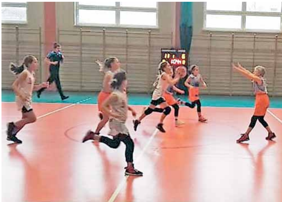
Koszykarki TK Basket Stryków (pomarańczowo-szare stroje) udanie prezentują się w Lidze Wojewódzkiej.