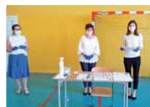
Członkowie komisji w SP w Bratoszewicach mieli na twarzach maseczki ochronne.

Podczas egzaminów uczniowie i nauczyciele są zobowiązani do przestrzegania wytycznych sanitarnych opracowanych przez Centralną Komisję Egzaminacyjną, Ministerstwo Edukacji Narodowej oraz Głównego Inspektora Sanitarnego, a to oznacza m.in. odpowiedni odstęp między ławkami. W efekcie, przy większej ilości uczniów, w części szkół egzamin odbywa się w kilku salach