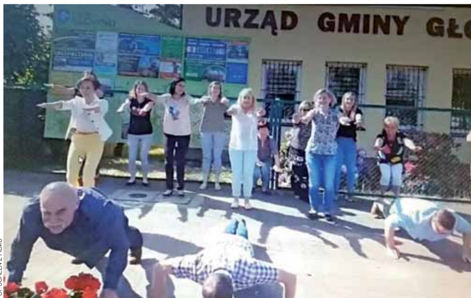
Panowie pompują, a panie wykonują przysiady – a wszystko to z myślą o potrzebujących!

Zgłoszenia przyjmowane są poprzez FB: Yacht Club Głowno oraz pod numerem telefonu: 604-273-466. aw