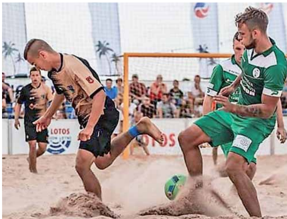
Piłkarze Pro-Fartu (czarno-żółte stroje) nie powalczą w tym roku w rozgrywkach młodzieżowych.

W niedawno opublikowanym komunikacie Departament Rozgrywek Krajowych PZPN poinformował o spotkaniu Komisji ds. Futsalu i Piłki Plażowej z przedstawicielami klubów uczestniczących w rozgrywkach piłki nożnej plażowej, w którym omówiono szczegóły nadchodzącego sezonu beach soccera. Zgodnie z ustaleniami przekazano terminy turniejów plażowej piłki nożnej. Już na początku wakacji w dniach 3-5 lipca odbędzie się Puchar Polski Kobiet w kategorii open, w którym 8 zespołów awansuje do Mistrzostw Polski Beach Soccera Kobiet. Tydzień później podob-