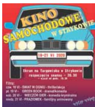
Plakat promującego wydarzenie.

Duży ekran kinowy zostanie rozstawiony w miejscu, gdzie zwyczajowo organizowana była scena dla artystów występujących na przykład podczas Dni Strykowa. Wszystkie seanse mają rozpocząć się o godzinie 20.30, ale wjechać na teren targowiska będzie można już godzinę wcześniej. – Lepiej zaplanować sobie kilka, kilkanaście minut na zapar-