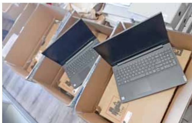
Nowoczesne notebooki trafiły m.in. do uczniów głowieńskich szkół podstawowych.

Starania o dofinansowanie na zakup sprzętu komputerowego dla potrzebujących uczniów czyni obecnie również gmina Głowno. Pod koniec maja złożono wniosek o przyznanie dotacji w wysokości 55 tysięcy złotych i została ona przyznana. Pozwoli na zakup 24 laptopów. Zgodnie z ideą projektu sprzęt przekazany zostanie uczniom z rodzin wielodzietnych. Dodajmy, że w gminie takich rodzin, w których dodatkowo wychowują się uczniowie szkół podstawowych, jest 47. Poprzednio gmina zakupiła sprzęt wart 55.649 złotych. Wówczas potrzebne było