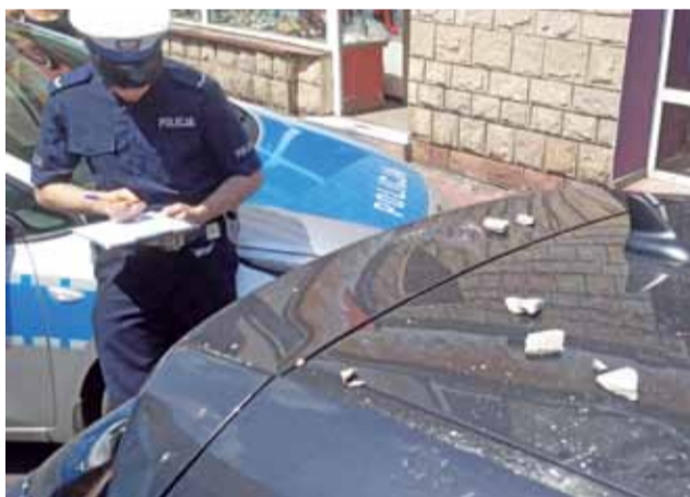
Właścicielka samochodu wezwała na miejsce policję, by mieć potwierdzenie tego, że doszło do takiego zdarzenia.

– Na Kołacinie jest częściej. Paliwo potaniało, to od razu widać, że leją pod korek – żartują strażacy. Ostrzegają jednak przy okazji, by kierowcy zwracali uwagę na to, czy z ich samochodów nie ma większych wycieków. – Po pierwsze szkoda paliwa, bo drugie na takich plamach bardzo łatwo inni kierowcy mogą wpaść w poślizg i nieszczęście gotowe – mówią. Mak