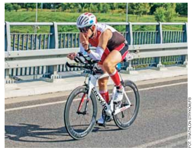
Triathloniści zawitają do Strykowa, ale dopiero w 2021 roku.