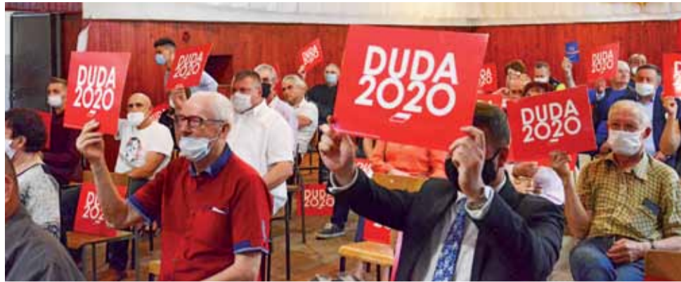
Wśród uczestników spotkania dominowali zwolennicy obecnego prezydenta, którzy trzymali transparenty z nazwiskiem swojego kandydata i wyrażali swoje poparcie dla niego, m.in. skandując „Andrzej Duda”.

– Teraz chcą wracać – przekonywała, odwołując się do wprowadzonych programów społecznych, które wspierają rodziny. Podniesione zostały także płace minimalne. Europosłanka nadmieniła, że Andrzej Duda od-