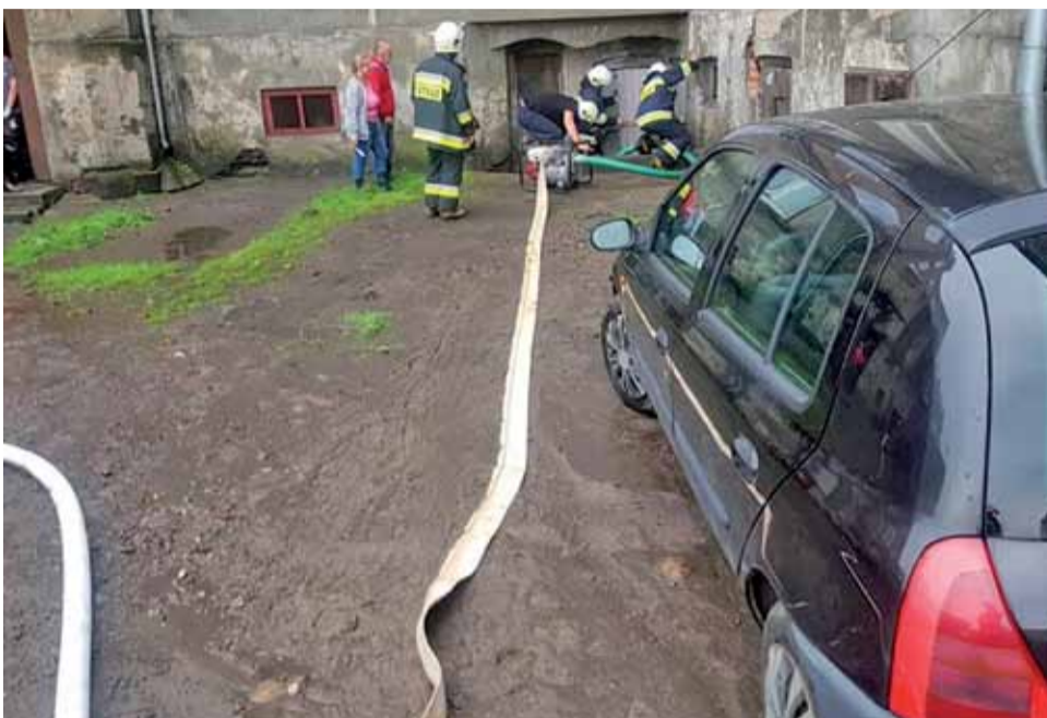
OSP Dmosin podczas wypompowywania wody z zalanych posesji w Zgierzach.