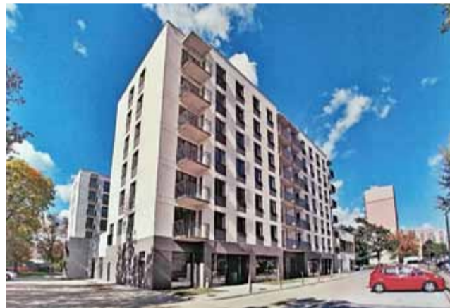
Czy podobny obiekt, łączący część mieszkalną i usługową powstanie w Głownie?

że sam najbardziej zainteresowany jest powstaniem niewielkiego kompleksu budynków z częścią usługową na terenie zielonym przy zalewie Mroźczka, gdzie zwyczajowo odbywały się imprezy miejskie (m.in. Dni Głowna), a także terenem leśnym wzdłuż ul. Sikorskiego, w przypadku którego rozważane jest wykorzystanie powierzchni ok. 7 hektarów. Według wstępnej koncepcji mogłyby tam powstać obiekty mieszkalno-usługowe, składające się z dwóch niezależnych budyn-