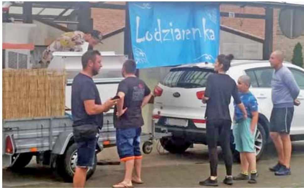
Dodatkową atrakcją były lody, które można było kupić z wprost z przyczepy.