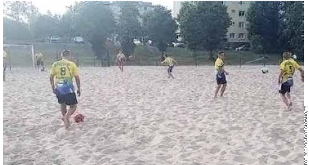
Piłkarze plażowi BSC Pro-Fart na plaży w Głownie rozpoczęli przygotowania do sezonu 2020.