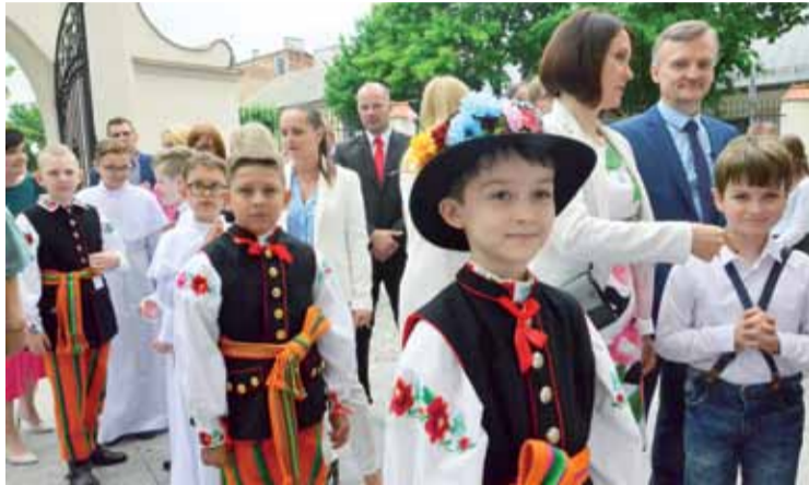
W tym roku bardzo widoczny jest trend ubierania dzieci komunijnych, także chłopców, w stroje łowickie.