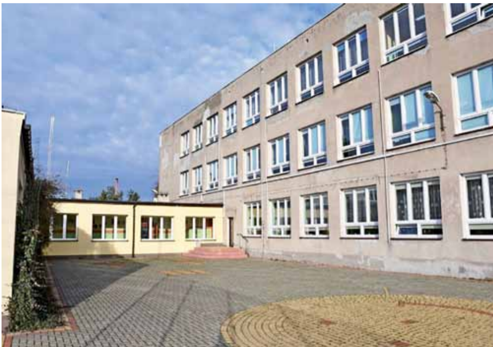
Budynek Szkoły Podstawowej Nr 2 w Strykowie znacząco się zmieni w ciągu wakacji.

Co zostanie wykonane? Przede wszystkim docieplone zostaną, 14-centymetrowej grubości styropianem, ściany zewnętrzne i stropodach na szkole. Tam, gdzie będzie to możliwe, zostanie wdmuchnięty pod stropodach granulata z wełny mineralnej, a tam, gdzie nie – położone będą dachowe płyty styropianowe laminowane papą.