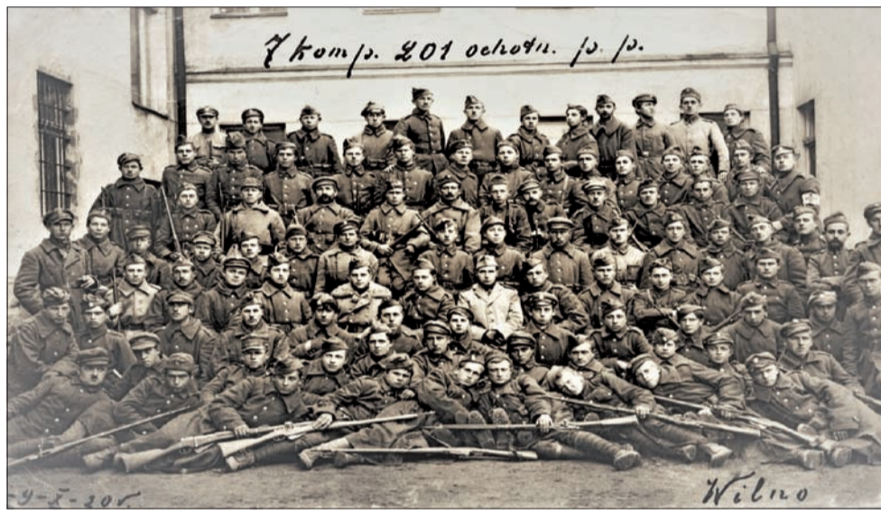
7 kompania 201 ochotniczego pułku piechoty, w której walczyli łowiccy ochotnicy, fot. wykonana w Wilnie 9 X 1920 r.

Armia Polska słabo uzbrojona, z oficerami wychowanymi w armiach państw zaborców, potrzebowała wzmocnienia o nowych żołnierzach. Zdecydowano o powołaniu uzupełniającej Armii Ochotniczej. Ochotnikami byli ludzie z trzech zaborów, o różnym wykształceniu, których łączyły wyniesione z do-