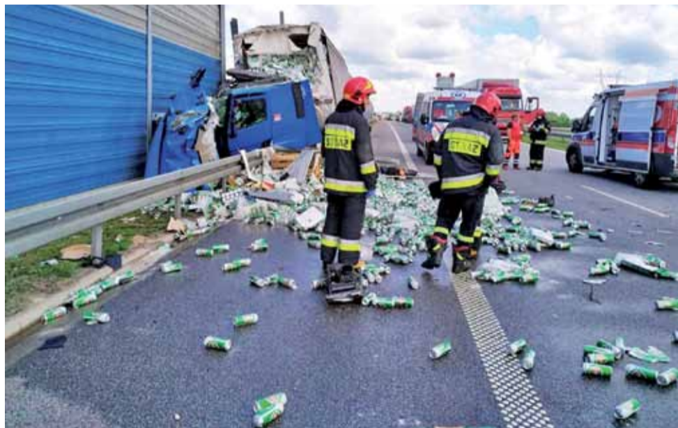
Akcję na A2 prowadzili strażacy z OSP Dmosin i JRG Brzeziny.

Reprezentant firmy Abart Development przedstawił jednocześnie zasady, na jakich możliwe byłoby nabycie mieszkania. Jak zapewnia, najpierw można byłoby je wynająć, by następnie w ciągu dziesięciu lat wykupić na korzystnych zasadach: za gotówkę, w oparciu o indywidualny kredyt mieszkaniowy lub z wykorzystaniem sposobu finansowania przygotowanego przez inwestora, czyli możliwości odroczenia spłaty 2/3 ceny netto zakupu mieszkania na okres 10 lat. str. 7