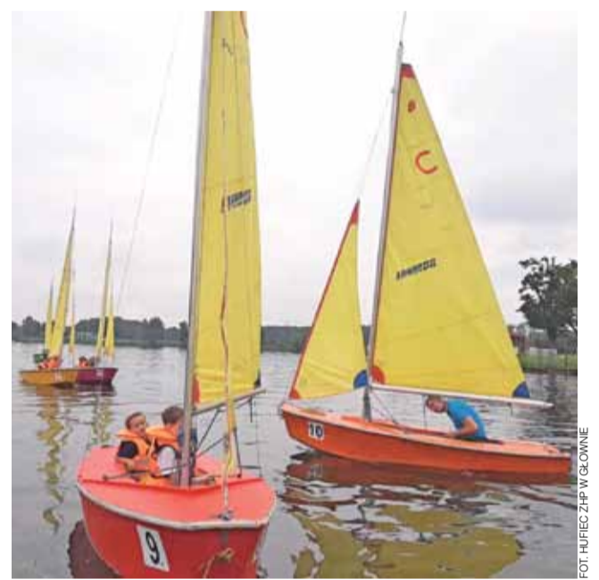
Żeglarskie szalenstwa już trwają, ale do miłośników wodnych wrażeń wciąż można dołączyć.

Warsztaty przeznaczone są dla dzieci w wieku od 6 do 12 lat. Obowiązują na nie wcześniejsze zapisy pod numerem telefonu 500-379-424. Organizatorzy zapewniają opiekę dla dzieci w godzinach od 7 do 17. W programie zajęcia sensoryczne, gry i zabawy sportowe, warsztaty rękodzielnicze, spotkania z ciekawymi ludźmi itp. mak