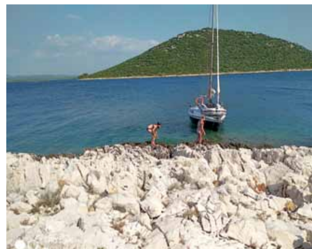
Dno morskie skaliste, plaża też, ale ten kolor nieba i wody – po prostu bajkowe. Ale to Morze Adriatyckie, na Bałtyku będzie zupełnie inaczej.

Jak nam powiedzieli, założyli żeby płynąć w odległości około 3 mil od brzegu, żeby w razie potrzeby można było wracać, a w awaryjnych sytuacjach mogą nawet wypłynąć w plażę. Mają taką techniczną możliwość, ponieważ ich żagłówek ma regulowane zanurzenie. Ważący 200 kg miecz z 200-kilowym bulem mogą podnieść i dzięki temu wypłynąć na płytką wodę i wbić się w ląd. Wy-