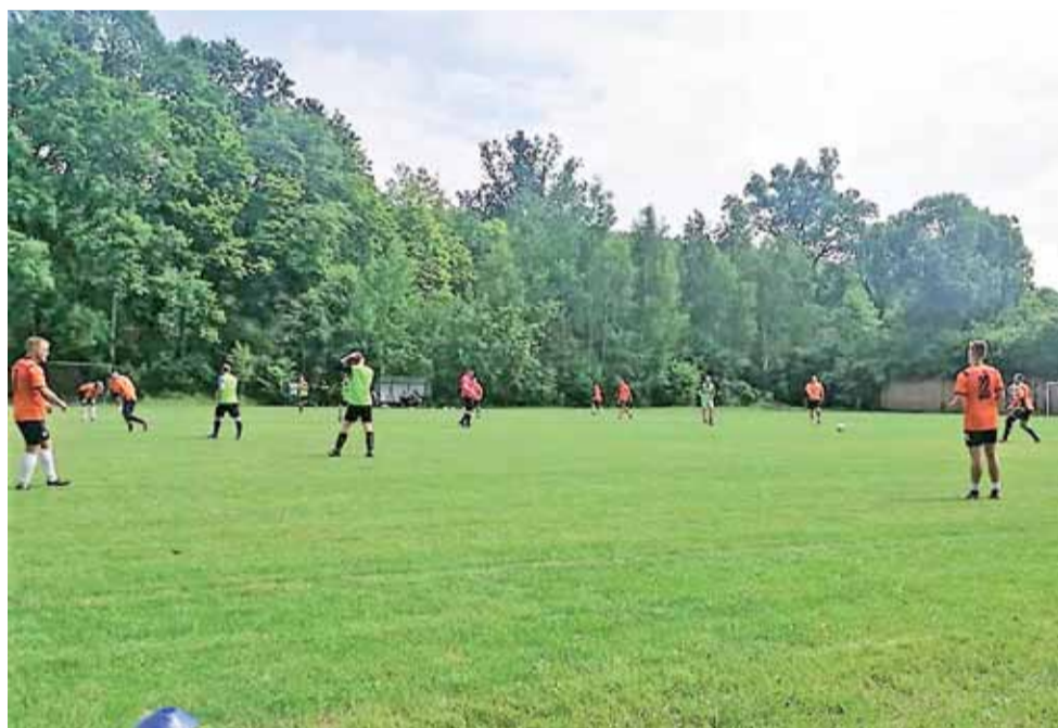
Drużyna Strugi Dobieszków (pomarańczowe koszulki) w nowym sezonie chce uzyskać dobry wynik.