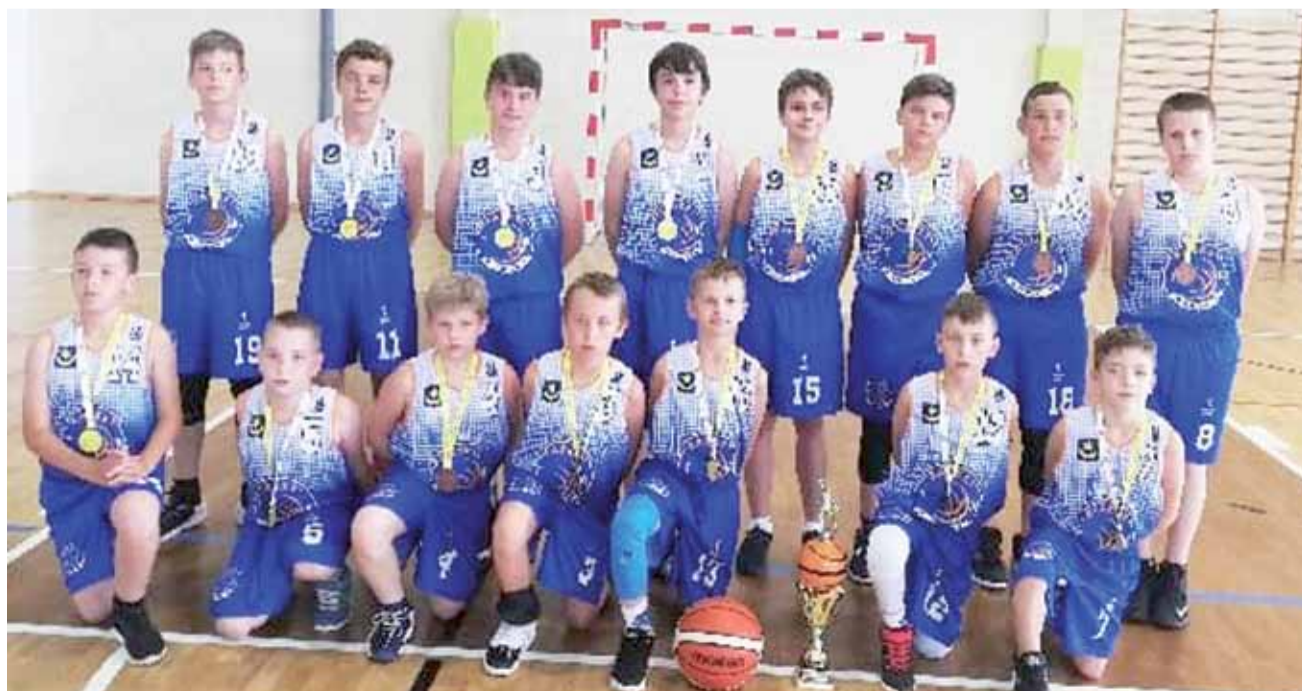
Drużyna żaków TK Basket Stryków wywalczyła brązowy medal w Wojewódzkiej Lidze Koszykówki U-12.