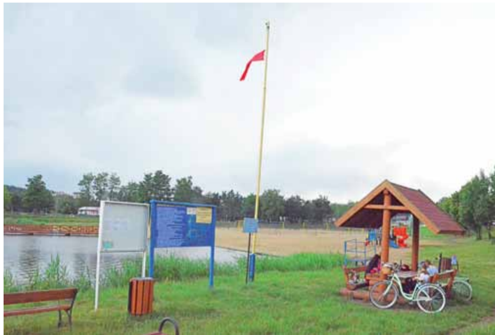
W dniu rozpoczęcia sezonu kąpielowego nad głowieńskim zalewem powiewała czerwona flaga.

Oficjalnie, wspomnianego dnia sezon rzeczywiście ruszył, jednak pierwsi plażowicze nie skorzystali z opcji kąpieli, bowiem nad obiektem powiewała czerwona flaga, sygnalizująca zakaz wejścia do wody. Na miejscu, naszym re-