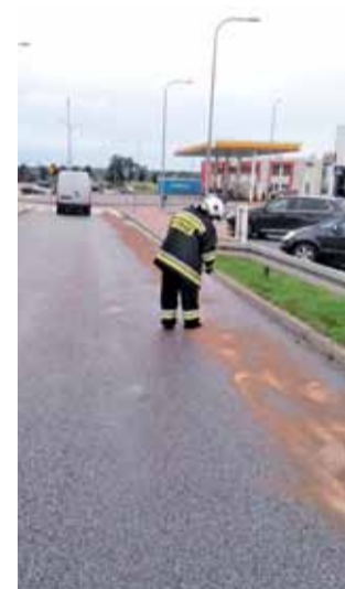
Strażacy z Dmosina w trakcie usuwania plamy substancji ropopochodnej.

Do zanieczyszczenia parkingu i drogi doszło w wyniku awarii zbiornika na paliwo w samochodzie osobowym, który kilka minut wcześniej zatankował większą ilość paliwa. Strażacy byli na miejscu ponad 2 godziny. mak