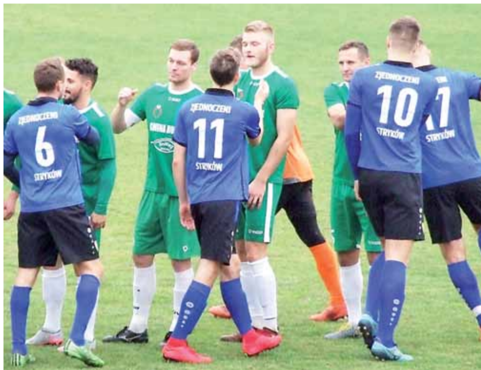
Piłkarze Zjednoczonych Stryków liczą na bardziej udany sezon niż ostatnio w rozgrywkach IV Ligi.