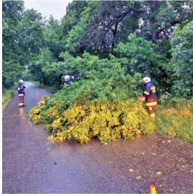
Złamany konar drzewa częściowo blokował drogę powiatową Kołacin - Głowno w miejscowości Koziołki.

OSP z Woli Cyrusowej pierwszy wyjazd miała już ok. godziny 4. rano.