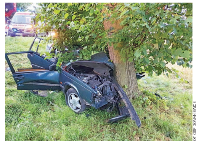
Volvo z nieustalonych przyczyn wypadło z drogi i uderzyło w drzewo. Podróżujące nim osoby zostały uwięzione w środku.

Na pomoc ruszyła OSP Domaniewice oraz zastępy JRG z PSP w Łowiczu i Strykowie. Strażacy z użyciem narzędzi hydraulicznych wydobyli osoby poszkodowane i przekazali je ratownikom z pogotowia. Kobieta została przetransportowana śmigłowcem LPR do szpitala w Warszawie. Mężczyzna, karetką – do szpitala w Skierniewicach. Ich życiu nie zagraża niebezpieczeństwo. mwk