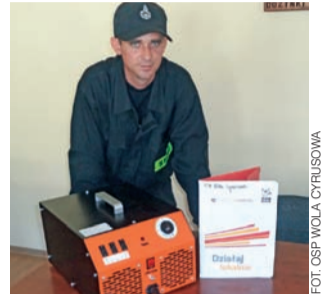
Strażacy z OSP Wola Cyrusowa ozonowali salę konferencyjną w Dmosinie przed ostatnią sesją.

W ramach realizacji tegorocznego projektu z programu „Działaj Lokalnie” jednostka OSP Dmosin zakupiła opryskiwacz spalinowy Sthil, który będzie wykorzystywany do dezynfekcji różnego rodzaju powierzchni na terenie gminy oraz generator ozonu (ozonator) do zwalczania niepożądanych mikroorganizmów z pomieszczeń użyteczności publicznej, a przede wszystkim, żeby skutecznie walczyć z pandemią koronawirusa. Dodatkowo dmosińscy strażacy kupili kombinzony ochronny oraz płyny do dezynfekcji. Sprzęt