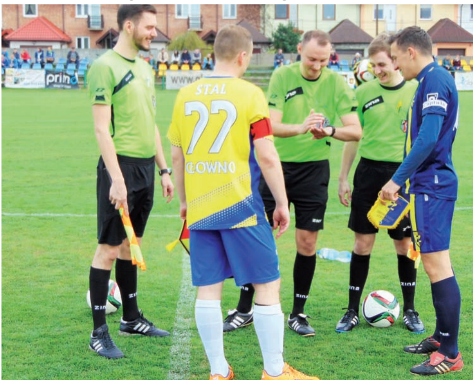
Derby Stal Głowno - Zjednoczeni Stryków z pewnością cieszyć się będą wielkim zainteresowaniem.