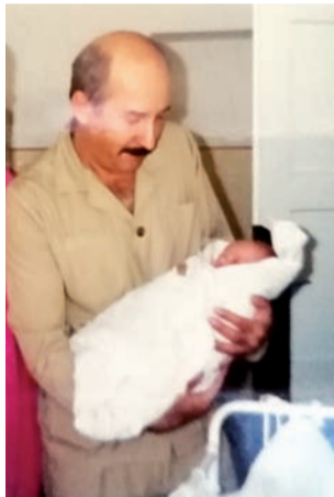
Na oddziale w Łowiczu, z jednym z nowo narodzonych dzieci.

szoły rodzenia. Z powodu epidemii plany te musiały zostać nieco odłożone w czasie.