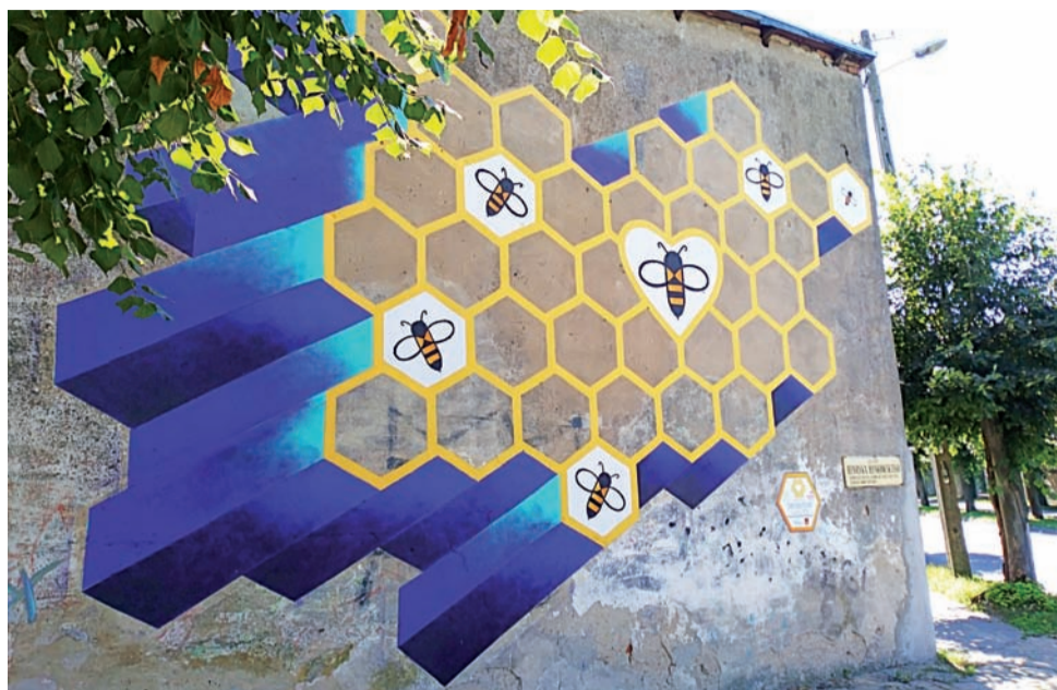
Mural przy ul. Rynkowskiego. Wygląda na niedokończony, ale... taki już pozostanie.

Nowy mural jest efektem działań twórczych dwojga artystów