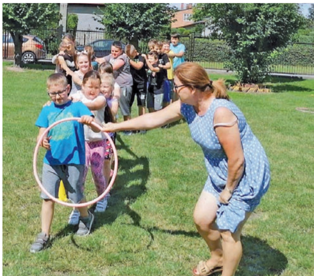
Podczas imprezy w Sobocie zorganizowane zostały zabawy i konkursy dla dzieci, których celem było rozruszanie ich po lockdownie.