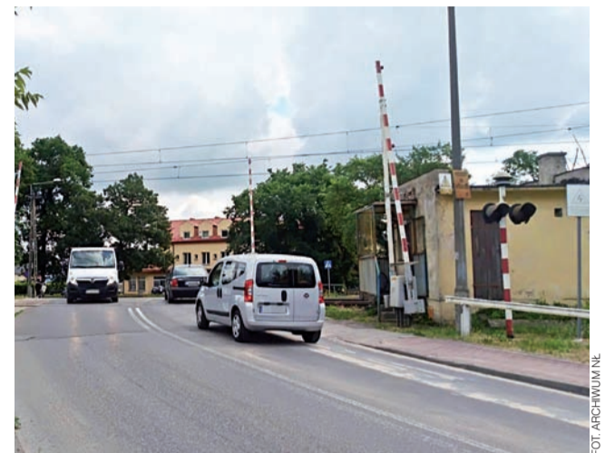
Tunelu w tym miejscu nie będzie na pewno przez kilka najbliższych lat. Czy uda się kiedykolwiek?

Łowickie.pl w swoim oświadczeniu wyjaśnia, że złożył wniosek, aby w Wieloletniej Prognozie Finansowej miasta na lata 2020 – 2032 zabezpieczyć 400 tys. zł w roku 2024 oraz w 2025 na wykonanie dokumentacji projektowej tunelu. Zdaniem klubu, w tych latach sytuacja finansowa miasta się poprawi. Radni z Łowickie.pl podkreślają, że ich zdaniem umowa wynegocjowana z PKP przez burmistrza Łowicza Krzysztofa Kalińskiego była nie-