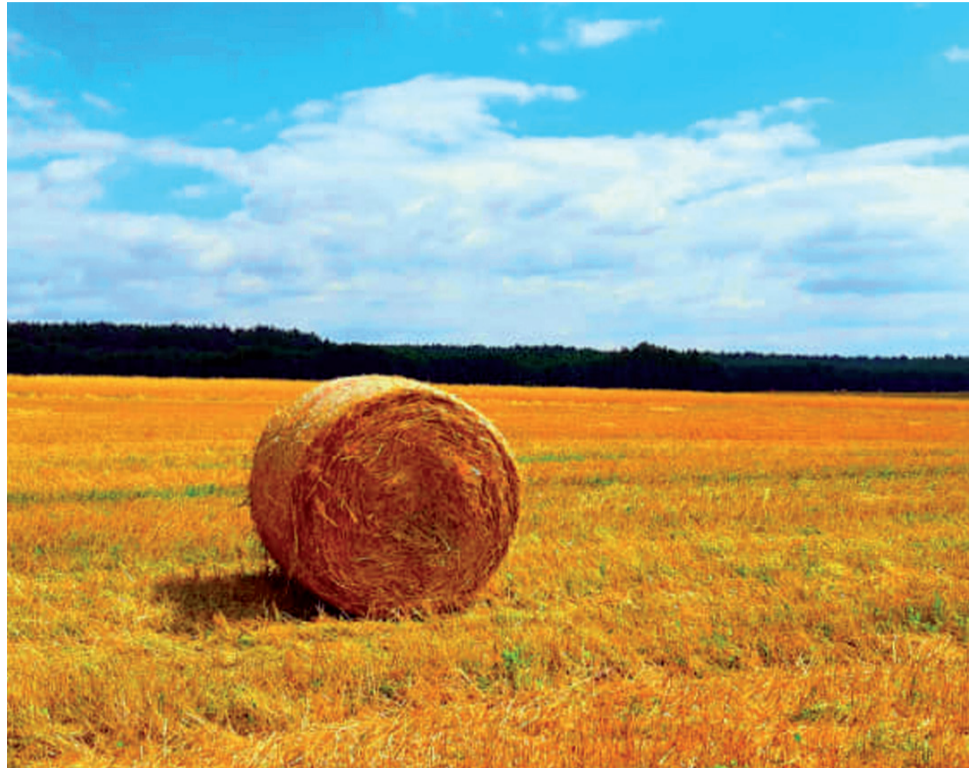
To zdjęcie zrobione było w sobotę 1 sierpnia podczas żniw w gospodarstwie państwa Mitek we wsi Dąbkowice Górne w gminie Łowicz i umieszczone na naszej grupie facebookowej „W obiektywie Łowiczaków”

Igielski w rozmowie z naszą reporterką zauważył, że ceny w skupach są na razie porównywalne z tymi z ubiegłego roku. My, porównując ceny ubiegłoroczne z aktualnymi, zauważamy już jednak, że rok temu były one wyższe. Potwierdził to także rolnik z Guźni (gmina Łowicz),