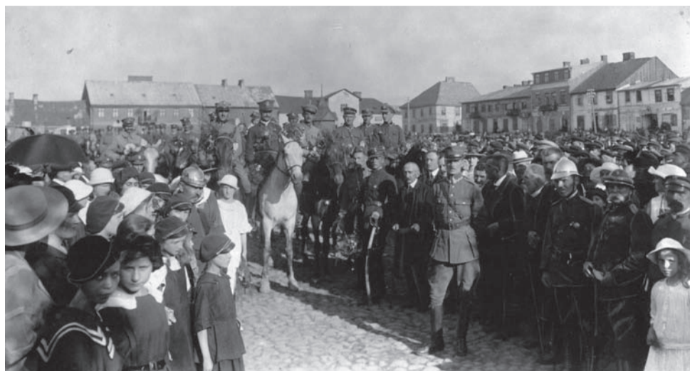
Ciechanów, 1920. Pożegnanie oddziału ochotników sformowanego i wyekwipowanego przez miasto.

[Rok 1920. Wojna polsko-radziecka we wspomnieniach i innych dokumentach, Warszawa 1990]