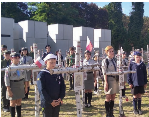
W godzinę „W” harcerze towarzyszyli poległym powstańcom.