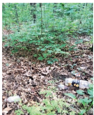
Na taki widok codziennie natykają się spacerowicze.

Zadanie to zrealizowano w ramach akcji „Serce dla pszczół” współfinansowanej ze środków Fundacji Orlen. aw