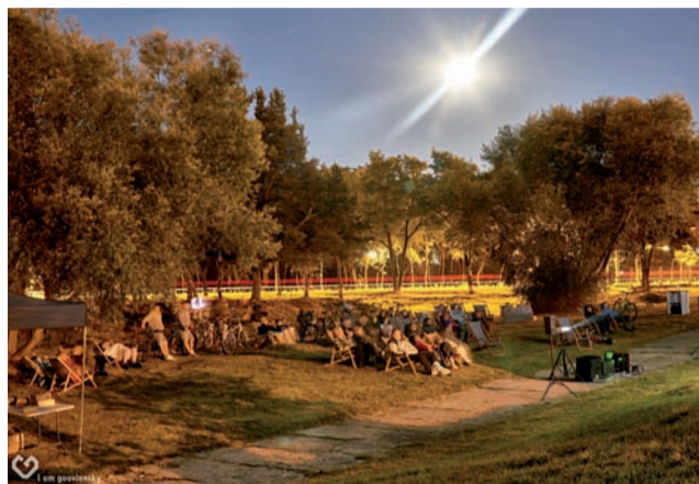
To pierwsze rowerowe kino w naszym mieście, ale na pewno nie ostatnie!

Entuzjaści jednoślądów licznie przybywali na plażę przy Mroźyczce, która w piątek 31 lipca zamieniła się w rodzaj plenerowej sali kinowej. W ramach inauguracyjnego pokazu wyświetlono film „Najlepszy” – dzieło w reżyserii Łukasza Palkowskiego z 2017 roku, inspirowane historią życia Jerzego Górskiego, który po narkotykowych doświadczeniach oraz wygranej walce z nałogiem został sportowcem, zdobywając