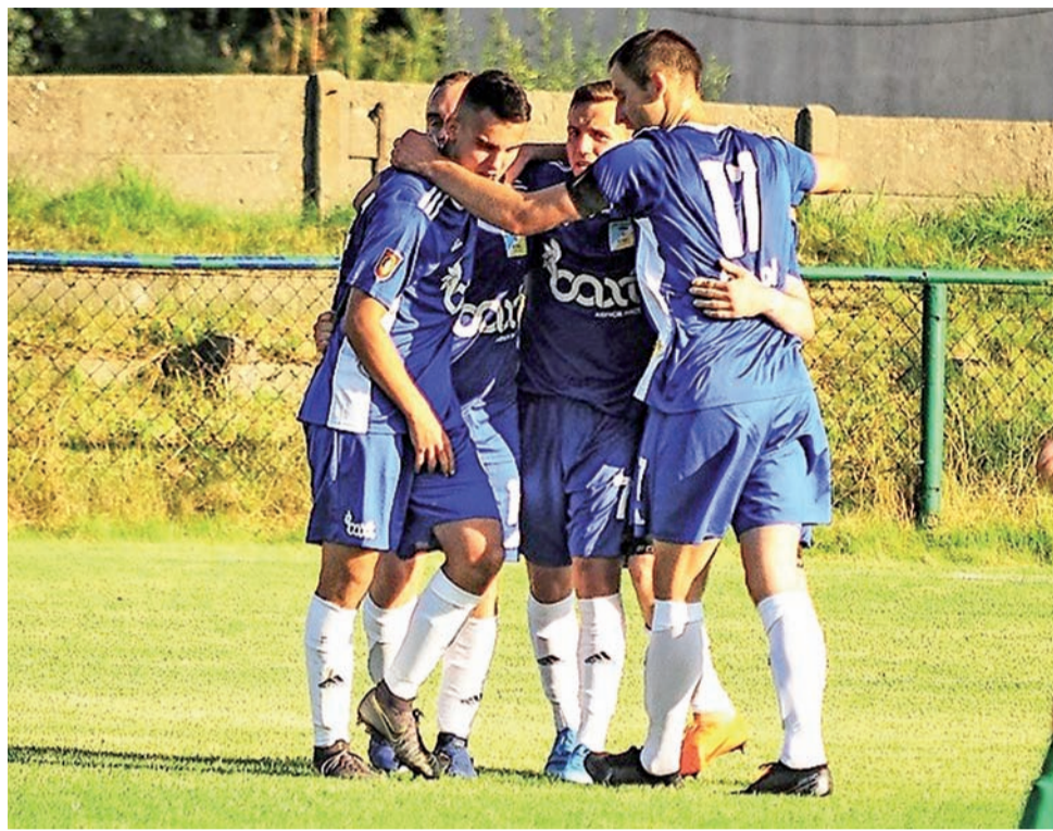
Drużyna z Głowna od zawsze była postrzegana jako grupa ludzi wspierających się w drodze do wspólnego celu. Stal to najbardziej rozpoznawalny klub sportowy w regionie.