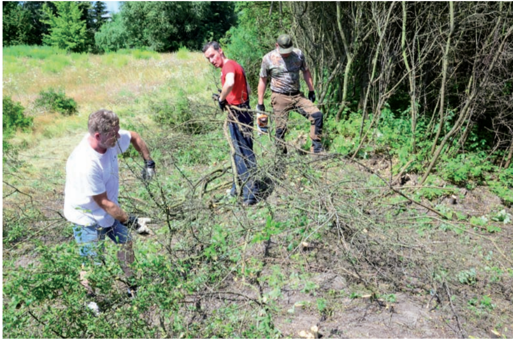
Mieszkańcy Bolimowa ciężko pracowali nad wycięciem tarniny z cmentarza żydowskiego, który porządkowali.

Porządki rozpoczęły się około godziny 10.00 i polegały przede wszystkim na karczowaniu krzewów tarniny. Roślina ma bardzo