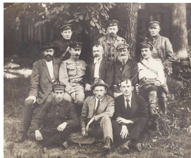
Członkowie Tymczasowego Komitetu Rewolucyjnego Polski.

Dowiedz się więcej: www.niepodlegla.gov.pl , www.karta.org.pl