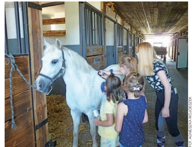
Nauka czyszczenia konia. Klacz Fiesta cierpliwie poddawała się zabiegom pielęgnacyjnym prowadzonym przez dzieci.

Jej koleżanki zapewniały z kolei, że ten dzień był dla nich wyjątkowy, bo pozostając z dala od miejskiego zgiełku po raz pierwszy od dawna mogły się rozkoszo-