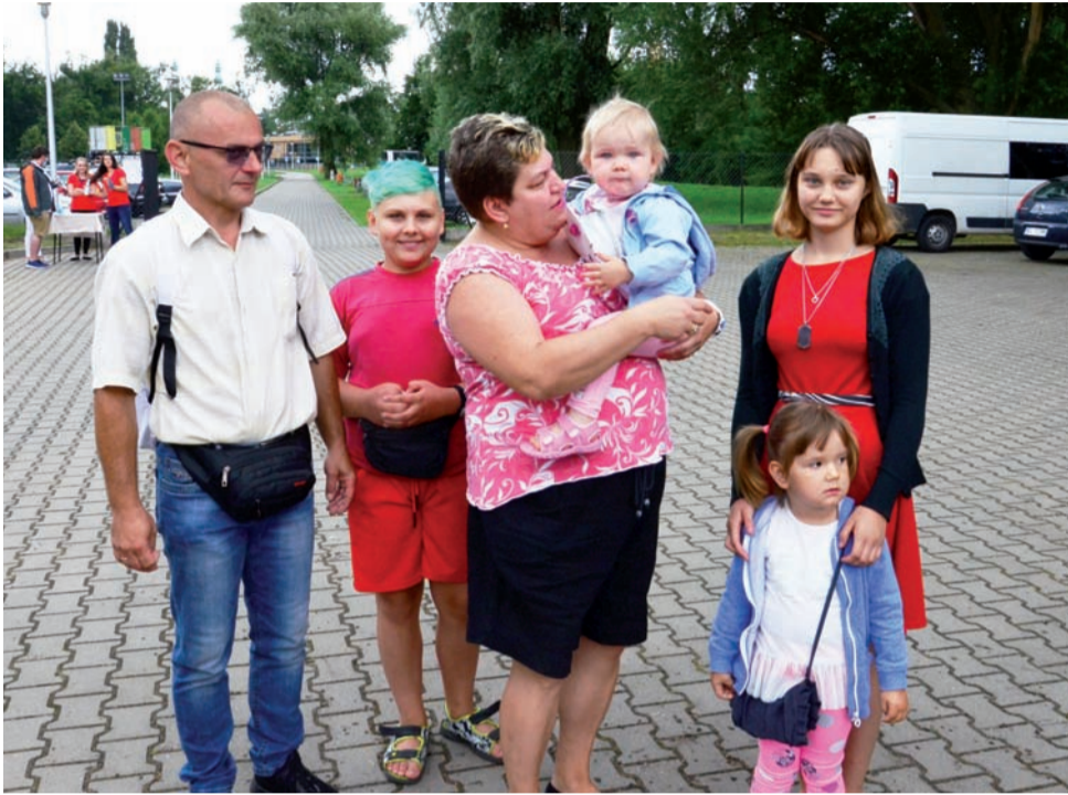
Dzień Rodzicielstwa Zastępczego ma na celu promowanie takich form pieczy zastępczej.

Niektóre dzieci już mają swoje rodziny, ale przecież gdy do niej przyjeżdżają, to nadal sami robią sobie herbatę czy biorą coś do jedzenia, to znaczy – czują, że są u siebie