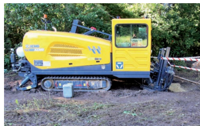
Maszyna umożliwiająca układanie wodociągu metodą przecisku sterowanego.

Oprócz tego strykowski ZGKiM zakończył w ostatnich