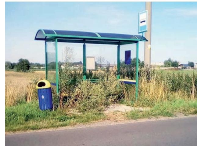
Przystanek w Zelgoszczy w gminie Stryków sfotografowany przez Bogdanę Walczak.

Wydarzenie jest częścią projektu „Filmowe podróże wokół Główna – Rowerowe Główno”, współfinansowanego przez Miasto Główno oraz Stowarzyszenie LGD „Polcentrum” w ramach programu Działaj Lokalnie. aw