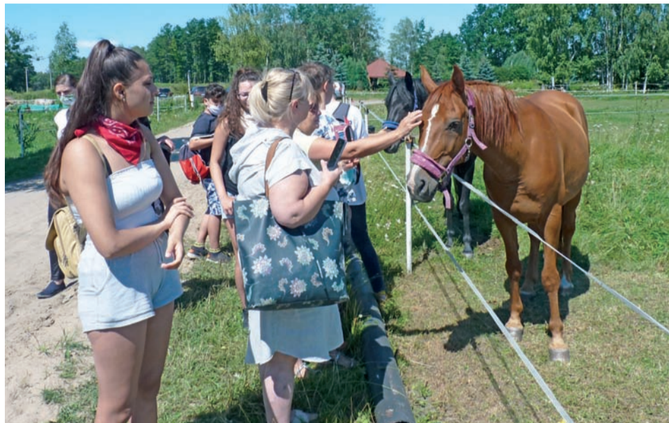
Niektórzy mieli obawy przed zabawą z końmi, ale spokój zwierząt pozwolił im pokonać te lęki.

– Znam ją od wielu lat, bo to na niej uczyłam się jeździć. To bardzo spokojny koń, więc można było bez strachu czyścić ją szczotkami twardymi i miękkimi. Nie-