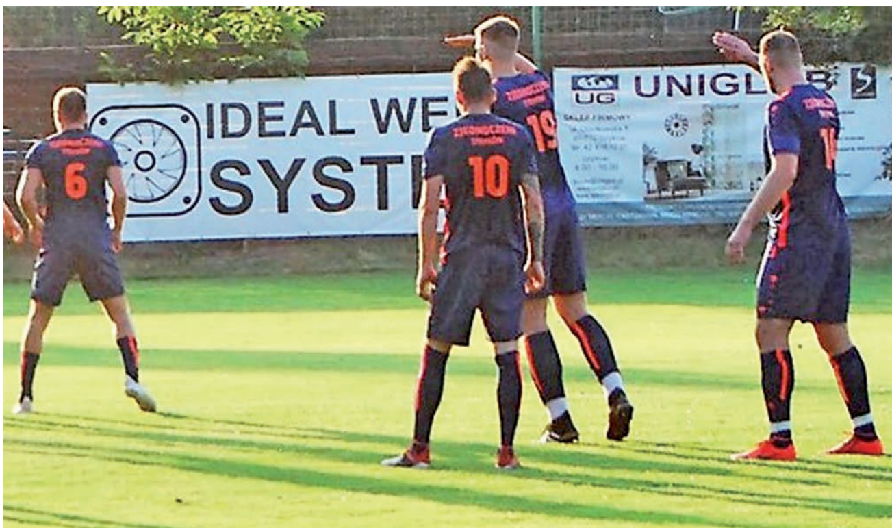
Piłkarze Zjednoczonych Stryków nieźle weszli w swój 20-ty sezon w rozgrywkach IV Ligi. Podopieczni trenera Łukasza Wijaty celują w tym roku w górną połowę tabeli, strykowianom powinno pomóc doświadczenie.