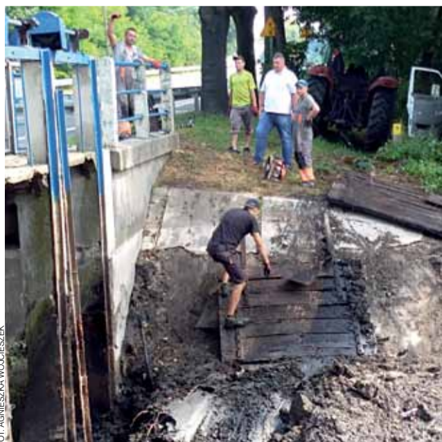
Rozpoczęcie działań to dobra wiadomość dla mieszkańców okolicy, którzy uskarżali się na uciążliwości związane z nieprzyjemnym zapachem utrzymującym się w pobliżu obiektu.

– przez co w obie strony tworzył się zator. str. 4