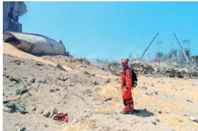
Rozpoznanie w „Strefie Zero”.

Dodatkowo nowymi okolicznościami było pozostawienie dużej samodzielności w działaniu polskiej GPR. – Zazwyczaj wykonujemy zadania grupy koordynującej, która zleca priorytety ratownicze. W Bejrucie obdarzano nas dużym zaufaniem i odpowiedzialnością. Nie dość, że dostaliśmy największy sektor to sami pro-