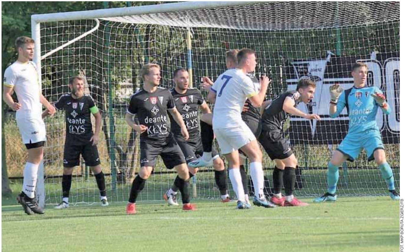
Zjednoczeni Stryków (białe stroje) zawsze mieli dość sporo problemów w derbach powiatu z Borutą Zgierz.

Niestety mądrze grający w obronie goście nie dali się więc zaskoczyć, a sami w 81 min.