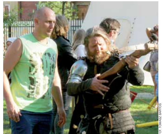
Członkowie łowickiego bractwa rycerskiego pod basztą dali możliwość mieszkańcom miasta np. postrzelać z kuszy.