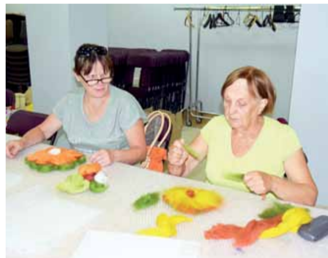
Seniorcy robiące kwiaty techniką filcowania na mokro podczas warsztatów z cyklu „Wakacyjne klimaty”.

Czterogodzinne warsztaty wymagały dużo cierpliwości i ogromu pracy, ale w efekcie powstały cuda. – Pozналиśmy naprawdę szerokie zastosowanie filcowania. Sama myślę czy nie wykorzystać jej do zrobienia szalika albo nawet torebki – dodaje seniorka. ek