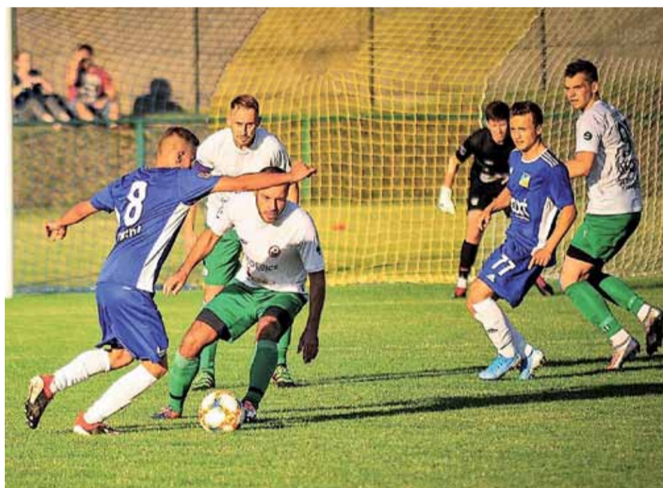
Piłkarze Stali Głowno (niebieskie stroje) dobrze spisują się jako beniaminek IV Ligi.

Na szarym końcu znajdują się dwie drużyny, które nie zgromadziły jeszcze w tym sezonie żadnego punktu – Keeza Termy Ner Poddębice i Czarni Rząśnia. Be-