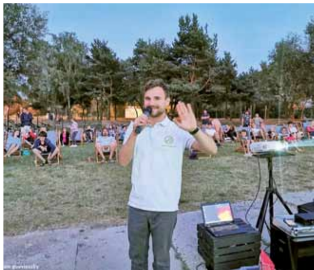
Była to już ostatnia szansa na seans w plenerze. Publiczność dopisała!

Tym razem rowerzyści mieli okazję obejrzeć amerykański dramat w gwiazdorskiej obsadzie – „Cast Away: Poza światem”. Pomysł projekcji opowieści o rozbitku, który w wyniku katastrofy lotniczej trafia na bezludną wyspę, gdzie uczy się sztuki przetrwania, przypadł do gustu lokalnym miłośnikom kina – nad Mroźczyńkę przybyli oni najliczniej w tym sezonie. – Liczba jednoślądów była imponująca. Byliśmy pod wrażeniem, bo widzów było zdecydowanie