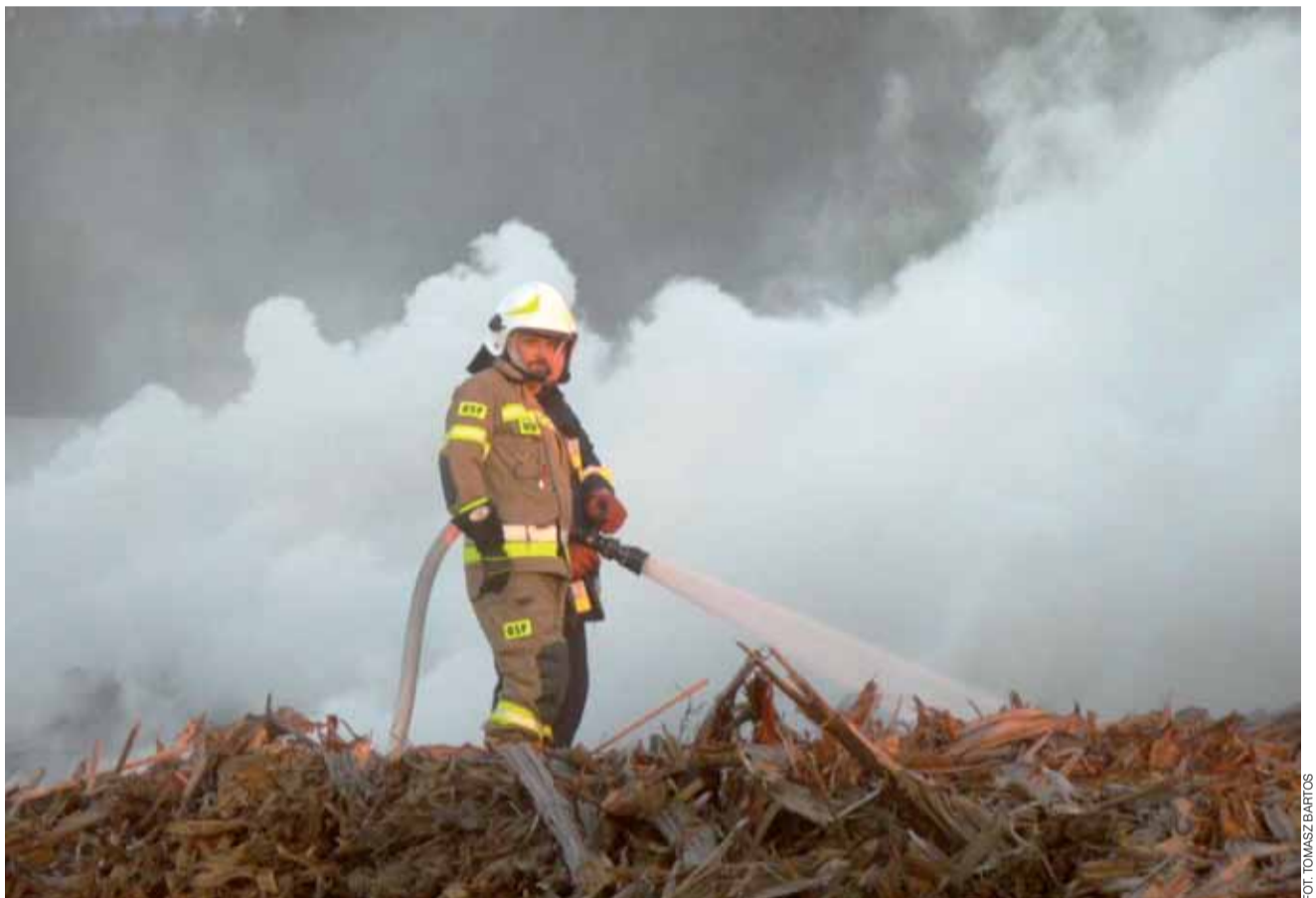
Jeden z ponad 60 strażaków, którzy przez dwa dni walczyli z żywiołem.

Gęsty dym okresowo bardzo spowalniał ruch na autostradzie A2, przy której doszło do pożaru, bo teren składowiska znajduje się w jej pobliżu. Nasz reporter, który dojechał na miejsce pożaru z Łowicza, już z daleka widział Stryków spowity dymem, tylko wieżę kościoła widać było nad