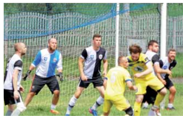
Sokół Popów (biało-czarne stroje) zagra w okręgu skierniewickim.