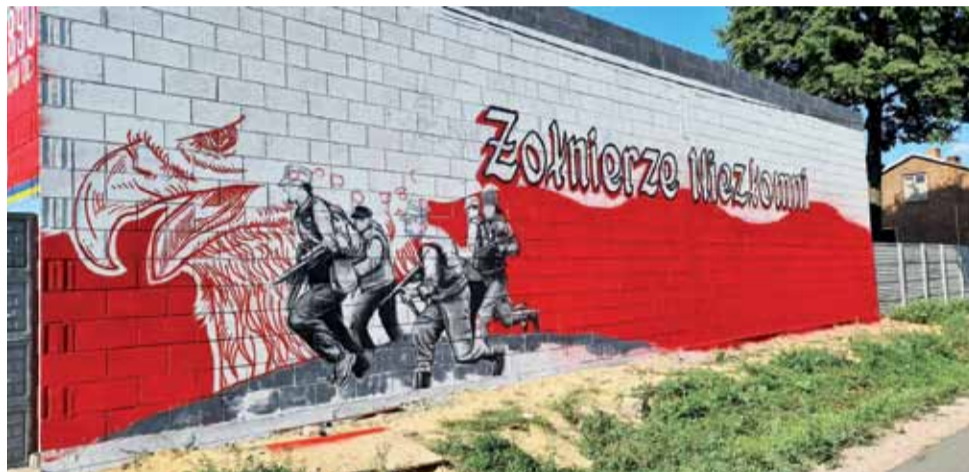
Mural na garażu w Reczycach jest już na ukończeniu.

Dlaczego w taki sposób postanowili uatrakcyjnić wygląd garażowej, dobrze widocznej z drogi