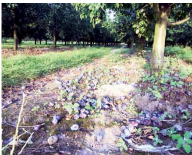
Śliwek jest w bród i są tanie. Gdzieś tam nawet nie są zbierane. Na zdjęciu sad w Sierżnikach

Na stoiskach mogliśmy kupić także śliwki, porzeczki, maliny czy borówki. Handlujący przekonali nas, że ich owoce są dużo lepsze i smaczniejsze niż te z marketów, ponieważ widać, że są świeże, polskie i pochodzą z ekologicznych upraw. – One po prostu mają inny smak! – usłyszeliśmy.