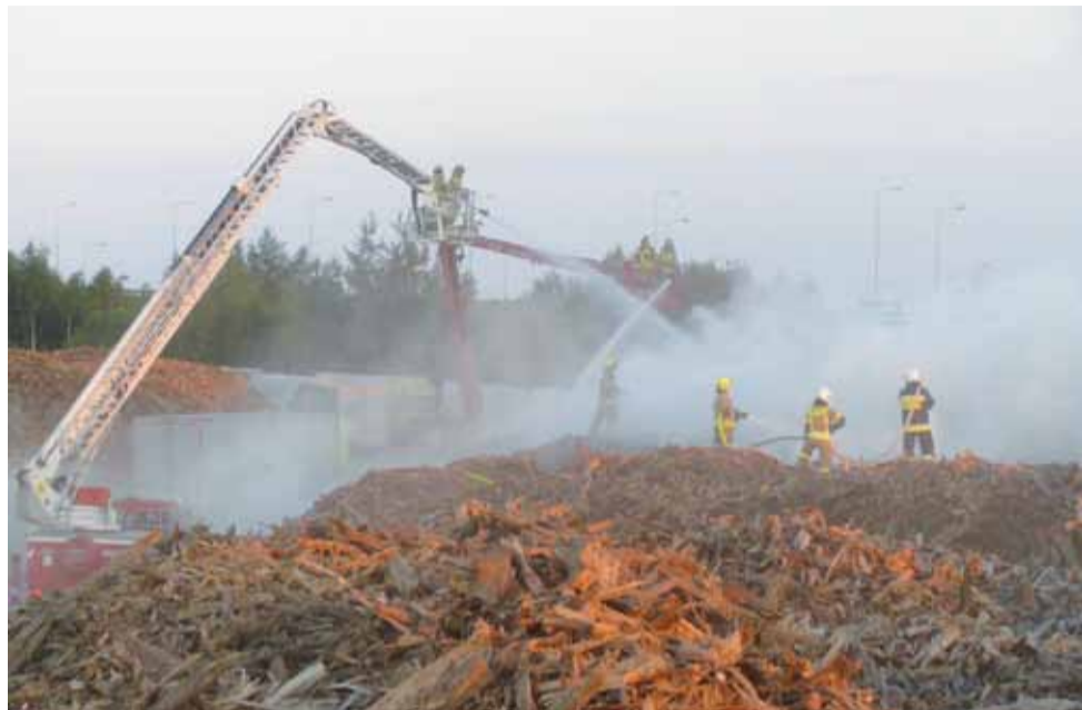
Strażacy walczyli z ugaszeniem składowiska zrębek także lejąc wodę z podnośników.

Owoce na targu. Smak broni się sam. str. 16