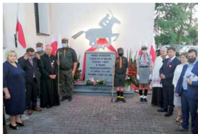
Pomnik przy kościele pw. Św. Jakuba w Głownie będzie gotowy w przyszłym roku, znajdują się na nim nazwiska głownian, którzy polegli w Bitwie Warszawskiej i walkach z bolszewikami 1920 roku.