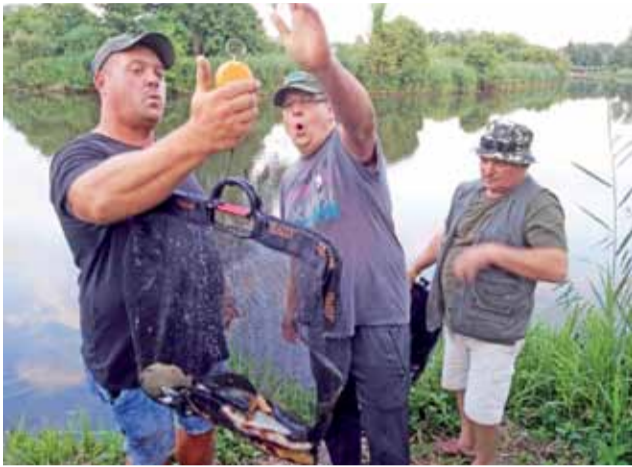
Tak wyglądało wazenie złowionych ryb podczas ubiegłorocznego memoriału wędkarskiego.

Z uwagi na sytuację epidemiczną przed przystąpieniem do zawodów będzie mierzona temperatura ciała. Organizatorzy przypominają