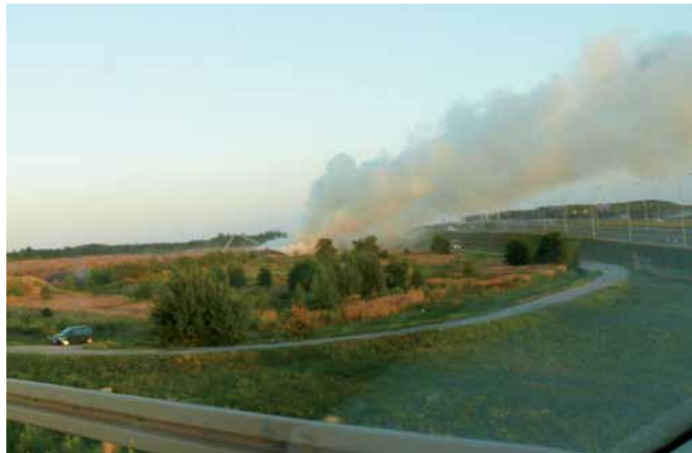
Na tej fotografii widać jak dym zawiewał nad autostradą A2.

Gmina Stryków | Wielki pożar zrębek na składowisku przy Brzezińskiej