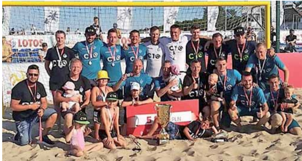
Zespół FC10 Zgierz zdobył w 2020 roku Wicemistrzostwo Polski Beach Soccera.