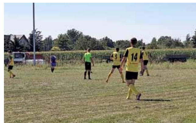
Powstaniec Dobra (żółte koszulki) wkrótce rozpocznie nowy sezon.

W 1. kolejce swędowianie podejmą na własnym boisku Sokola Skromnice, a mecz zaplanowano na niedzielę, 23 sierpnia o godz. 18:00. Obecność kibiców oczywiście bardzo pożądana. wp