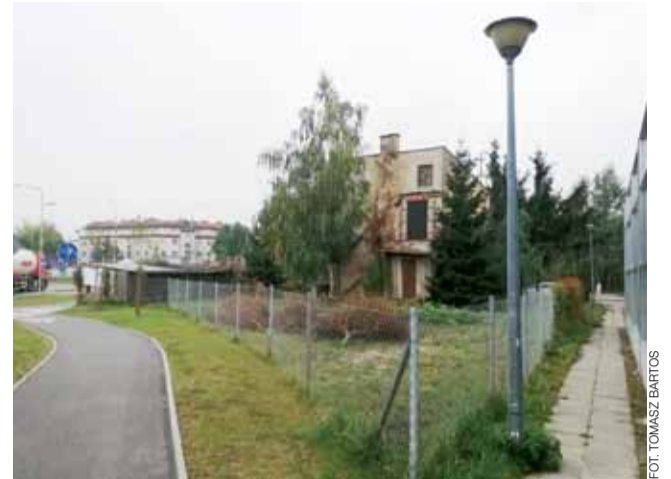
Narożny budynek przy rondzie w ul. Bolimowskiej stoi pomiędzy ekranami (z prawej strony) a DK70 (z lewej strony).

– Jak długo będziecie się jeszcze zastanawiać? – pytał.