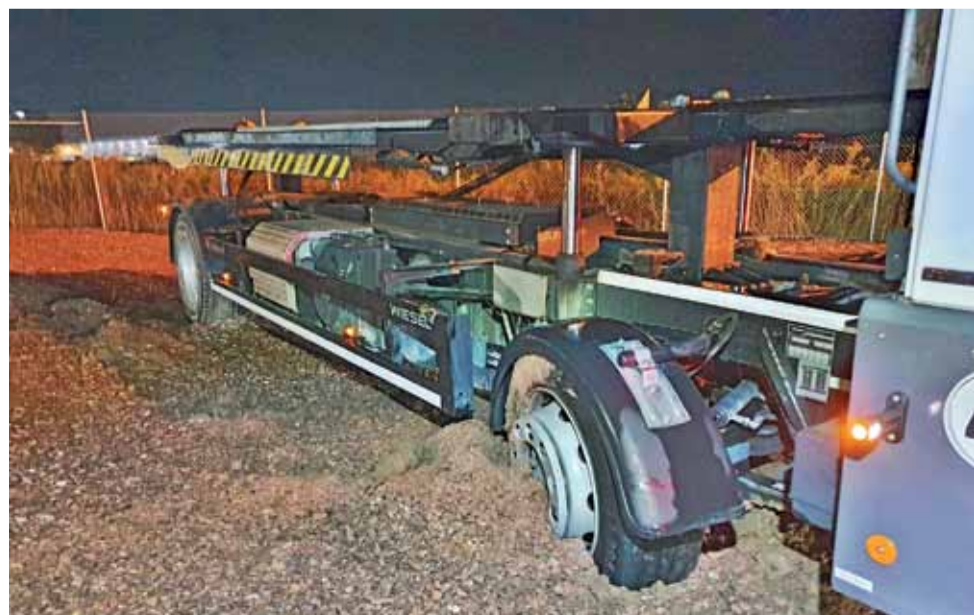
Samochody ciężarowe zakopały się na parkingu utwardzonym tłuczniem.

Następnego dnia, w poniedziałek, w godzinach popołudniowych, życie dopisało ciąg dalszy scenariusza. – Chyba nas lubią na tych magazynach – podpisał zdjęcie z kolejnej akcji wyciągania samochodu ciężarowego zakopanego na tym samym parkingu pracownik specjalistycznej pomocy drogowej. Wyciągany był jeden z tych samochodów, których kierowcy w nocy twierdzili, że nie będą następnego dnia potrzebować pomocy. Mimo że na parkingu nie było już mokro, okazało się, że jest nadal zbyt grząsko, by wyjechać z niego ciężarówką Scania. mak