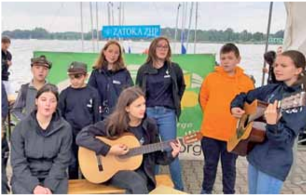
W trakcie konkursu harcerze śpiewali szanty i piosenki turystyczne.

Spotkanie miało też ważny aspekt edukacyjno-patriotyczny, uczestnicy oglądali bowiem mobilną wystawę „Harcerze i harcerki w obronie ojczyzny. Rok 1920”. Na 24 wielkoformatowych planszach został w niej zaprezen-