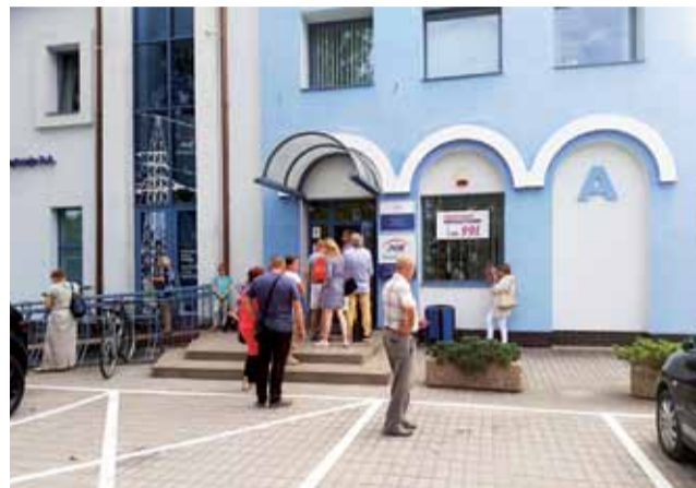
Kolejki przed Biurem Obsługi PGE w Łowiczu nie są nowością, jednak to nie jest wystarczający powód do tego, aby klienci się do nich przyzwyczaili i uznali, że zawsze tak być musi.

Być może części z tych problemów dałoby się uniknąć, gdyby klienci mogli starannie przygotować się do wizyty w placówce. Każdy wolałby zaoszczędzić sobie czasu i nerwów i do tej wizyty dobrze się przygotować, jednak materia jest dla nich zbyt skomplikowana, a wspomniane próby uzyskania informacji telefonicznej o tym jak to zrobić, też mogą skończyć się niepowodzeniem.