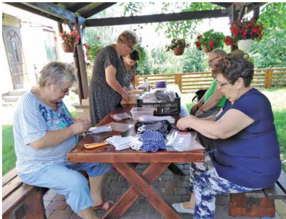
Członkinie stowarzyszenia włożyły mnóstwo serca, by pomóc innym. Aktywne seniorki samodzielnie szyły maseczki ochronne.

Wszyscy uczniowie klasy piątej (11 osób) i 1 osoba z VI zdali egzamin i otrzymają wkrótce Kartę Rowerową, dzięki której będą mogli poruszać się po drogach publicznych. Przypominamy, że za jazdę bez karty rowerowej osobą nieletnią grozi mandat w wysokości nawet 100 zł.