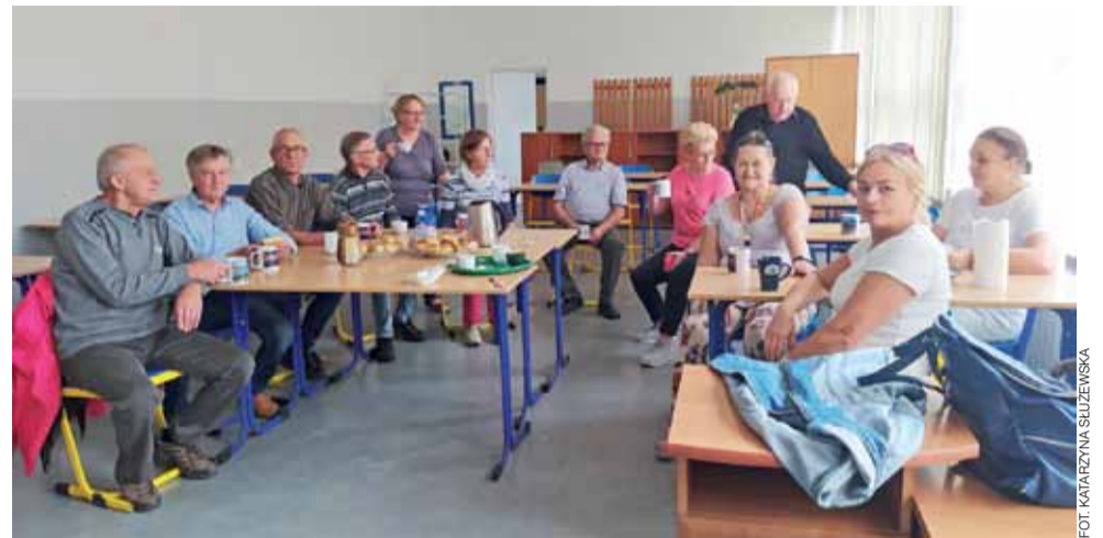
Członkowie Łowickiego Uniwersytetu Trzeciego Wieku, którzy przygotowują nowe pomieszczenia w budynku przy Al. Sienkiewicza przed inauguracją kolejnego roku akademickiego.

Po podpisaniu dokumentów o przekazaniu pomieszczeń na cele działania ŁUWT, członkowie od razu mogli wejść do nich wejść