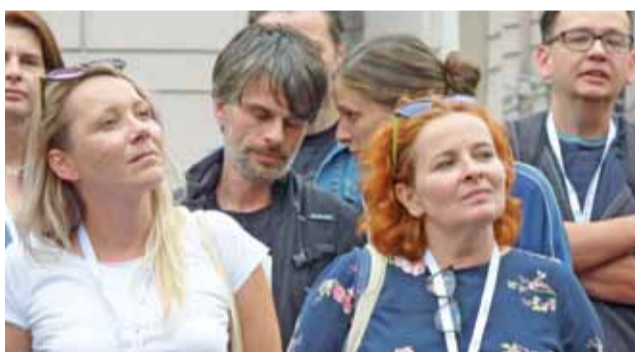
Uczestnicy kinobusu podczas zwiedzania Łowicza.

Łowicz znalazł się na trasie podróżującego po całej Polsce kinobusu. Jest to swego rodzaju objazdowy festiwal kinowy, w którym biorą udział ludzie związani z branżą filmową, dziennikarze i krytycy, a także zapaleni miłośnicy X muzy.