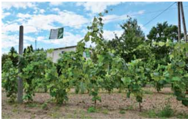
Tak wyglądają teraz krzewy winorośli posadzone w maju.

mem, zaś jedną w gminie Głowno. Jednej osobie, pochodzącej właśnie z terenu tej gminy, udało się w trakcie minionego tygodnia wyzdrowieć. U nas wzrost zakażeń nie jest radykalny, ale może wzbudzać obawy, tym bardziej, że w skali całego powiatu przybywa ich dość szybko. Lawinowo wzrasta również liczba osób objętych kwarantanną: jeszcze przed dwoma tygodniami było ich w powiecie 39, w zeszłym tygodniu 149, a obecnie już 430. Na szczęście, od wielu tygodni nie zmienia się liczba zgonów w naszej okolicy i wciąż wynosi 16. aw