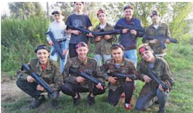
Przed rozgrywką „Laser Tag” w Konstancynie Łódzkiej.

Dzień później (tj. 17 września) przedstawiciele młodzieży Centrum Kształcenia i Wychowania OHP w Dobieszkowie wraz z kadrą pedagogiczną uczestniczyli