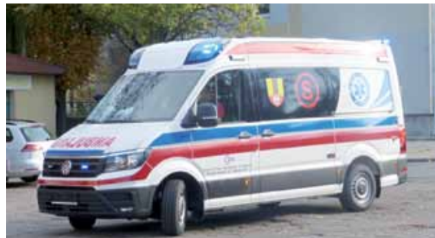
Tak rok temu prezentował się nowy ambulans, oznakowany już jako karetka typu S, ale jeszcze bez tablic rejestracyjnych.

Zmiany, które wejdą w życie za miesiąc, oznaczają, że faktycznie szpital zachowuje niespełna roczną karetkę „P”, ale traci „S”. Czy to dobre dla szpitala?