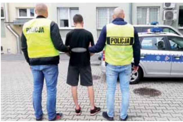
Zatrzymanie 23-latkę. Już wcześniej mężczyzna był notowany za konflikty z prawem.