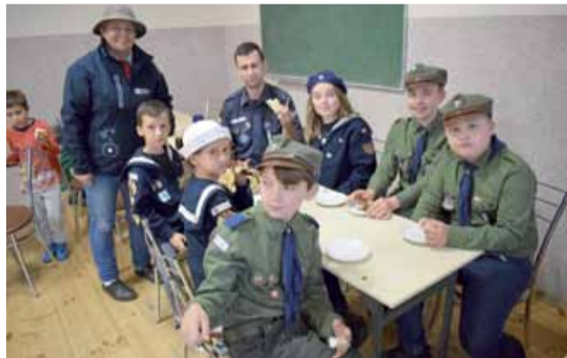
Harcerze hufca ZHP w Głownie podczas poczęstunku w Skaratkach.