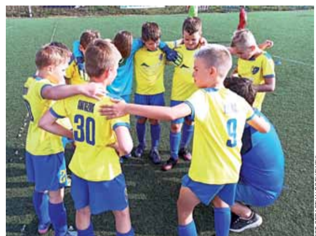
Młodzi Zjednoczeni walczą o sukces w dwóch rozgrywkach.