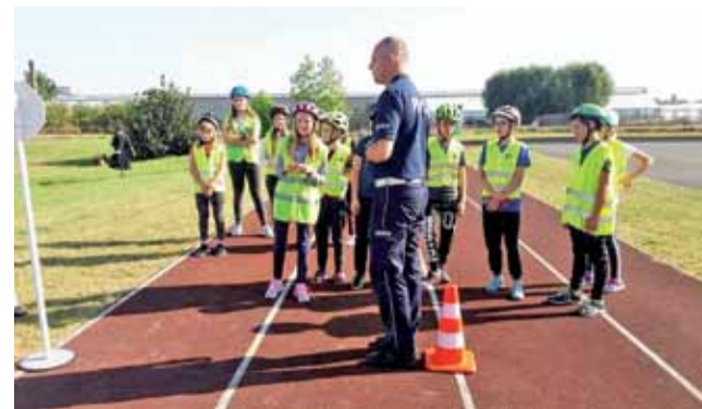
Piątoklasiści na egzaminie praktycznym mieli do pokonania miasteczko ruchu drogowego.