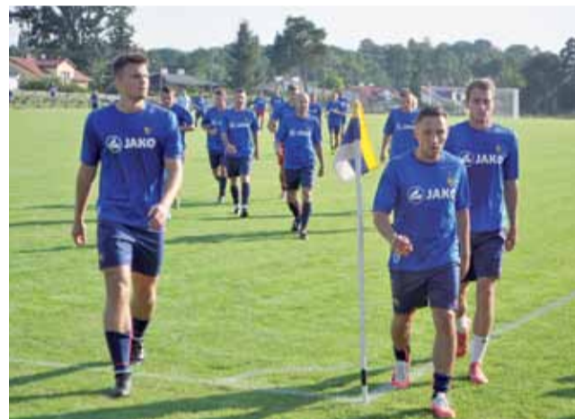
Zjednoczeni Stryków w tegorocznym Pucharze Polski Okręgu Łódzkiego rozegrali tylko jedno spotkanie.

Drużyna z Rąbienia wykorzystała każdy błąd strykowskiej defensywy. Trzy bramki stracone z V-ligowcem dają do myślenia.