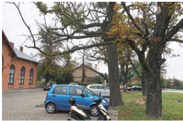
W zatoczce zieleni na dworcu znajduje się 5 kasztanów, których spróchniałe gałęzie uginają się nad samochodami.

Drzewa rosną na działce stanowiącej własność państwa i są w użytkowaniu wiecznym PKP S. A. W związku z czym utrzymanie zieleni znajdującej się na