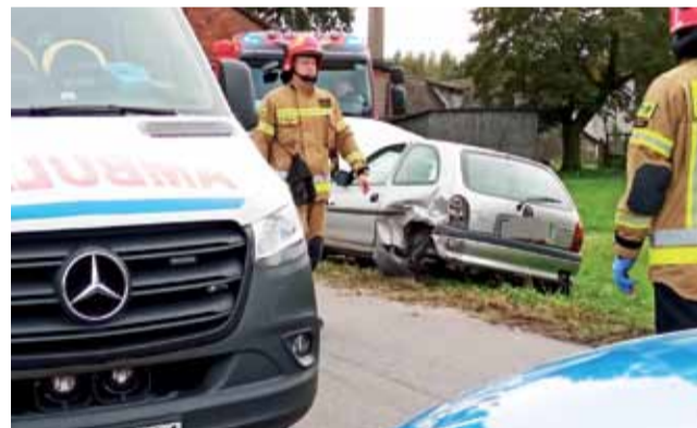
W Oplu stojącym na poboczu na szczęście nikogo nie było.

W Oplu nie było nikogo, w czasie zdarzenia jego właścicielka znajdowała się na terenie pobliskiej posesji. Jak udało się nam dowiedzieć, ratownicy przebadali ją, ponieważ widząc zdarzenie, znalazła się w dużym szoku. Badaniom poddany został też kierowca Volkswagena, nic poważnego jednak mu się nie stało.