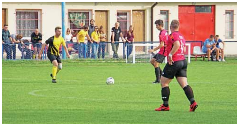
Powstaniec Dobra (żółto-czarne stroje) jest w coraz lepszej formie i wkrótce powinno to być widać w wynikach.

Z kolei w gr. VII B-klasy skier-niewickiej świetny mecz rozegrała Iskra Głowno, która wysoko pokonała Olimpię Oporów 7:1. Głównianie mają w tabeli 15 pkt. i zajmują 4. miejsce ze stratą jedynie 1 pkt. do wicelidera i 3 pkt. do prowadzącej Sierakowianki Sierakowice. Zapowiada się bar-