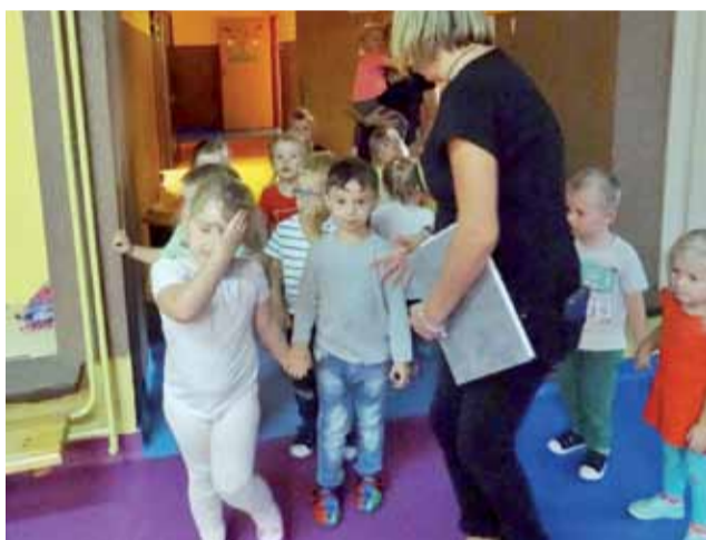
Próbną ewakuację w przedszkolu w Domaniewicach odbywają się co najmniej raz w roku.

W trakcie ćwiczeń nauczycielki zapoznały dzieci ze znakami ewakuacyjnymi i ich rozmieszczeniem w przedszkolu. Dzieci dowiedziały się jak powinny się zachować w takiej sytuacji. Nauczyły się reagować na sygnały i dźwięki. Próba przebiegła sprawnie i bezproblemowo, z zachowaniem ostrożności. Pozorowana ewakuacja jest przeprowadzana w przedszkolu w Domaniewicach co roku. mak