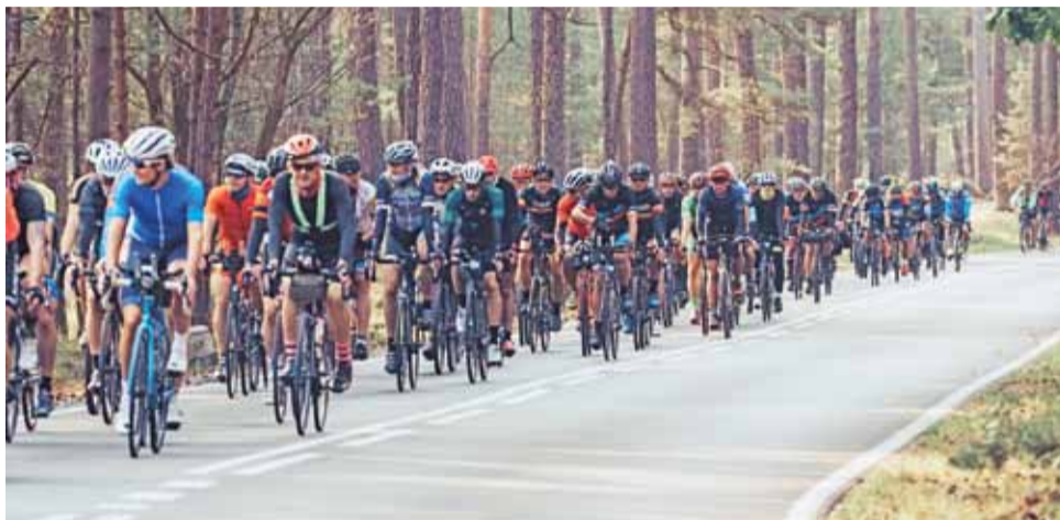
Peleton zawodników biorących udział w MPP2020.

Maraton Północ-Południe jest przykładem rowerowego rajdu turystycznego, a tym samym nie jest uważany za zawody sportowe. Jego organizatorem jest Stowarzyszenie Koło Ultra, którego siedziba mieści się w Warszawie. Podczas każdej edycji limit czasowy, w którym uczestnicy mu-