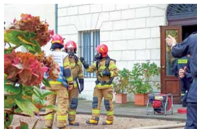
W czasie ćwiczeń strażacy wykonywali te same czynności, co na prawdziwych akcjach.

Okolo godziny 10 strażacy z PSP Łowicz, OSP Nieborów i OSP Bednary udali się na teren pałacu. Najpierw wynieśli z budynku kobietę, która udawała wymagającą przeprowadzenia resuscytacji krążeniowo-oddechowej. Potem, korzystając z podnośnika, pomogli wydostać się z pokoju na drugim piętrze kobiecie, która została tam „uwięziona”. Na koniec wynieśli z pałacu repliki cennych przedmiotów – obrazu i fotelu. Celem ćwiczeń było doskonalenie umiejętności strażaków, które by-