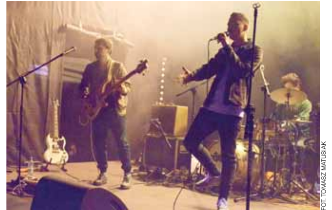
Bisz i Radex z utęsknieniem czekali na powrót do koncertów, a ten w Łowiczu był jednym z pierwszych, jakie udało im się zagrać po lockdownie.