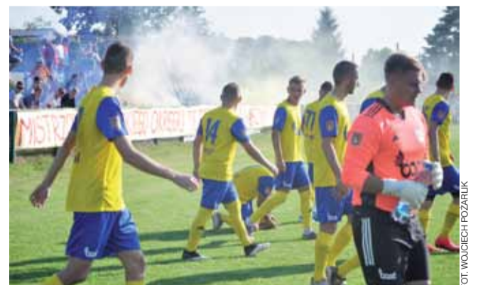
Stal Głowno notuje bardzo dobre wyniki jako beniaminek IV Ligi.

Wieści z Głowna i Strykowa członek Stowarzyszenia Gazet Lokalnych Edycja wspólna z tygodnikiem „Nowy Łowiczanie”