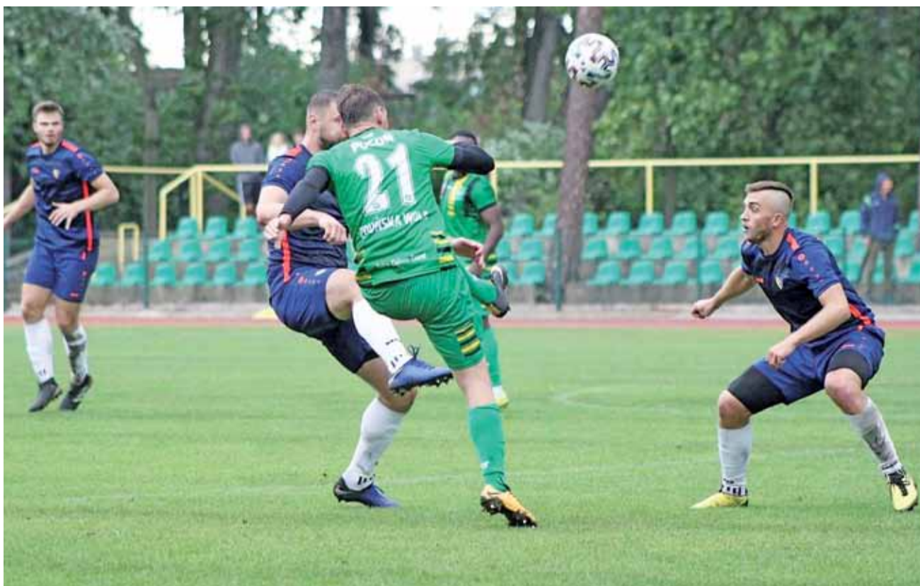
Zjednoczeni Stryków (granatowe stroje) w meczu z Pogonią Zduńska Wola pokazali wielki charakter. Odrobić trzy bramki to rzadka sztuka.