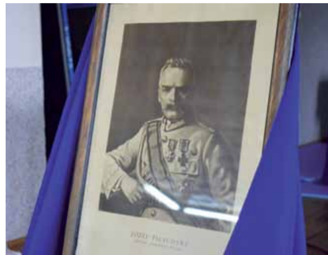
Historia tego portretu jest w pewnym sensie paralełą ostatnich stu lat dziejów Polski.