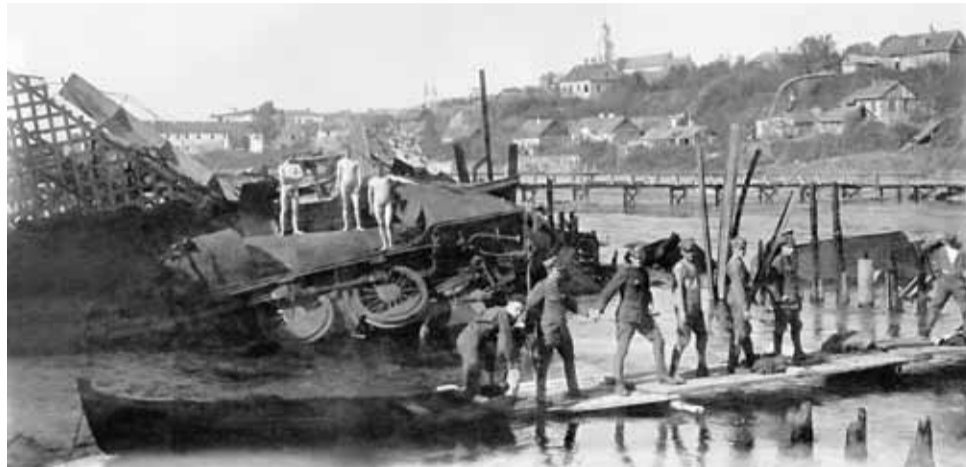
Grodno, 1920. Zniszczony most nad Niemnem, w tle drewniany most zbudowany przez polskich saperów.

Na [...] posiedzeniu konferencji pokojowej przewodniczący delegacji sowieckiej, [Adolf] Joffe, odczytał sowiecką deklarację pokojową, zupełnie inną niż warunki przedstawione delegacji