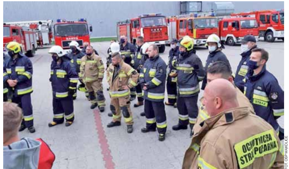
W Corningu tyłu jednostek straży jeszcze nie było. Ćwiczenia zostały omówione po ich zakończeniu.

Na przykład jednostka Ochotniczej Straży Pożarnej z Mąkolice w gminie Głowno zabezpieczała wraz ze strażakami zawodowymi JRG Stryków transport uszkodzonego z dachu z użyciem