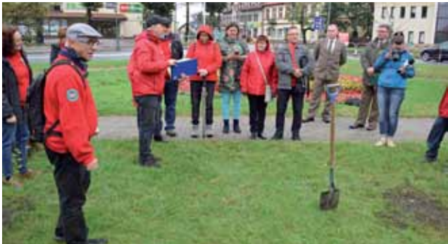
Sadzenie Drzew Dziedzictwa na Placu Koński Targ.