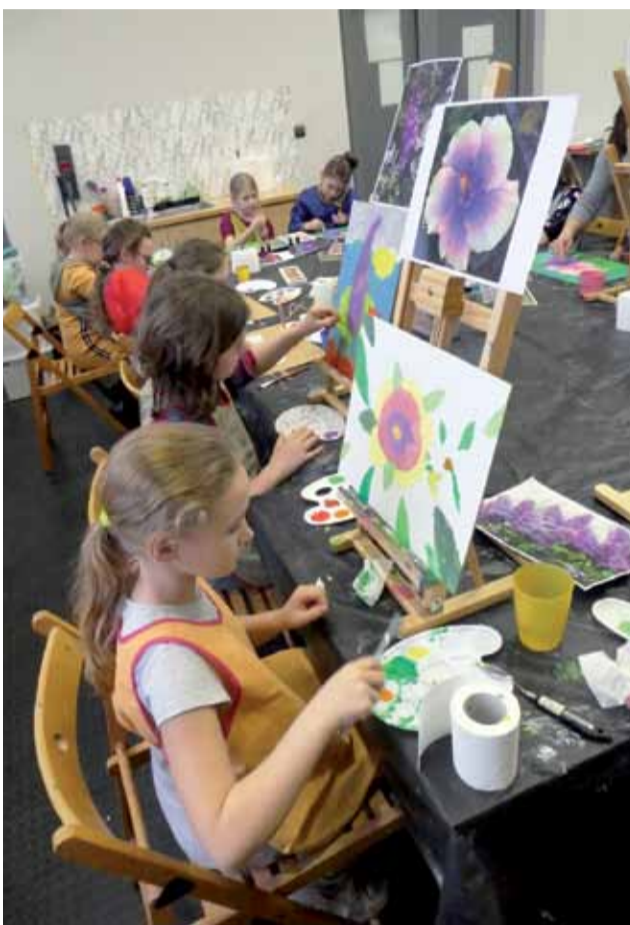
Dzieci przygotowujące prace na konkurs podczas wtorkowych zajęć plastycznych w świetlicy PKP Stryków.

Wyróżnione oraz nagrodzone prace są dostępne w katalogu na