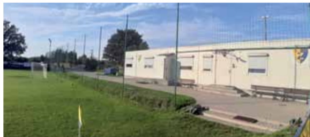
Budynek sanitarny pełniący rolę szatni na boisku przy ulicy Brzezińskiej w Strykowie.

Dofinansowanie przeznaczone jest na rozwój infrastruktury sportowej i rekreacyjnej. Już w maju tego roku Sejmik przyznał samorządowi z regionu aż 3 miliony złotych. Pomoc finansowa ma być przeznaczona przede wszystkim na remonty